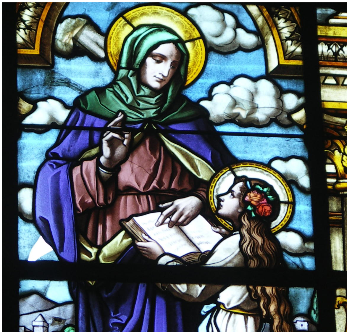
Obr. 5. Novosedlice, kostel sv. Valentina, vitraj se sv. Annou.

Vzhledem k tomu, že práce obdobného charakteru, jakési regionální korpusy, dosud nebyly zpracovány, stále uniká jedna ze zásadních možností využití výše uvedených informací. Alespoň nejzákladnější porovnání zjištěných vitrají na Teplicku je v rámci této kapitoly provedeno se souborem sakrálních vitrají Lounska, 23 jejich pracovní soupis a základní dokumentace byla autorem provedena v letech 2005–2006. 24