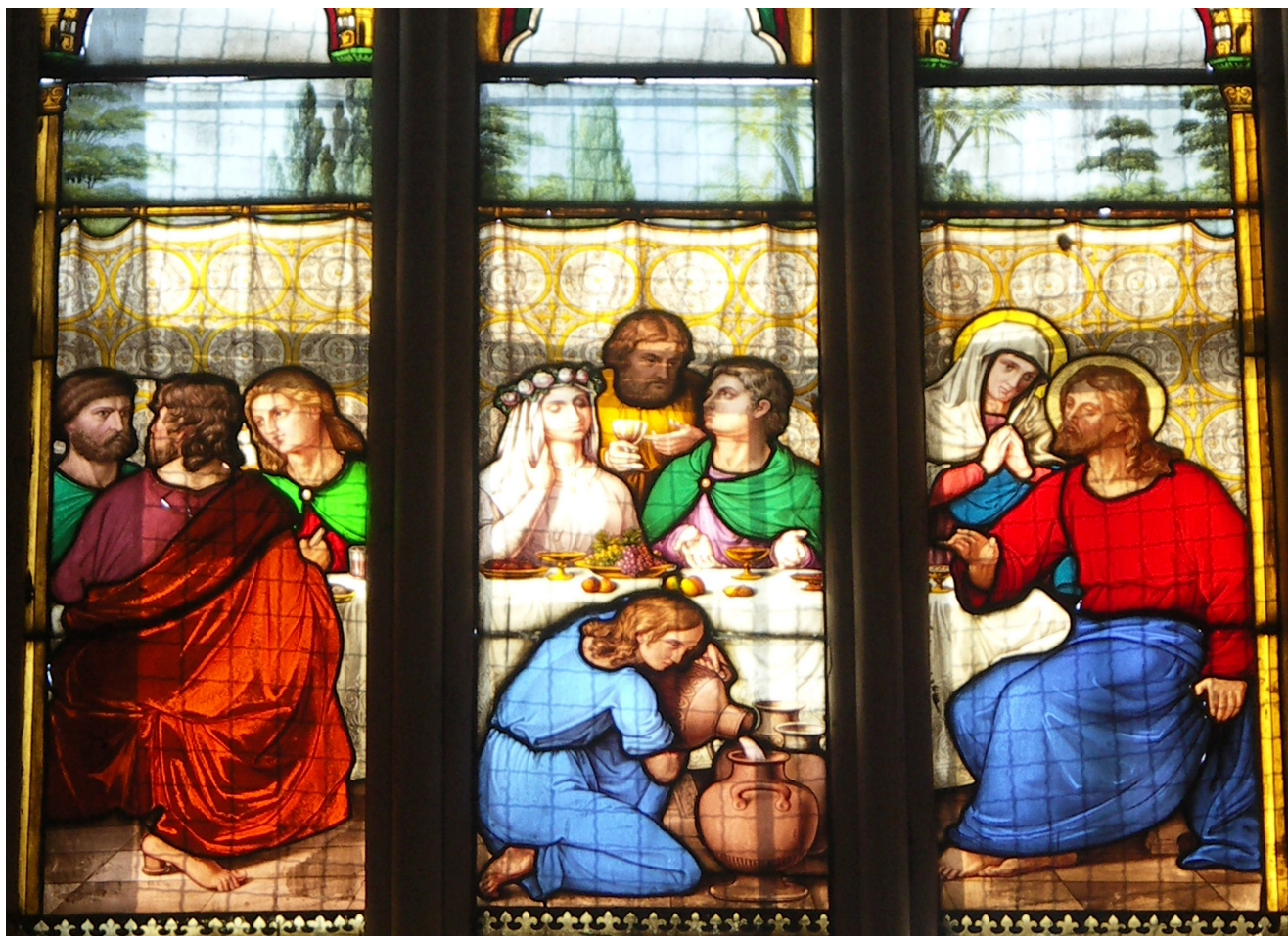
Obr. 2. Teplice, kaple Povýšení sv. Kříže, vitraj „Svatba v Káni Galilejské“, detail hlavního výjevu, stav před restaurováním.

umístěné proti sobě v chrámové lodi hrobského kostela představují častý prvek výzdoby evangelických chrámů. 14