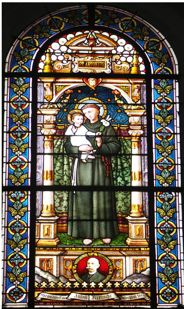
Obr. 3. Modlany, kostel sv. Apolináře, vitraj se sv. Antonínem Paduánským, ve spodní části s vyobrazením donátora A. Kreische.