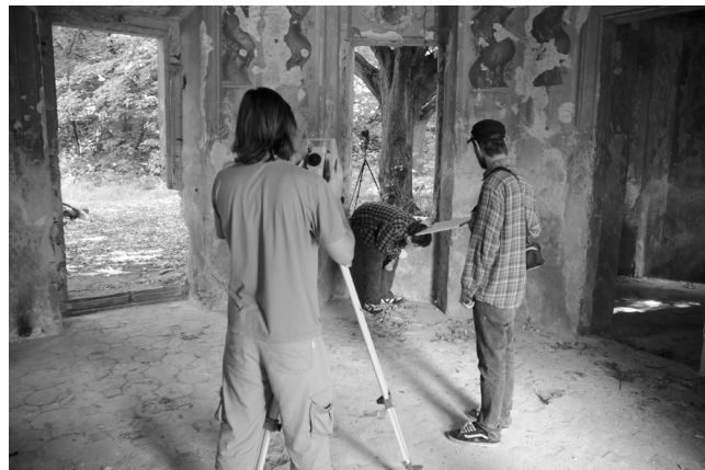
Obr. 3. Studenti 1. ročníku oboru Dokumentace památek při práci s totální stanicí Leica v barokním gloriety v Milešově.

Pro zpracování digitálních audiovizuálních záznamů má pracoviště k dispozici počítačovou pracovní stanici pro zpracování obrazových dat (pracovní stanice s digitální stříhovou kartou Canopus, tři monitory, audio mixační pult, DVD vypalovací mechanika, sw Adobe Premiere pro 1.5, Adobe Photoshop CS, Ulead DVD workshop SE – dvd, authoring sw). Digitální záznam obrazu je možné pořizovat díky poloprofesionální DV kameře Canon XM2.