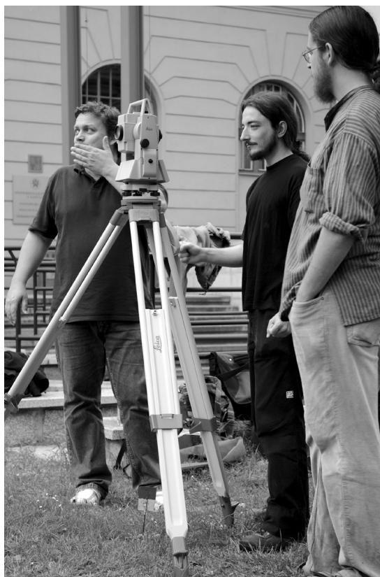
Obr. 5. Pracovníci Centra pro dokumentaci... a Národního památkového ústavu při práci s totální stanicí Leica.