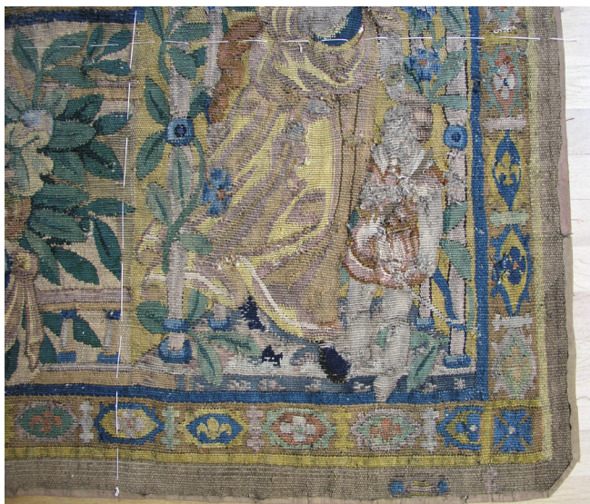
Obr. 2. Právý spodní roh tapiserie se znakem Audenarde v lemu, stav před restaurováním.