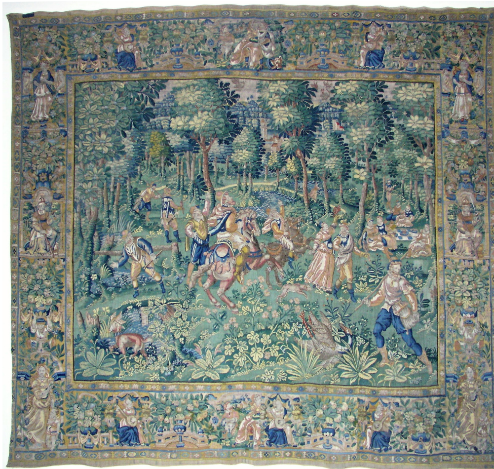
Obr. 1. Libochovice, zámek, tapiserie Šlechtická slavnost před restaurováním.

Tapiserie „Šlechtická slavnost“ pochází ze zámku Heřmanův Městec, 1 odkud byla v rámci konfiskací po roce 1945 převezena do Státního zámku Sychrov. V rámci příprav nové zámecké instalace byla v 60. letech 20. století převezena na Státní zámek Libochovice, kde se nachází i v současné době. 2 Tapiserie „Šlechtická slavnost“, pro niž bylo v minulosti užíváno i názvů „Lovecká verdura“ 3 či „Společnost v oboře“, 4 je tkána tradiční technikou rypsové vazby, má rozměry 345 x 400 x 7 cm, osnova je tkána vlnou, útek vlnou i hedvábím, dostava 5 této tapiserie je 4–5