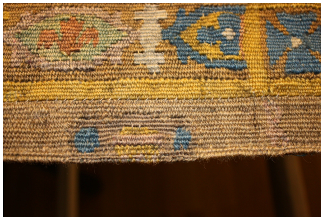
Obr. 8. Znak Audenarde, stav po restaurování.

Vzhledem k možnému poškození originálních vláken nebylo k rozpuštění lepidel použito ani chemických rozpouštědel. Restaurátorky proto k odstranění lepidla využily regulovaného tepla v kombinaci s citlivým naměkčováním lepidla etanolem a mechanickým dočištěním. Po vyčištění a vyrovnání tapiserie byl připraven celoplošný nosný skelet (sepraná lněná tkanina). Veškerá poškozená místa byla řešena zcela reverzibilní metodou šité integrační retuše. Nefunkční a nevhodné vysprávkky byly odstraněny, poškozené osnovy a chybějící útky byly doplněny a fixovány, rozvolněné rozparky byly zpevněny. V místech po lepených plombách (jen výjimečně byly ponechány) byly chybějící osnovy nahrazeny a doplněny šitými útky. Odstřížené lemy byly po odstranění nalepené pásky doplněny osnovami a dotkány do dochované šířky. V rubu byla tapiserie podložena novou podšívkou, jejíž horní třetina byla prošitím svislých švů spojena s tapiserií. 24