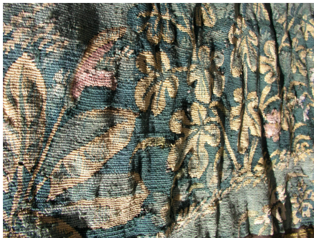
Obr. 4. Zdeformovaná tapiserie, stav před restaurováním.

v tlamě úlovek. V pravé dolní části leží zastřelený velký pták z řádu brodivých, do kterého klove lovecký dravý pták. Zprava se k dvojici ptáků blíží lovec s kopím. Ve středu kompozice celého výjevu se nachází trojice lovců, sledujících lovené ptactvo na obloze. Dva z lovců sedí na vzpínajících se koních, třetí je pěší, stojí za jezdcí a rukou ukazuje vzhůru na ptáky. Pod nohama koňů pobíhá lovecký pes. Vlevo od ústřední trojice se pohybují další tři lovci, všichni pěší, jeden z nich nese kuši a s napřaženou rukou směřuje k psovi u jezírka. Vpravo od ústřední trojice lovců se prochází šlechtický pár, který je ovšem rovněž zapojen do lovu – žena i muž mají navlečeny sokolnické rukavice, žena má svého sokola usazeného na vztyčené paži, muž na paži před sebou. Výš směrem k horizontu je zobrazena smíšená šlechtická společnost u prostřeného stolu. Téměř pod horizontem se pak pohybují dvě postavy, přičemž jedna z nich hraje na loutnu. Těsně pod horizontem je vytkán stylizovaný zalesněný kopcovitý terén, v němž jsou rozmístěny stavby domů s červenými střechami. Na obloze