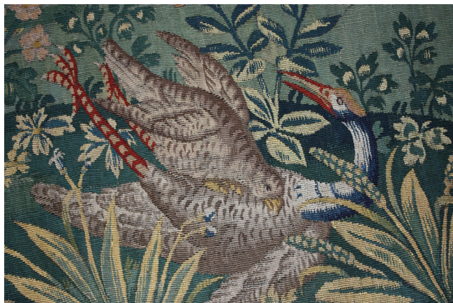
Obr. 7. Dva ptáci ve spodní části tapiserie, stav po restaurování.

zení, často se tak stává, že originální lem tapiserie zcela chybí. I u libochovické tapiserie došlo k poškození lemu a v současné době je ze znaku Audenarde zachován jen jeho horní segment zachycující část štítu a brýle.