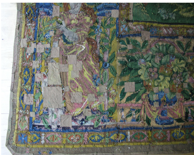
Obr. 3. Rub s lepenými plombami, pravý spodní roh tapiserie se znakem Audenarde, stav před restaurováním.

v tlamě úlovek. V pravé dolní části leží zastřelený velký pták z řádu brodivých, do kterého klove lovecký dravý pták. Zprava se k dvojici ptáků blíží lovec s kopím. Ve středu kompozice celého výjevu se nachází trojice lovců, sledujících lovené ptactvo na obloze. Dva z lovců sedí na vzpínajících se koních, třetí je pěší, stojí za jezdcí a rukou ukazuje vzhůru na ptáky. Pod nohama koňů pobíhá lovecký pes. Vlevo od ústřední trojice se pohybují další tři lovci, všichni pěší, jeden z nich nese kuši a s napřaženou rukou směřuje k psovi u jezírka. Vpravo od ústřední trojice lovců se prochází šlechtický pár, který je ovšem rovněž zapojen do lovu – žena i muž mají navlečeny sokolnické rukavice, žena má svého sokola usazeného na vztyčené paži, muž na paži před sebou. Výš směrem k horizontu je zobrazena smíšená šlechtická společnost u prostřeného stolu. Téměř pod horizontem se pak pohybují dvě postavy, přičemž jedna z nich hraje na loutnu. Těsně pod horizontem je vytkán stylizovaný zalesněný kopcovitý terén, v němž jsou rozmístěny stavby domů s červenými střechami. Na obloze