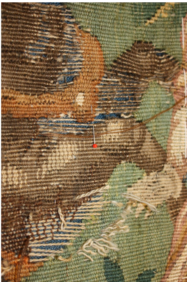
Obr. 5. Vzpínající se kůň, stav v průběhu restaurování.