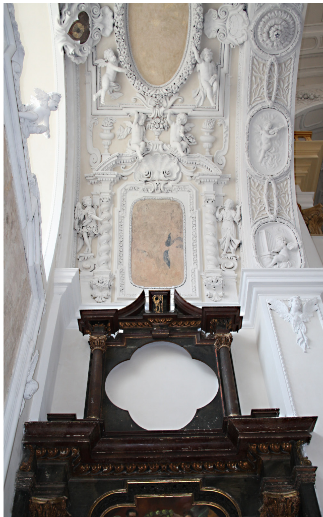
Obr. 4-5. Chomutov, kostel sv. Ignáce. Příklad raně barokního Gesamtkunstwerku, kdy dřevěná retábllová architektura „pokračuje“ ve štukovém provedení směrem k výzdobě vrcholu klenby a obdobným způsobem do sebe zahrnuje na protilehlé straně zapuštěnou zpodělnici. V tomto případě by oltářní architektura i zpodělnice měly podléhat památkové ochraně společně s nemovitostí, i když nejsou samostatně prohlášeny za kulturní památku.

Výše uvedený metodický pokyn Arcibiskupství pražského řadí oltáře a mensy zděné, kamenné a štukové mezi věci nemovité, dřevěné, přenosné a dekorativní prvky mezi movité, tedy plně v intencích § 120 občanského zákoníku. Z dříve již řečeného vyplývá, že je nutné vztah hlavního oltáře k nemovitosti hodnotit pokaždé individuálně, ale kritéria hmotného spojení s architekturou doplnit také o „nehmotně - ideové“ vč. architektonických, historických (podloženost archivními prameny) a liturgických vazeb. Na základě těchto kritérií by skutečně bylo možno ve většině případů – bez ohledu na to, zda je oltář prohlášen za památku (ať již movitou či součástí nemovitosti) prokázat u velké části hlavních oltářů s dřevěným retabulem s pevnou menzou (výjimečně i bez pevné menzy) pevnou vazbu k památkově chráněné nemovitosti (zohlednit nutno i umělecko-historické kritérium). Současně je možno zdůvodnit, že odstraněním prostorové oltářní kompozice dojde k jejímu znehodnocení např. zánikem vazby na další prvky