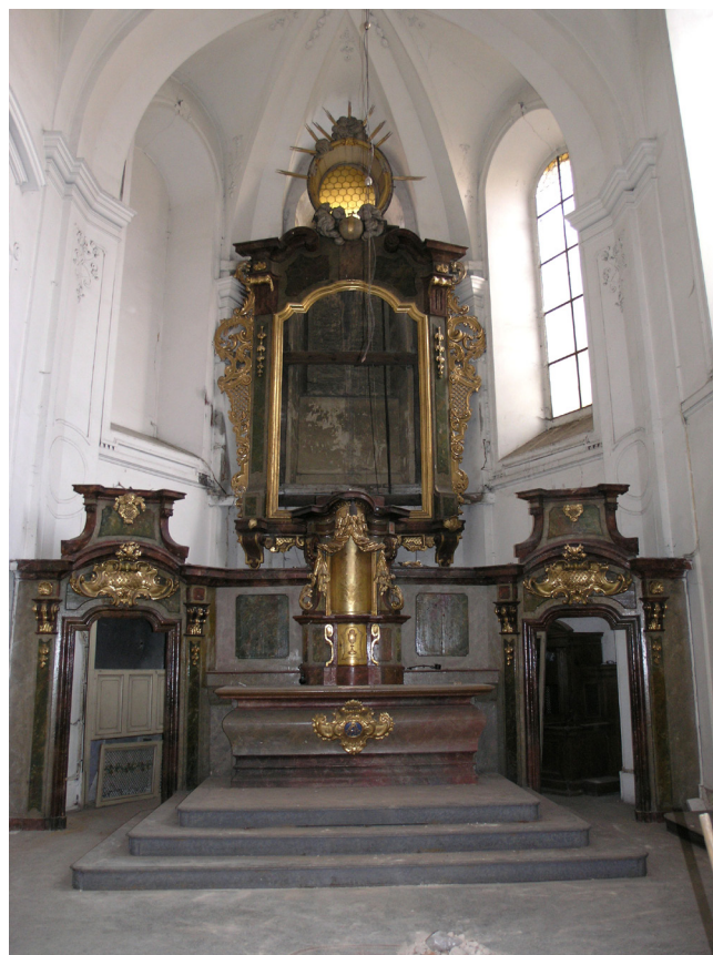
Obr. 3. Mladá Boleslav, kostel sv. Bonaventury. Vazba k nemovitosti je dobře patrná i po částečném odstrojení výzdoby hlavního oltáře. Vedle oltářních branek ukotvených pod určitým půdorysným úhlem do bočních zdí je to i konstrukce orámování oválného otvoru pro vstup světla nad architektonizovaným masivním rámem obrazu titulárního světce. Je zřejmé že instalace takového oltářního celku, dimenzovaného na konkrétní parametry prostoru, bude v presbytáři jiného kostela problematická.

rické vazby a souvislosti a po řádném odůvodnění (charakteristický rys všech vyjádření Spolkového památkového úřadu skutečně umožňuje u sakrálního objektu se stavbou, ale i s jejím specifickým posláním (např. liturgickým) učinit součástí nemovité kulturní památky i určité součásti vnitřního vybavení, resp. příslušenství. Přemístění (vyjma vývozu za hranice) však spolkový památkový zákon neřeší.