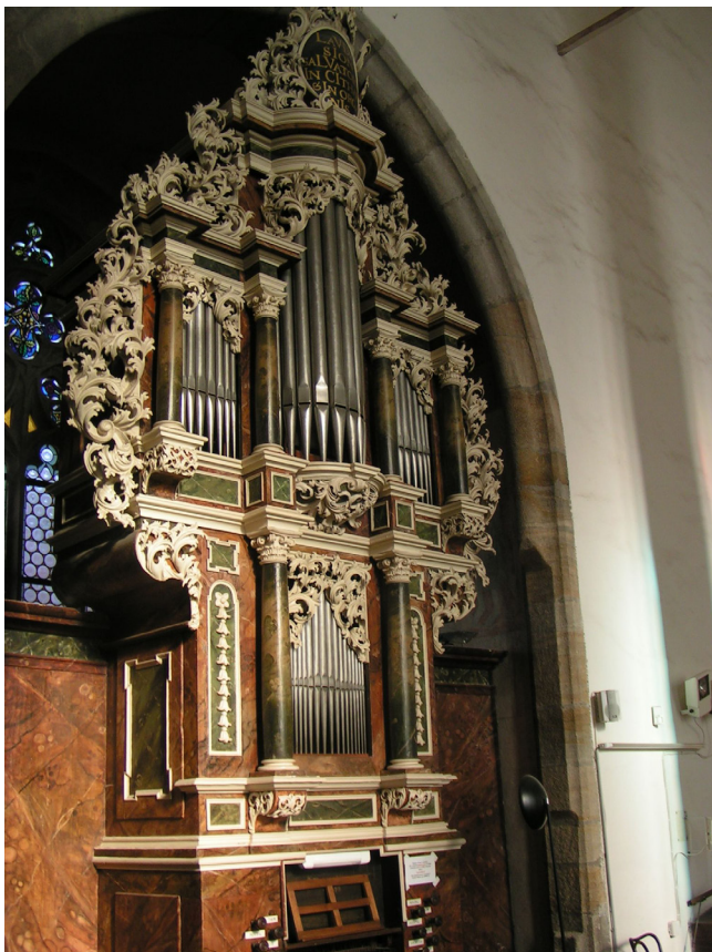
Obr. 7. Český Krumlov, kostel sv. Víta. Chórové varhany z roku 1716 byly na boční kůr tohoto kostela přeneseny ze zrušeného podstatně menšího jezuitského kostela sv. Jošta roku 1789 a jejich architektonicko výtvarné i hudebně akustické kvality vyznívají v tomto prostředí tak dokonale, jako by zde byly odjakživa.

utilitární pořizování průměrných nástrojů továrního charakteru, u nichž se ani nepočítalo s dobou životnosti přesahující století a jimž lze památkovou hodnotu, natož vztah k nemovitosti přiřadit těžko. Dalším přelomem byla doba po druhé světové válce. Vedle ničení či nevhodných přestaveb nástrojů na nízké řemeslné úrovni dochází v důsledku změn osídlení k rozsáhlým transferům řady varhan z bývalých sudetských oblastí – buď zcela účelově v rámci diecézí, nebo mimo české země – desítky nástrojů tak skončily např. na Moravě či Slovensku, někdy v prostorech akusticky nepřiměřených. 20 Tento problém je však v severozápadních Čechách aktuální dodnes, neboť počet nevyužívaných kostelů razantně stoupá a nad jejich dalším osudem se vznáší otázky. Komplikovat byrokratickým procesem odsouhlasování přesunu nástroje chátrajícího v původním prostoru desítky let beznadějně nevyužívaného kostela a při neustávající vlně vykrádání pouze z titulu součásti památkově chráněné nemovitosti napomůže nástroj spíše k postupující degradaci a konečné likvidaci. Desítky nástrojů z této oblasti by již neexistovaly, kdyby nedošlo k improvizovanému transferu do jiného přijatelnějšího prostoru či depozitu, některé v důsledku nepružného řešení možného transferu byly na míře své autenticity nevratně poškozeny např.