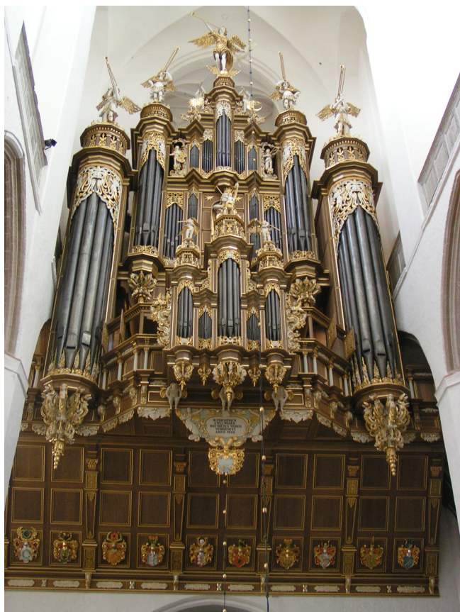
Obr. 6. Stralsund, Marienkirche. Monumentální varhany Fridricha Stellwagena z roku 1659 vznikly současně se západní kruchtou, s níž je poji výzdoba i vyvedení nejen pozitivu, ale i stroje pedálu do tzv. pedálových věží, typických pro dobové severoněmecké varhanářství, do poprsnice krucht. Byť jde o řešení odlišné od naší varhanářské praxe poznamenané jihoněmeckým varhanářským okruhem, bylo by možné z našeho pohledu v tomto případě označit varhany za pevnou součást nemovitosti.

linie prospektů pod různými úhly). V období od baroka až po pokročilé 19. století je v našich podmínkách častým řešením dvoumanuálového nástroje vsazení samostatné skříňe pozitivu, případně skříňe i stroje celých varhan do poprsnice kůru. Toto řešení svádí k představě, že takovéto varhany jsou zdánlivě „automaticky“ součástí poprsnice, která je součástí nemovitosti, ale skutečnost tak jednoznačná není. Podstatou jde o hudební nástroj propojený s rovinou architektonicko-výtvarného a technického řešení (jakýsi Gesamtkunstwerk sám o sobě, i s přesahy k prostoru a vybavení), u něhož po dlouhé vývojové období prostorové rozmístění jednotlivých strojů bylo principem zamýšleného kontrastu zvukového vyzařování (zvuková hodnota varhan jako hudebního nástroje je prioritní), pozitiv či skříň nástroje však mohly být zasazeny do dodatečně vytvořeného výřezu, jindy zase skříňe obsahují zcela novodobý stroj bez památkové hodnoty, kdy pozitiv již není funkční částí stroje, nebo jde o něhou atrapu. Ve 20. století se můžeme setkat se zasazením nehodnotného prospektu dehonestujícího charakteru do poprsnice krucht – ale zde přece uplatňovat památkovou ochranu nechceme... Posuzování „na první pohled“ tedy může být zavádějící. Intenzivnější vazba k interiéru sakrální stavby existuje především tam, kde šlo o záměr související se stylově shodným vybavením kostela a skříň varhan