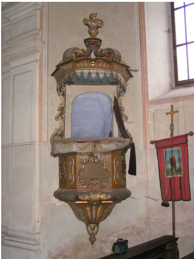
Obr. 5. Pnětluky, kostel sv. Bartoloměje. Rokoková kazatelna je vyústěním přístupového schodiště vedoucího zdímem z přilehlé sakristie. Jde o původní řešení z doby stavby kostela. V takovémto případě by kazatelna měla podléhat památkové ochraně společně s nemovitostí, i když by nebyla samostatně chráněna.