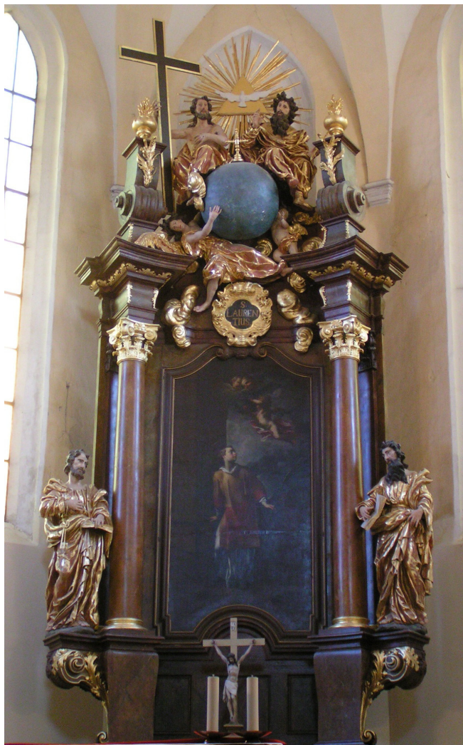
Obř. 1. Bílina, kostel sv. Petra a Pavla. Tento barokní hlavní oltář pochází původem z jiného nevyužívaného kostela a jeho přemístění před téměř dvěma desítkami let bylo vynuceno záchranou před zničením. Přestože architektura jeho retáblu i do stávajícího interiéru zdánlivě přiměřeně zapadá, v původním umístění pevně zapadala do architektonických dimenzí a členění závěru pozoruhodně centralizující vertikálně dimenzované sakrální architektury a přispívala k iluzi monumentality jejího interiéru. Restituce na původní místo je za současných poměrů velmi nepravděpodobná, ale stále v budoucnu možná. Proto by tato oltářní architektura neměla být evidována jako pevná součást bílinského kostela sv. Petra a Pavla, ale měla by zůstat movitou památkou s podchycením vazby k původní sakrální stavbě.

ve vlastním aktu prohlášení, nýbrž až na úrovni vedení ÚSKP. Ve sporných případech uplatnění tohoto kritéria tedy nezbyvá, než se opřít o § 119 Občanského zákoníku, který však logicky na specifika památkové problematiky nastaven není. 4