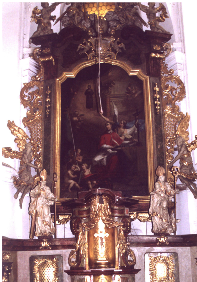
Obr. 2. Mladá Boleslav, kostel sv. Bonaventury Dnes již neexistující původní situace umístění působivého rokokového rámového hlavního oltáře bývalého konventního kostela sv. Bonaventury s předsazenou menzou a tabernáklovou stěnou před demontáží.

tu či nemovitou památku je důležitá také z hlediska kritérií získání státní či krajské dotace na restaurování památky. Například oltáře či varhany, které v duchu trendů po roce 2000 byly prohlášeny s přidělením čísla nemovité kulturní památky, nemohly získat dotaci z Programu restaurování movitých kulturních památek MK (na rozdíl od srovnatelných varhan a oltářů prohlášených dříve a vedených v seznamu movitých kulturních památek) ale po postupném vytěšňování z programu Záchraně architektonického dědictví se v průběhu dalších let mohly ucházet o dotaci z Programu MK prostřednictvím obcí s přenesenou působností.