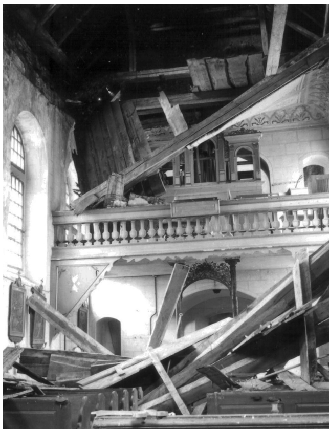
Obr. 11. Kalek, kostel sv. Václava, pohled na západních kruchtů a na havarijný stav interiéru, 1973.