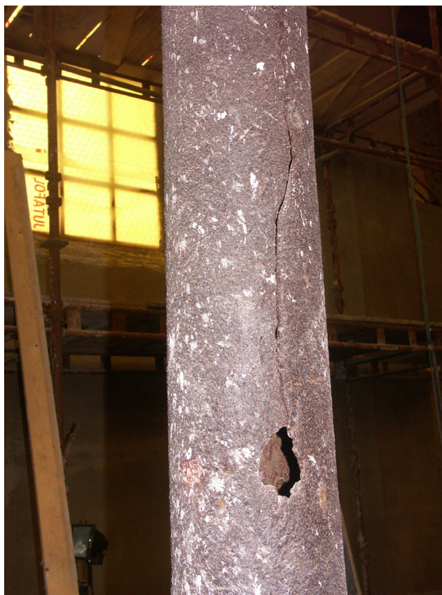
Obr. 6. Kalek, kostel sv. Václava, detail destrukce litinového sloupu v lodi kostela, červenec 2010.

Nad rámec zpracované projektové dokumentace bylo nutno dořešit odvodnění kostela uložením drenážního potrubí v odvodňovacím kanálku podél obvodového zdiva. V exteriéru byly instalovány i rozvody vnějšího osvětlení a osazena zapuštěná svítidla do úrovně terénu, který byl upraven jen v bezprostřední blízkosti kostela.