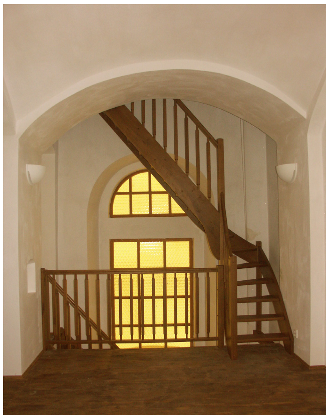
Obr. 10. Kalek, kostel sv. Václava, interiér, nové schodiště na půdu, leden 2011.