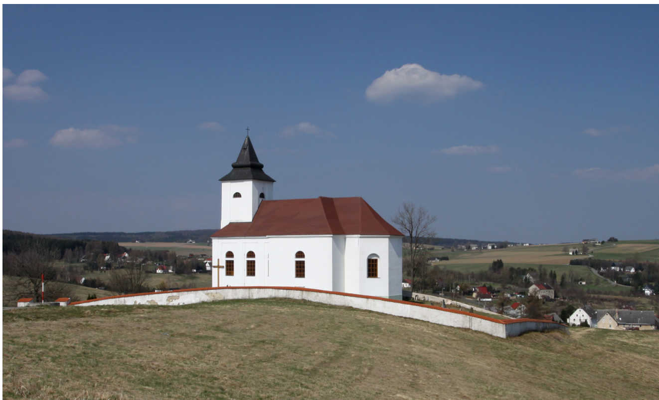
Obr. 2. Kálek, kostel sv. Václava, celkový pohled od jihovýchodu, duben 2011.

panství Červený Hrádek hrabě Ferdinand Maxmilián Hrzán z Harasova. Novostavba kostela byla vysvěcena 27. července roku 1702 a o půl století později se Kálek dočkal i farní budovy. 6 Po zasvěcení kostela svatému Václavu k němu byl přeložen z centra obce i hřbitov.