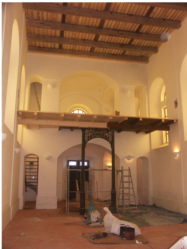
Obr. 5. Kalek, kostel sv. Václava, stav lodi kostela v průběhu obnovy, listopad 2010.

stropu jak z finančních důvodů, tak z důvodu časové náročnosti prováděných a navazujících prací i nevhodných a náročných klimatických podmínek (vysoká vlhkost a nízké teploty v objektu). Dobové fotografie interiéru kostela byly dohledány představiteli obce a předloženy zástupcům památkové péče v průběhu již započaté rekonstrukce, kdy byla zpracována PD včetně rozpočtu a uzavřena smlouva se zhotovitelem stavby po výběrovém řízení. Dle těchto doložených fotografií interiéru byly v průběhu obnovy kostela navrhovány a řešeny různé detaily, drobné změny a odchylky od PD s dodavatelskými firmami a schvalovány zástupci státní památkové péče – např. dřevěné prvky a profílance zábradlí, kuželky balustrád krucht (obr. 11), včetně nových dřevěných vřetenových schodišť, dvouramenných dřevěných schodišť na kůr i do půdního prostoru (obr. 7, 10, 12). Byly vyrobeny a osazeny nové kazetové hlavní vstupní i boční dveře. Vřetenová schodiště byla doplněna o nová zábradlí z černého kovu (obr. 9) a byly nově navrženy a instalovány bezpečnostní zámečnické výplně mezi okenní otvory v patrech všech krucht. Historická nosná konstrukce dřevěné krucht – zkřížené a trhlinami již značně destruktované litinové sloupy (obr. 6) byly repasovány, ošetřeny nátěrem a úspěšně osazeny na původní místo v interiéru (obr. 5, 7, 8).