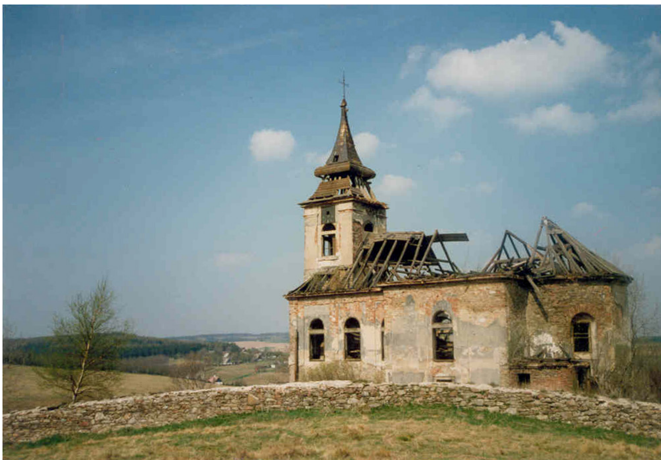
Obr. 1. Kalk, kostel sv. Václava, celkový pohled od jihovýchodu, srpen 1997.

Horská obec Kalk, ležící u česko-německých hranic, severozápadně nad městem Chomutov, nemá typickou náves, její nepravidelný půdorys náleží k rozptýlenému „řádkovému“ osídlení. Dominantami obce jsou kostel svatého Václava, viditelný i ze saské strany, a bývalý lovecký zámek. 1 Volně stojící kostel, situovaný severovýchodně od pozdně barokní fary a obklopený hřbitovem s ohradní zdí, je posazený na konci táhlého hřbetu sbíhajícího k centrální části obce. Hlavní veřejné budovy, kostel s farou a budovou školy, i obytná zástavba se koncentrují převážně jihovýchodně od jádra vsi, podél cesty spojující Kalk s vnitrozemím. Po jihozápadní straně se rozkládá údolí s Bílým potokem a pravobřežním přítokem Načetínského potoka.