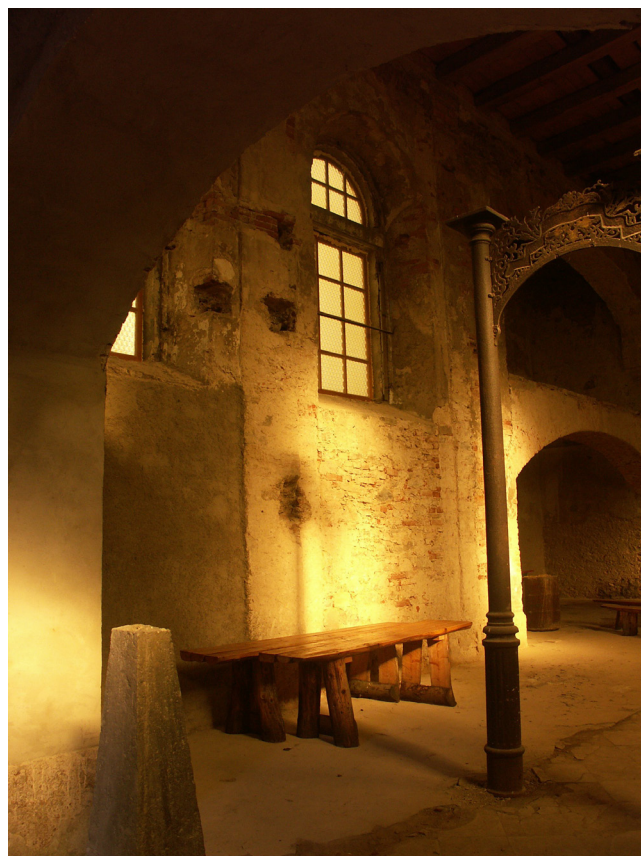
Obr. 4. Kalek, kostel sv. Václava, stav lodi kostela před obnovou interiéru, v popředí pylon původně osazený na hřbitovní zdi u vstupní brány, červenec 2007.

Současná obnova kostela svatého Václava byla realizována dle projektové dokumentace (dále jen PD) „Rekonstrukce kostela Kalek“. 13