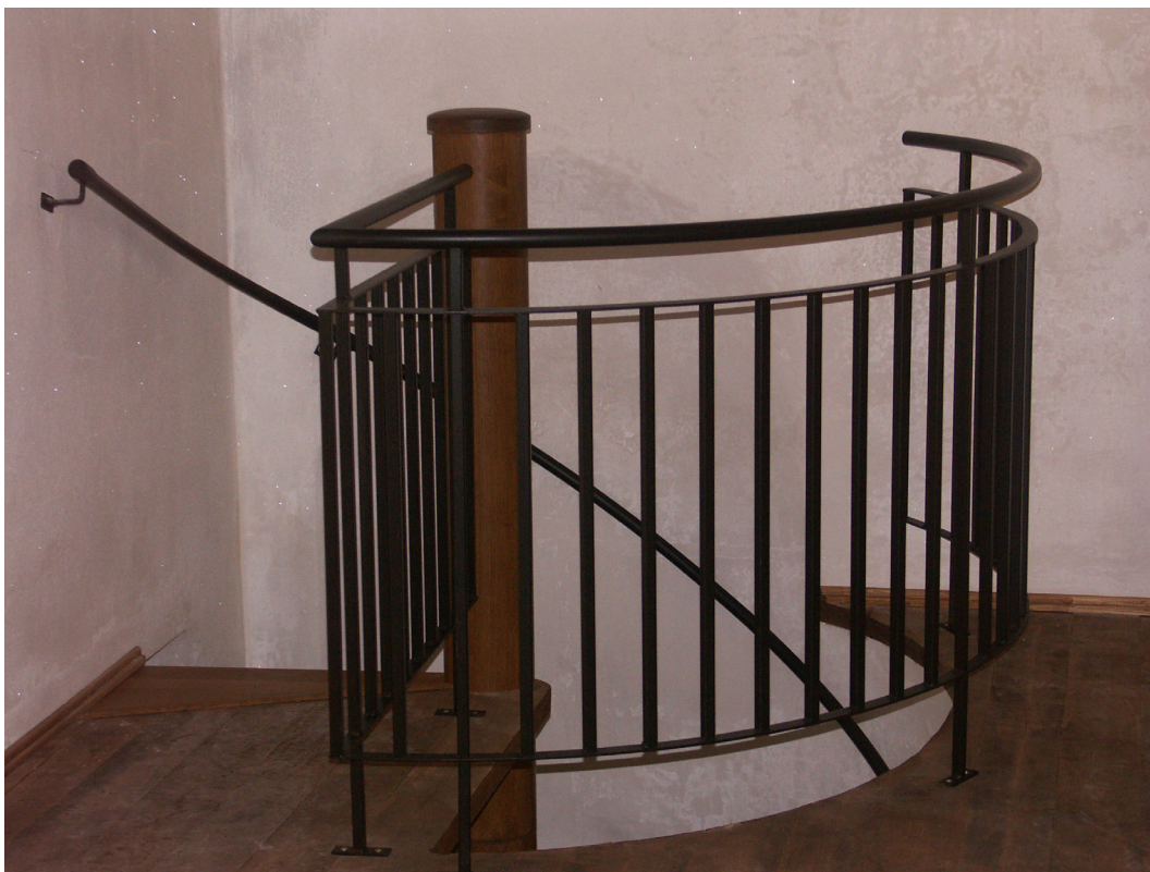
Obr. 9. Kalek, kostel sv. Václava, interiér, detail zábradlí, leden 2011.