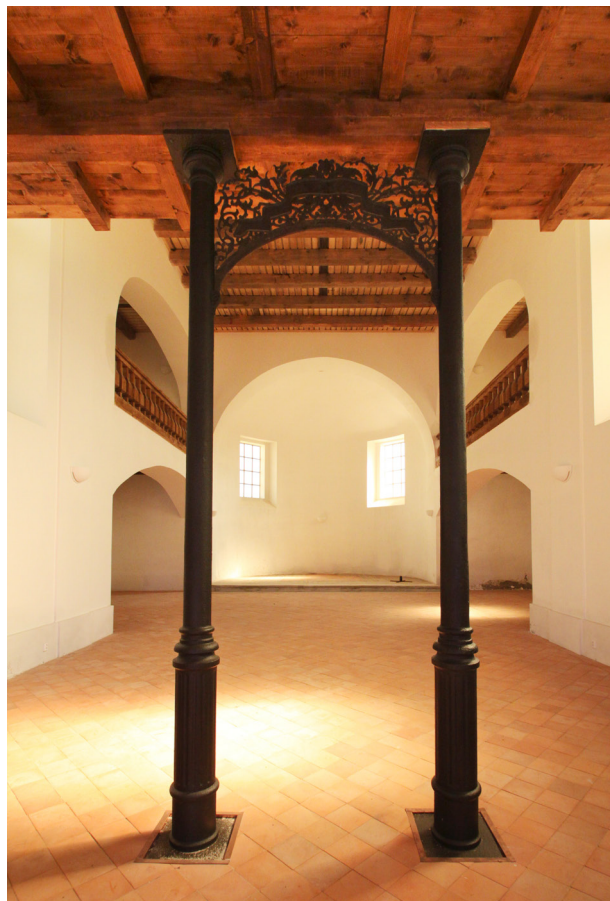
Obr. 8. Kalek, kostel sv. Václava, interiér, průhled do lodi přes litinovou konstrukci nesoucí kruchtu, duben 2011.