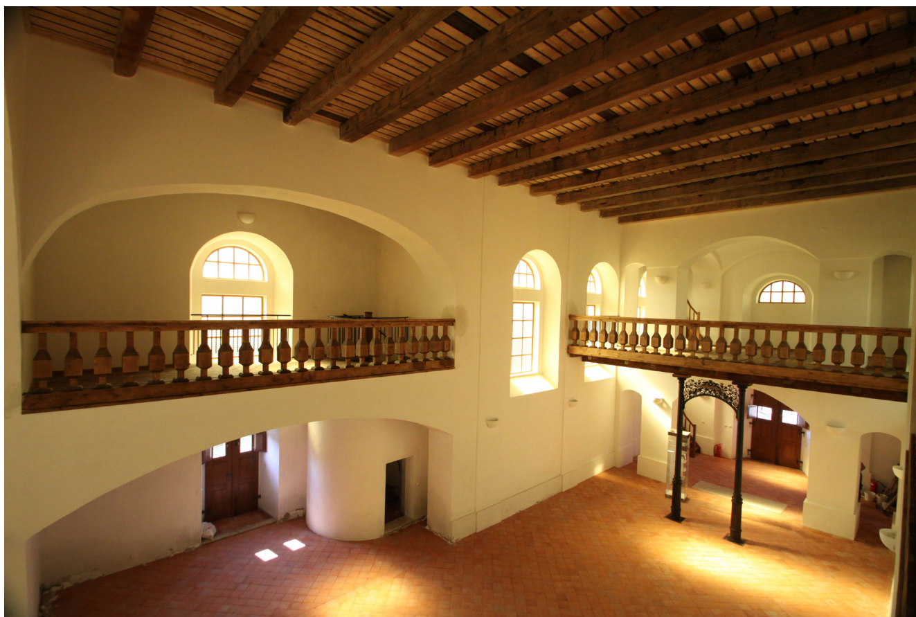
Obr. 12. Kalek, kostel sv. Václava, pohled do interiéru na emporu a kruchtů, duben 2011.