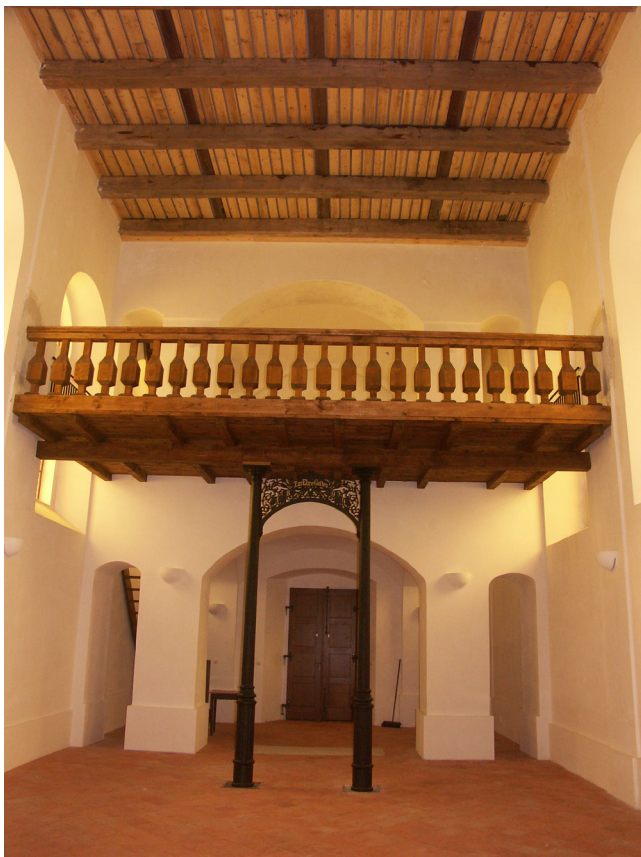
Obr. 7. Kalek, kostel sv. Václava, interiér, litinová konstrukce nesoucí novou dřevěnou kruchtu, leden 2011.