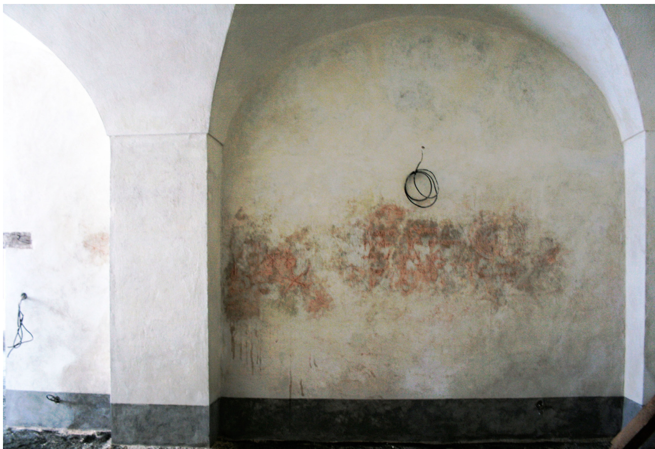
Obr. 2. Umístění souboru kreseb a nápisů v ploše jižní stěny místnosti 107.

Druhotné zesilování tahu dřívku a serifů počátečního písmene nápisu dle mého soudu dokládá, že zvolený typ písma běžně užíval pro široký dukтус plochého pisadla. Užité zednické rudky bylo vedeno patrně okamžitou potřebou, běžnou u znakových figur nižšího statusu: náčrtů, skic a poznámek.