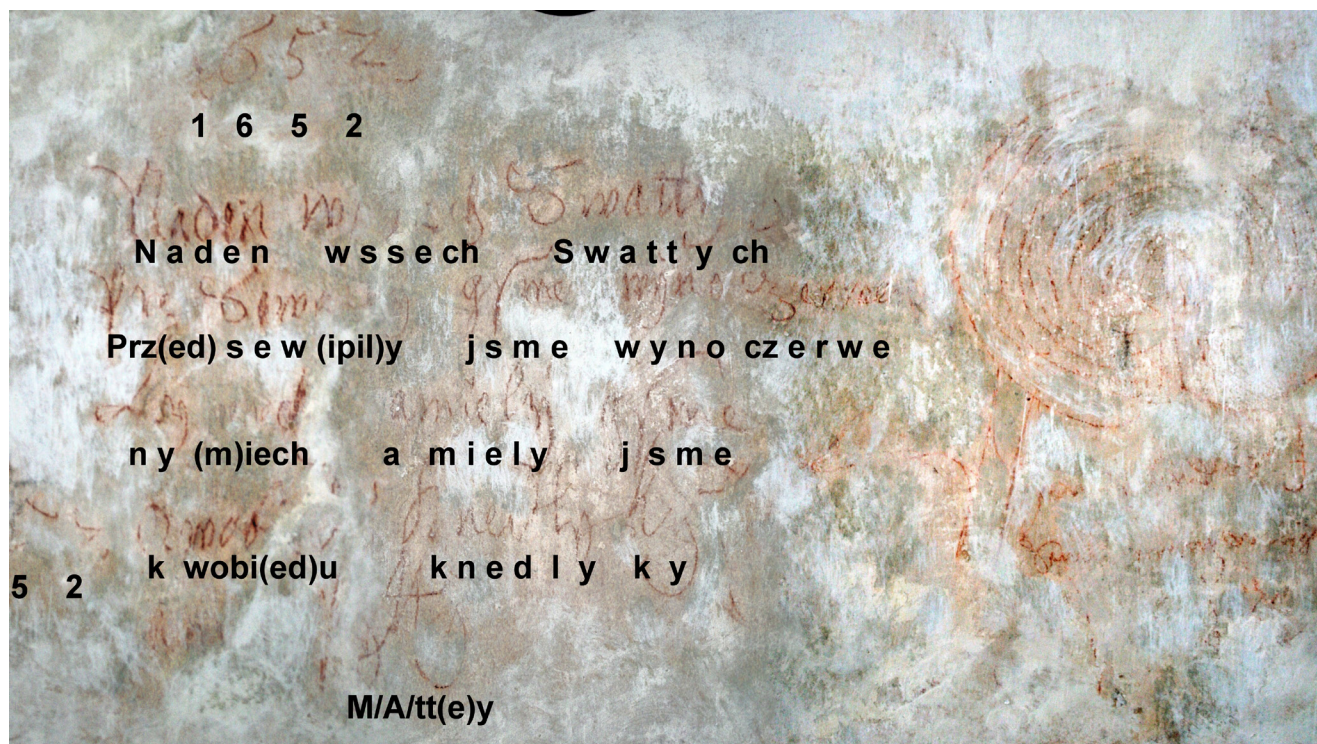
Obr. 5. Interpretací přepis epigrafu.

menu, při posvícenských hodech se vedle pečeně konzumovaly především kynutá obilná jídla: knedlíky, koláče a buchty. Při jejich přípravě je mouka z obilí nové sklizně zadělána uchovávaným „věčným“ kváskem. Spojení věčného s novým do jednoho celku je prvkem prosperitní magie, který cílí k zajištění kontinuity cyklu a k příslibu příštího zdaru.