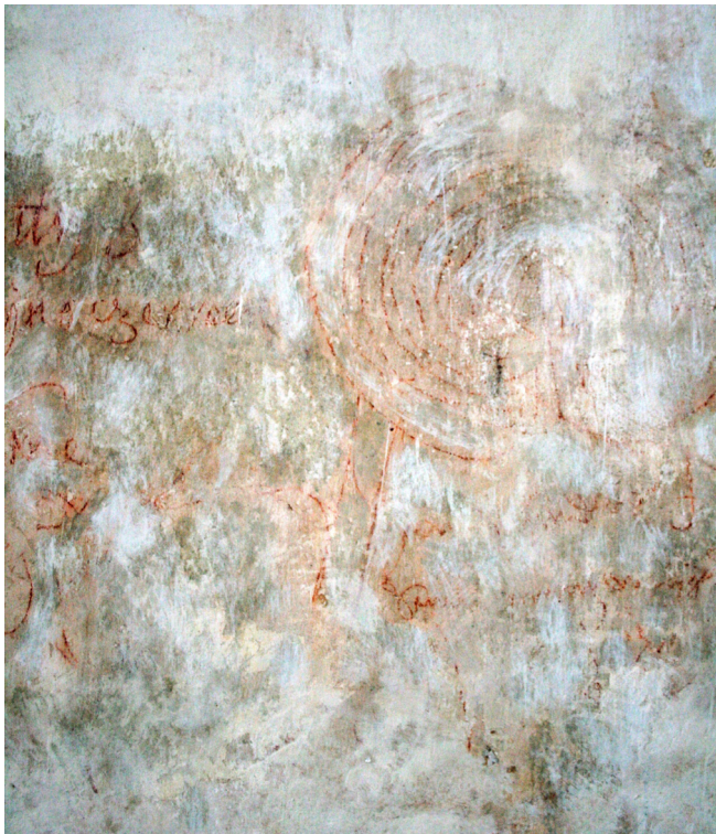
Obr. 6. Detail symbolu Ptolemeovských nebeských sfér.