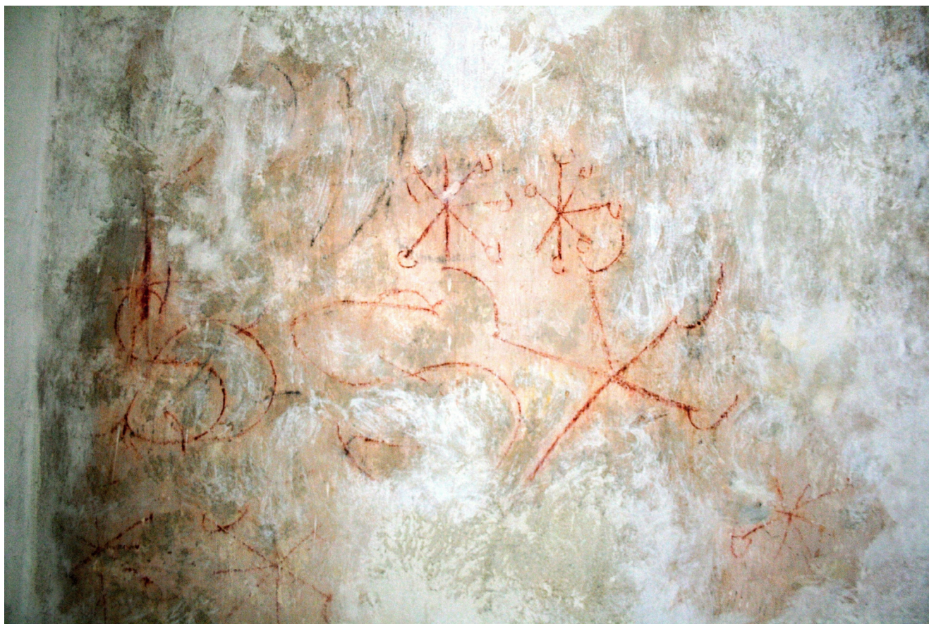
Obr. 3. Detail dvou epigrafických vrstev.

spojuje tento Timaiův příměr s Kristovým křížem, který je vepsán na nebesích jako základ uspořádání vesmíru.