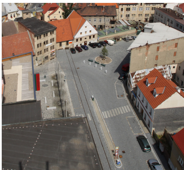
Obr. 9. Pohled z pivního majáku na nově upravené náměstí.