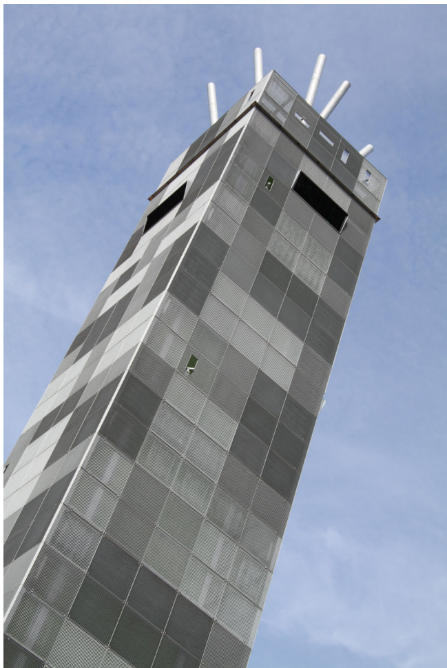
Obr. 2. Těleso pivního majáku.