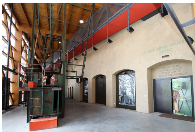
Obr. 8. Přístavba muzea, interiér s česačkou chmele.

Realizace dvou ambiciózních novostaveb a úprava veřejných prostor představuje po plošných asanacích prováděných