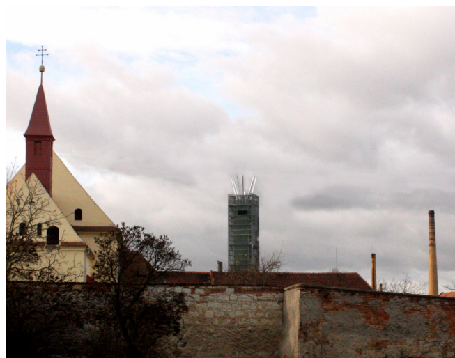
Obr. 6. Pohled na pivní maják od kapucínského kláštera.