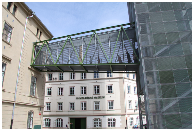
Obr. 3. Lávka spojující pivní maják a sousední sklad chmele, exteriér.