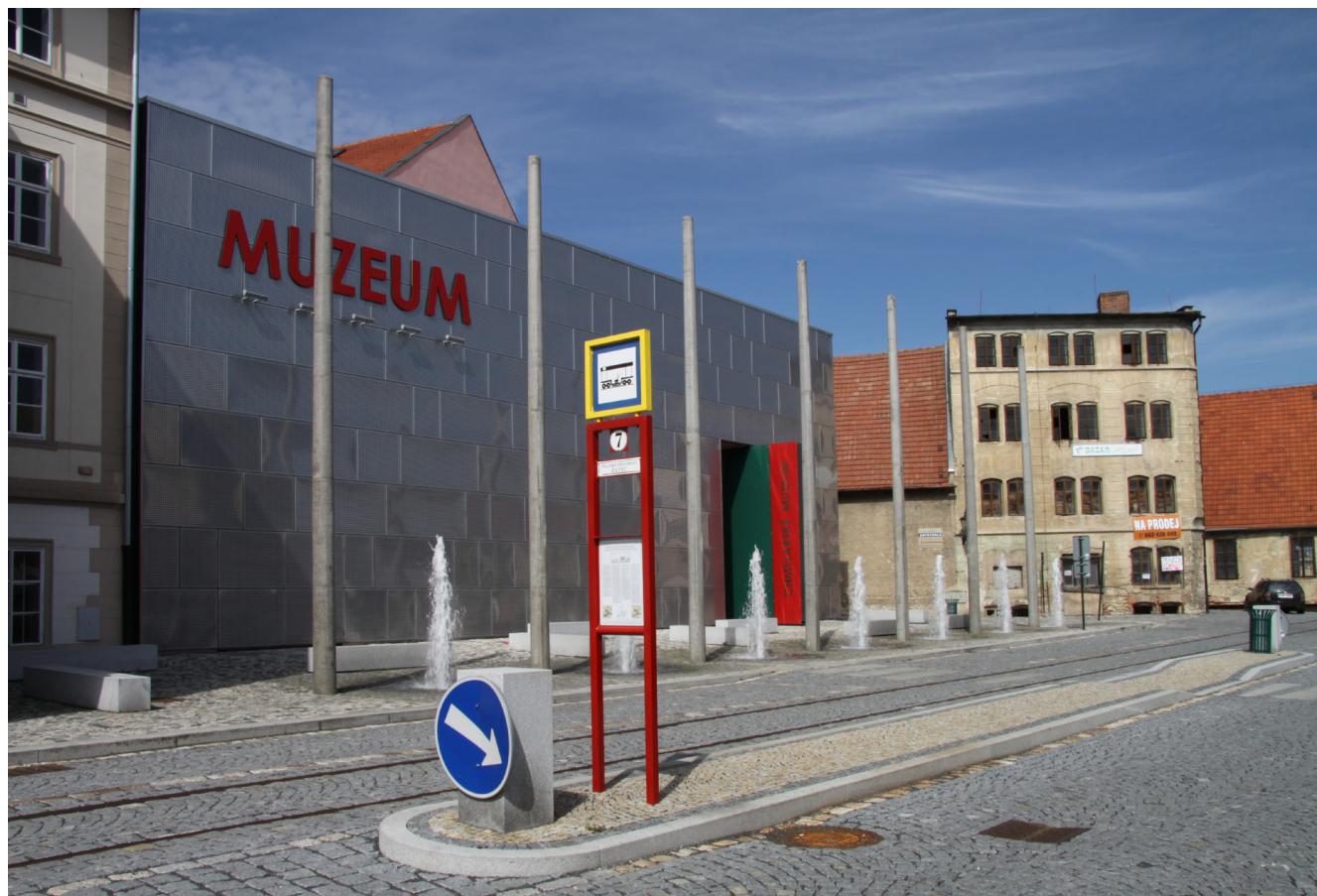
Obr. 7. Čelní průčelí přístavby muzea.