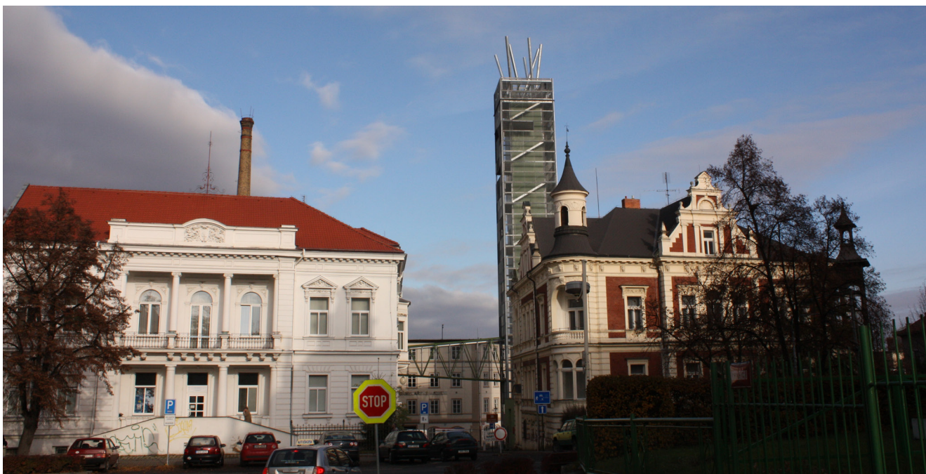
Obr. 5. Pohled na pivní maják od jihu z ulice Jaroslava Vrchlického.

Český Krumlov, Praha) působila konfliktně a případná realizace by zde pro odbornou složku státní památkové péče byla neakceptovatelná. V Žatci je však nutné s ohledem na výše uvedené hodnoty památkového území uvažovat v jiných dimenzích. Památková zóna s řadou přirozených vertikál stavbu přijala bez toho, že by se to v dálkových pohledech negativně projevilo v její specifické siluetě. V panoramatu nepředstavuje věž rušivý prvek, prakticky zde splývá s ostatními komíny, v jejichž řadě ji musí divák cíleně vyhledat. Z běžných průhledů v rámci města vytváří nové, v některých případech téměř malebné (pohled z ulice Komenského Aleje), jindy naopak provokativní kompozice (pohled z prostoru za kapucínským klášteřem). Podstatné však je, že věž ani z jednoho pohledu není vizuální bariérou. I přes svou dominanci nebrání v pohledu na historickou část města.