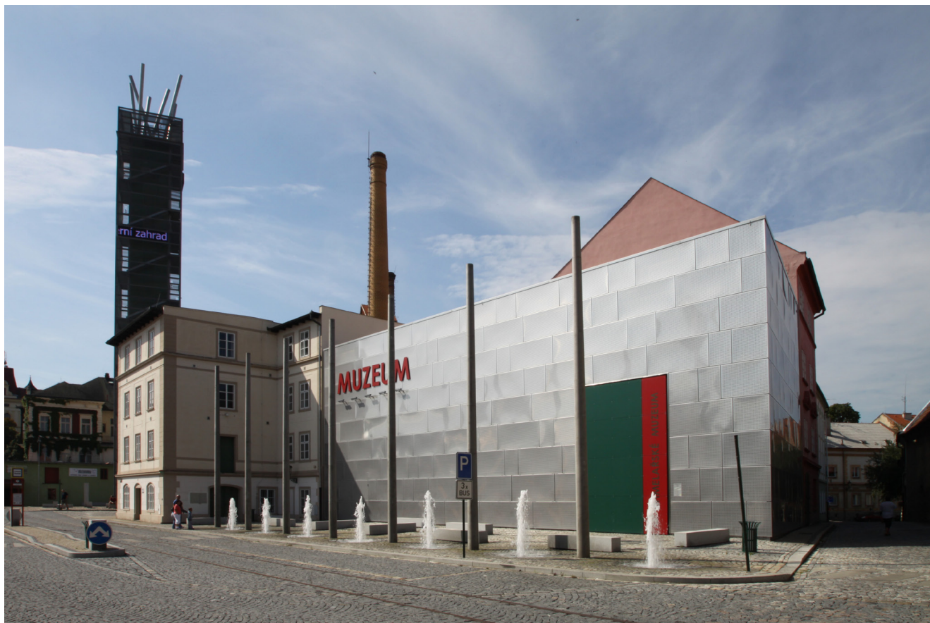
Obr. 1. Pohled na Náměstí Prokopa Velkého s přístavbou muzea a pivním majákem.

Chrám chmele a piva byl založen jako účelové občanské sdružení – příspěvková organizace města Žatce a několika dalších partnerů s cílem propagovat a udržovat chmelařské tradice a zároveň pečovat i o historické stavební objekty na katastru města, které ke zpracování a skladování chmele sloužily. Projekt, který v roce 2007 finanční částkou přesahující 211 mil. Kč podpořila Evropská unie ze svého Regionálního operačního programu Severozápad, se proto v intencích původního záměru zacítil na revitalizaci části tzv. Pražského předměstí. Zahrnoval obnovu bývalého skladu chmele č. p. 1550 na náměstí Prokopa Malého, záchranu a rekonstrukci renesanční sladovny č. p. 356 v Masarykově ulici, úpravu povrchů na náměstí Prokopa Malého a Prokopa Velkého, rekonstrukci zahrady u kapucínského kláštera a výstavbu dvou nových objektů – pivního majáku a přístavby chmelařského muzea.