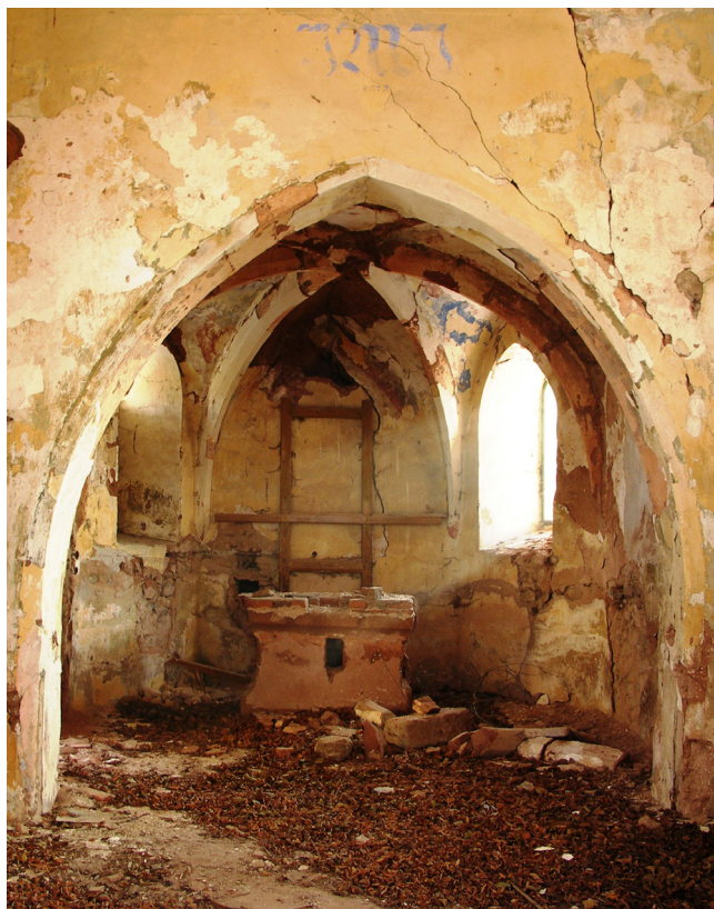
Obr. 3. Libyně, kostel sv. Jiljí, presbyterium, pohled od Z.

Proces obnovy kostela dosud není dokončen, je však již nepochybné, že objekt se nenachází v přímém ohrožení a ve stadiu realizace je projekt na nové využití stavby. Jeho cílem je zřízení muzejní expozice věnované uměleckému sklářství a tvorbě vitrají. Okenní otvory kostela budou osazeny vitrajemi, dokumentujícími vývoj vitrají a techniky sklomalby od románského období až do 20. století. Vzhledem k torzálnímu stavu fondu středověkých vitrají v ČR byly jako předlohy použity vitraje ze zahraničí. V současné době je instalováno pět vitrají zhotovených ateliérem Skloart v Lubenci. V presbyteriu jsou osazeny vitraje vycházející ze středověkých předloh, jedná se o dvojici vitrají s gotickým rostlinným ornamentem podle předloh z Musée de Cluny a figurální