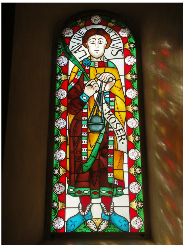
Obr. 9. Libyně, kostel sv. Jiljí, vitraj sv. Vavřince.

vitraj se sv. Vavřincem, zhotovenou dle vitraje se sv. Danielem z augšpurského dómu. Úzké gotické okno v ose presbyteria bude osazeno vitrají s prostým zasklením terčíky (bucnami). Období středověkých vitrají dále doplňuje narativní vitraj zachycující v jednotlivých kruhových polích výjevy ze života patrona kostela sv. Jiljí, která byla komponována podle souboru vitrají z katedrály v Chartres. V lodi kostela je dále instalována vitraj se sv. Jiřím, zachycující období renesance, zhotovená dle předlohy z chrámu Panny Marie (Onze-Lieve-Vrouwekerk) v belgických Bruggách. Poslední dosud realizovaná vitraj s vyobrazením sv. Václava zastupuje zlatý věk tvorby vitrají v období historismu, předlohou byla vitraj z roku 1898 z kostela sv. Petra a Pavla v nedalekých Podbořanech.