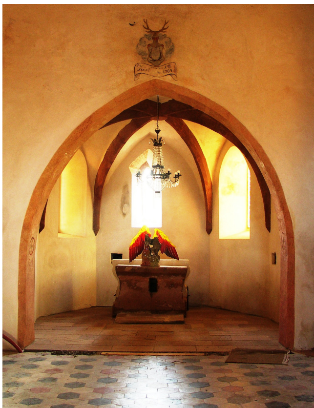
Obr. 4. Libyně, kostel sv. Jiljí, presbyterium, pohled od Z.