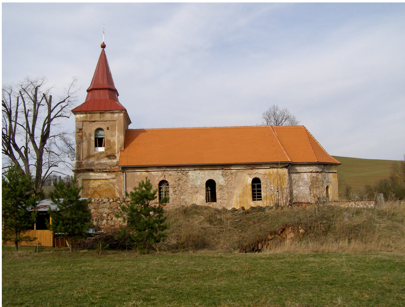
Obr. 2. Libyně, kostel sv. Jiljí, celkový pohled od J.