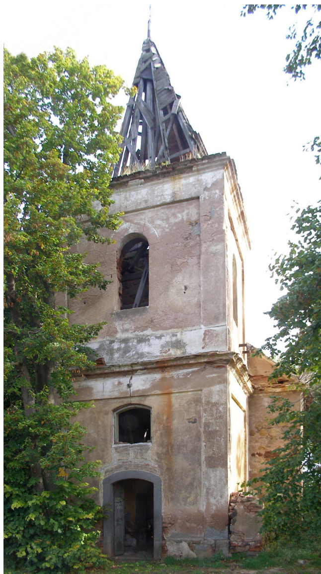
Obr. 1. Libyně, kostel sv. Jiljí, celkový pohled od Z. 18. 10. 2006.

V presbyteriu byl realizován restaurátorský průzkum omítek, 5 při kterém byly nalezeny malby konsekračních křížů na podhledu triumfálního oblouku a nástěnná malba s erbem Strojetic nad vnější stranou triumfálního oblouku. V roce 2011 proběhlo doplnění omítek presbyteria spojené s konzervací a restaurováním fragmentů nástěnných maleb. Byl proveden odkryv gotické výmalby triumfálního oblouku tvořené konsekračními kříži a odkryv barokní malby erbu Strojeticých ze Strojetic včetně mluvící pásky odkazující na renovaci kostela