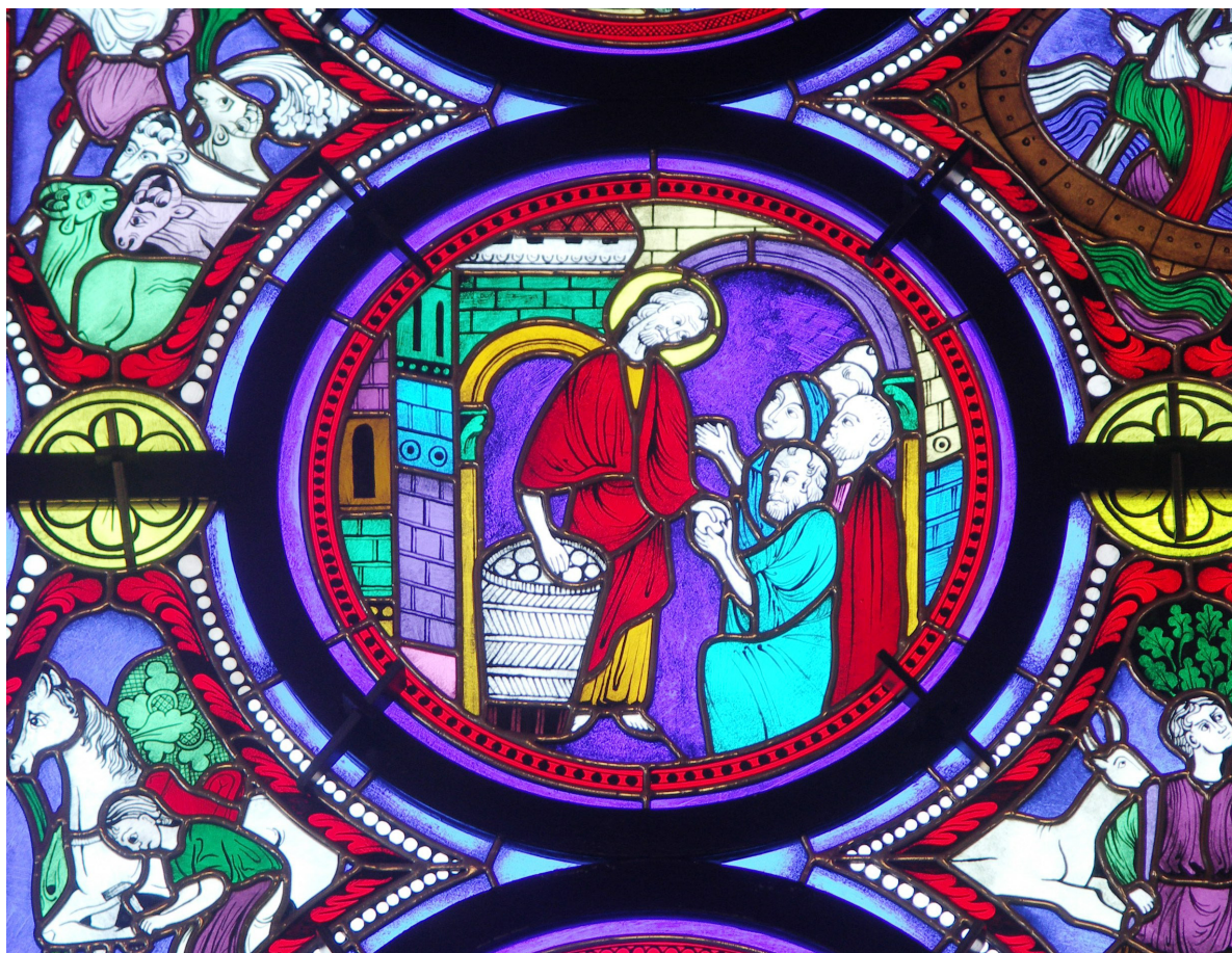
Obr. 8. Libyně, kostel sv. Jiljí, vitraj sv. Jiljí, detail.