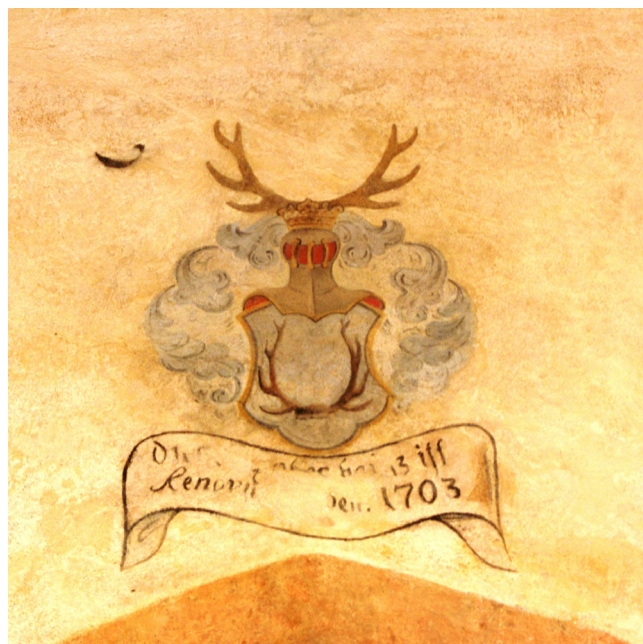
Obr. 5. Libyně, kostel sv. Jiljí, detail erbu Strojeticů ze Strojetic, pohled od Z.