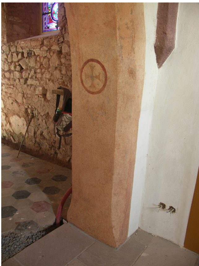
Obr. 6. Libyně, kostel sv. Jiljí, detail pohledu triumfálního oblouku s konsekračním křížem, pohled od JV.