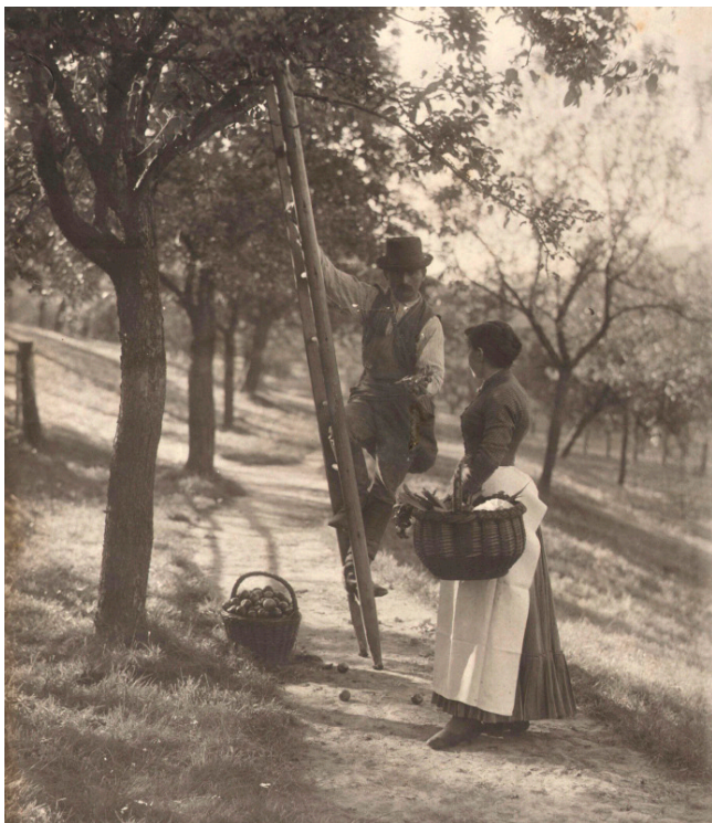
Obr. 11. Karel Chotek, Česání ovoce , 1900?, print, fond Velké Březno, SZ Velké Březno .

až v Jižní Rhodesii v Africe, kam přijel v 50. letech, a kde také roku 1969 zemřel. 38