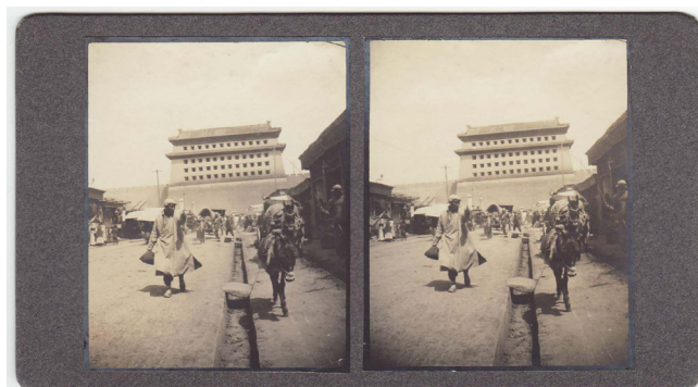
Obr. 15. Nesignováno, Peking, 1931–1932, stereofotografie ze souboru Jáva, Čína, Japonsko.