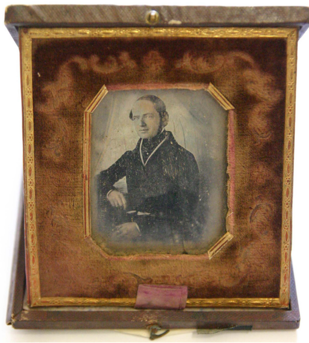
Obr. 3. Nesignováno, Portrét neznámého muže, (Josef Edler Schroll?), 1845? daguerrotypie adjustovaná v koženém pouzdře, fond Liběšice, SZ Libochovice.

ateliéru v Čechách a jedné z nejvýznamnějších osobností české fotografie vůbec. Druhá daguerrotypie „Portrét mladého muže“ je na zadní straně opatřena vizitkou se jménem daguerrotypisty P. Graffa 11 a také přesným datem pořízení, kterým byl 17. duben 1847. Bližší data o autorovi nejsou známa, ale práce s rekvizitami a celková kompoziční promyšlenost snímku vede k domněnce, že autor prošel praxí v malířském portrétním ateliéru.