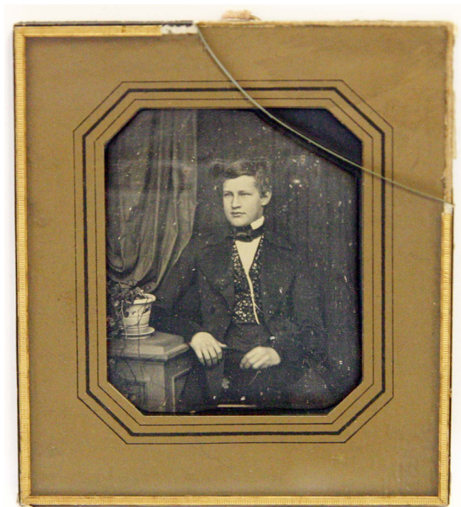
Obr. 2. P. Graff, Portrét neznámého muže, 1847 daguerrotypie v rámu, fond Huttenhof, SZ Libochovice.

ambrotypie 8 nebo pannotypie. 9 Nejbohatší na sbírkové předměty pořízené těmito technikami je depozitář na státním zámku Libochovice, ve kterém se dochovaly soubory celkem čtyř ambrotypii, šesti daguerrotypií a sedmi pannotypií, které pocházejí ze svozů Huttenhoff, Liběšice, Snědovice a z kmenového svozu Libochovice.