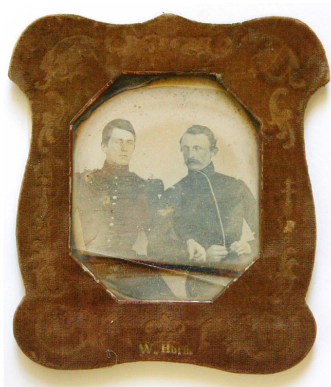
Obr. 1. Wilhelm Horn, Dva důstojníci, 1850? daguerrotypie v sametovém rámu, fond Huttenhof, SZ Libochovice.

Teprve v průběhu 70. let 20. století došlo v Evropě k postupné změně v přístupu k těmto sbírkovým předmětům, které byly doceněny jako významný zdroj informací pro kulturní a společenské dějiny 19. a 20. století, ale také pro dějiny umělecké fotografie. 5 Do Čech dorazila tato vlna zájmu o fotografie s dvacetiletým zpožděním až v 90. letech minulého století a souvisela s rozsáhlými politickými a hospodářskými změnami ve společnosti. Právě v této době začaly státní instituce a Národní památkový ústav