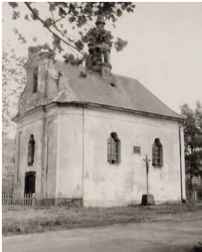
Obr. 2. Dolina, kostel sv. Františka Serafínského, celkový pohled, 1961. Sbíрка NPÚ ÚL, č. neg. 10129.