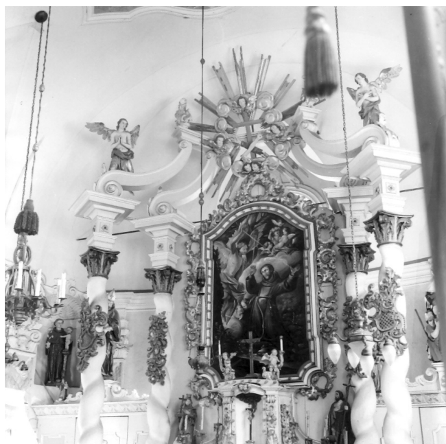
Obr. 5. Dolina, hlavní oltář sv. Františka Serafinského, 1966.

K vybavení interiéru kostela zřejmě patřily také čtyři kamenné sochy – sv. Floriána, archanděla, sv. Markéty z Cortony a sv. Prokopa, fotografované již mimo kostel v době přesunu před jeho demolicí s uvedením původu z Doliny. 10