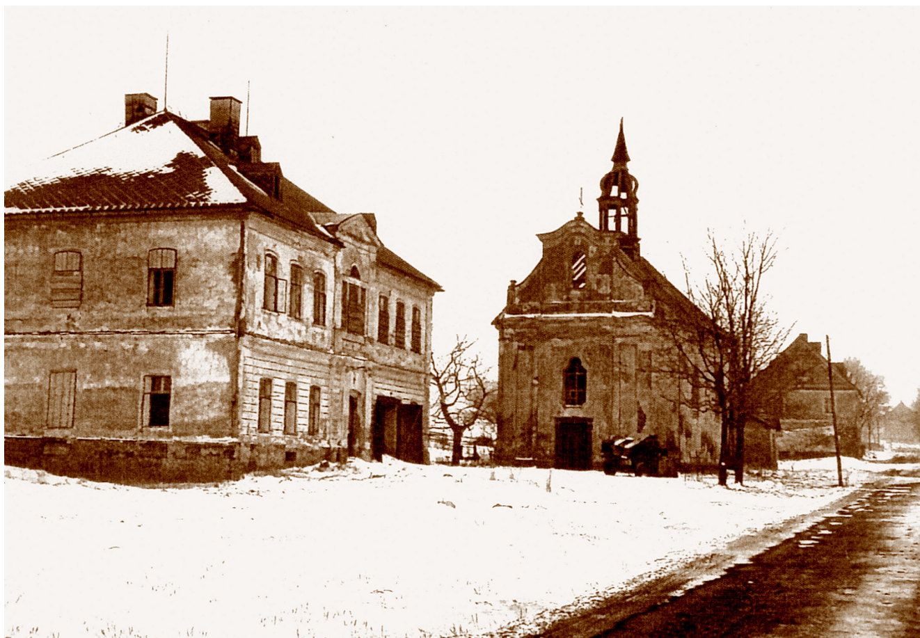
Obr. 4. Dolina, kostel sv. Františka Serafinského, před demolicí, nedatováno.

V popisech je zmiňován jen hlavní oltář, datovaný do 3. čtvrtiny 18. století (movitá kulturní památka, č. rejstříku 35-1406). Jeho bíle lakovanou architekturu tvořily čtyři torčované sloupy, dva z nich předsunuté, s volutově stočenými pásy mezi sloupy a horní římsou, která byla doplněna dvěma klečícími andílky. Na bílých sloupech se vyjímaly zlatené řezby rokajových motivů a korintských hlavic. Uprostřed byl zavěšen titulní obraz Stigmatizace sv. Františka v rámu s rokajovou řezbou. Po stranách mezi sloupy stály dvě sochy – vlevo sv. Mikuláše a vpravo sv. Alžběty Uherské s postavou almužníka. Na horní desce tabernákle byly drobné sošky dvou andělů světloňošů. Sochy ve dvou nikách po stranách oltáře představovaly sv. Antonína Paduánského a pravděpodobně P. Marii. V oltářním nástavci byl bohatě rezbářsky pojednaný znak minoritů, tedy kříž s paprsky vycházejícími z mráčeků, doplněný hlavičkami andělíčků, v dolní části jsou pak dvě zkřížené paže se stigmaty, připomínající zakladatele řádu. 9