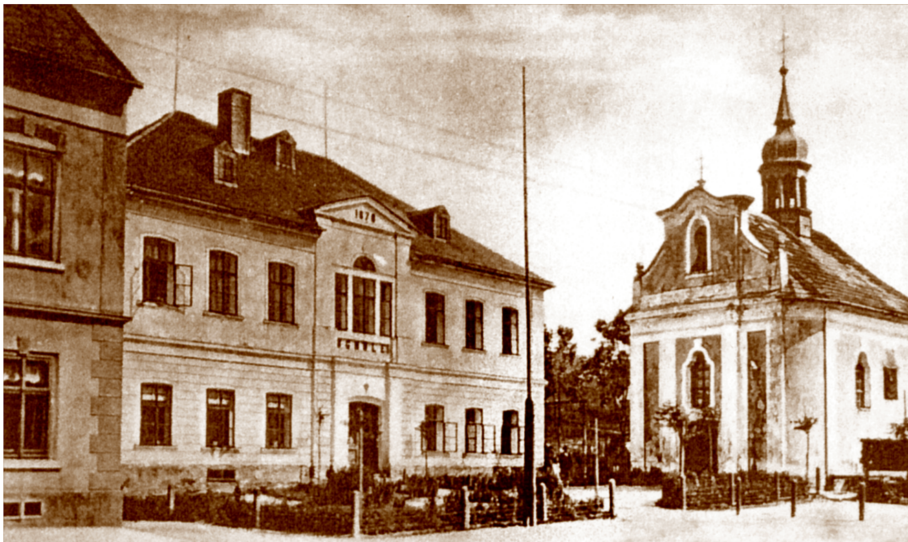
Obr. 1. Dolina, dobová pohlednice, nedatováno.

Obec Dolina se nacházela původně přibližně 1 km jižně od města Přísečnice při silnici do Měděnce a dále do Klášterce nad Ohří. V poměrně úzkém údolí podél potoka protékajícího od Měděnce vznikla postupně po obou stranách silnice vesnická zástavba o délce 1,2 km, k níž patřily také dva strážní domky č. p. 107 a č. p. 108 na trati Chomutov–Vejprty a dům č. p. 90 poblíž osady Kotlina. 1