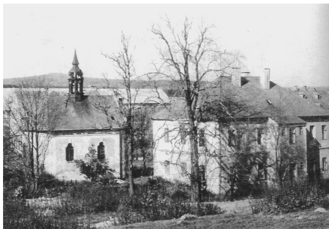
Obr. 3. Dolina, kostel sv. Františka Serafínského, pohled od Měděnce, nedatováno.

povoznictví (př. zajištění pravidelné dopravy zboží mezi Lipskem a Prahou) doplatilo na zprovoznění železniční trati Chomutov – Vejprty v roce 1872. 3