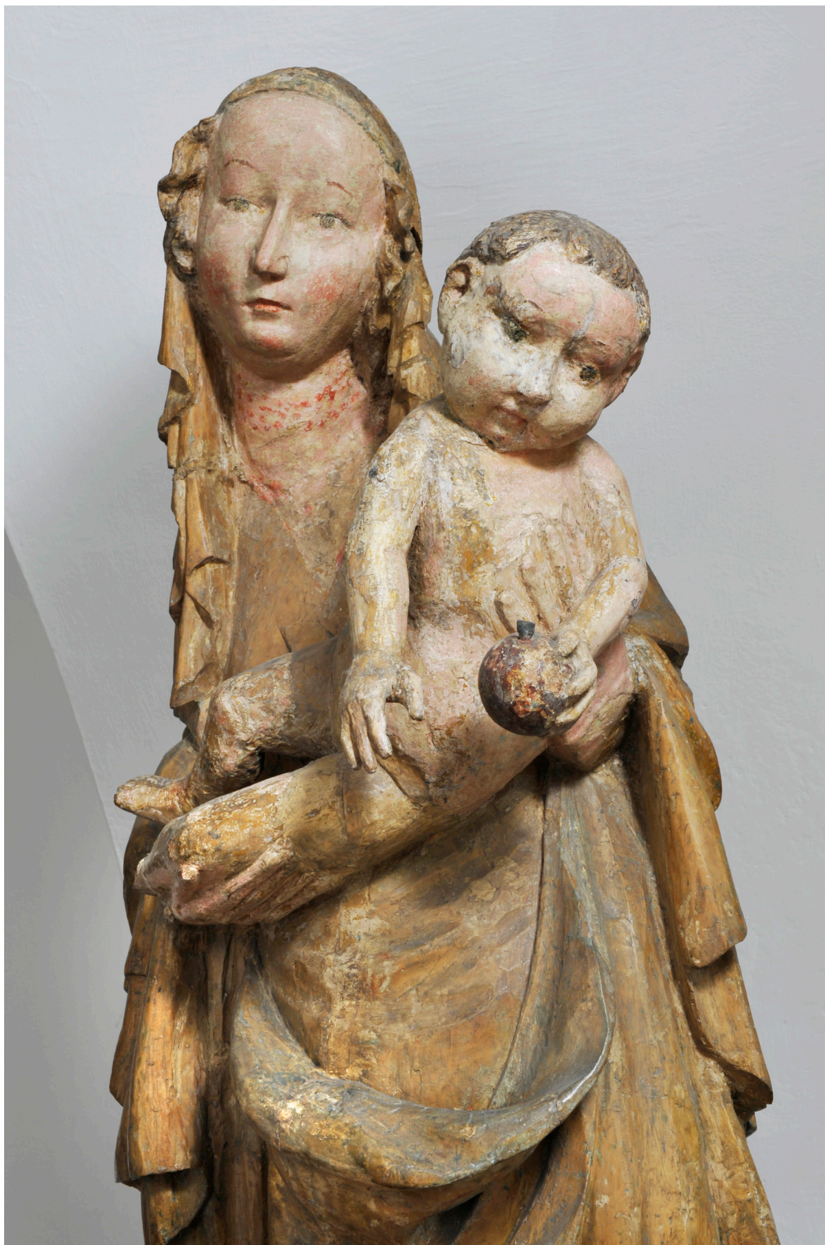
Obr. 12. Madona ze Zadní Lhoty u Těchlovic, čelní pohled – detail.