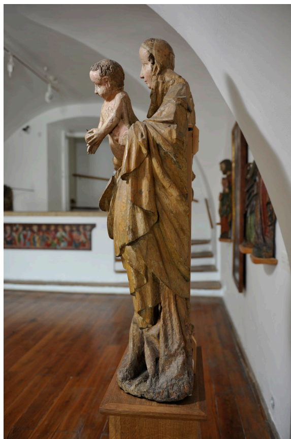
Obr. 10. Madona ze Zadní Lhoty u Těchlovic, boční pohled.