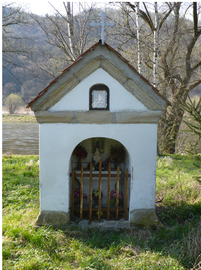
Obr. 6. Barokní mariánská kaple v Těchlovicích, z níž byla madona vyplavena v červnu 1804.

Pokud budeme chtít alespoň částečně nahlédnout do osudů madony ze Zadní Lhoty před jejím deponováním v litoměřické galerii, budeme se muset nejprve přesunout o více než dvě stě let nazpět, a to konkrétně do června roku 1804. Tehdy Labe díky silným deštům vystoupilo ze svého běžného koryta tak, že to ani nejstarší obyvatelé nepamatovali, a mimo toho, že do svého širokého okolí roznášelo téměř červené bahno, 11 rovněž zasáhlo a vyplavilo u Těchlovic malou mariánskou barokní kapli. Tento sakrální objekt (obr. 6) se nachází na jihozápadním okraji obce poblíž labského koryta nalevo od silnice vedoucí z Velkého Března ještě před prvními těchlovickými domy a podle tradice byl vystavěn obyvateli obce Zadní Lhota v roce 1681 jako poděkování za odvrácení o rok dříve řádicí morové epidemie, jež se zastavila v Těchlovicích a do jejich obce již nepronikla. 12 Kaple zřejmě nebyla povodní příliš poškozena, ovšem zmizela z ní dřevěná socha madony. 13 Ta byla nahrazena novou mariánskou sochou – Pietou, tentokrát kamennou, kterou do kaple jako projev kajícího věnoval těchlovický soused Engel. 14 Již v následujícím roce však obyvatelé obce Zadní Lhota, vzdálené asi jeden kilometr jižně od Těchlovic, našli v Labi onu dřevěnou madonu z mariánské kapličky, která se k nim dostala „proti proudu“. 15 Vzhledem k tomu, že její původní místo bylo zřejmě již „obsazeno“ kamennou sochou či soškou, zůstal tento objev delší dobu „nevyužit“. 16 Až v roce