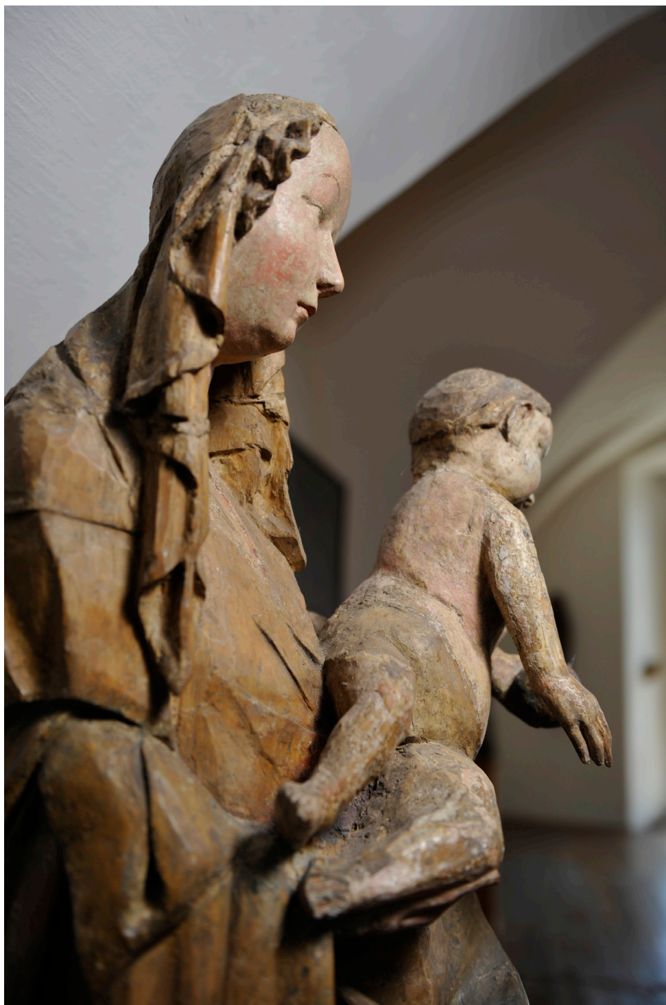
Obr. 5. Madona ze Zadní Lhoty u Těchlovic, boční pohled.

Ke konci první třetiny 15. století se nejen české gotické sochařství výrazněji odpoutává od principů krásného slohu, jakožto specifické české varianty umění přelomu 14. a 15. století; přesněji řečeno – jde v evropském umění o období, kdy je již „ nadvláda mezinárodní gotiky u konce “ 10 a střední Evropa hledá, ale hlavně aplikuje nové umělecké styly a horizonty. Víra v zázračnou moc uměleckých děl, jejich uctívání a devoce se prostřednictvím replik a kopií šíří dál i do vzdálenějších oblastí Čech, aniž by však, a to je nutné zdůraznit, ztrácely pevnou závislost na prvotním