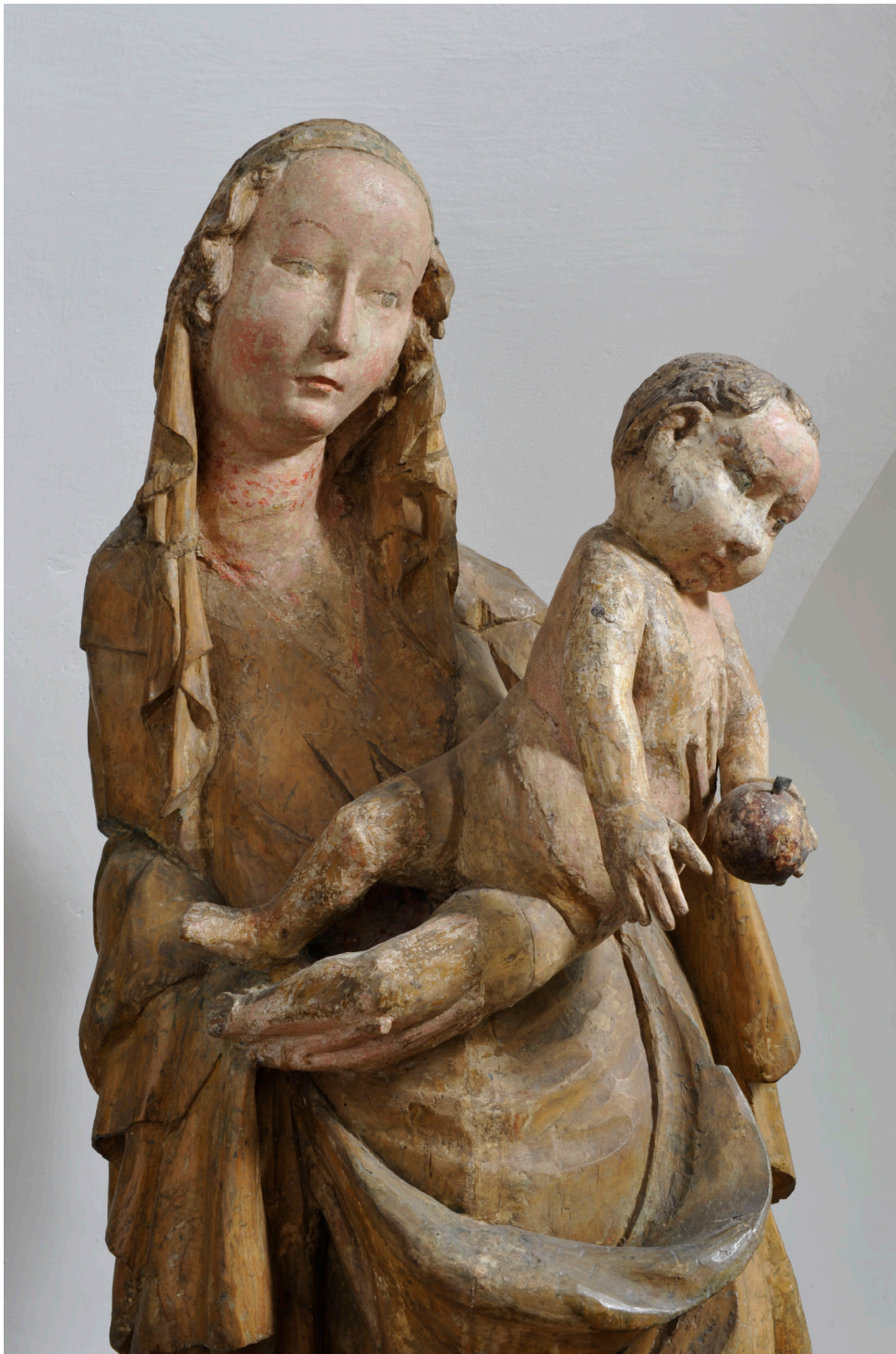
Obr. 2. Madona ze Zadní Lhoty u Těchlovic, detail horní části sochy.

čině (dnes Oblastní muzeum v Děčíně). V katalogu stálé expozice gotického umění se přikláním 6 k závěrům O. Votočka a stejně jako on spatřuji v uměleckém výrazu madony vazby na sochařská díla krásného slohu. Svým pojetím charakterizuje dílo uměleckou situaci v prvních desetiletích 15. století, i když jak hovoří Votoček: „... (madona ze Zadní Lhoty u Těchlovic) neztrácí přímé vazby na původní severočeskou sochařskou produkci... “. I v katalogu děčínské gotické plastiky nacházím nepřehlédnutelné vazby na Plzeňskou madonu a ponechávám již O. Votočkem stanovenou dataci, i když se pokouším zmíněnou časovou sekvenci částečně zúžit.