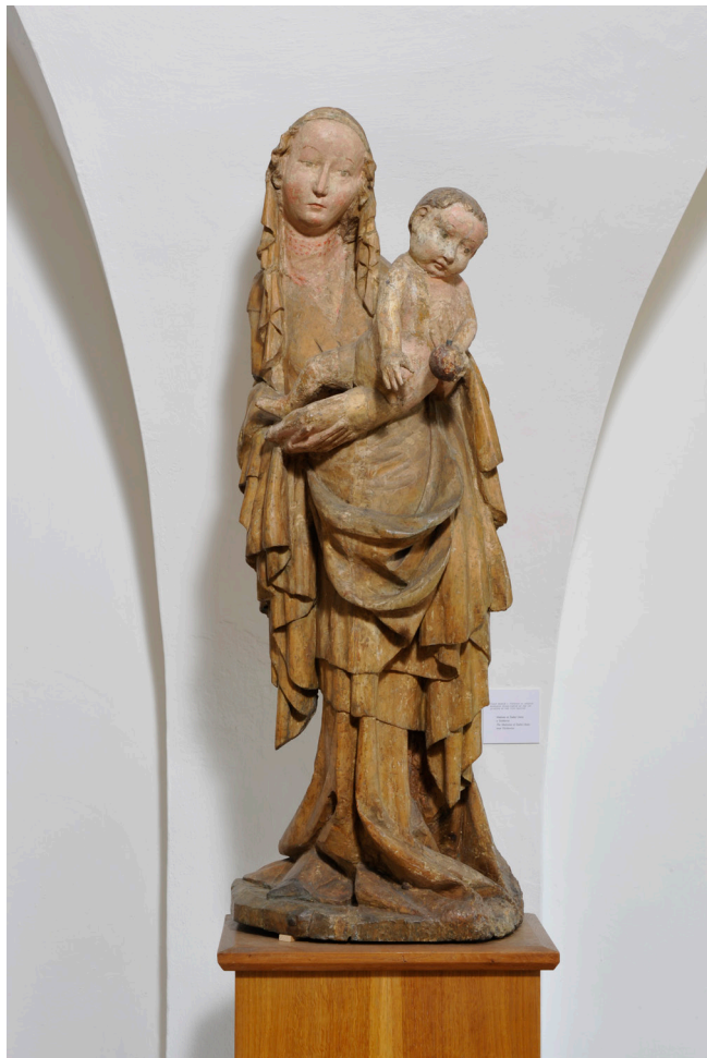
Obr. 1. Madona ze Zadní Lhoty u Těchlovic, celkový pohled.