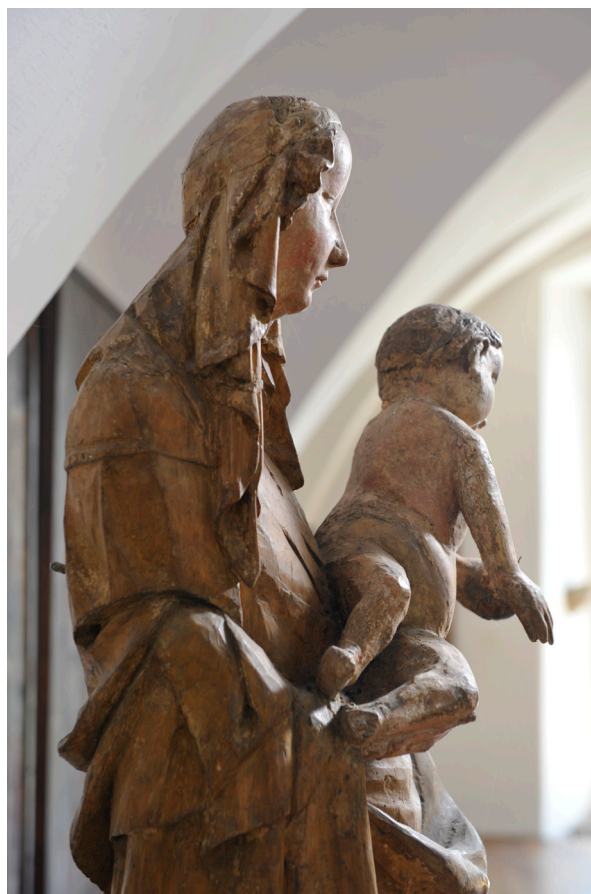
Obr. 11. Madona ze Zadní Lhoty u Těchlovic, boční pohled.