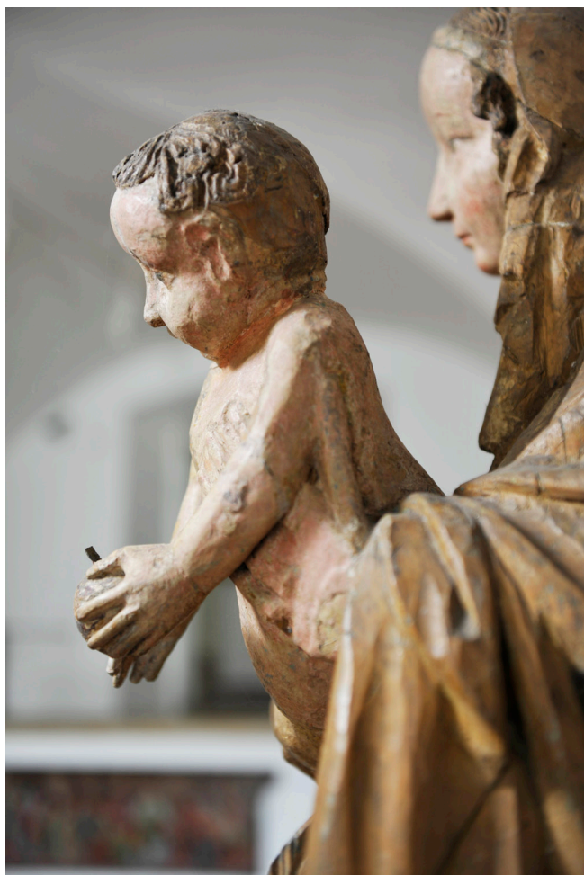
Obr. 9. Madona ze Zadní Lhoty u Těchlovic, boční pohled – detail.

of Děčín. The art historian (L. Turčan) finds considerable sculptural analogy between this Madonna and the key work of Gothic sculpture: Madonna from the church of St. Bartholomew in Pilsen. L. Turčan shares this idea with O. Votoček, the author of older art-historic classification. In agreement with M. Ottová the author also emphasizes an important attribute of the work from Těchlovice – its direct dependence on above mentioned work of art – Madonna from the church of St. Bartholomew in Pilsen – which apparently gave an initial impulse to origins of Madonna from Těchlovice that was probably made as a devotional copy of Madonna from Pilsen.