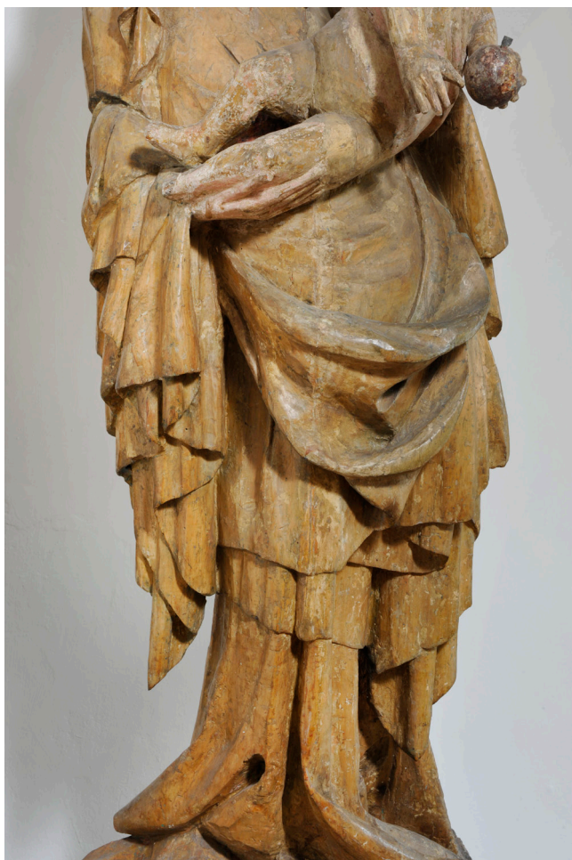
Obr. 3. Madona ze Zadní Lhoty u Těchlovic, detail spodní části sochy.

Odborné názorové spektrum se ohledně madony ze Zadní Lhoty u Těchlovic svým způsobem ustálilo, i když prostor pro drobnější názorové korekce poskytuje samotné dílo v několika rovinách. Spojovacím článkem naší madony ze Zadní Lhoty s madonou z Plzně je především samotná skulpturní koncepce plně objemového díla, jehož tvarosloví skýtá širší prostor pro četné analogie, viz obr. 2, 3, 4, 5. Z relativně široké polygonální základny vyrůstá figura s výrazným zúžením spodních partií složených z harmonických kaskád tubicových záhybů, na které již navazuje dominující eurytmie záhybů ve střední kompoziční části. Rozměrné hmotné mísovité záhyby po stranách ohraničené kaskády zvýrazňují především pod pravíci postavy ponderaci esovitě prohnuté figury Marie. Klíčovým komponentem v každém případě zůstává tělíčko Ježíška, které se od Marie spirálovitě odklání na levou stranu, což je pozice dítěte, kterou nacházíme s větší frekvencí i u klíčových děl krásného slohu. Nejen u již zmíněné Plzeňské madony, ale i u proslulé Krumlovské madony (Uměleckohistorické muzeum Vídeň), její volné repliky z Národní galerie, ale i u Třeboňské madony (augustiniánský klášterní kostel Panny Marie královny a sv. Jiljí v Třeboni). Obdobně jako u madony z Údlíc se i v případě madony ze Zadní Lhoty u Těchlovic její řezbář, který byl pevně svázan se svým vzorem, nedokázal vyrovnat s jeho tvarově harmonickým skulpturním projevem, což zdůraznila již M. Ottová ve své práci. Časové určení umělecké pozice madony