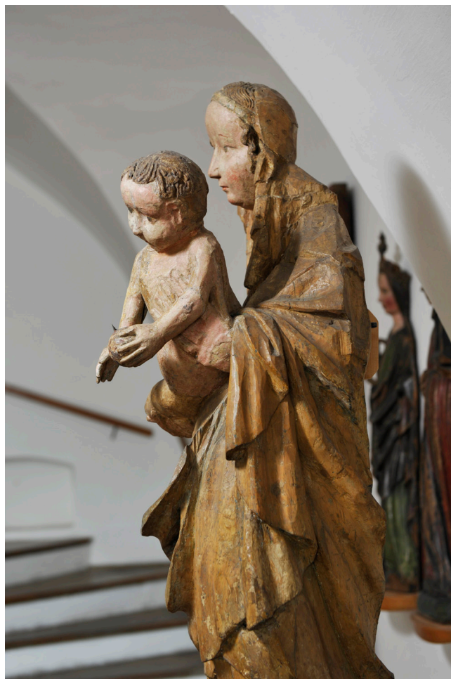
Obr. 4. Madona ze Zadní Lhoty u Těchlovic, boční pohled.

Odborné názorové spektrum se ohledně madony ze Zadní Lhoty u Těchlovic svým způsobem ustálilo, i když prostor pro drobnější názorové korekce poskytuje samotné dílo v několika rovinách. Spojovacím článkem naší madony ze Zadní Lhoty s madonou z Plzně je především samotná skulpturní koncepce plně objemového díla, jehož tvarosloví skýtá širší prostor pro četné analogie, viz obr. 2, 3, 4, 5. Z relativně široké polygonální základny vyrůstá figura s výrazným zúžením spodních partií složených z harmonických kaskád tubicových záhybů, na které již navazuje dominující eurytmie záhybů ve střední kompoziční části. Rozměrné hmotné mísovité záhyby po stranách ohraničené kaskády zvýrazňují především pod pravíci postavy ponderaci esovitě prohnuté figury Marie. Klíčovým komponentem v každém případě zůstává tělíčko Ježíška, které se od Marie spirálovitě odklání na levou stranu, což je pozice dítěte, kterou nacházíme s větší frekvencí i u klíčových děl krásného slohu. Nejen u již zmíněné Plzeňské madony, ale i u proslulé Krumlovské madony (Uměleckohistorické muzeum Vídeň), její volné repliky z Národní galerie, ale i u Třeboňské madony (augustiniánský klášterní kostel Panny Marie královny a sv. Jiljí v Třeboni). Obdobně jako u madony z Údlíc se i v případě madony ze Zadní Lhoty u Těchlovic její řezbář, který byl pevně svázan se svým vzorem, nedokázal vyrovnat s jeho tvarově harmonickým skulpturním projevem, což zdůraznila již M. Ottová ve své práci. Časové určení umělecké pozice madony