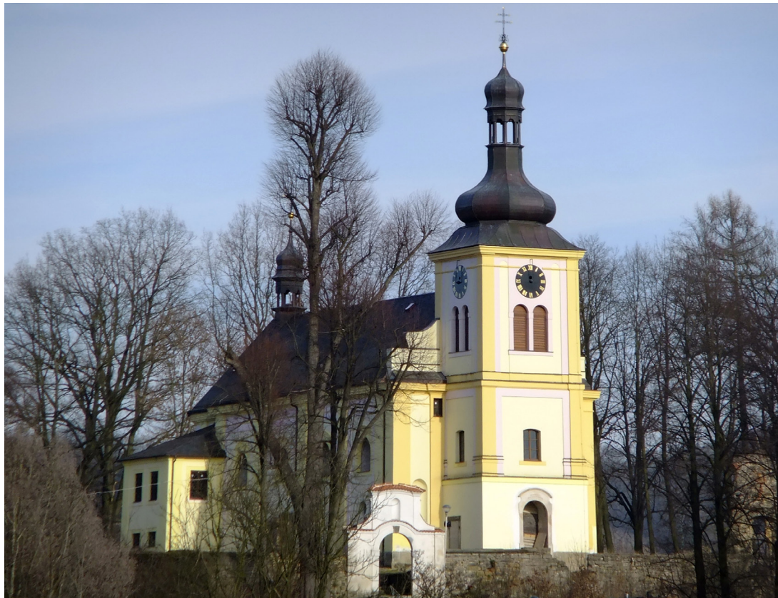
Obr. 1. Současný stav kostela sv. Martina v Markvaticích.

Během probíhajících oprav kostela sv. Martina v Markvarticích došlo začátkem roku 2010 k objevu dvou náhrobníků, jež dokládají bohatou historii této vesnice a svým vznikem spadají do doby před barokní přestavbou markvartického chrámu. Jelikož se jedná o náhrobníky drobné šlechty, je třeba připomenout, že právě pro Markvartice na Děčínsku byla typická rozdrobená držba vsi, která se zde na rozdíl od jiných lokalit udržela prakticky do konce období patrimoniální správy, byť ani tato vesnice nešla pobělohorskému scelování.