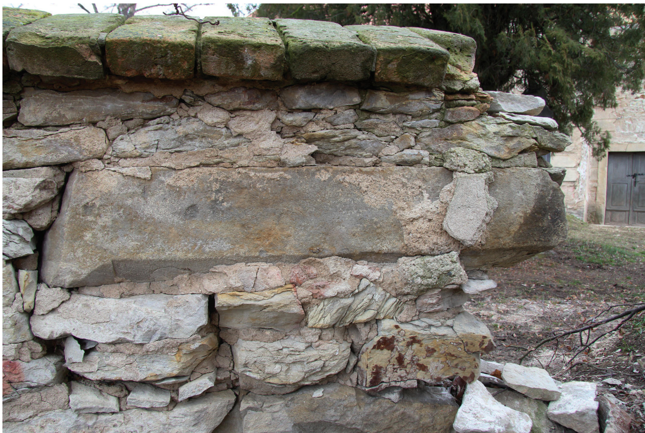
Obr. 3. Černěves, kostel sv. Prokopa, detail profilovaného fragmentu ostění v ohradní zdi hřbitova.

v lodi, vstup do sakristie a vstupní brána s ohradní zdí kolem areálu kostela. Poslední úprava proběhla v 19. století, kdy kostel dostal konečnou vnější podobu ve formě empírového pláště.