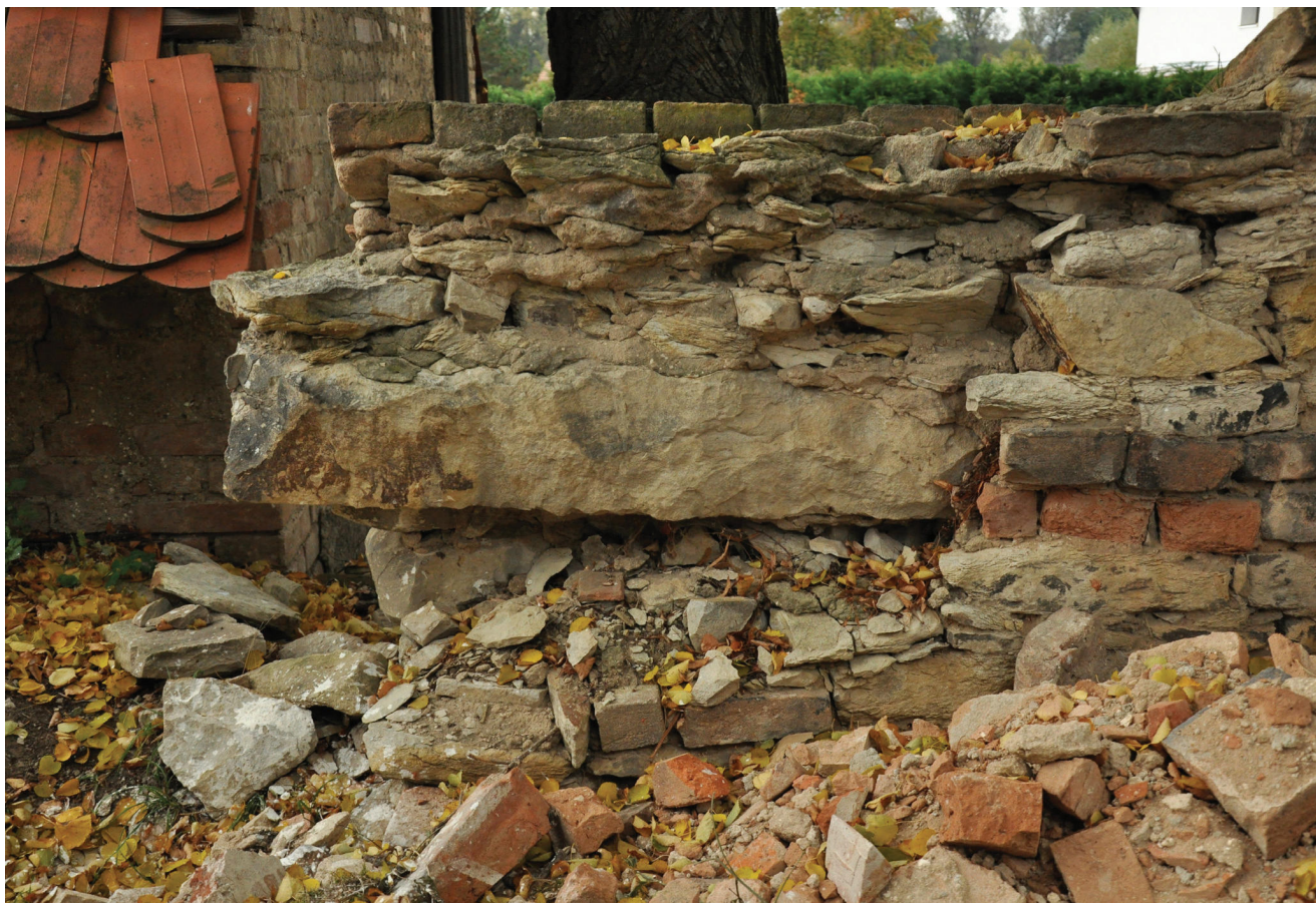
Obr. 8. Černěves, kostel sv. Prokopa, pohled na rubovou stranu profilovaného fragmentu ostění v ohradní zdi hřbitova. Foto: Táňa Nejezchlebová 2012.

v jižním průčelí presbytáře 16 a jednak zazděný okenní otvor v závěrovém boku presbytáře. 17 U mladších otvorů lze současnost s fragmentem ostění v ohradní zdi vyloučit vzhledem k odlišnému vzhledu okosení i nasazení záklenku. U otvoru v presbytáři lze shodnost rovněž vyloučit, neboť náběžní štítek i okosení jsou rozdílného vzhledu. Jako nejpravděpodobnější se tak jeví řešení, že se jedná o fragment stojky portálu dveřního otvoru, lokalizaci na stavbě lze teoreticky spojit s exteriérovým vstupem ze hřbitova do sakristie, který je v současném stavu opatřen barokním kamenným rámem s plastickou lištou vnější hrany a stopami modro-červené polychromie. Samotná hmota sakristie je datačně v literatuře bez dalšího upřesnění spojována již s obdobím 13. století, 18 dle dochovaných konstrukcí a prvků lze s jistotou předpokládat existenci sakristie v 15. století.