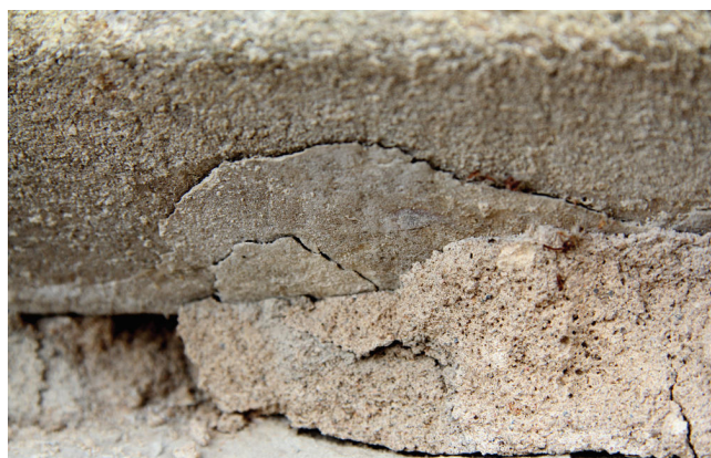
Obr. 7. Černěves, kostel sv. Prokopa, detail autentické povrchové úpravy na okosení profilace fragmentu ostění v ohradní zdi hřbitova. Foto: Táňa Nejezchlebová 2012.

Na ploše okosení se pod maltou ohradní zdi dochovaly fragmenty autentické povrchové úpravy portálu. Ostění bylo dle fragmentů potahováno tenkou jednovrstvou vápennou omítkou s jemně hlazeným povrchem, na kterou navazoval bílý vápenný nátěr v několika vrstvách ( obr. 7 ). Rubová strana prvku je degradována zvětráváním povrchu a mechanickým poškozením, čímž došlo k částečnému setření hran a ploch prvku. Sekaná plocha je zachována pouze částečně při vnějším přečnívajícím konci prvku. Plocha nese zachovanou zahnědlou krustu, vzniklou na povrchu ostění pravděpodobně v důsledku přežehnutí ohněm ( obr. 8 ).