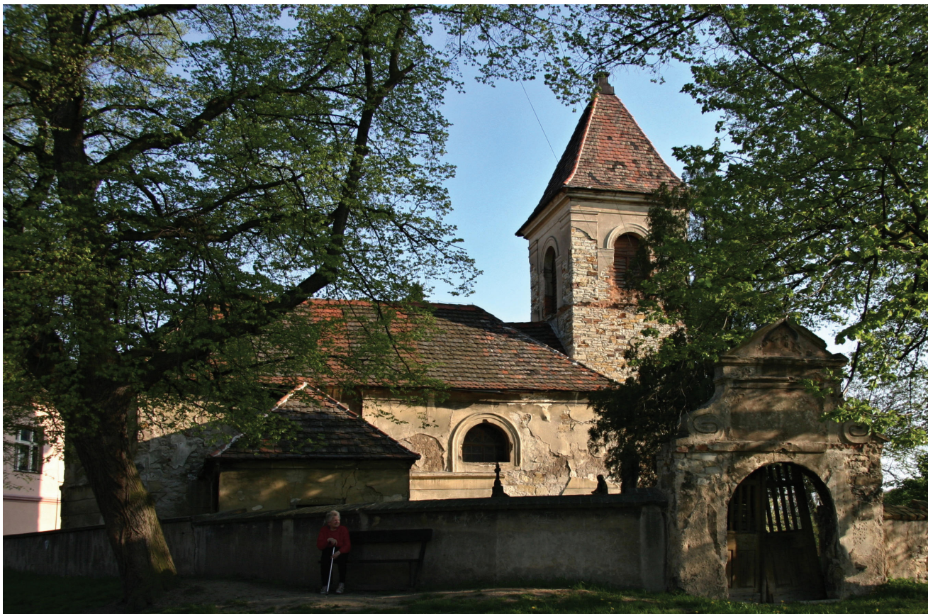
Obr. 1. Černěves, kostel sv. Prokopa, celkový pohled od severovýchodu.

V případě stavebních změn a historického vzhledu kostela sv. Prokopa v Černěvsi se dosavadní publikované stati omezovaly pouze na popis dochované architektury a vybavení s velmi stručnými poznámkami k historii, plynoucími z písemných pramenů. 1 Až v průběhu roku 2009 a 2010 při plánované opravě fasád kostela byly dosavadní poznatky rozšířeny o průzkum reliktů historických omítek, 2 jehož závěry byly vzápětí publikovány. 3 Následující objev druhotně užitých architektonických článků v severní části ohradní zdi hřbitova poskytl další rozšiřující informace k zaniklé podobě kostela. Nejvýraznějším objeveným prvkem byl profilovaný fragment ostění, jehož rozbor tvoří jádro tohoto příspěvku. 4