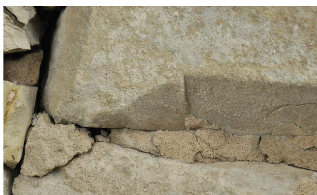
Obr. 5. Černěves, kostel sv. Prokopa, detail náběžního štítku profilace fragmentu ostění v ohradní zdi hřbitova.