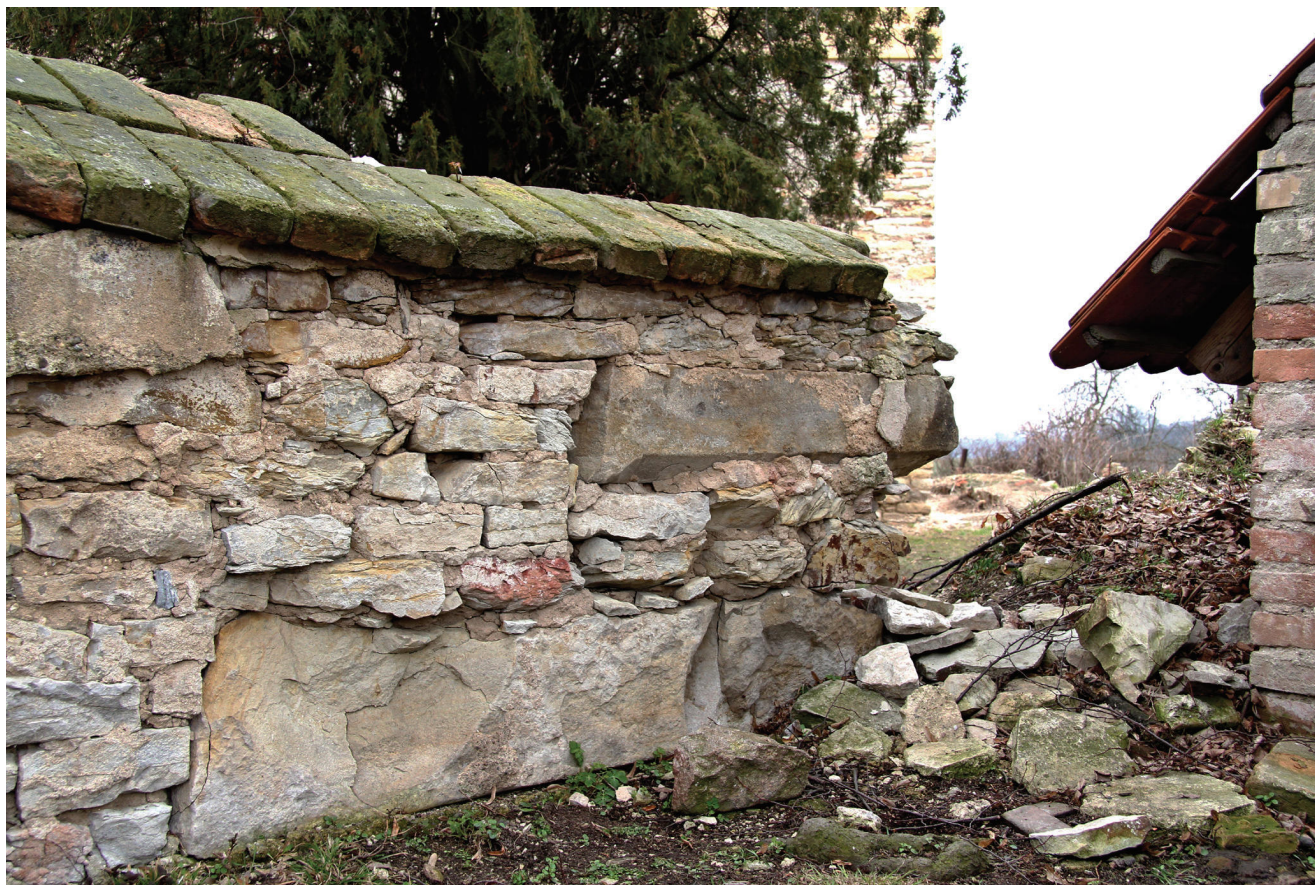
Obr. 2. Černěves, kostel sv. Prokopa, pohled na náleзовou situaci profilovaného fragmentu ostění v ohradní zdi hřbitova od severu.

na dvě části, kdy část s kostelem spadala přímo do majetku arcibiskupství, nicméně spravována byla z Roudnice nad Labem a zbývající část dále zůstávala pod správou kláštera v Doksanech. Roku 1454 došlo k zastavení doksanské části Zbyňkovi Zající z Házmburka, který ji spojil se statky v Klapém a Budyni nad Ohří. 8 Část s kostelem nadále zůstávala v majetku pražského arcibiskupství pod správou v Roudnici n. L., 9 odkud zřejmě vyšel i podnět k přestavbě snad již prostorově a konstrukčně nevhodného farního kostela. Během přestavby byl v první řadě přestavěn a zaklenut presbytář, který se do období 15. století hlásí především podobou klenby a profilem klenebních žeber.