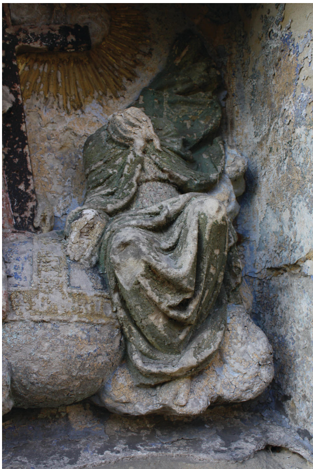
Obř. 2. Kaple Nejsvětější Trojice v Přední Lhotě u Těchlovic, detail reliéfu Nejsvětější Trojice, Bůh Otec, stav před restaurátorským zásahem, r. 2009, archiv NPÚ, ÚOP v Ústí nad Labem.