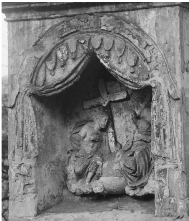
Obř. 4. Detail výklenku s reliéfem Nejsvětější Trojice na archivní fotografii z roku 1969, archiv NPÚ, ÚOP v Ústí nad Labem.