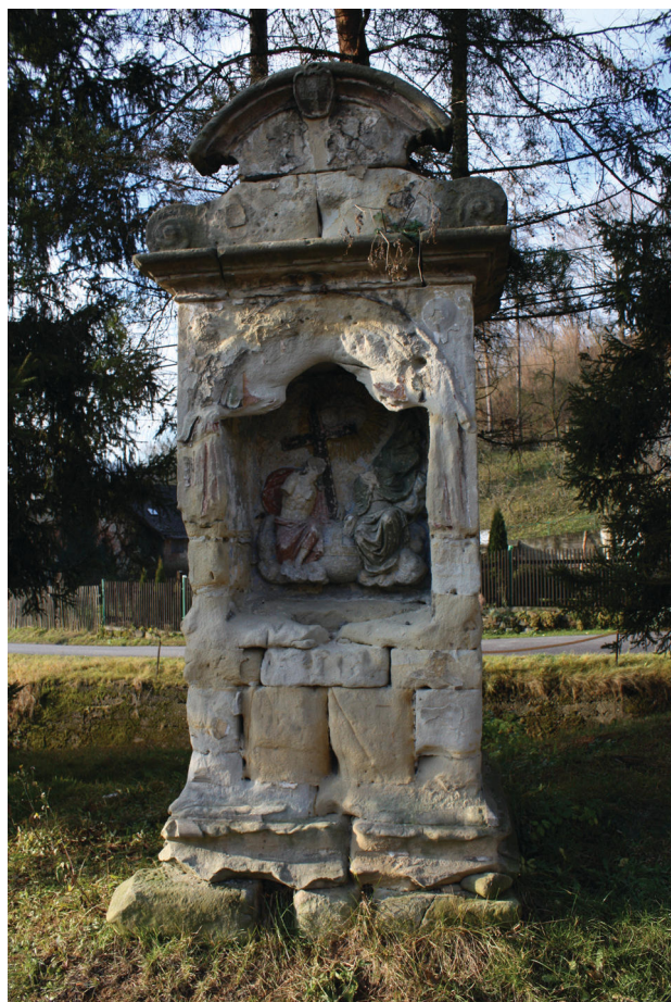
Obr. 1. Kaple Nejsvětější Trojice v Přední Lhotě u Těchlovic, celek, stav před restaurátorským zásahem, r. 2009, archiv NPÚ, ÚOP v Ústí nad Labem.

Osada Přední Lhota se nachází na pravém břehu Labe přibližně deset kilometrů jižně od Děčína a tvoří jedno ze čtyř katastrálních území obce Těchlovice. Nejstarší známé pojmenování obce jako Přední Lhota je datováno do roku 1543, ale počátky obce se kladou již do 1. pol. 12. století. Od roku 1624 je doložen název Dolní Lhota (Nieder Welhoten nebo Nieder Wellhotten). Nejvyššího počtu obyvatel dosáhla obec v roce 1930, kdy zde žilo 190 obyvatel včetně 17 Čechů. 1 V rámci církevní správy spadala Přední Lhota pod farnost v blízkých Těchlovicích.