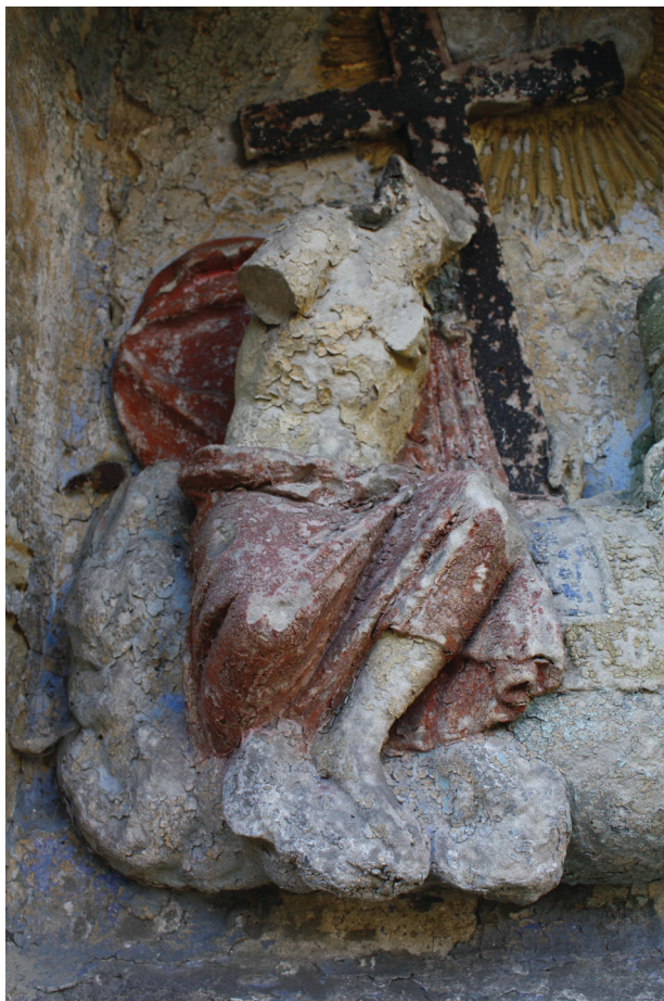
Obř. 3. Kaple Nejsvětější Trojice v Přední Lhotě u Těchlovic, detail reliéfu Nejsvětější Trojice, Ježíš Kristus, stav před restaurátorským zásahem, r. 2009, archiv NPÚ, ÚOP v Ústí nad Labem.

Na celém plášti kaple se nacházel poměrně velký počet nápisů. Pod nápisovou kartuší bylo uvedeno „Heiligste Dreifaltigkeit, in einiger Gott“; 6 pod tím „Erbarme dich unser“; 7 Na levé straně kaple bylo možné nalézt nápis: „Die Himmel erzählen die Herrlichkeit Gottes, und das Firmament verkündet seiner Hände Werke Ps. 5,2“; 8 zatímco na pravé straně „Drey sind, welche in der Himmel Zeugnis geben: Der Vater, das Wort, und der h. Geist 1 Joh. 5,7“; 9