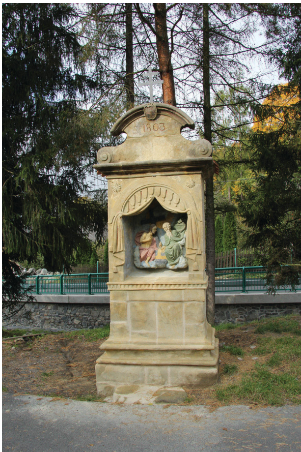
Obr. 6. Kaple Nejsvětější Trojice po restaurátorském zásahu, rok 2013.

zlacení plátkovým zlatem, bílé nátěry, červené nátěry a v nejmladší fázi opět bílé nátěry. Na reliéfu se ve velké míře dochovaly mnohé vrstvy polychromie, ovšem na baldachýnu a na architektuře kaple pouze torzálně. Po komparaci restaurátorského průzkumu a dochované kolorované historické pohlednice, která zachycuje zadní stranu kaple, je možné vyslovit hypotézu, že v určitém časovém úseku byla architektura kaple (případně i reliéfu) pojata v monochromní bílé úpravě.