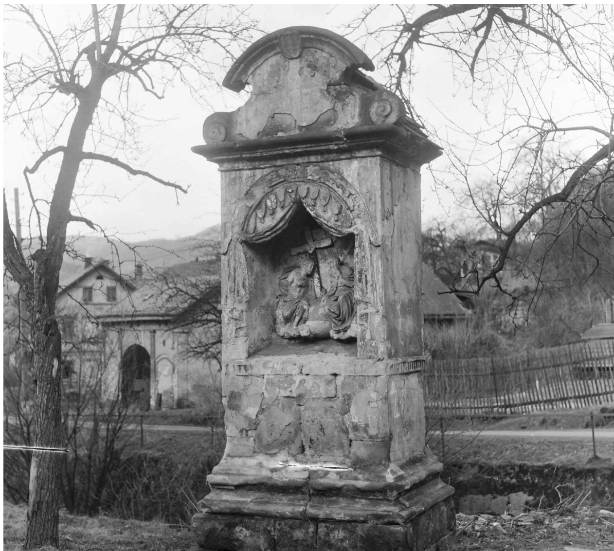
Obr. 5. Kaple Nejsvětější Trojice v roce 1969, archiv NPÚ, ÚOP v Ústí nad Labem.

do Ústředního seznamu kulturních památek České republiky. V této době byl již stav kaple havarijný. Povrch jemného labského pískovce, ze kterého byla kaple postavena, byl vlivem klimatických podmínek, vzliňající vlhkosti a vegetačního spadu blízko rostlých stromů silně degradován. Povrchová modelace se stala z velké části nečitelnou, zdobné reliéfní prvky pláště kaple jako baldachýn či obíhající ozubový pás téměř chyběly. Střešní krytina byla rozlámaná a silně znečištěná vegetačním spadem. Spárování pískovcových bloků bylo dožilé. Nacházela se zde i četná mechanická poškození v podobě olámaných hran a zejména chybějících částí reliéfu. Byly ulámany hlavy Ježíše Krista i Boha Otce, chyběly části rukou. Na reliéfu dochované silné vrstvy mnohočetné polychromie ztrácely soudržnost a odpadávaly stejně jako poslední zbývající fragmenty polychromie baldachýnu a barevných úprav pláště kaple. Na stěnách se nacházely pozůstatky cementových tmelů z dříve proběhlých oprav.