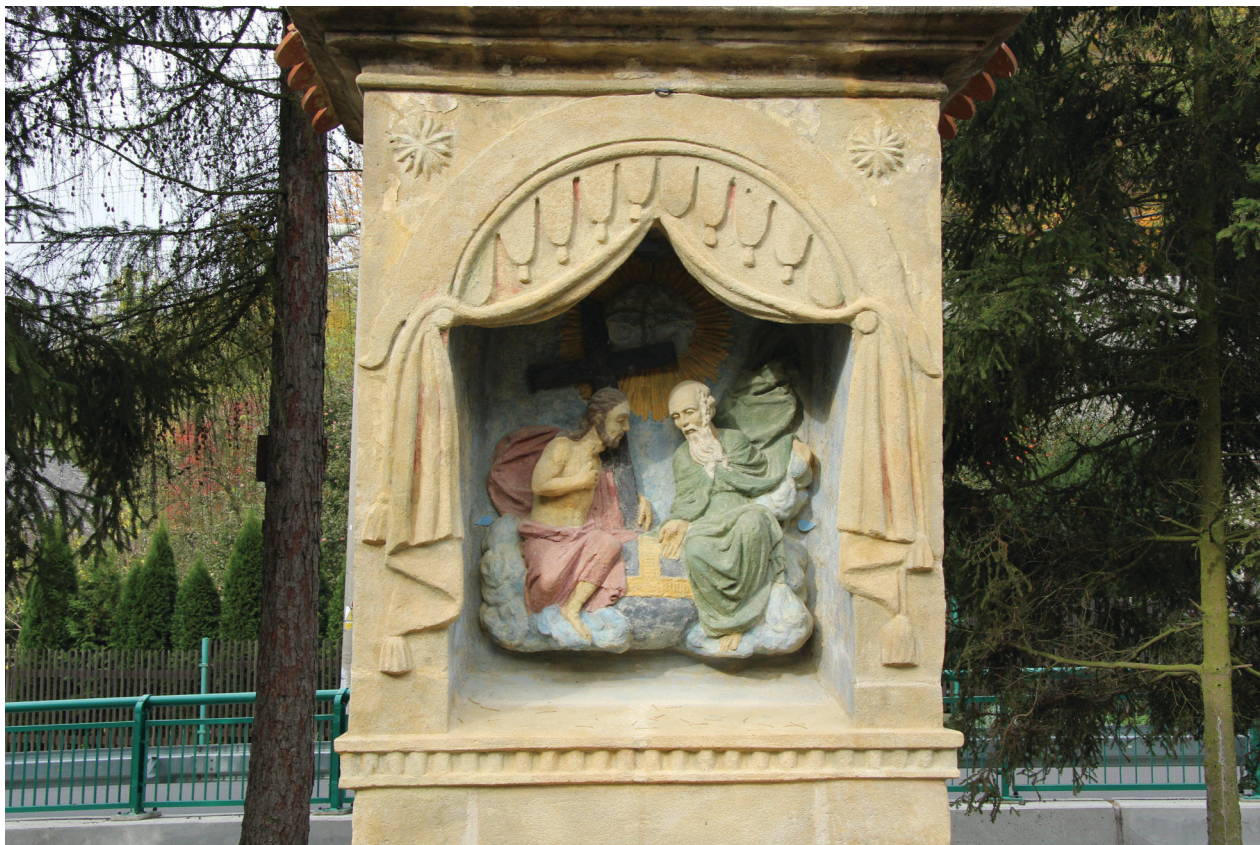
Obr. 8. Kaple Nejsvětější Trojice po provedení restaurátorského zásahu, rok 2013, detail výklenku s reliéfem Nejsvětější Trojice.

Po plastickém doplnění a barevné lazurní retuši reliéfu byl tento osazen zpět do výklenku. Po rekonstrukci zdobných prvků kaple, tmelení defektů kamene a doplnění spárování byly na závěr provedeny lokální barevné retuše pro vizuální sjednocení památky a lokální hydrofobizace dopadových ploch. Na vrchol kaple byl do původního otvoru osazen drobný kovaný latinský kříž a byl barevně zvýrazněn sekaný nápis ve vrcholové kartuši i vročení ve štítu kaple. 10