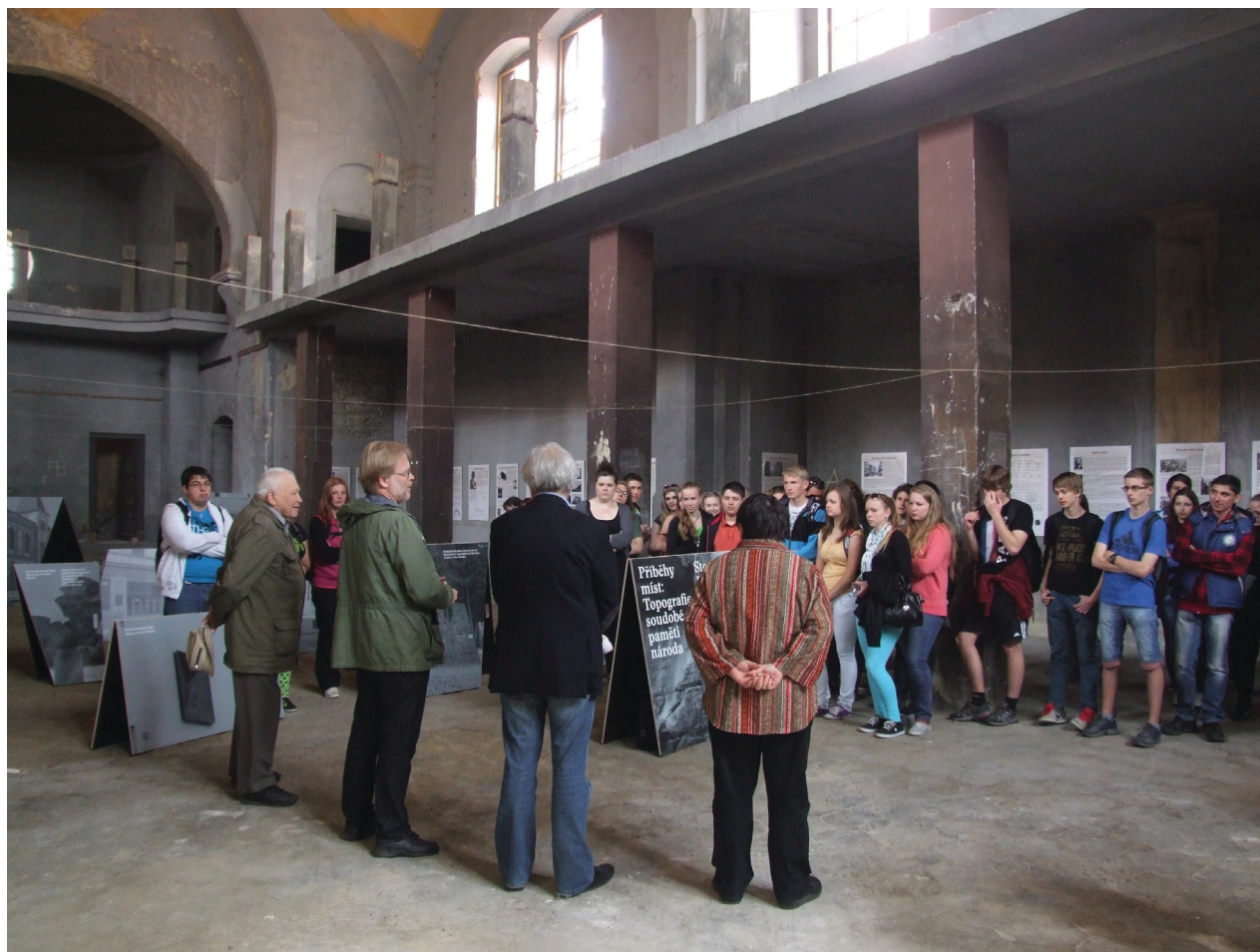
Obr. 2. Zahájení výstavy za účasti autorů a pamětníků tamtéž. Foto: autor, 2014.