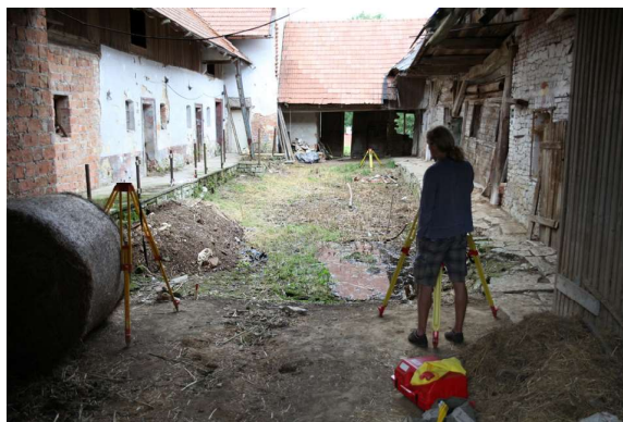
Obr. č. 3. Trstěnice č.p. 2, pohled do dvora JV branou. Foto: Jan Horák, 2015.