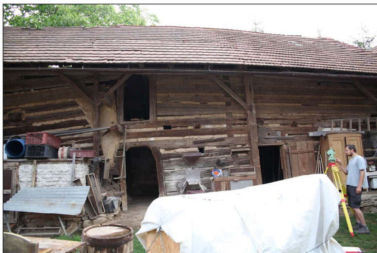
Obr. č. 1. Čistá č.p. 97, pohled na výměnek v SV části dvora.