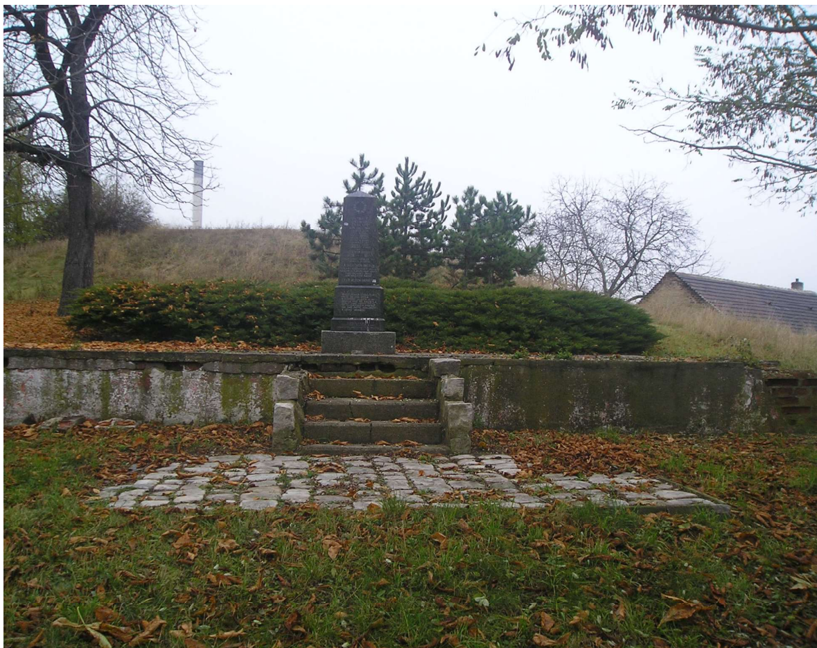
Obr. 6. Rudolice n. B., pomník obětem 2. světové války na místě kaple Navštívení P. Marie.

Sousední areál č. p. 7 (po přečíslování č. p. 12) byl v rozboru popsán jen jako nižší mladší objekt, který patřil včetně hospodářského zázemí zřejmě ke dvorci č. p. 8. Při podrobném průzkumu bylo potvrzeno, že hlavní budova je původně mlýn s částí renesančního obvodového zdiva, donedávna s jedinečně dochovanou vnitřní dispozicí vč. ojedinělých maleb ve vstupní síni a patrným zbytkem náhonu podél hlavní budovy. 9 Areál mlýna č. p. 12, vedený v Ústředním seznamu kulturních památek ČR pod č. rejstříku 44038/5-5344, se po odprodeji do soukromého vlastnictví dostal postupem doby do totálního havarijního stavu vylučujícího záchranu nejen jeho památkové podstaty, ale i zachování a obnovu původních stavebních konstrukcí. Vinou naprostého nezájmu střídajících se soukromých vlastníků o jeho využití a jejich různých finančních machinací připomínají památku jen zbytky obvodního zdiva. 11