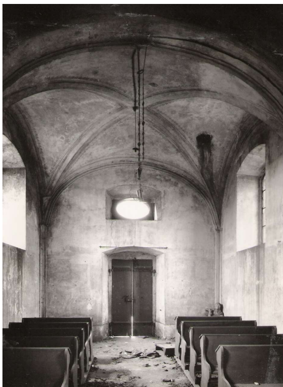
Obr. 5. Rudolice n. B., kaple Navštívení P. Marie, interiér – pohled ke vstupu v roce 1967.

Vzhledem k připravované rozsáhlé povrchové těžbě uhlí na území stávajícího Mostu bylo nutné uvolnit daný prostor nejen od všech objektů a technických zařízení, kilometrů různých druhů komunikací a inženýrských sítí, ale vybudovat nový dopravní koridor včetně mosteckého železničního a autobusového nádraží – vše s návazností na urbanistické řešení nového Mostu.