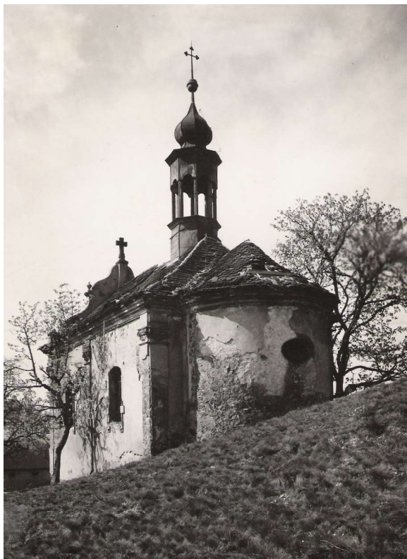
Obr. 2. Rudolice n. B., kaple Navštívení P. Marie, pohled od jihovýchodu v roce 1967.