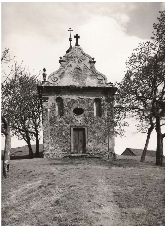
Obr. 3. Rudolice n. B., kaple Navštívení P. Marie, západní průčelí v roce 1967.

ke kraji Chebskému. V letech 1855 až 1868, kdy bylo zrušeno krajské zřízení, patřila pak obec do kraje Žateckého. Od roku 1850 Rudolice tvořily spolu s Obrnicemi a Střimicemi jednu politickou obec. Až do roku 1938 příslušely Rudolice k politickému okresu Most. V době okupace 1939–1945 byly od roku 1941 trvale administrativně připojeny k Mostu (Landratkreis Brůx), který byl součástí tzv. říšské sudetské župy (Reichsgau Sudetenland). Po osvobození v roce 1945 byl obnoven okres Most (od roku 1949 jako součást Ústeckého, poté Severočeského kraje) a do jeho obvodu patřily i Rudolice nad Bílinou. Vzhledem k novému poválečnému správnímu uspořádání byly v roce 1947 připojeny obce Kopisty s Konobříží a Pařidly, Rudolice nad Bílinou, Souš a Střimice jako osady k městu Mostu. 4