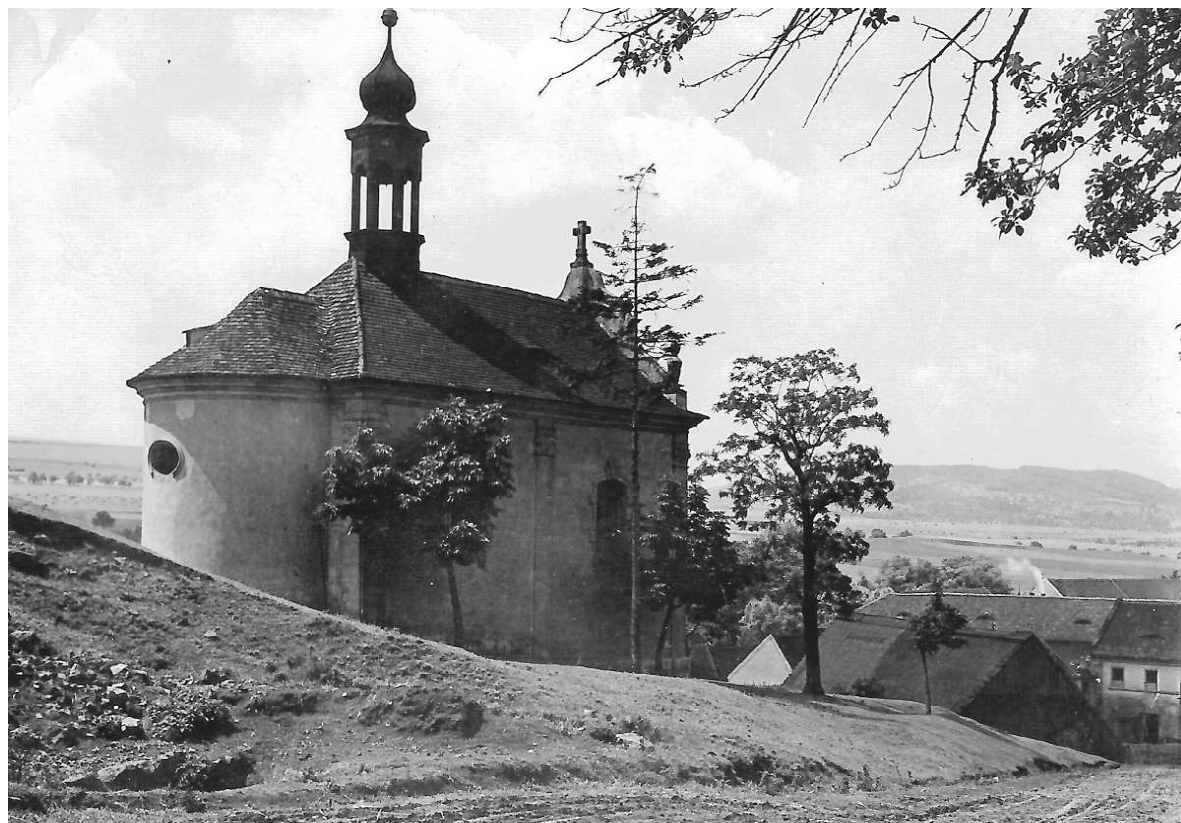
Obr. 1. Rudolice n. B., kaple Navštívení P. Marie, pohled od severovýchodu v roce 1925.

Rudolice nad Bílinou se nacházejí při řece Bílině v bezprostřední blízkosti města Mostu, od něhož je odděluje novodobá přeložka železniční trati z Ústí nad Labem do Chomutova.