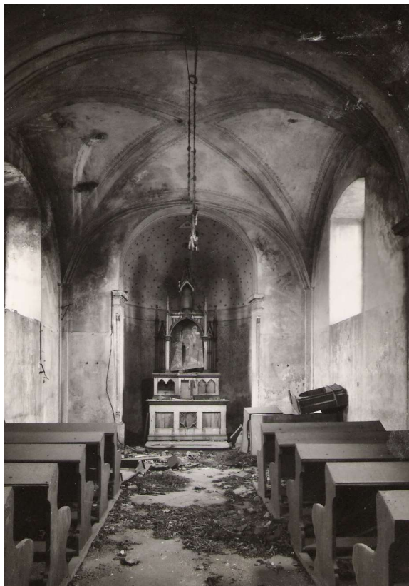
Obr. 4. Rudolice n. B., kaple Navštívení P. Marie, interiér – pohled k oltáři v roce 1967.