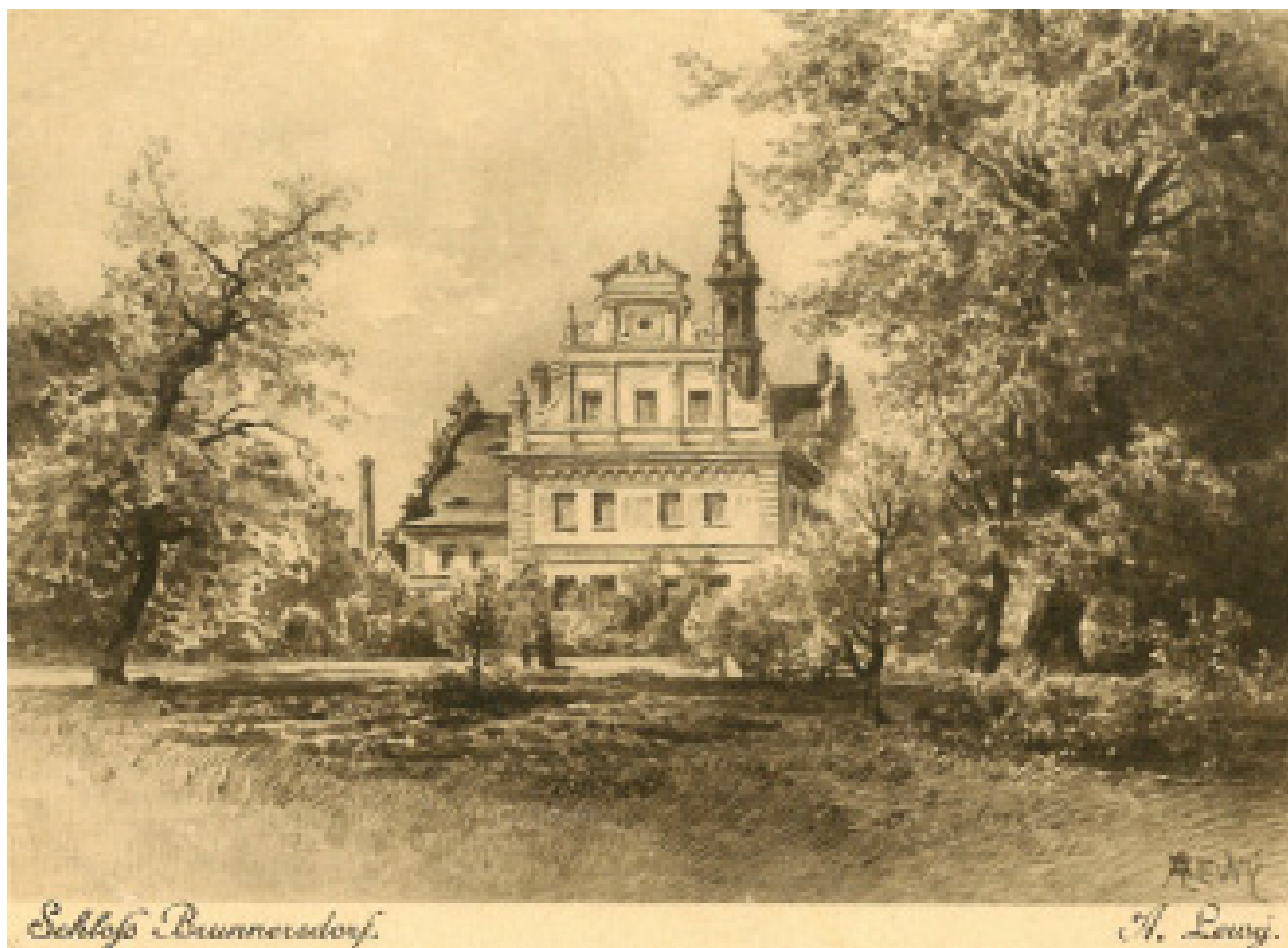
Obr. 2. Zámek Prunéřov. Pohled od jihu.

okresu, kde se již nacházely hnědouhelné doly, například již zmiňovaný důl Nástup. Počítalo se s velkým rozšířením těžby, na kterou měla v budoucnu navázat stavba uhelných elektráren. Z hlediska hospodářského tak odpadla problematika dovozu uhlí (hledisko krajiny a ekologických podmínek se nezohledňovalo). V době slučování okresů se již rozběhly první plánovací práce na stavbě od Prunéřova nepříliš vzdálené elektrárny Tušimice. Kromě ní, se plánovala i stavba elektrárny ve Vernéřově, který je od Prunéřova vzdálen necelé tři kilometry a kam se později přestěhovala velká část prunéřovských obyvatel. Z této stavby nakonec sešlo. Elektrárna se nepostavila ve Vernéřově, ale v západní části bouraného Prunéřova. 11