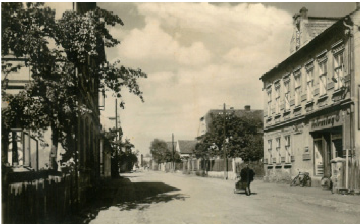
Obr. 3. Prunéřov v druhé polovině 50. let 20. století.

stup likvidační komise, která měla na starosti všechny záležitosti s tím spojené. A ještě v témže roce se rozběhlo vystěhovávání obyvatel a bourání opuštěných domů.