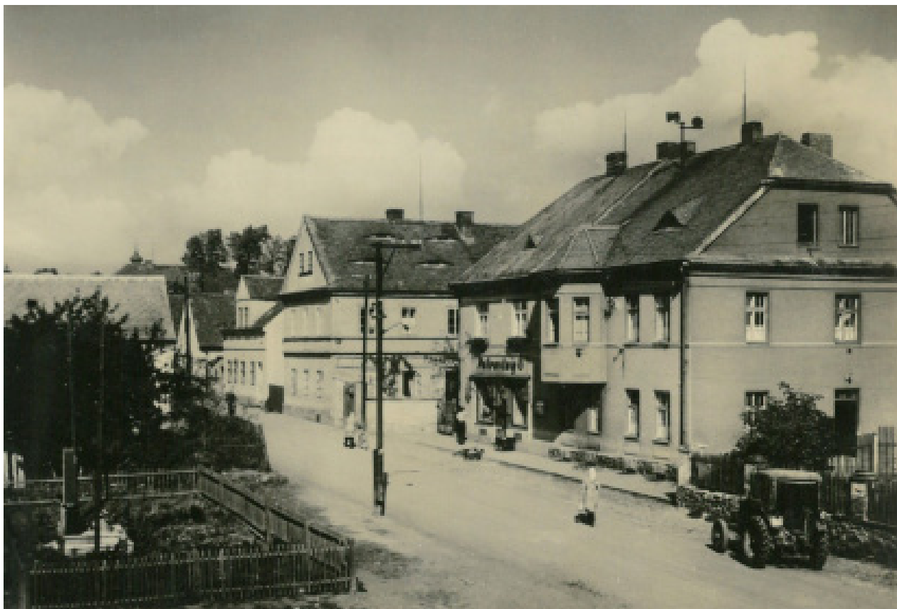
Obr. 4. Prunéřov na počátku 60. let 20. století. Sbírká pohlednic Oblastního muzea v Chomutově.

po Sametové revoluci bylo rozhodnuto, že elektrárny budou odsířeny a odkaliště již nebudou potřeba. 23 Původní obyvatelé Prunéřova se tedy museli opět stěhovat.