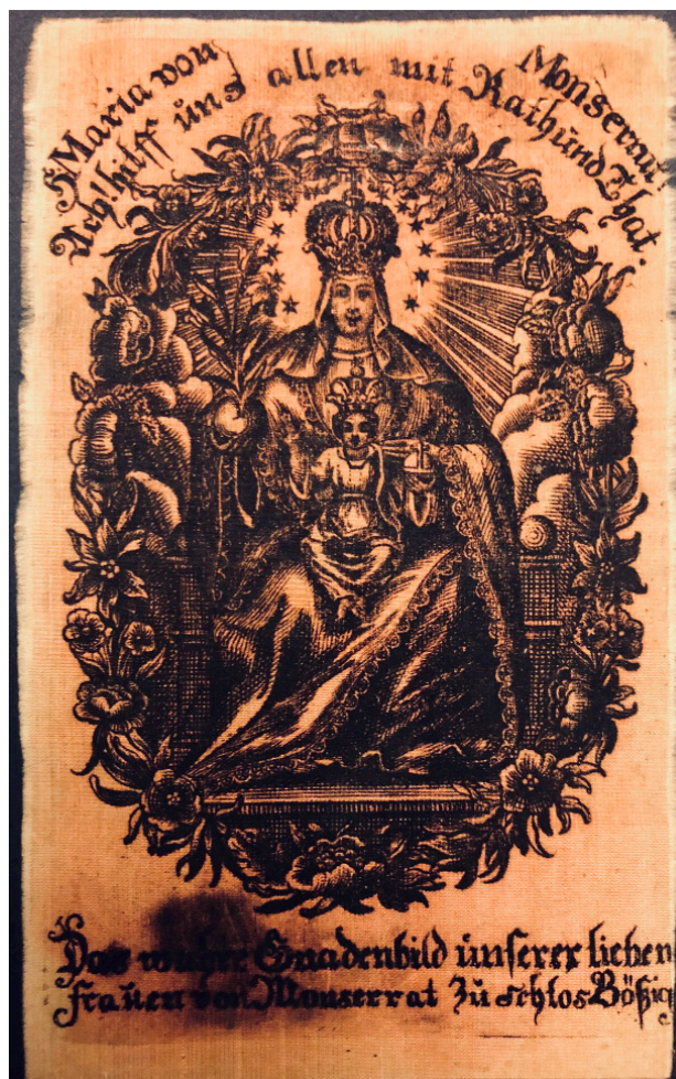
Obr. 7. Milostná socha Panny Marie Montserratské na Bezdězi, mědiryt na červeném hedvábí, pol. 18. stol., soukromá sbírka.