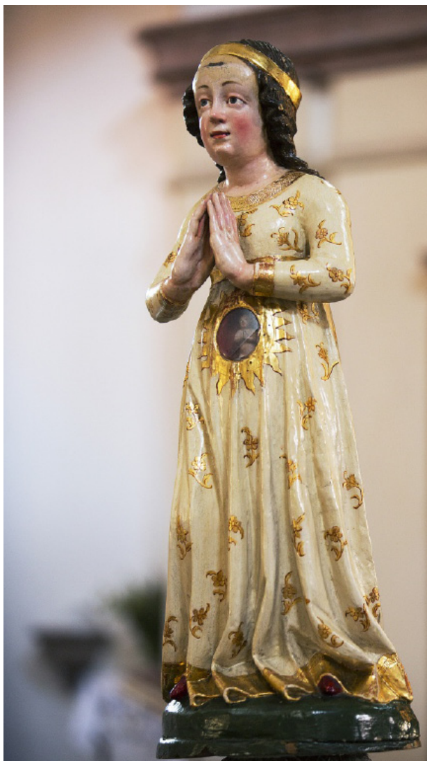
Obr. 11. Milostná socha Panny Marie z Horní Police, konec 15. století.