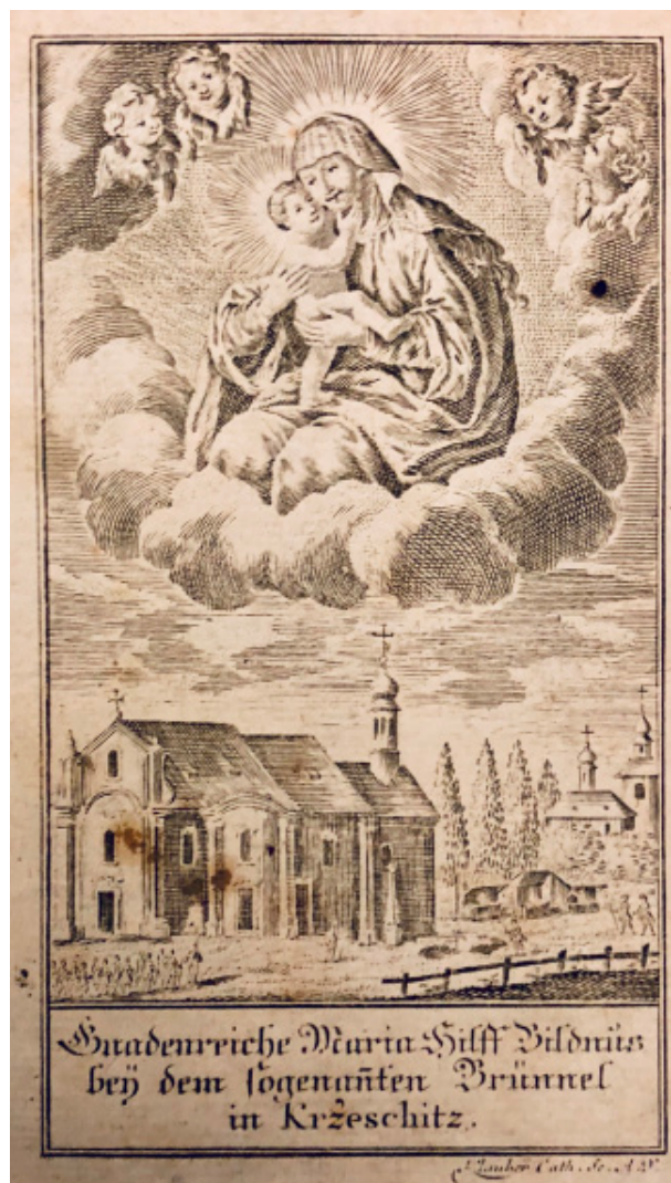
Obr. 2. Josef Klauber, Poutní kostel a milostný obraz Panny Marie Pomocné v Křešicích , mědiryt, pol. 18. stol., soukromá sbírka.

a obrazy byly účtě vystaveny na nákladných oltářích zvaných mariánské trůny. Ty nejnákladnější byly zhotoveny ze stříbra. V některých poutních kostelích byl originál milostné sochy či obrazu ukazován jenom o svátcích, ve všední dny byla na oltářích kopie. Tak tomu bylo například v Klatovech či ve Staré Boleslavi. V některých poutních kostelích (např. v polské Čenstochové) byly uctívané sochy či obrazy skryté zrakům věřících slavnostně odhalovány v určité denní hodině.