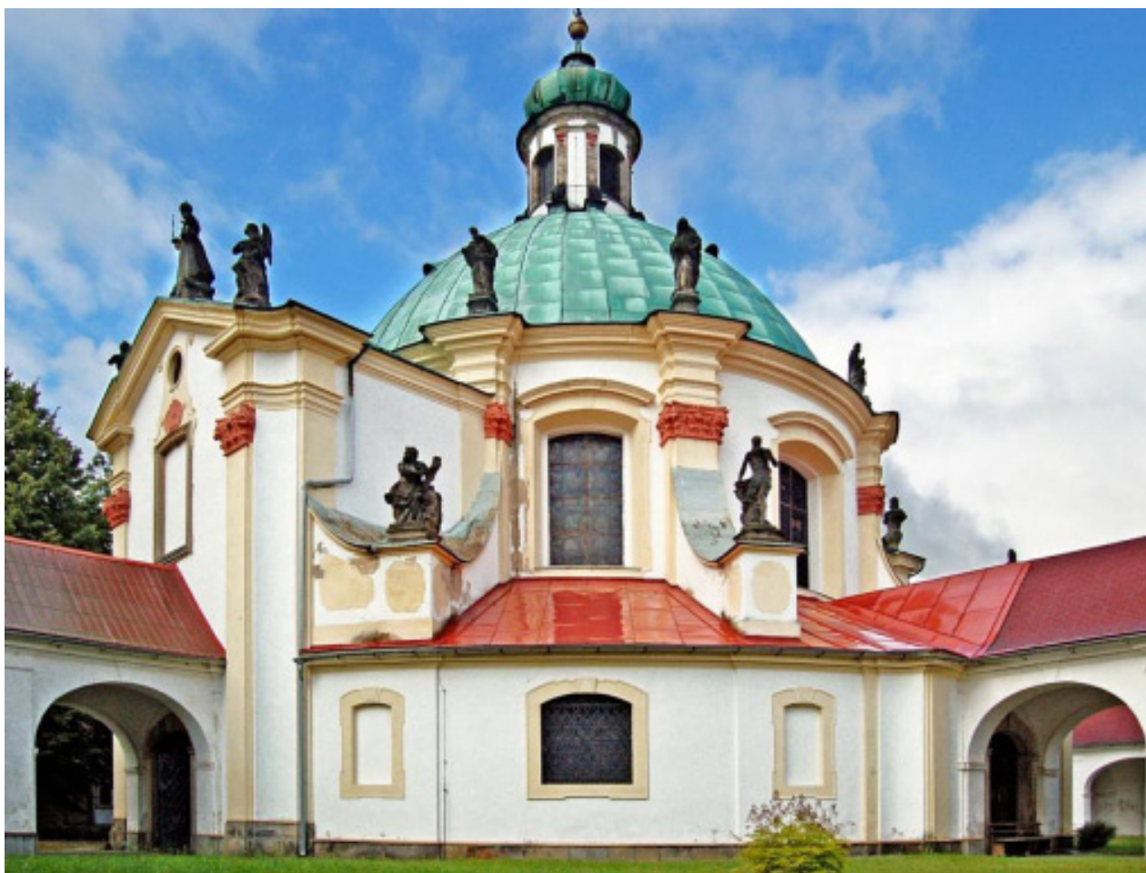
Obr. 8. Octavio Broggio, Poutní kaple Narození Panny Marie v České Kamenici.

kaple. V Relacích také nenalezneme zprávy z farností spravovaných biskupstvím v Litoměřicích.