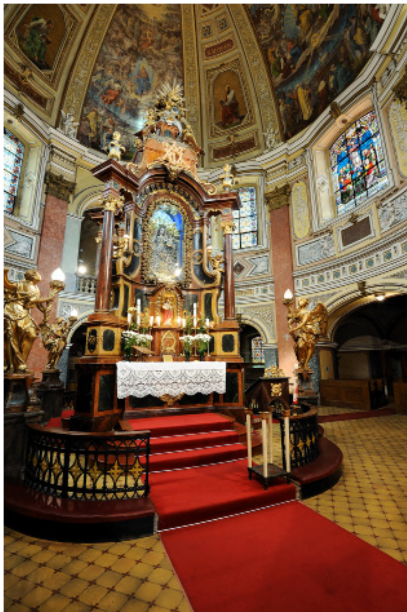
Obr. 9. Interiér poutní kaple Narození Panny Marie v České Kamenici.

půdorysu čtverce. Ve středech křídel ambitu jsou portály, od kterých vedou ke kapli arkádové chodby. Milostná socha je umístěna ve středu kaple v zasklené skříni.