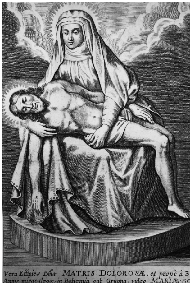
Obr. 5. Milostná Pietá z Bohosudov, mědiryt, 1. čtvrtina 18. století, soukromá sbírka.