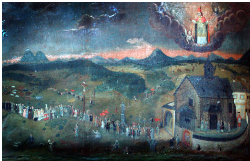
Obr. 4 Votivní obraz z kostela sv. Linharta v Hlavici, pol. 18. století.