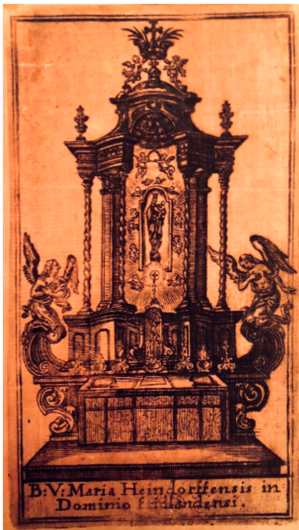
Obr. 6. Oltář s milostnou sochou Panny Marie Hejnické, mědiryt na červeném hedvábí, pol. 18. stol., soukromá sbírka.

dani. 30 Do Bohosudova roku 1515 putovalo bratrstvo z hornolužické Žitavy a král Ludvík Jagellonský věnoval do poutního kostela voskový votivní dar. 31 Prameny lze doložit i putě do Chlumu sv. Máří, jak dokládá listina z roku 1451, hovořící o „ein gemeiner lauff der pilgram“. 32 Dokladem chlumeckých poutí jsou také zprávy o votivních darech naturálních (sýry, slepice, ryby) i z vosku. 33 Středověkou úctou lze na základě zprávy o pouti žitavských měšťanů z roku 1506 prokázat ještě v Hejnicích, kde poutníci uctívali dodnes dochovanou milostnou