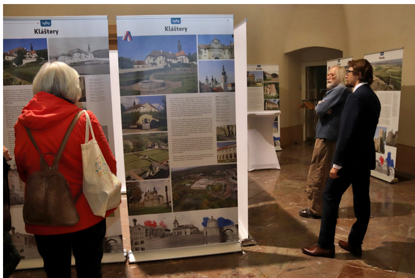
Obr. 2. Vernisáž proběhla v reprezentativním prostoru atria zámku v Krásném Březně.

Štefanové. Návštěvník výstavy je vtážen rovnou do prostředí různých typů památek a setkává se s jejich specifickými problémy. Na dvojici panelů si vždy může vytvořit ucelený obraz o dřívějším a dnešním stavu památkového fondu příslušného typu. Již záhy mu musí být jasné, jaký skok památková péče za těch třicet let udělala, a to nejen v metodické rovině, ale i svými výsledky. Vždyť se stačí projít centry Kadaně, Klášterce nad Ohří, Chomutova, Litoměřic, kochat se lidovou architekturou Děčínska či Úštěcka, navštívit alabastrový skvost v kostele při zámku v Krásném Březně a porovnat jejich stav před rokem 1989 se stavem nynějším. Prezentovány ale nejsou jen velké a známé práce, velký prostor je věnován i drobným, méně známým případům, protože pro památkáře není malých památek, a tak jsou důmyslně prezentovány i opravy drobných památek rozestých v krajině, neboť každá skrývá jedinečný příběh a spoluvtváří krajinný ráz a jeho poetickou malebnost.