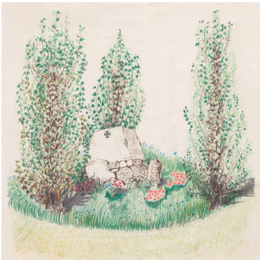
7) Návrh pomníku pro háj hrdinů v Bílíně, nesignováno, nedatováno (1916–1918).

měly nepochybně aktivizovat a posílit národní uvědomění jak české, tak německé strany. Příkladem těchto pozdních realizací jsou například pomníky v Kopistech (1937), Komořanech (1937), Ledvicích (1937), Vejprtech (1937) a Bohosudově (1938).