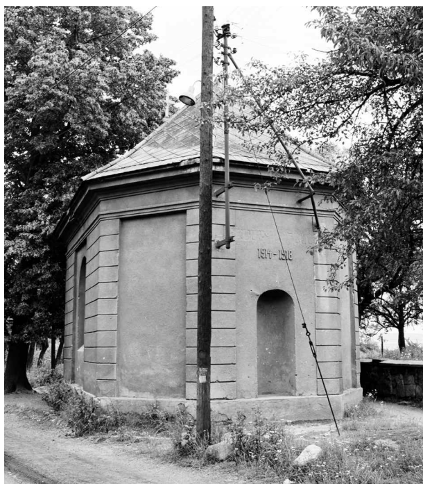
19) Válečná vzpomínková kaple v Kundraticích z roku 1929 po odstranění německých nápisů a sochy vojáka, nedatováno (před rokem 1974).

důslednější v městském prostředí než na venkově. Polská etnoložka Karolina Ćwiek-Rogalska na příkladu západočeské pohraniční oblasti uvádí, že častěji byly objektem agrese a demolic pomníky se sochami vojáků, které bylo snadné ztožnit s nepřáteli, tj. Němci, 63 zejména pokud tyto sochy byly