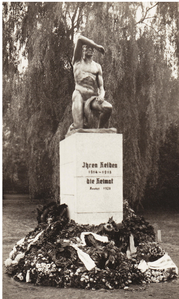
12) Zaniklý pomník padlým v Bílině od Hermanna Zettlitzera v den odhalení 16. září 1928.