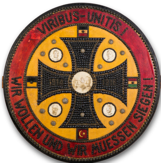
4) Štít pobíjený hřeby s motivem tlapatého kříže z roku 1916 ze sbírek Regionálního muzea v Teplicích. Foto: Marta Pavlíková, 2020.

u nás byla socha rytíře v Brně, 16 podobné sochy byly vztyčeny ale také v Praze, Chebu, Liberci, 17 Chomutově, 18 Litoměřicích a dalších městech. Vzhledem k materiálové podstatě wehrmannů a také kvůli jejich spojení s německou kulturou se do dnešních dnů dochovalo jen velmi málo těchto soch a předmětů, mezi nimi například teplický železný kříž 19 nebo štít pobíjený hřeby z Bíliny. 20