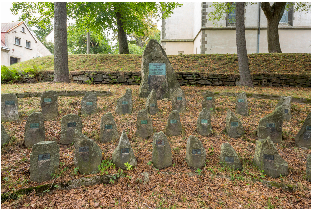
9) Pomník padlým v Novém Zvolání z roku 1924, 2019.

bývaly někdy seskupovány, obvykle po třech, do skupin komponovaných podle velikosti, takové, dnes již zaniklé, pomníky se nacházely například v Prunéřově (1926), Měděnci (1927) nebo Radonicích (1925) na Chomutovsku. Méně obvyklé je seskupení tří přírodních kamenných stél na způsob kamenného stolu či přístřešku evokujícího prehistorické dolmeny. Takto pojednané pomníky vytvořila pro obce Kralupy (1935) a Místo (1927) kamenická firma Emil Gelinek z Chomutova. Tento prvek z „šedého dávnověku“ 41 má své zahraniční paralely a býval označován výrazem hünengrab – obří hrob. 42 Zcela specifické jsou válečné památníky provedené z většího množství menších kamenů seřazených do půlkruhu často v několika řadách, kde každý kámen symbolizoval jednoho padlého a byl opatřen nápisovou tabulkou. Takto řešený pomník byl odhalen v Novém Zvolání na Chomutovsku v dubnu 1924, 43 obdobně řešené pomníky ale najdeme také v Zahradách a v Novém Hraběcí (1922) na Děčínsku.