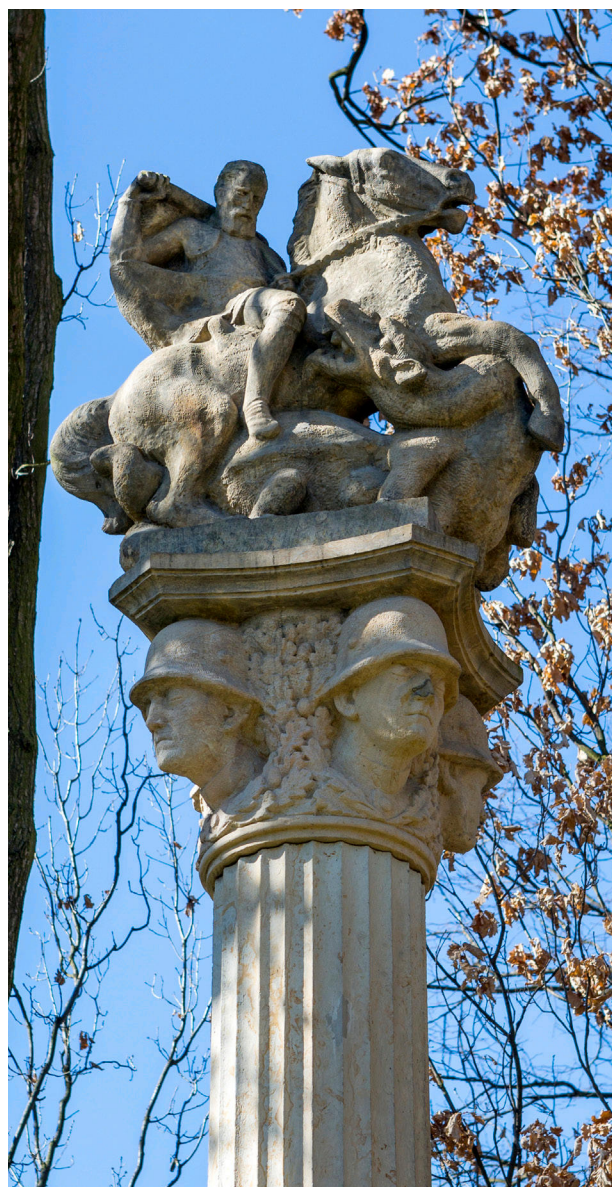
15) Detail hlavice sloupu se sochou sv. Jiří z pomníku padlým v Teplicích z roku 1929 od sochaře Johannese Watzala, 2017.

boly lze zjednodušeně kvalifikovat jako likvidaci, adaptaci a ignoraci. Likvidační proces probíhal živelně i organizovaně od prvních mírových dnů roku 1945, z veřejného prostoru však nebyly odstraňovány jen válečné pomníky, ale památky německého charakteru obecně. Násilně byl zdemolován například pomník v Dubí (1933), kde byla soše vojáka sražena hlava a zdemolované části pomníku včetně soklu byly následně zakopány na různých místech. 52 Monumentální pomník v Lubenci (1923) na Lounsku byl rozstřílen postupujícími ruskými vojsky 53 a v roce 1947 nahrazen pomníkem Rudé armády. Obdobné převrstvení historické paměti proběhlo také