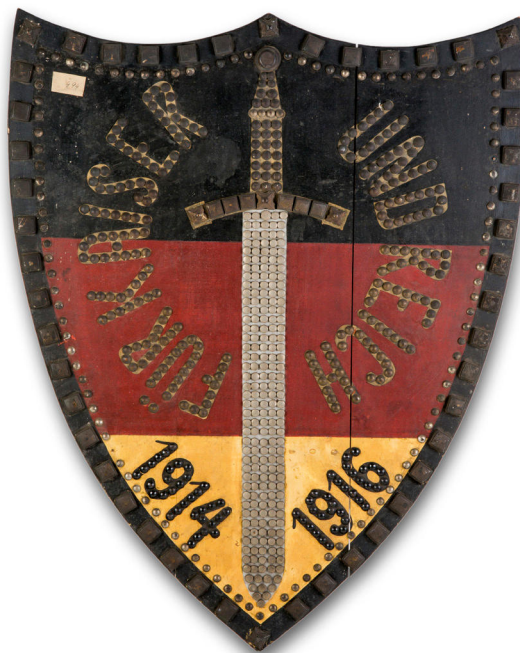
5) Štít ze Světce pobíjený hřeby s motivem meče z roku 1916 ze sbírek Regionálního muzea v Teplicích.