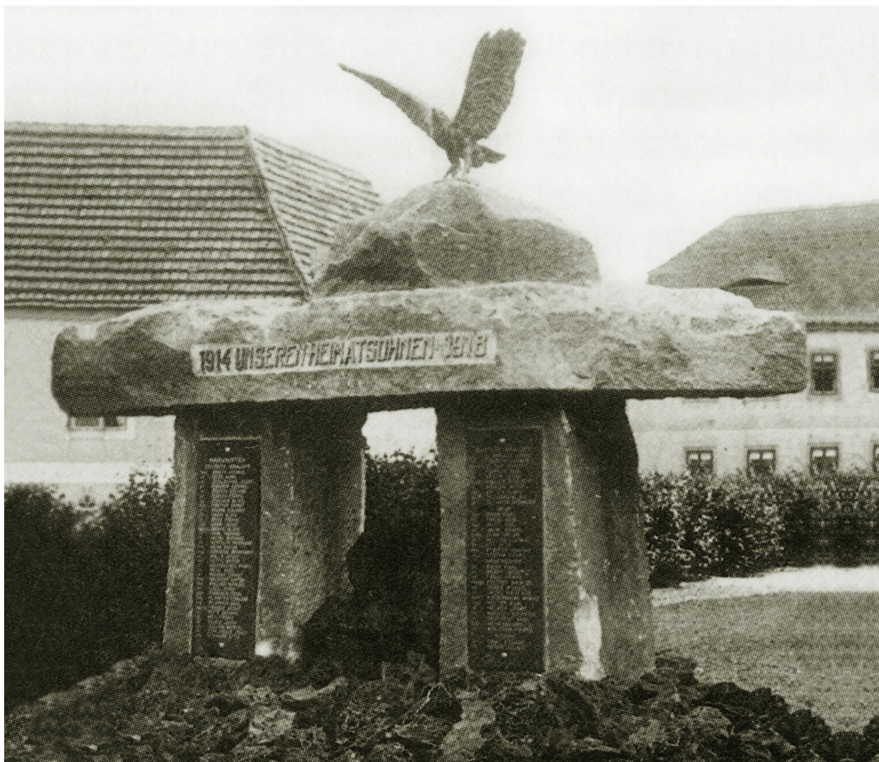
8) Zaniklý pomník padlým v Kralupech z roku 1935, nedatováno (40. léta 20. století).

Obvyklými tvůrci a dodavateli těchto drobných memoriálních staveb byly především lokální kamenosochařské firmy, jejichž tvorba svým významem nepřesáhla hranice regionu. Tito kameníci a kamenické firmy pracovali většinou podle osvědčených vzorů a své úspěšné práce opakovaně replikovali na různých místech. Pouze menší segment pomníkové produkce, typicky vázaný na městské prostředí, vznikl za účasti odborně školených autorů, akademických sochařů nebo architektů, ale i u nich se lze setkat s duplikací vlastních návrhů. S ohledem na národnostní složení se na sledovaném území setkáme především s díly autorů německého původu jako například Johanna Adolfa Mayerla, Johannese Watzala, Wilhelma Weisse, Oswalda Hofmanna, Hermanna Zettlitzera nebo Friedricha Rolanda Watzka. 36