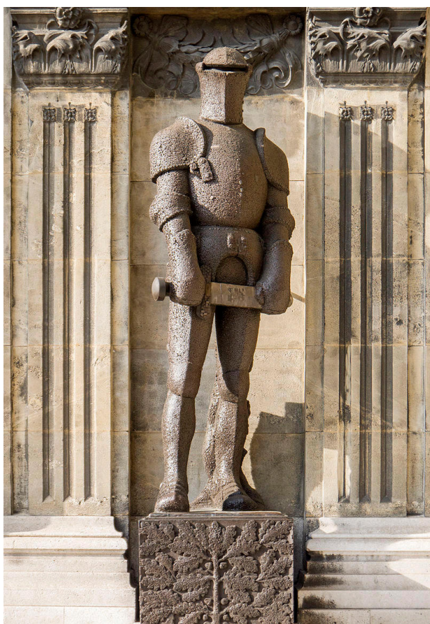
3) Socha železného rytíře ( Wehrmann in Eisen ) ve Vídni z roku 1914 od Josefa Müllnera, 2019. Foto: Marta Pavlíková, 2019.

zaniklých staveb), které vznikly v letech 1915–1938. Většinu z těchto realizací lze na základě použitých symbolů, jazyka nápisů nebo okolností jejich vzniku zařadit do skupiny německých pomníků. Menší část objektů nebylo možné jasně identifikovat, jedná se například o torza pomníků bez nápisů nebo pomníky, ke kterým se nepodařilo dohledat bližší informace o jejich vzniku. Nejméně je na sledovaném území zastoupena skupina ryze českých pomníků 7 a pomníků smíšených, tedy prokazatelně vzniklých česko-německou spoluprací. 8