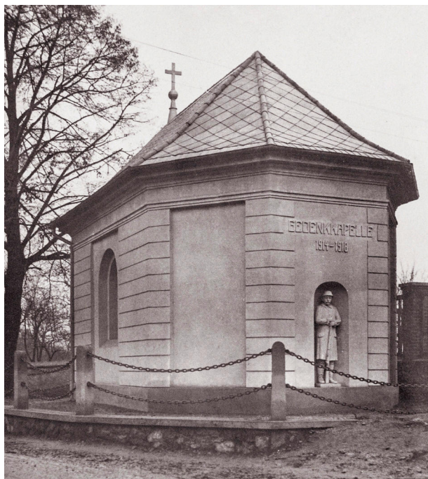
18) Válečná vzpomínková kaple v Kundraticích z roku 1929 krátce po svém dokončení, nedatováno (po roce 1929).