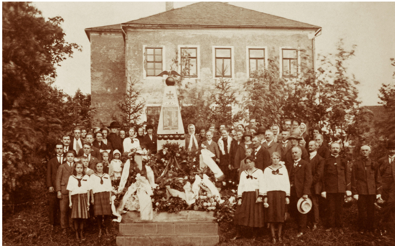
1) Slavnostní odhalení dnes zaniklého pomníku padlým v Kotlině, nedatováno (1919–1938).

Zájem o studium památek spojených s velkou válkou a její vzpomínkovou kulturou zažívá od nedávného stého jubilea konce války značné oživení. V rámci velmi bohatého souboru pomníků, památníků a dalších memoriálních staveb dochovaných na našem území, představují pomníky českých Němců ryze specifický segment, který dosud nebyl podroben hlubšímu výzkumu. Jeho problematice se věnovaly zatím jen dílčí studie, 1 syntetické zpracování tohoto tématu zatím provedeno nebylo. Více než zájmu domácí odborné veřejnosti byly tyto památky předmětem studia zahraničních badatelů. 2