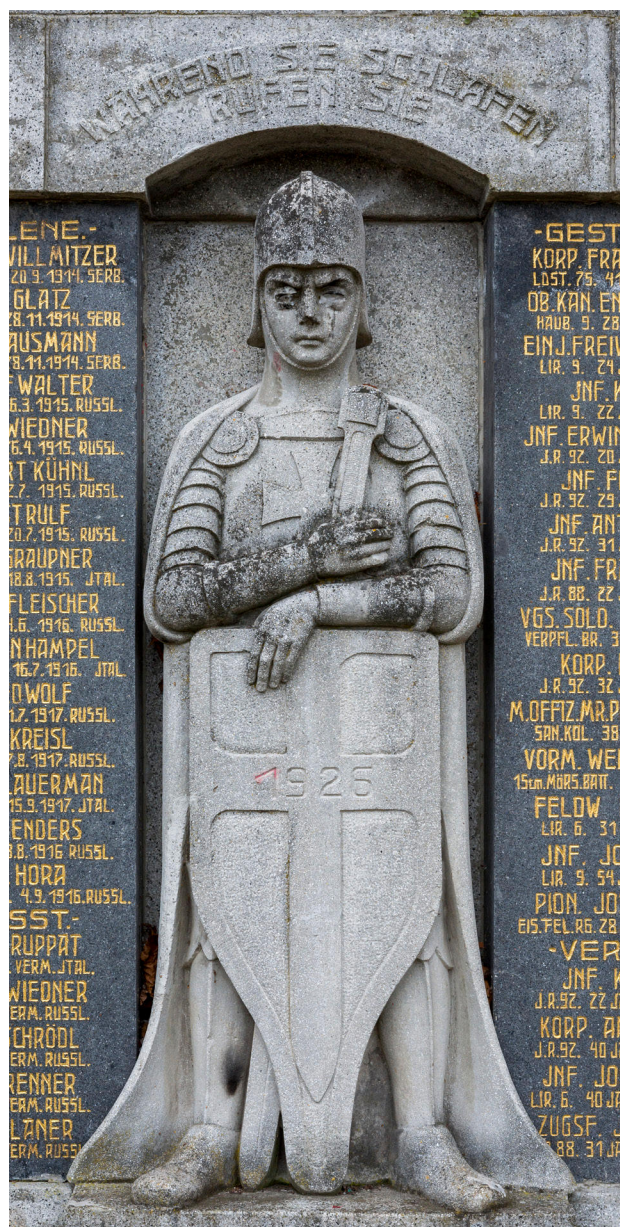
14) Socha rytíře z pomníku padlým ve Vilémově z roku 1926 od firmy Bratři Starkové, 2018.

jako například ve Vilémově, nebo mohl být pomník doplněn malými kříži z březových větví zastupujícími jednotlivé padlé, jak se tomu stalo v Šumné (1926) a Kyjicích (1925). Velmi záhy však začal existenci válečných pomníků ohrožovat sběr barevných kovů pro válečné účely. Již na sklonku roku 1942 byla z pomníku v Mostě sejmuta bronzová plastika válečníka a patrně roztavena. 51 Podobný osud měl postihnout také plastiku lva z pomníku v Žatci, kterou se však podařilo místním skrýt a dochovala se do současnosti. Zásadně nová situace však nastává v roce 1945, kdy komunita, která pomníky stavěla a pro kterou byly určeny, byla vysídlena.