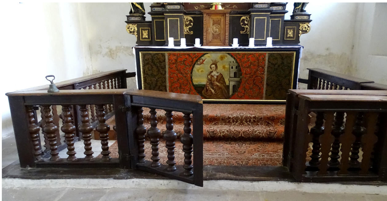
11) Zahrádky, kostel sv. Barbory, detail chórové mřížky a antependia hlavního oltáře.

barokní řečniště pročleněné zahluubenými plochami lemovanými zlacenými zalamovanými lištami a podepřené obdobně pojatým dřevěným hranolovým sloupkem s kamennou patkou s ustupující profilací v horní části ( obr. 12 ). Povrch je dnes opatřen mladším šedobílým nátěrem, pod kterým prosvítá v místech poškození jednoduché šedavé mramorování, bez výzdoby. Raně barokní původ z poslední třetiny 17. století prozrazuje i kování vstupních dveří.