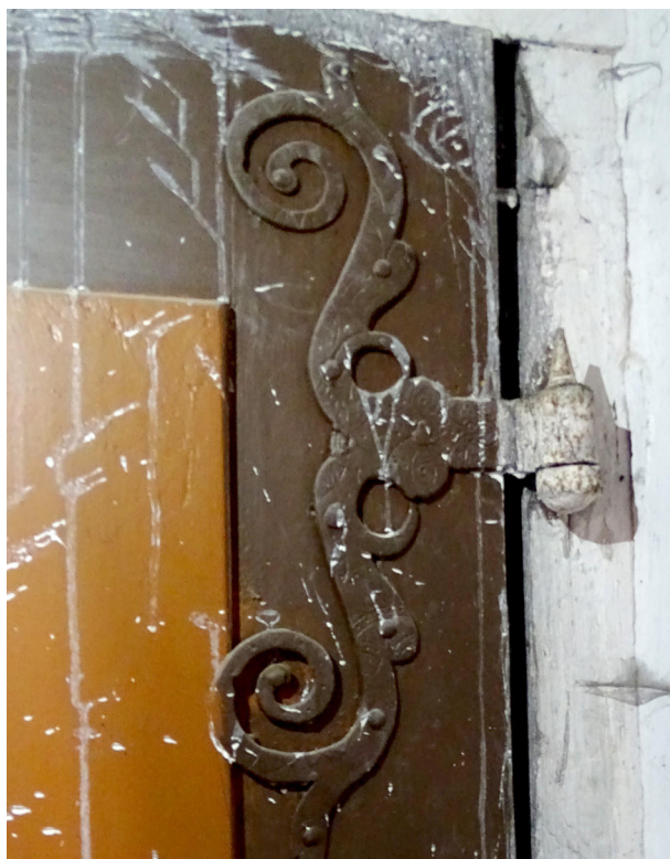
7) Zahrádky, kostel sv. Barbory, interiér, detail kování dveří do oratoře.

obdobných prací na věži). 16 Dílčí úpravy byly provedeny také kolem roku 1836, jak dokládají dílčí úpravy krovu s datacemi ve štítu. Architektura kostela v rámci typologie venkovských kostelů tohoto období dle Rostislava Šváchy souvisí již s obdobím, kdy prvotní posttridentskou střídmost a prostotu těchto staveb vystřídal dekorativnější planimetrismus, byť ze tří jím prezentovaných typů se pouze částečně blíží typu sálu s přízvedními pilíři, avšak s nezaklenutou lodí, zastropenou plochým stropem s fabionem, včetně bočních kaplí připomínajících od 80. let 17. století se uplatňující mělký transept. 17 K presbytáři kostela pak byla roku 1803 připojena střízlivá přístavba kounicovské hrobky.