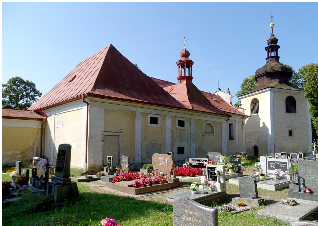
1) Zahradky, kostel sv. Barbory, exteriér, celkový pohled od severovýchodu. Foto: Vít Honys, 2021.

Areál hřbitovního kostela sv. Barbory se zvonicí se nachází na osamocené terénní ostrožně dostupné od severu přístupovým schodištěm s dvojicí soch jižně od současné zástavby obce Zahradky, s níž je spojen komunikací vroubenou alejí. Ta ovšem doplnila starší „valdštejnskou alej“ spojující zámek s bažantnicí až v klasicistním období roku 1799. 1 Takto, s alejí, jej od severu zachycuje v zadním plánu své kolorované veduty Zahrádek s areálem zámku z roku 1818 Jan Antonín Venuto. 2