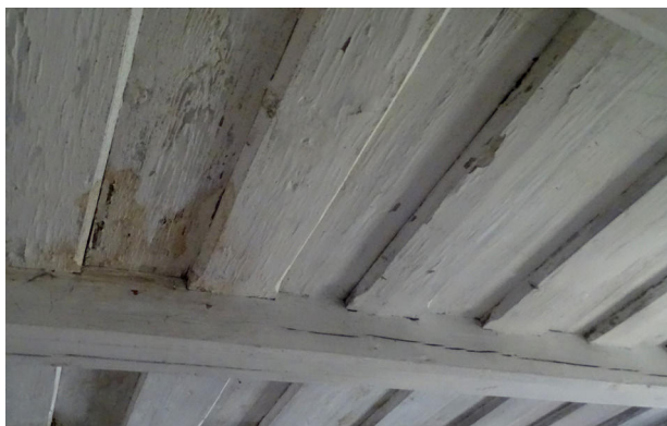
6) Zahrádky, kostel sv. Barbory, interiér, záklopový strop oratoře.

že oratoř byla k presbytáři přistavěna později, snad společně s bočními kaplemi.