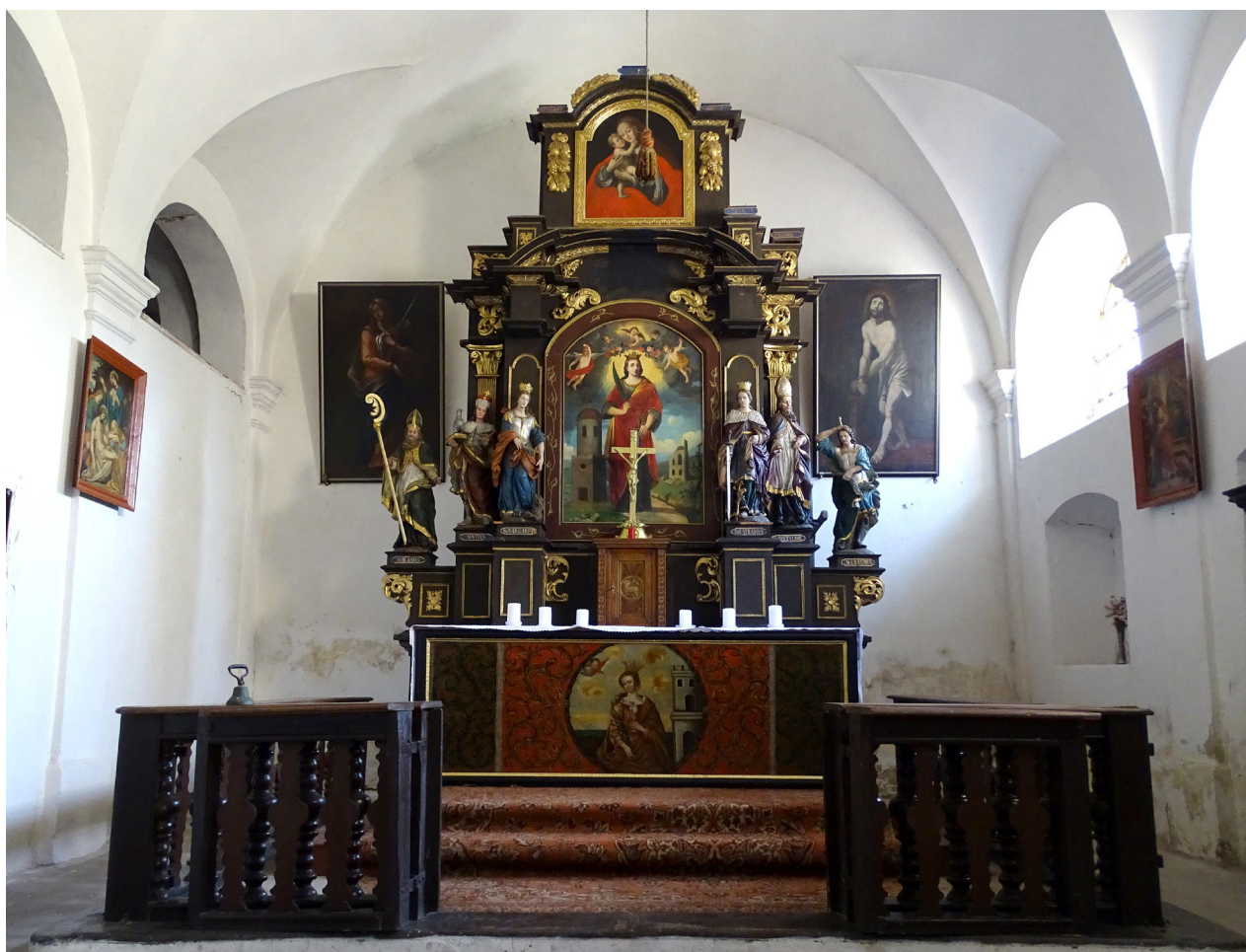
9) Zahradky, kostel sv. Barbory, interiér presbytáře s hlavním oltářem.

na plátně malované antependium. V jeho středu je v kruhovém medailonu znázorněna na oblačném pozadí polopostava sv. Barbory s korunkou na hlavě, kalichem přidržovaným levou rukou před hrudí a s atributem věže po straně. Zbývající plochu vyplňují akantové rozviliny na červeném a hnědém pozadí, které společně se stylem poněkud rustikalizované ústřední malby naznačují vznik antependia v období počátků raného baroka, tedy ve starší fázi existence hlavního oltáře ještě před vznikem stávajícího oltářního retabula někdy po roce 1652 (obr. 9, 10). 19 Dekorativní malba se však nachází i na rubové straně dřevěného obvodového rámu. 20 V nástavci nad segmentově vyklenutým frontonem je vsazen původní obraz Panny Marie Pomocné – Pasovské vroubený pilastry zdobenými zlacenými reliéfními girlandami. 21 Na uprázdněných postranních soklech a bočních konzolách je umístěno