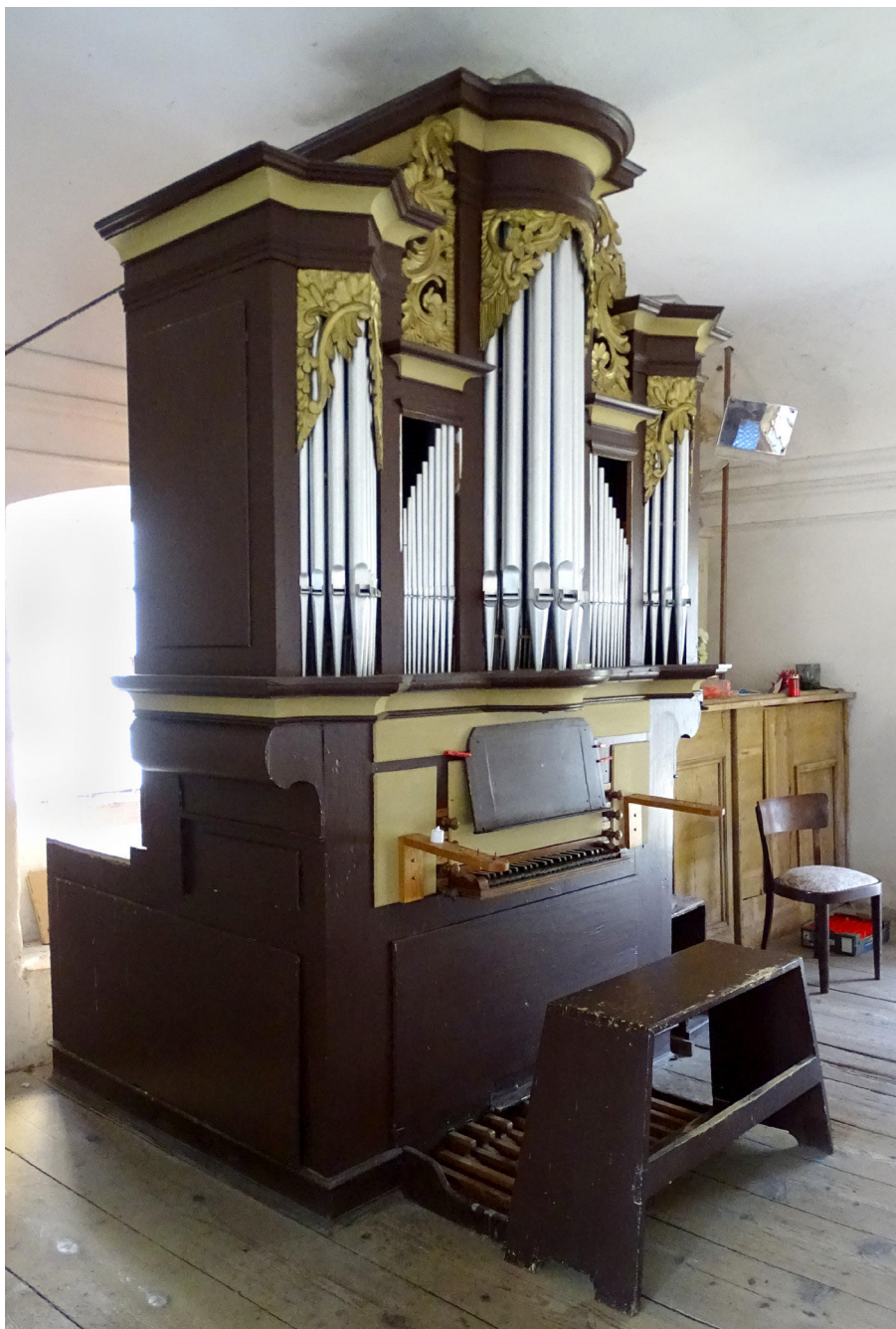
14) Zahrádky, kostel sv. Barbory, interiér, prospekt varhan.