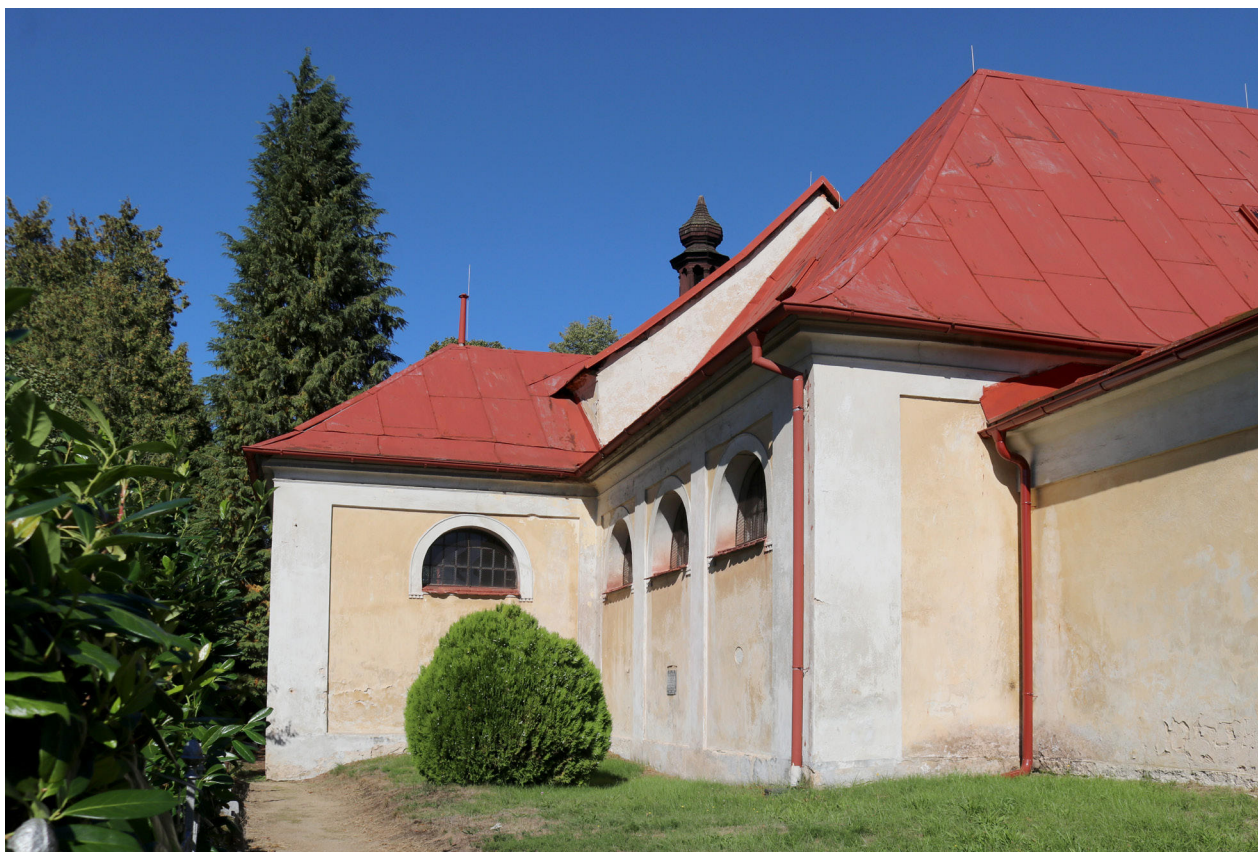
4) Zahradky, kostel sv. Barbory, exteriér od JV.

režných pilířků s užšími vyzděnými omítanými poli. Pískovcový kvádr v západní části zdi poblíž zvonice nese zvětrávající leto-počet (1)587, obdobný kvádr při severním nároží západní části zdi obsahuje v zahloubeném poli nápis ERWEITERT/ Anno 1837// lemovaný reliéfními snítkami s květy. Hlavní brána vymezená dvěma vysokými pilíři z pískovcových bloků završenými hlavicí a s novodobými vraty se nachází v západní straně zdi přímo proti hlavnímu vstupu do kostela. Další vjezdová brána obdobného provedení se nachází ve východní části zdi. Náhrobky v ploše hřbitova jsou vesměs novodobé, jen v jihovýchodní části hřbitova se nachází kovovým plůtkem ohrazená hrobka s postranními náhrobními stélami s eklektickými, převážně novobaročními prvky, o které se opírá socha lkající ženy.