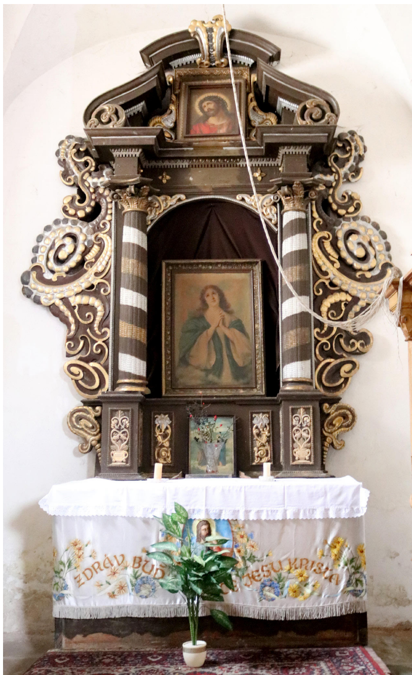
13) Zahrádky, kostel sv. Barbory, interiér, boční oltář v severní kapli. Foto: Kamil Podroužek, 2021.

na půdorysu trojbokém, propojenými se střední věží nižšími plochými mezitravé. Řezbářskou výzdobu nástroje tvoří dnes bronzované rokokové řezby nad ústími píšťal a nad mezitravé. Nad ústími píšťal mezitravé bohužel již chybí a je nepochybné, že již dlouhodobě chybí po stranách prospektu i dobově obvyklé křídlové řezby, které již nezachycuje žádná dochovaná historická fotodokumentace. Pozorný pohled však odhalí i další dodatečnou úpravu, totiž netradiční situování prospektových píšťalnic již v horní úrovni profilace spodní prospektové římsy bez návazného vlysu kryjícího ucpávky ventilové komory manuálové vzdušnice. Ty jsou zde netradičně dostupné vyjímatelným dřevěným krytem až bezprostředně pod římsou. Toto řešení se nevyskytuje u žádného z dochovaných nástrojů J. Rusche, ani jiných dobových nástrojů a je