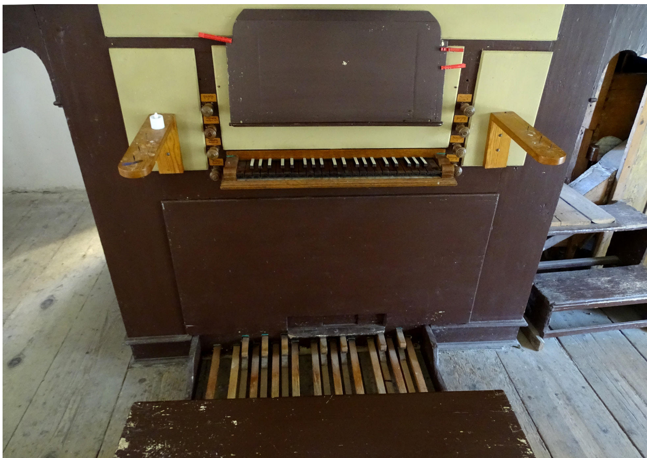
15) Zahrádky, kostel sv. Barbory, hrací stůl varhan.

zvonice), dokončovanou do podoby dnešního barokního vzhledu ve více fázích období druhé poloviny 17. až počátku 18. století. Významná z hlediska souvislostí je skutečnost, že v tomto stylu vznikala v době, kdy okolní, poněkud řidší síť kostelů vyplňovaly jen nevelké sakrální stavby středověkého původu (např. kostel Nejsvětější Trojice v nedalekých Hostíkovcích). Zajímavým zjištěním je poznatek o možnosti vytápění prostoru barokní patronátní oratoře. Přes škody způsobené trestnou činností v závěru devadesátých let 20. století se v interiéru dochovaly cenné prvky barokního vnitřního vybavení. Je to především raně barokní oltářní architektura bočního oltáře sv. Anny ze třetí čtvrtiny 17. století s kvalitními boltcovými řezbami, snad nejstarší tohoto druhu na Českolipsku, dále pak raně barokní antependium hlavního oltáře a snad i oltářní mřížka a kazatelna z přibližně téže doby. Vedle dochovaných obrazů – olejomalb, si zasluhuje pozornost i stávající retabulum hlavního oltáře z devadesátých let 17. století nedlouho po vzniku upravené pro osazení souborem barokních soch Čtrnácti sv. pomocníků (dnes bohužel jen torzálního). Ty společně s doloženými údaji kostelních účtů dokládají jejich lokálně rozvinutý kult po období minimálně 18. století v míře zastiňující význam původního kostelního patrocinia sv. Barbory včetně funkce filiálního hřbitovního kostela. Zjištění tohoto kultovního ohniska je významné i ve vztahu k oblasti, kde na rozdíl od západní části severních Čech