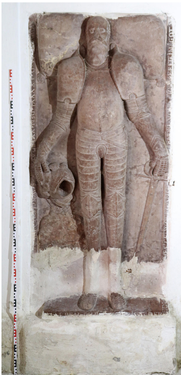
8) Zahrádky, kostel sv. Barbory, interiér, renesanční náhrobek v severní boční kapli. Foto: Kamil Podroužek, 2022.

svlakové dveře. Nad dveřním otvorem je malý, výškově obdélný okenní otvor s kamenným ostěním bez profilace. Výrazně větší je okenní otvor ve druhém patře, ukončený plným obloukem a uzavřený dřevěnými žaluziemi. Shodně řešená, ovšem bez vstupních otvorů, jsou i zbývající průčelí s výjimkou jihovýchodního. To v přízemí prostupuje vstupní otvor s kamenným ostěním ukončeným plným obloukem s okosenou hranou, v němž jsou osazeny jednokřídlé dřevěné dveře rámové konstrukce, s absencí okenního otvoru bezprostředně nad ním. Jednotlivá průčelí jsou završena profilovanou korunní římsou, nároží jsou zvýrazněna v bělavém odstínu malovanými lizénami.