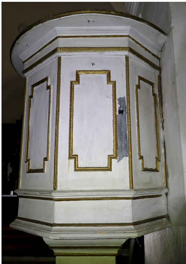
12) Zahrádky, kostel sv. Barbory, interiér, detail kazatelny. Foto: Kamil Podroužek, 2021.

Do kostela měly být také přeneseny ze zámecké kaple v Zahořanech u Litoměřic roku 1781 ostatky sv. Viktorina. 31