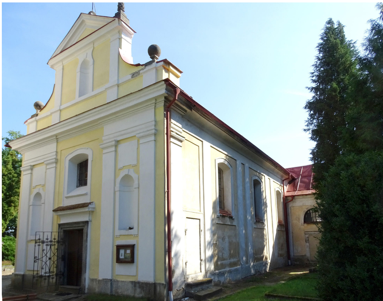
3) Zahradky, kostel sv. Barbory, hlavní západní průčelí od JZ. Foto: Vít Honys, 2021.