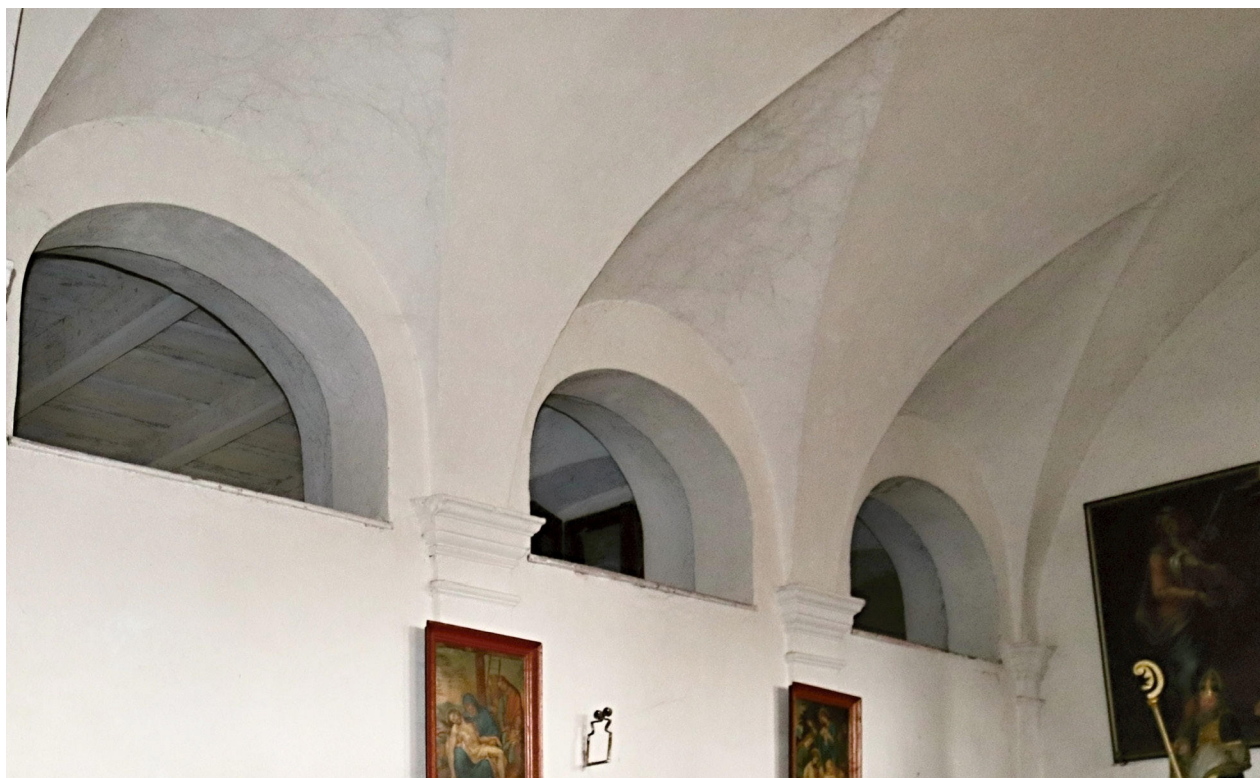
5) Zahradky, kostel sv. Barbory, klenba presbytáře s oratoří od JZ.

se při průčelí však obdélným, druhotně zazděným dveřním otvorem s kamenným ostěním s lištou vedoucím původně na schodiště kůru. Průčelí navazujících bočních kaplí vytvářejících náznak transeptu jsou lemována lizénovými rámci, okenní otvory jsou termální, rovněž rámované šambránami s lištou po obvodu a kapkami pod spodními rohy, přičemž otvory severního a jižního průčelí jsou zazděné. V západních průčelích obou zmíněných kaplí jsou obdélné dveřní otvory s jednoduchým kamenným ostěním, dnes druhotně zazděné.