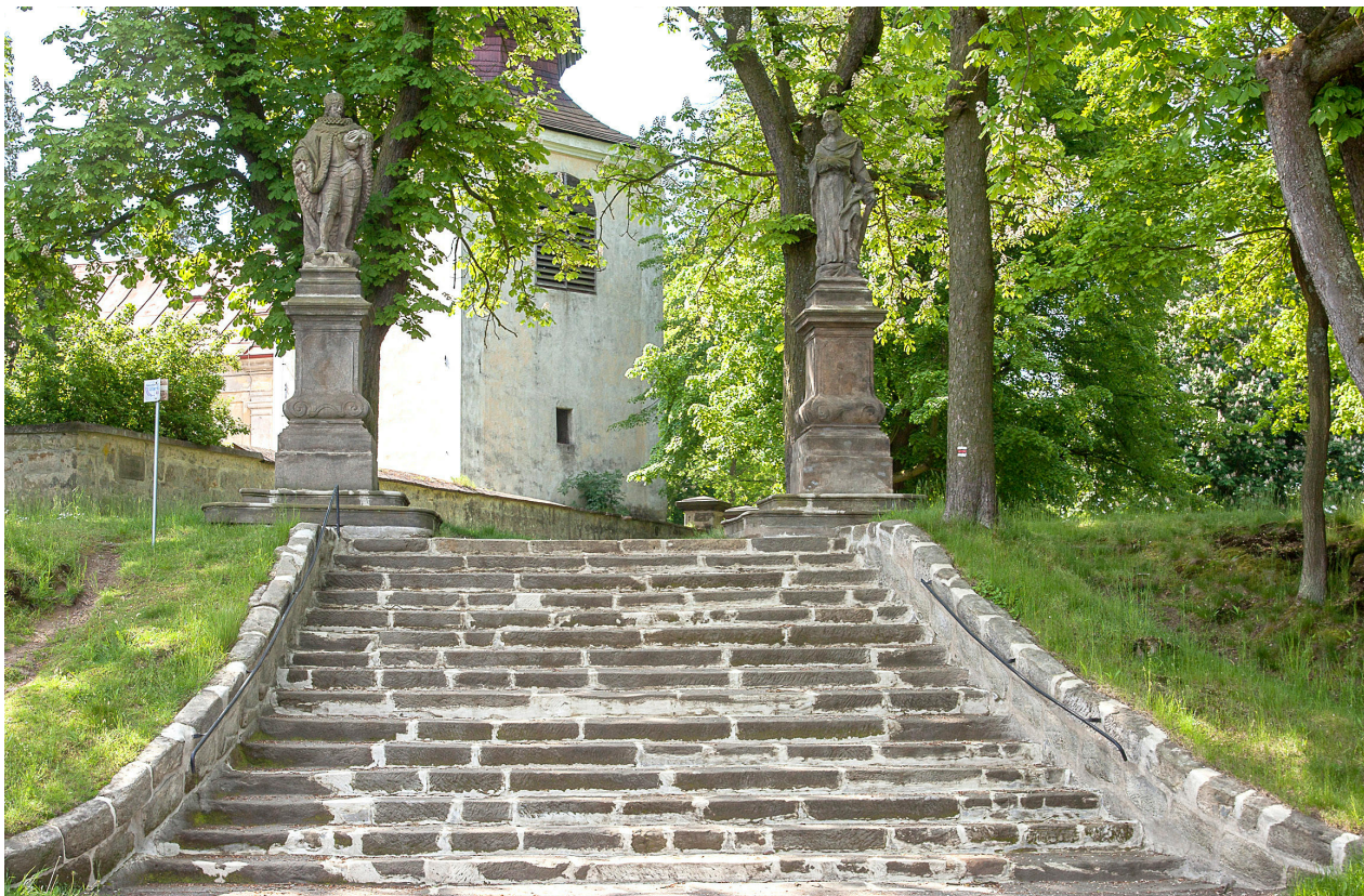
2) Zahrádky, areál kostela sv. Barbory, přístupové schodiště se sochami sv. Ferdinanda Kastilského a sv. Judy Tadeáše. Foto: Petr Hrubý, 2021.

a 2. července 1661 v něm sloužil mši kardinál Arnošt Vojtěch Harrach. 4 Vstupní poznatky z prohlídky objektu naznačovaly, že kostel je v rozhodujícím rozsahu novostavbou z více fází průběhu 17. století na místě ke stejnému účelu využitým již dříve; zatímco alespoň u spodní části sousedící zvonice bylo možno předbarokní původ patrně z konce 16. století předpokládat. 5