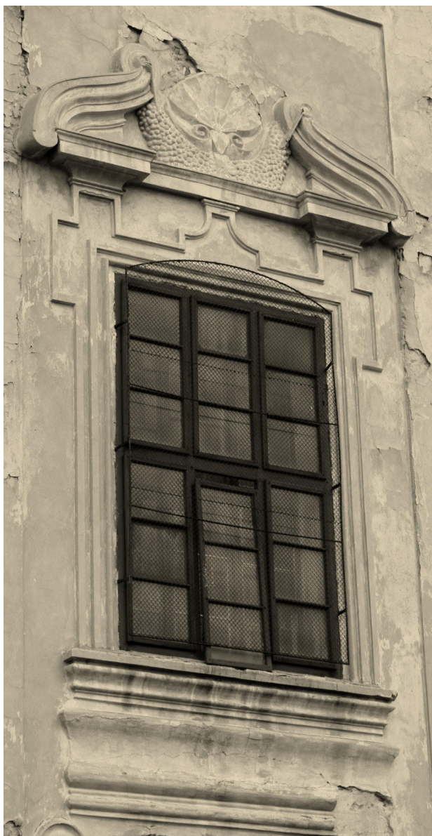
8) Křemýž, kostel sv. Petra a Pavla, suprafenestra v západním průčelí. Foto: Tomáš Vorlíček, 2020.

Presbyterium kostela, odsazené od lodi velmi úzkým lizénovým rámem, je tvořeno pěti stranami osmiúhelníka. Do jednotlivých polí vymezených lizénovými rámy jsou vložena okna obdobného řešení jako v lodi. Nad nimi jsou do plochy stěn vložena vpadlá čtvercová pole. Stejný motiv se opakuje i ve stěně závěru presbyteria, kde je však okno zaslepeno. Při bočních stěnách kněžiště jsou situovány přízemní rizality sakristie (severní průčelí) a oratoře (jižní průčelí), kde se nachází i jeden ze vstupů do kostela. Další vstup, v současné době zazděný, se dříve nacházel i v severním průčelí kostela. Způsob zastřešení obou rizalitů si vyžádal redukcii výšky oken bočních stěn presbyteria na polovinu. Rovina střechy je od hmoty stavby horizontálně oddělena průběžnou koruní římsou s výrazně vyloženou deskou. Kostel je zastřešen velmi nízkou sedlovou střechou, která je nad západním průčelím zvalbená.