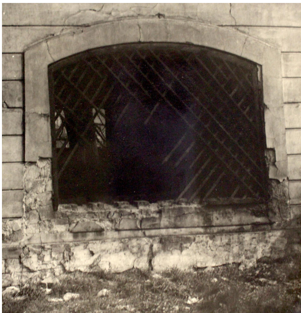
15) Křemýž, kostel sv. Petra a Pavla. Okna v přízemí zvonice zazděná při rekonstrukci budovy v roce 1974.

kteřá zde zřetelně navazuje na starší řešení v podobě původní stavby. Zřetelně tak vyjadřuje časovou a významovou kontinuitu s předbělohorským obdobím a dřívějšími vlastníky z rodu Kozelků ze Hřivic. Je více než pravděpodobné, že tato koncepce byla výsledkem předem promyšleného architektonického řešení.