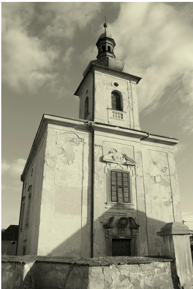
6) Křemýž, západní průčelí kostela sv. Petra a Pavla.

mírně předstupující rizalit vyvrcholený hranolovou věží završenou cibulovou bání ( obr. 6 ). Důraz na výraznou vertikální průčelí podtrhuje systém členění fasád v podobě lizén vymezujících v bočních osách druhého pohledového plánu plochy nečleněné stěny. Jediný horizontální členicí prvek průčelí představuje korunní římsa průběžného – v rizalitu zalamaného kladí. Fasády věže jsou řešeny poněkud náročněji užitím subtilních pilastrů s toskánskými hlavicemi, na něž dosedá korunní římsa a bání věže. Hlavní výtvarný důraz je kladen na střední kompoziční osu průčelního rizalitu, kde jsou soustředěny jednotlivé dominantní plastické architektonické prvky. Kompozici západního průčelí dotvářela v minulosti dvojice soch apoštolů sv. Petra a sv. Pavla umístěná na atice. 32