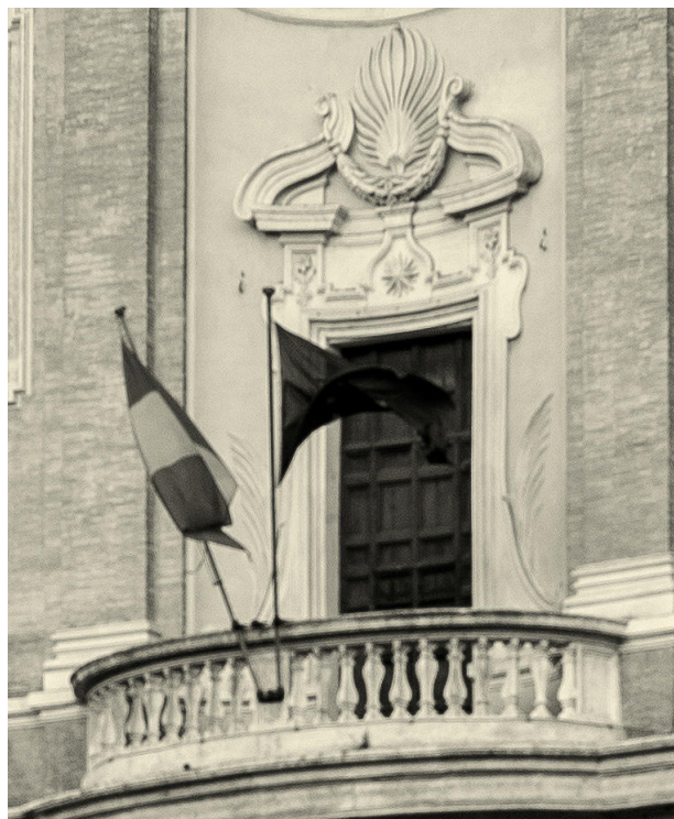
9) Řím, Oratorio di San Filippo Neri – detail fasády.

Presbyterium kostela, odsazené od lodi velmi úzkým lizénovým rámem, je tvořeno pěti stranami osmiúhelníka. Do jednotlivých polí vymezených lizénovými rámy jsou vložena okna obdobného řešení jako v lodi. Nad nimi jsou do plochy stěn vložena vpadlá čtvercová pole. Stejný motiv se opakuje i ve stěně závěru presbyteria, kde je však okno zaslepeno. Při bočních stěnách kněžiště jsou situovány přízemní rizality sakristie (severní průčelí) a oratoře (jižní průčelí), kde se nachází i jeden ze vstupů do kostela. Další vstup, v současné době zazděný, se dříve nacházel i v severním průčelí kostela. Způsob zastřešení obou rizalitů si vyžádal redukcii výšky oken bočních stěn presbyteria na polovinu. Rovina střechy je od hmoty stavby horizontálně oddělena průběžnou koruní římsou s výrazně vyloženou deskou. Kostel je zastřešen velmi nízkou sedlovou střechou, která je nad západním průčelím zvalbená.