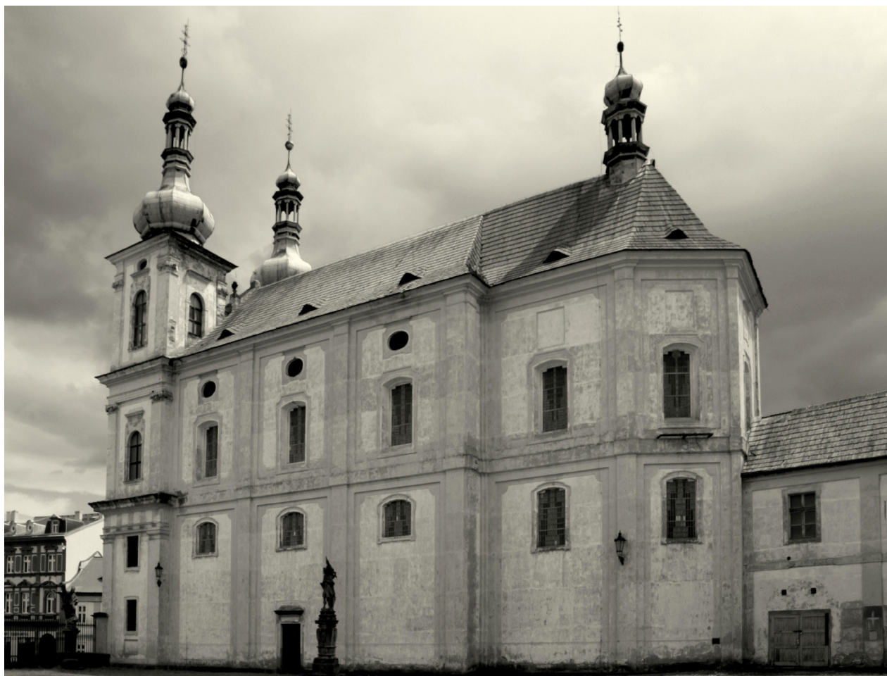
17) Duchcov, kostel Navštívení Panny Marie, severní fasáda. Foto: Tomáš Vorlíček, 2017.

strnulosti 44 (obr. 16). Na bočních fasádách se uplatňují charakteristické prvky aplikované v Duchcově v podobě zmíněných eliptických okulů. Závěr kostela, kam jsou do plochy nad okny vložena vpadlá čtvercová pole, je se zámeckým kostelem v Duchcově téměř identický (obr. 17).