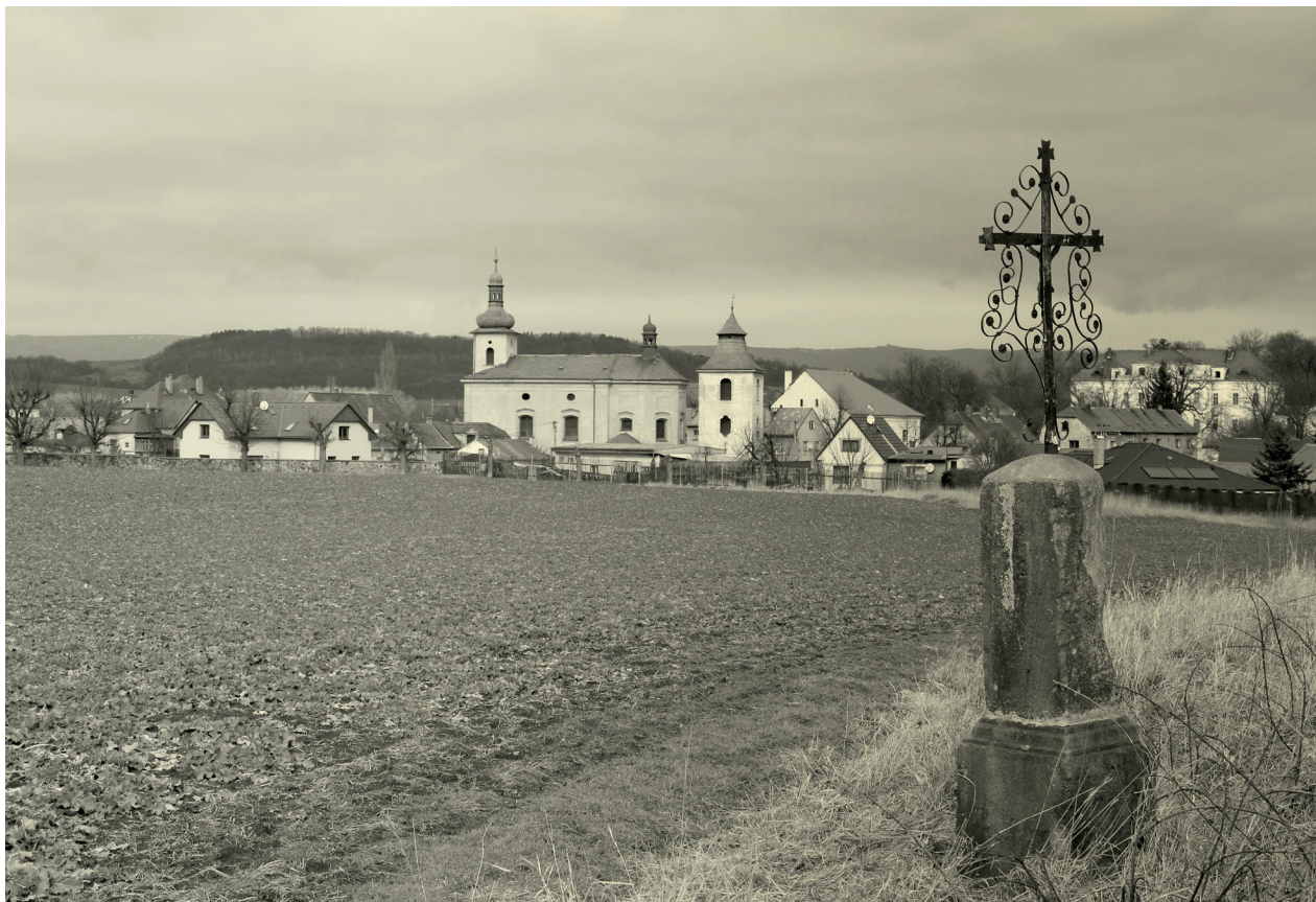
1) Křemýž, celkový pohled na obec od jihu. Foto: Tomáš Vorlíček, 2018.

Obec Křemýž se nachází přibližně 4,5 km jižně od Teplic a 6 km severně od Bíliny. Obec je situována na mírně vyvýšenině, která se na jihu místy příkře svažuje do údolí řeky Bíliny. Dominantní krajinný prvek představuje severně od obce zalesněný Ládenský vrch (332 m n. m.), na jihu pak kužel Husova vrchu (266 m n. m.). Intravilánu obce dominuje budova zámku a kostel sv. Petra a Pavla se samostatně stojící zvonící ( obr. 1 ). Malebná konfigurace střech kostela vyniká zvláště na pozadí zalesněných kup Milešovského středohoří.