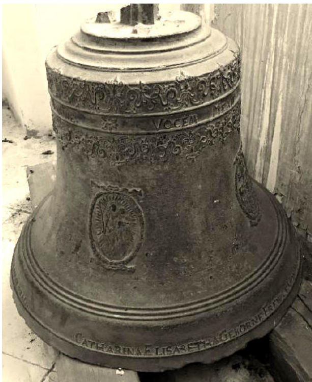
2) Zvon z roku 1676 je v současné době deponován na zámku v Duchcově. Foto: Robert Kotyšan, 2020.

duchcovsko-litvínovském panství Valdštejnů, v jejímž kontextu bude problematika v této studii nahlížena, představuje práce Pavly Priknerové. 5 Opomenout samozřejmě nelze ani příslušné kapitoly doposud nejrozsáhlejší syntézy barokní architektury v Čechách. 6