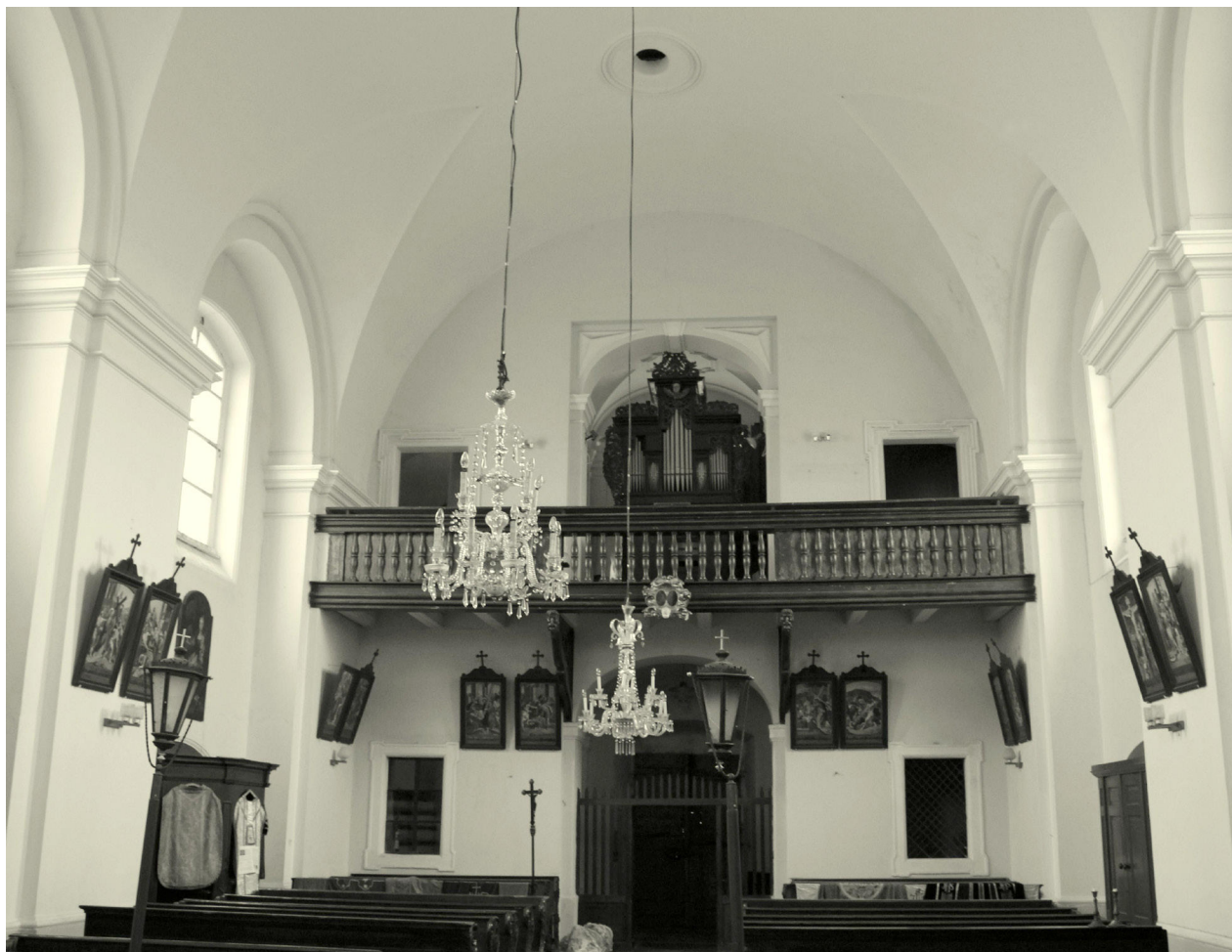
12) Křemýž, kostel sv. Petra a Pavla, pohled na varhany kruchtou.

své tvorbě Marc Antonio Canevalle, který jej poprvé použil na fasádách zámku v Mnichově Hradišti. Tento prvek se dále výrazně uplatnil i na fasádách Canevalleho vrcholné stavby kostela sv. Vojtěcha na Novém Městě pražském z let 1699–1704. Naposledy se k němu architekt vrátil v roce 1708 při přístavbě věže kostela sv. Jana Křtitele ve Strážišti u Příbrami. Geograficky nejbližší ke Křemýži jej Canevalle – mimo jiné společné prvky – aplikoval na fasádách zámeckého kostela Navštívení Panny Marie v nedalekém Duchcově.