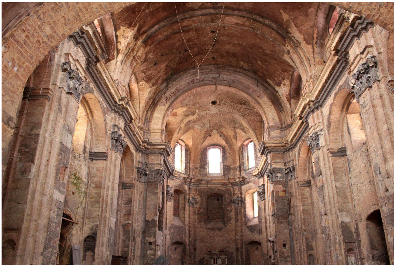
18) Duchcov, Kostel Navštívení Panny Marie, interiér lodi. Foto: Tomáš Vorlíček, 2018.

Pozoruhodný příklad recepce „velké architektury“ v rámci jednoho města představuje prakticky dosud nepovšimnutý objekt tzv. Heymannovy kaple v Duchcově. Na přelomu 17. a 18. století byla na soukromém pozemku kněze Johanna Christopha Heymanna († 1703) vybudována drobná centrální stavba s předsaženým kulisovým průčelím. Jako vzor zde bezpochyby sloužily struktury drobných oktagonálních kaplí zakomponovaných do průčelních bloků kostelů v Horním Jiřetíně a především kostela Zvěstování Panny Marie v samotném Duchcově, ke kterému měl donátor kaple úzké vazby. 48