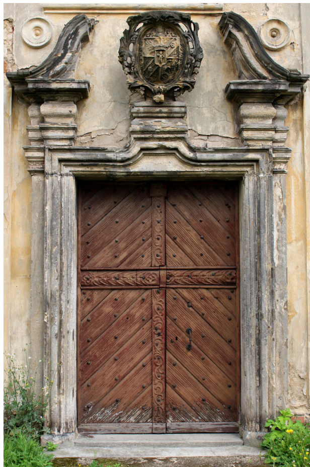
7) Křemýž, kostel sv. Petra a Pavla, hlavní vstupní portál s erbem rodu Pachonhay. Foto: Tomáš Vorlíček, 2018.

dosedající na nízký zalamaný sokl. Parapet je provázán s půlkruhově zaklenutým oknem zasazeným do ploché šambrány, nad níž je umístěno elipsovité okénko. Jednodušeji jsou členěna boční průčelí věže, kde je užití pouze nečleněných parapetních říms.