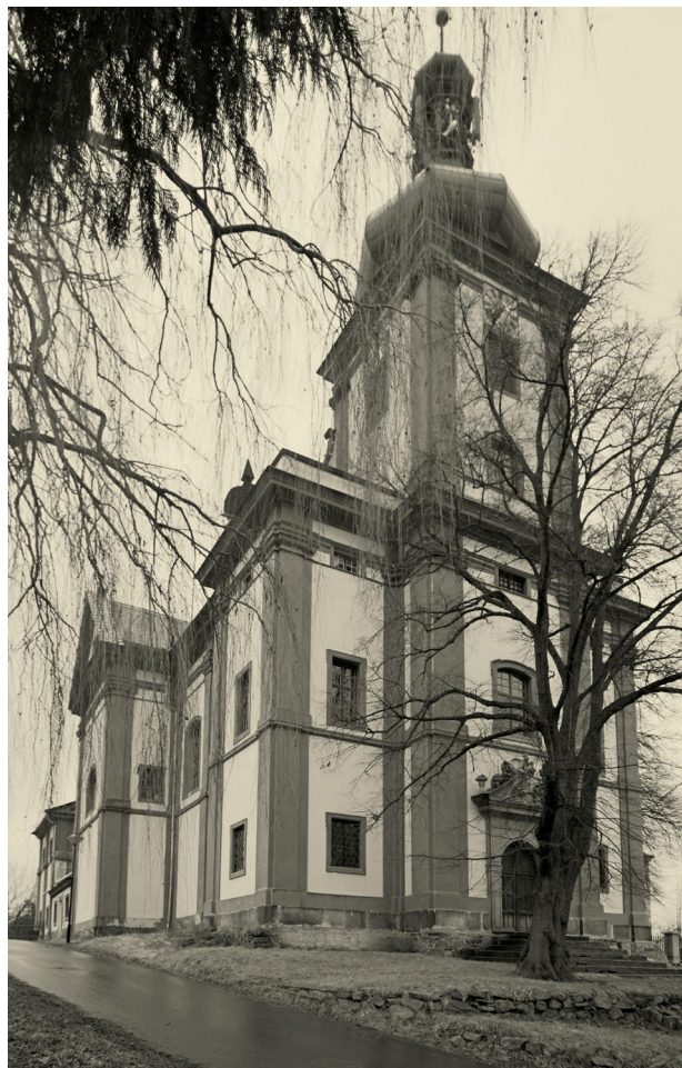
16) Horní Jiřetín, kostel Nanebevzetí Panny Marie, západní průčelí.