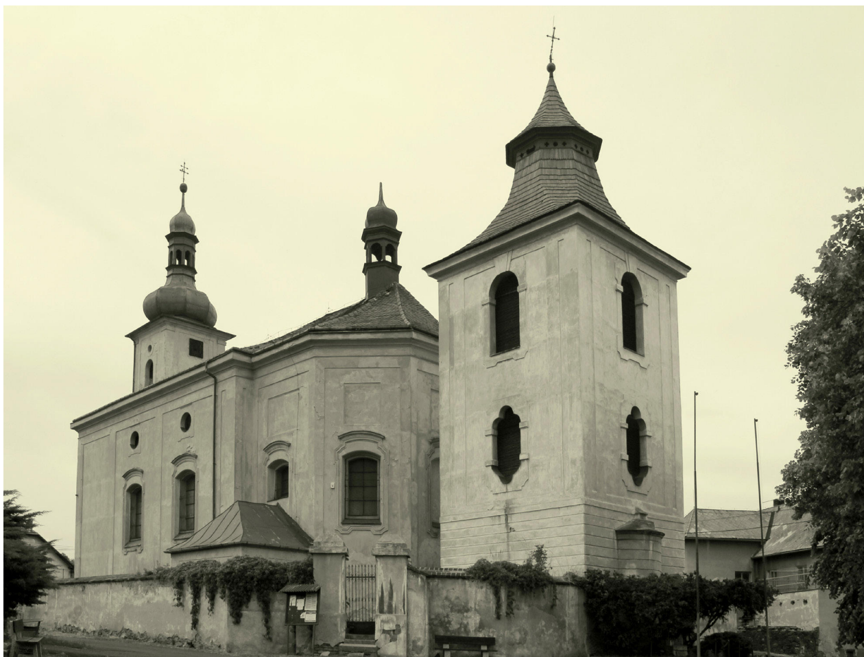
5) Křemýž, areál kostela sv. Petra a Pavla z prostoru návsi.