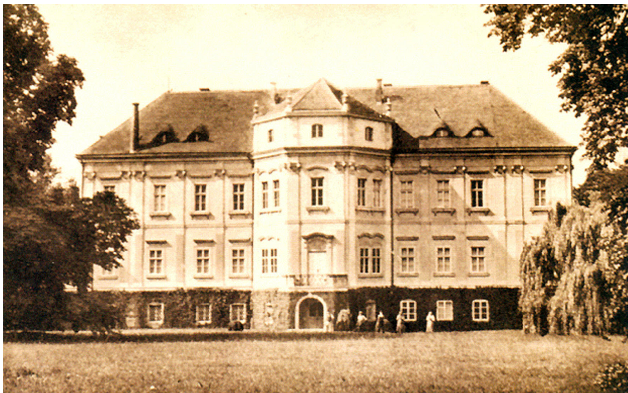
Křemýžský zámek (Schloss)

4) Křemýž, severní průčelí zámku po poslední výraznější přestavbě ve 30. letech 20. století na dobové pohlednici.