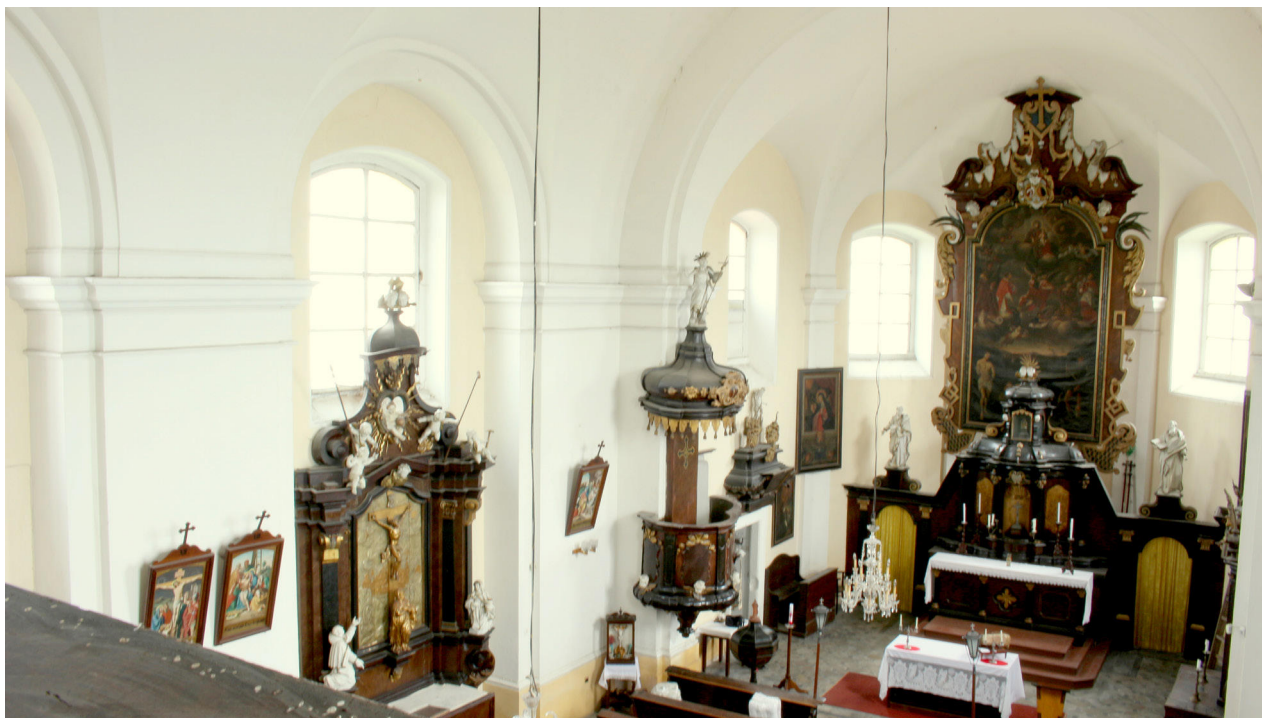
13) Křemýž, kostel sv. Petra a Pavla, pohled do lodi a presbyteria.

v období, kdy je slunce nízko, vytváří z lodi soustředěný, jemně modelovaný a odstíněný prostor. Tomuto výtvarnému záměru architekta patrně odpovídá i současná výmalba interiéru kostela. Aktivní bílé natřené tektonické články v podobě pilastrů a říms vynášejících klenbu jsou zde barevně odlišeny od okrové pasívní hmoty obvodového zdiva.