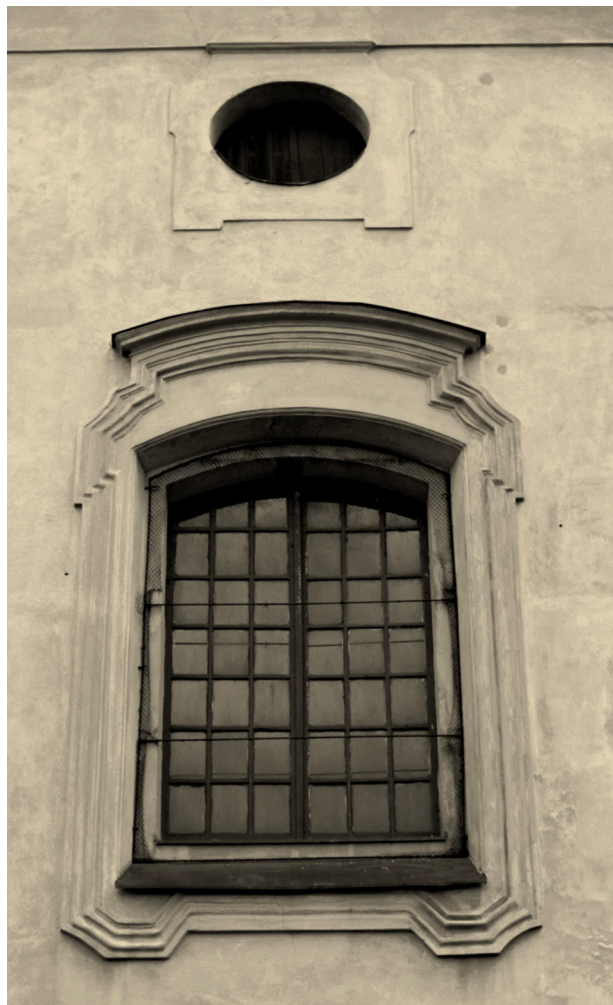
11 Křemýž, kostel sv. Petra a Pavla, proflace okenních šambrán v jižním průčelí.

tvorbou barokního Říma. 34 Toto album, které výrazně přispělo k formování tzv. mezinárodního baroku, patrně architekt použil jako inspiraci a aplikoval výše uvedený borrominiovský motiv v severočeské Křemýži nedlouho po vydání jeho prvního dílu. 35