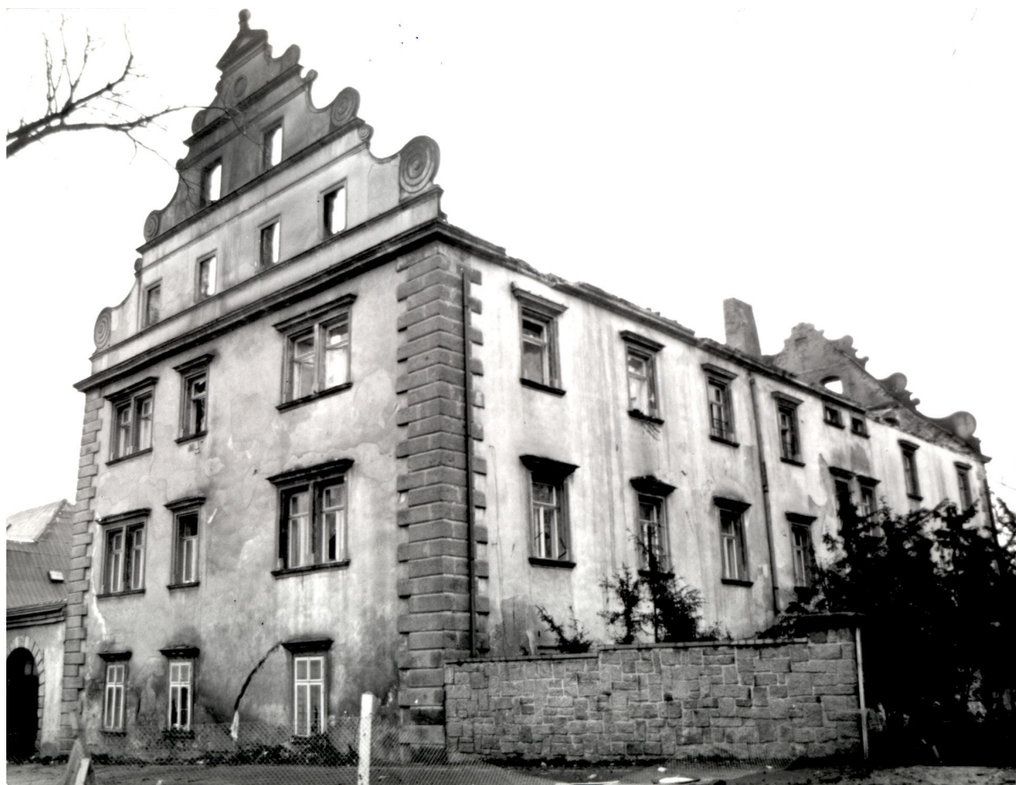
Obr. 2. Šluknov, zámek, pohled od jihozápadu, stav po požáru 1. 4. 1986, duben 1986.