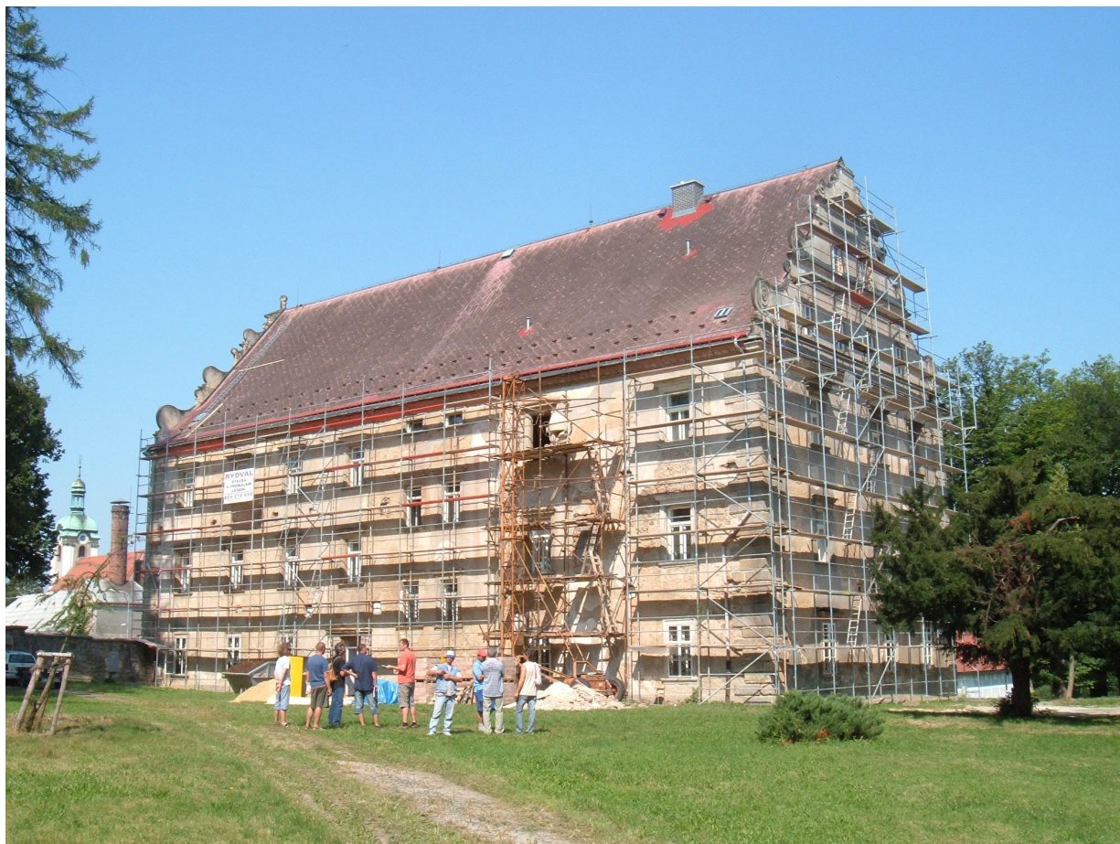
Obr. 5. Šluknov, zámek, pohled od jihovýchodu, 17. července 2007.