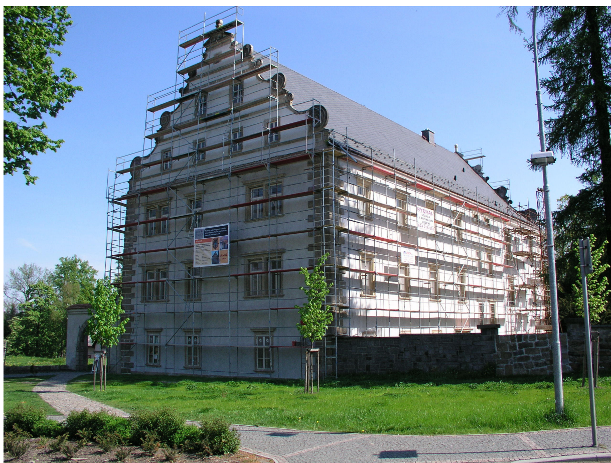
Obr. 3. Šluknov, zámek, pohled od jihozápadu, květen 2008.