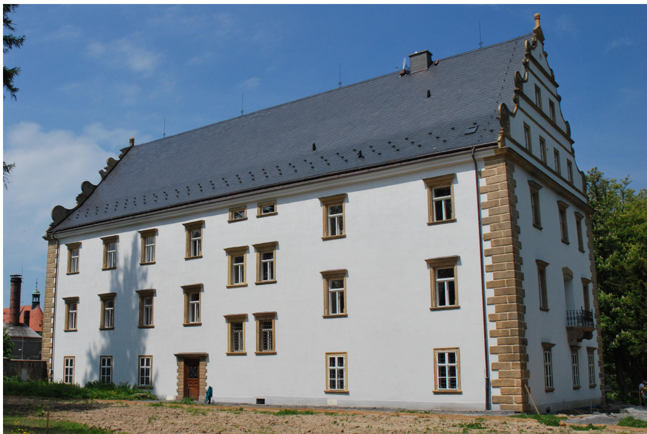
Obr. 6. Šluknov, zámek, pohled od jihovýchodu, 8. června 2010.