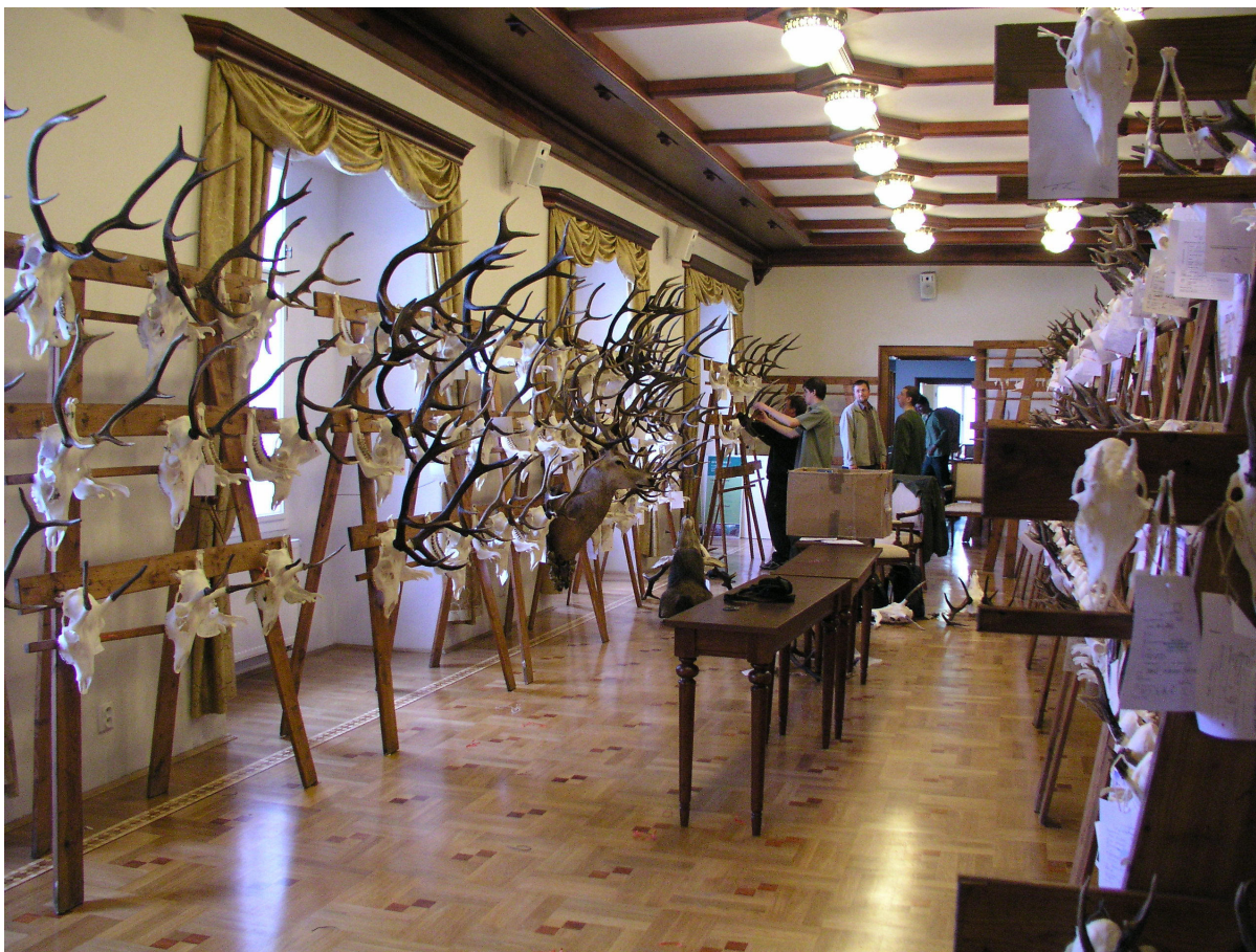
Obr. 13. Šluknov, zámek, hlavní sál 2. patra. Instalace výstavy trofejí Střední lesnickou školou ve Šluknově, květen 2008.