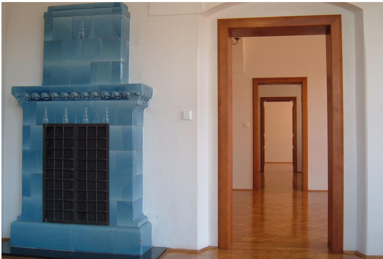
Obr. 12. Šluknov, zámek, opravené prostory 1. patra, červenec 2007.