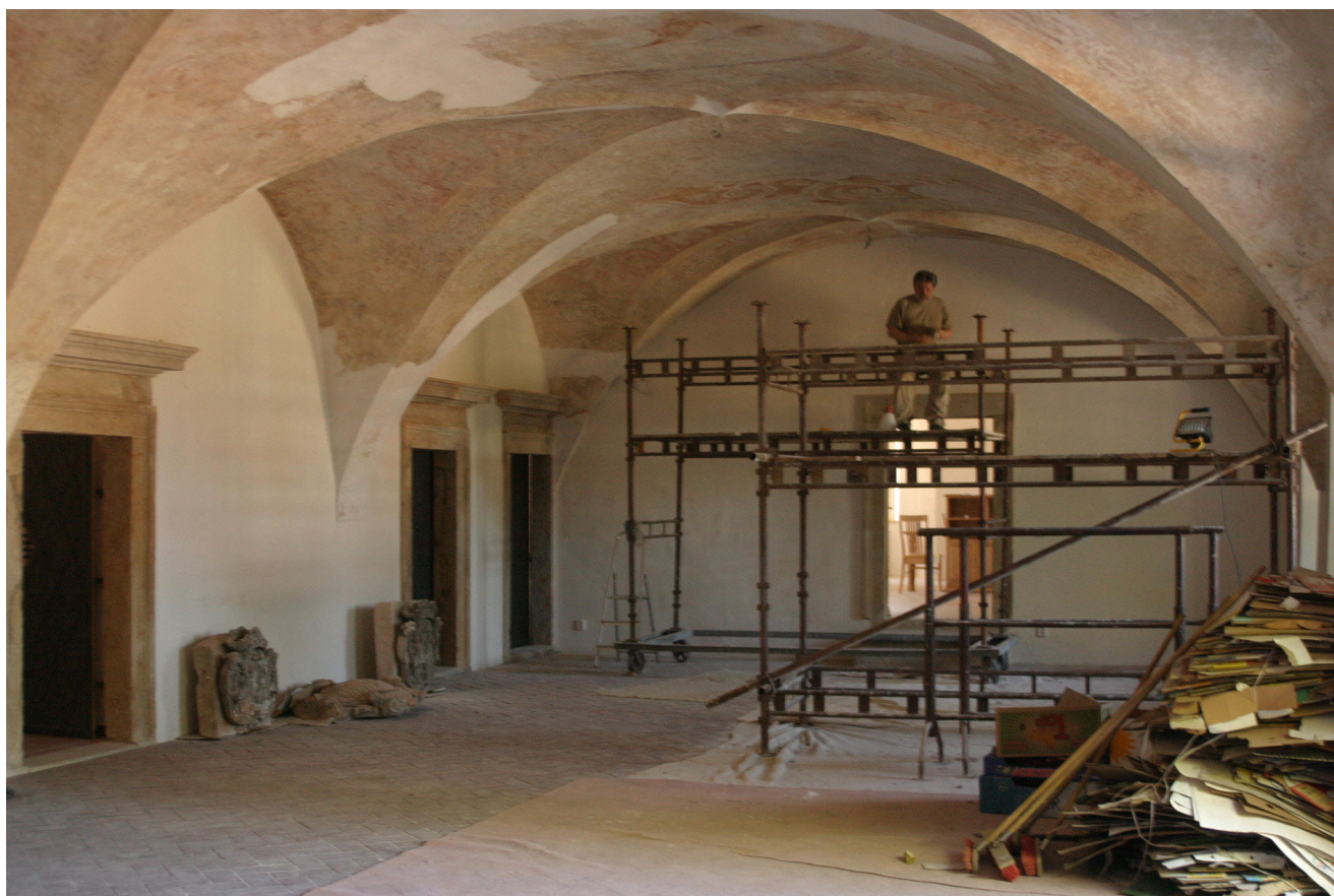
Obr. 10. Šluknov, zámek, přízemí, vstupní hala, práce na restaurování stropu, červenec 2006.