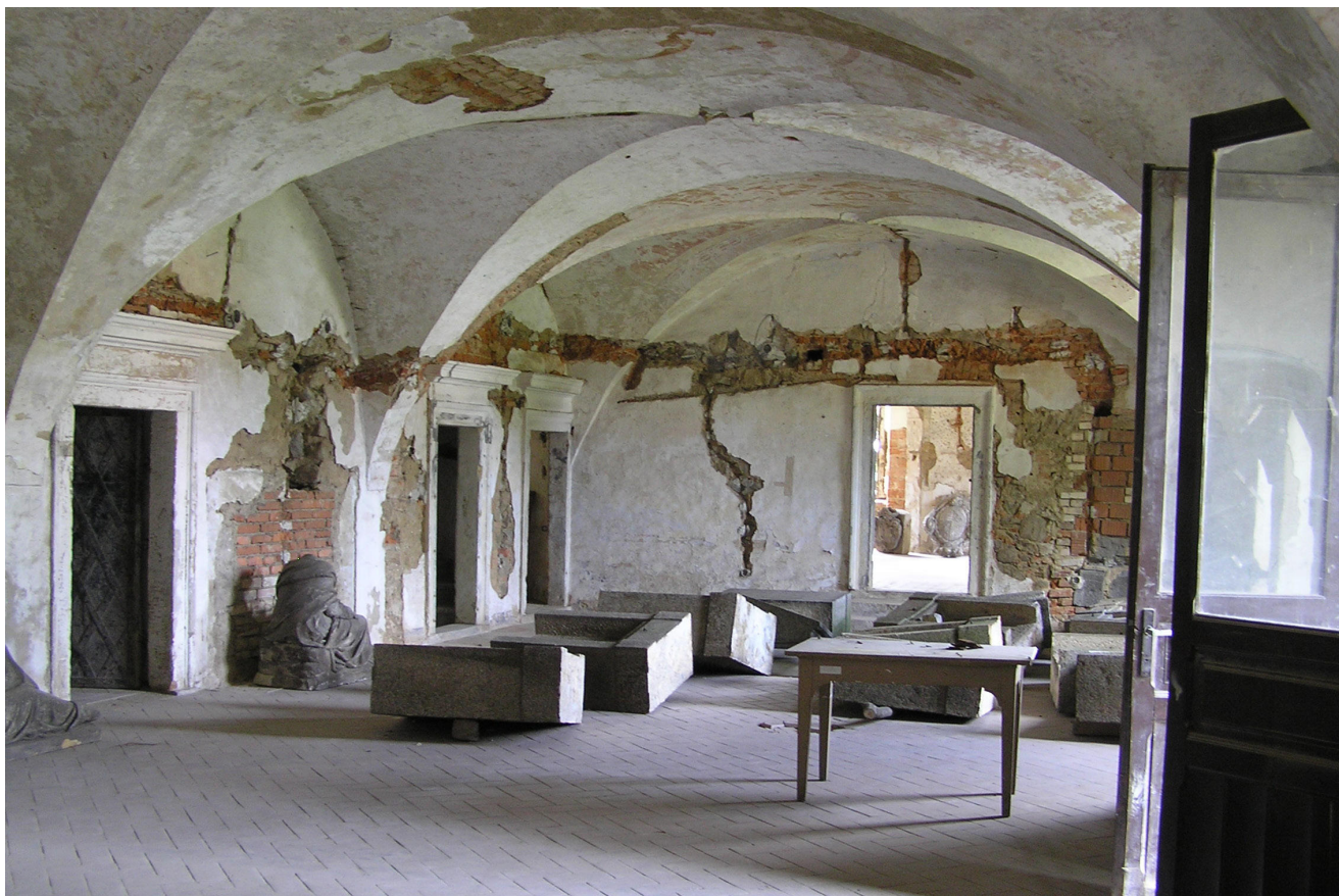
Obr. 9. Šluknov, zámek, přízemí, vstupní hala, před zahájením stavebních prací, červen 2005.