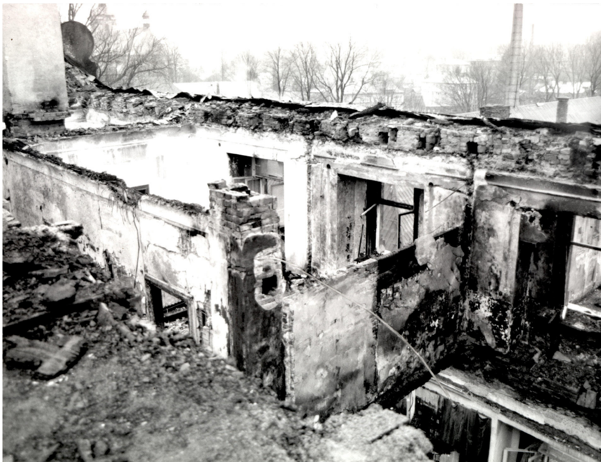
Obr. 7. Šluknov, zámek, pohled z pudy k pravému štítu, stav po požáru 1. 4.1986, duben 1986.

V roce 2000 byl založen Dobrovolný svazek obcí Sever (obce Lobendava, Staré Křečany, Lipová, Velký Šenov, Jiříkov, Mikulášovice, Šluknov, Dolní Poustevna, Vilémov, Rumburk), jehož se stal Šluknov přirozeným centrem.