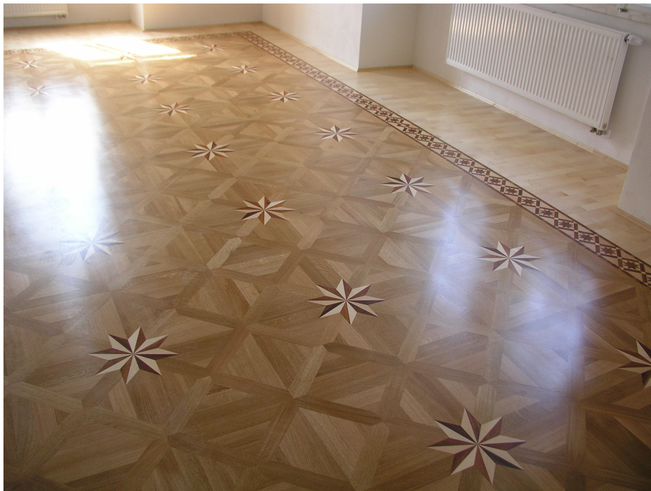
Obr. 11. Šluknov, zámek, 2. patro zámku, ukázka nových parketových podlah, květen 2008.

dokončením rekonstrukce objektu zámku bude uspokojena potřeba vzniku prostor vhodných pro komunitní akce, vzdělávání a prezentaci mikroregionu. Projekt obnovy je zaměřen zejména na tři cílové skupiny budoucích návštěvníků zámecného objektu. Vzhledem k plánovanému častému pořádání společensko kulturních akcí (svatby, rodinné oslavy, kulturní společenské a vzdělávací akce aj.) se počítá přímo s obyvateli Šluknovského výběžku jako nejčastějšími návštěvníky. Dále bude zámek zaměřen na lesnickou veřejnost a samozřejmě na domácí a zahraniční turisty. Hlavním současným cílem návštěvníků je blízký Národní park České Švýcarsko v Krásné Lípě, cca 15 km od Šluknova.