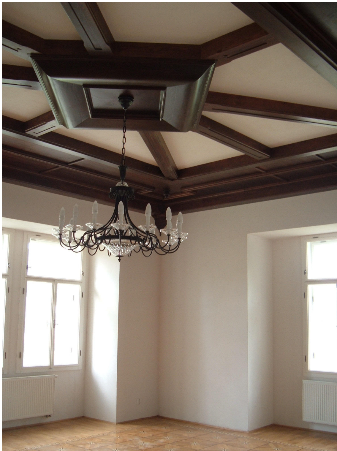
Obr. 14. Šluknov, zámek, opravené místnosti v 1. patře zámku s ukázkou nově instalovaných kazetových stropů, červen 2007.