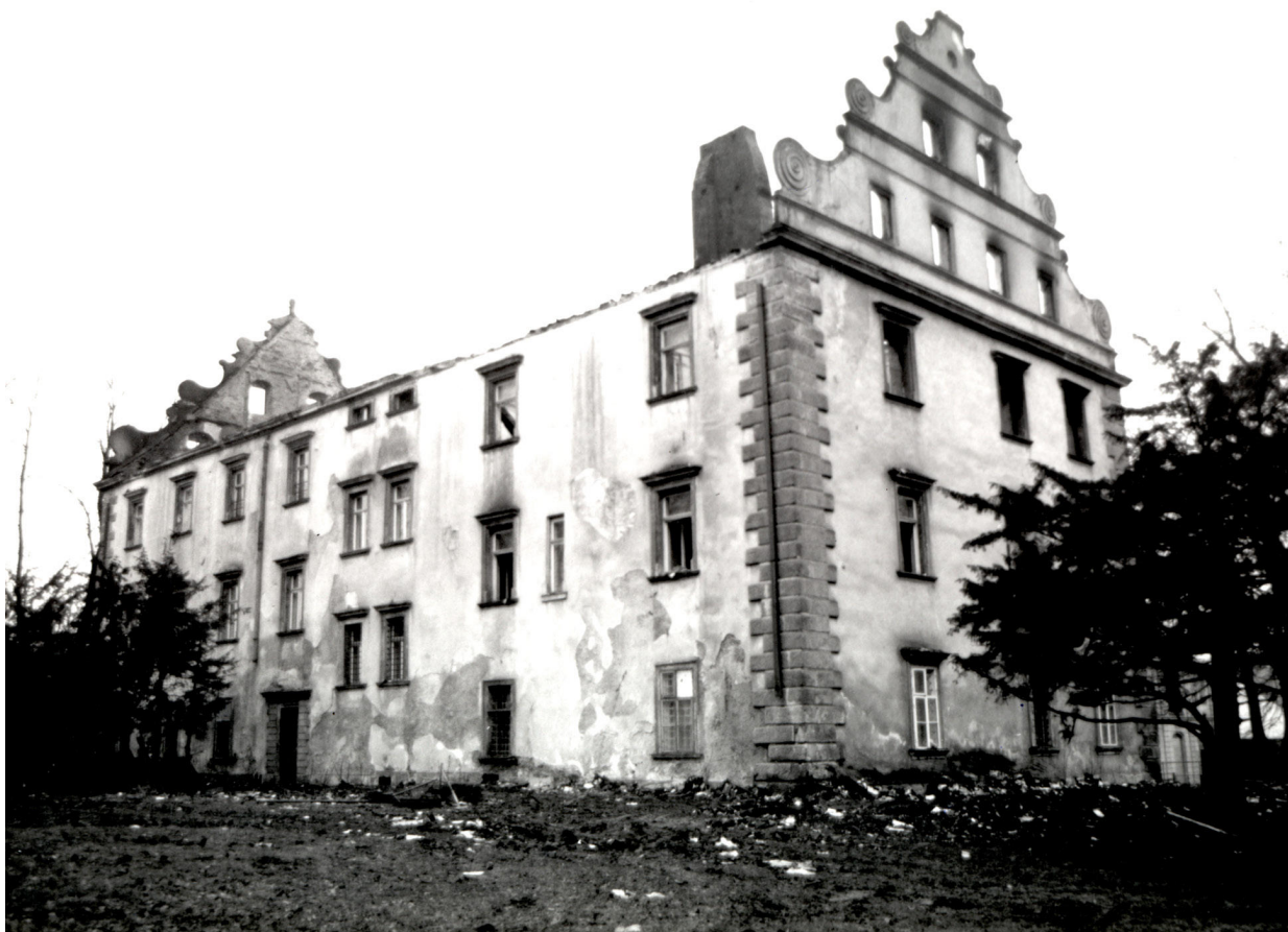
Obr. 4. Šluknov, zámek, pohled od jihovýchodu, stav po požáru 1. 4. 1986, duben 1986.