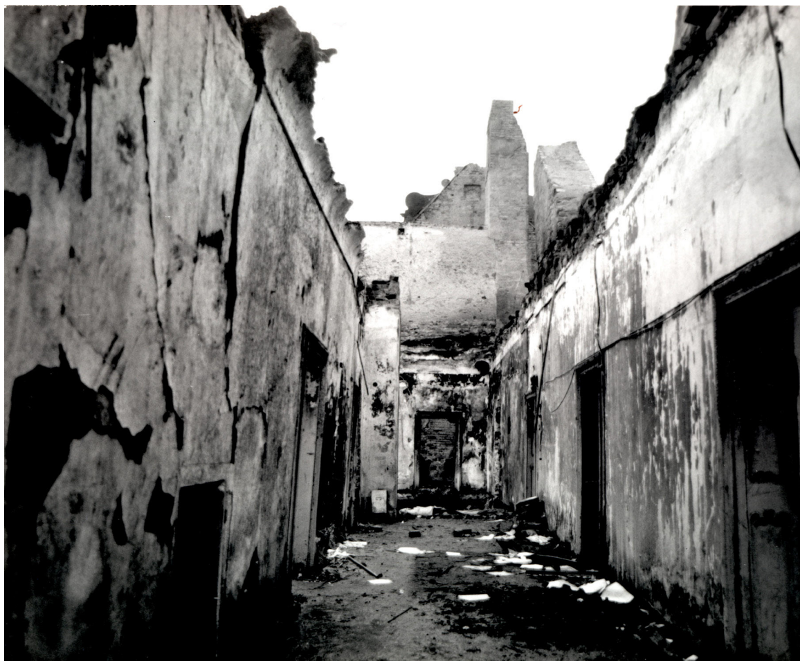
Obr. 8. Šluknov, zámek, 2. patro, chodba, stav po požáru 1. 4. 1986, duben 1986.