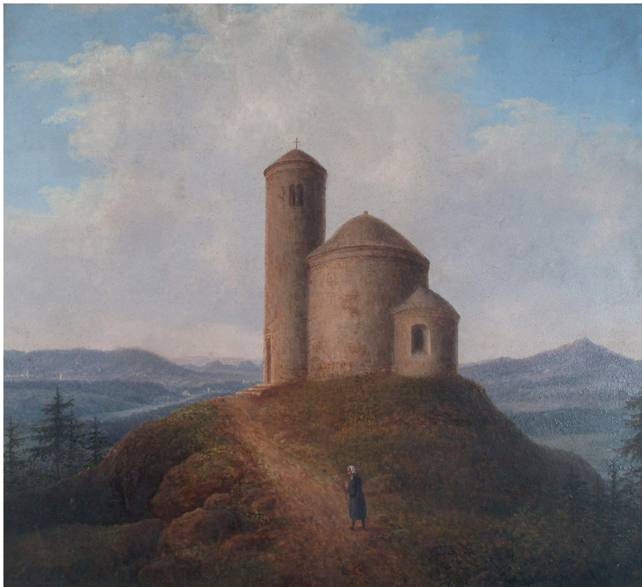
Obr. 3. Hugo Seykora, kaple sv. Jiří na hoře Říp, 1845, červen, olej na dřevě, 25,6 x 27,6 cm. Pohled od jihu. Královská kanonie premonstrátů na Strahově, grafická sbírka Strahovské obrazárny, sign. O 1108.