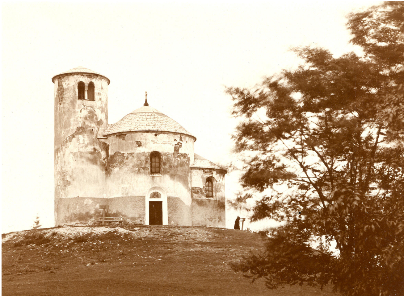
Obr. 1. Archivní fotografie z roku 1916 dokládá úpravu fasád, kterou rotunda získala při obnově v letech 1869–1881.

Obnovy exteriéru rotundy sv. Jiří a sv. Vojtěcha na hoře Říp jsem se účastnil jako odborný garant Národního památkového ústavu.