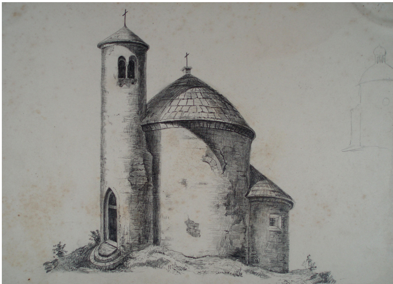
Obr. 5. Hugo Seykora, kaple sv. Jiří na hoře Říp, tužka, papír, 194 x 275 mm. Královská kanonie premonstrátů na Strahově, grafická sbírka Strahovské obrazárny, sign. SK 1646 (kart. 36).