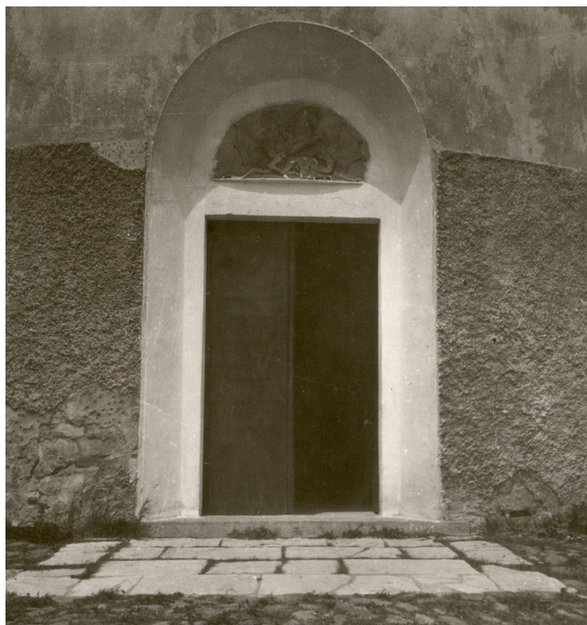
Obr. 2. Portál vstupu proraženého v 19. století na fotografii z roku 1907. Všimněme si místa odpadlé omítky vlevo ve styku portálu a horního okraje soklu. Z detailu je zřejmé, že omítky z let 1889 – 1881 byly nanášeny na starší omítkové vrstvy.

jest všecek hladce omítněn, pročež nelze poznati, je-li věž s lodí ve zdivu docela vázaná.“ Na archivní fotografii z roku 1907 je vedle portálu vidět pod poškozeným místem starší pekovanou omítku. Za první republiky byly vnější omítky z části otlučeny tak, aby bylo vidět kvádřikové zdivo. Na cihelném zdivu omítky zůstaly. Tento stav je zachycen ještě na fotografii přebalu třetího svazku Uměleckých památek Čech.