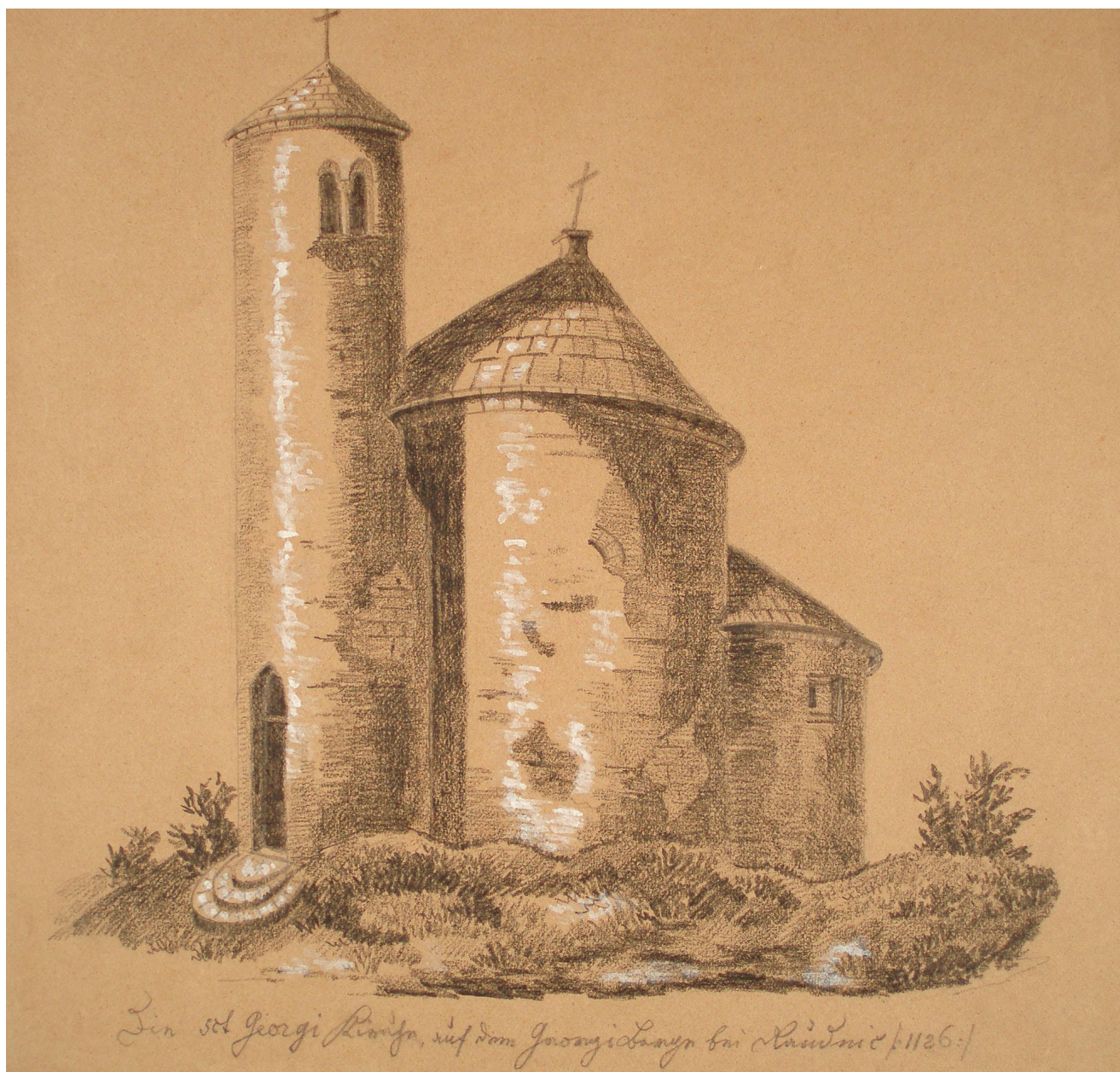
Obr. 4. Hugo Seykora, kaple sv. Jiří na hoře Říp, tužka, papír, 239 x 205 mm. Královská kanonie premonstrátů na Strahově, grafická sbírka Strahovské obrazárny, sign. SK 1561 (kart. 36).