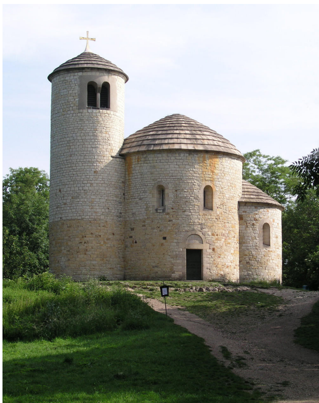
Obr. 5. Podoba fasád po přestavbě v letech 1966–1974, při které se celý vnější líc rozebral a znovu vyzdil s použitím části starých kvádrů.

co a proč se dělá. Oprava vědomě korigovala úpravy 20. století ve prospěch historicky věrohodnější podoby. Její hlavní motivací však bylo co nejlépe ochránit zbytky původních kvádrů.