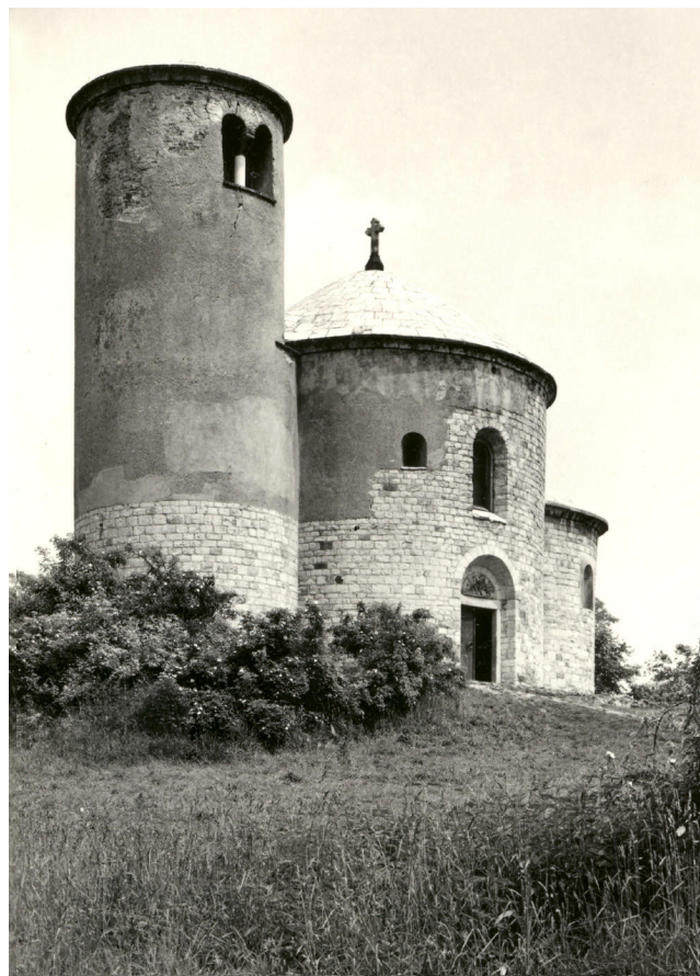
Obr. 3. Na fotografii z roku 1961 vidíme úpravu 1. republiky, při které bylo odhaleno kvádřikové zdivo.

Obnova byla poplatná názorům své doby, což ji zpětně nelze vyčítat. Z dnešního pohledu však autenticita památky