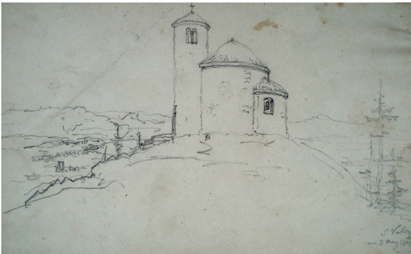
Obr. 2. Hugo Seykora, kaple sv. Jiří na hoře Říp, 1845, 8. března, tužka, papír, 122 x 200 mm. Pohled od jihu. Královská kanonie premonstrátů na Strahově, grafická sbírka Strahovské obrazárny, sign. SK 1174 (kart. 36).