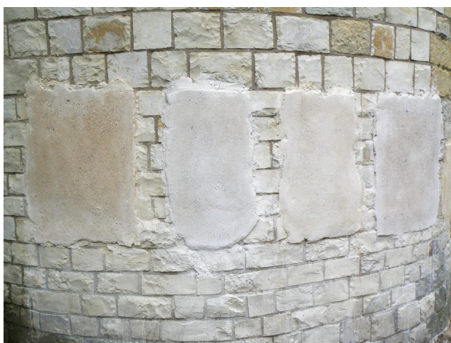
Obr. 8. Složení, zpracování, barevnost i úprava povrchu a detailů nových omítek se ověřovala řadou fyzických vzorků.