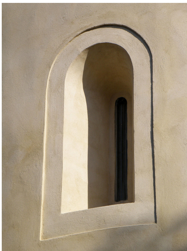
Obr. 9, 10. Aktuální podoba po obnově.