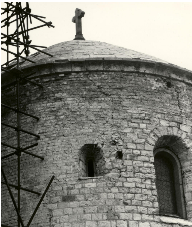
Obr. 4. Otlučení všech omítek znamenalo mimo jiné odhalení rozsáhlých ploch cihelného zdiva použitého při historických opravách.