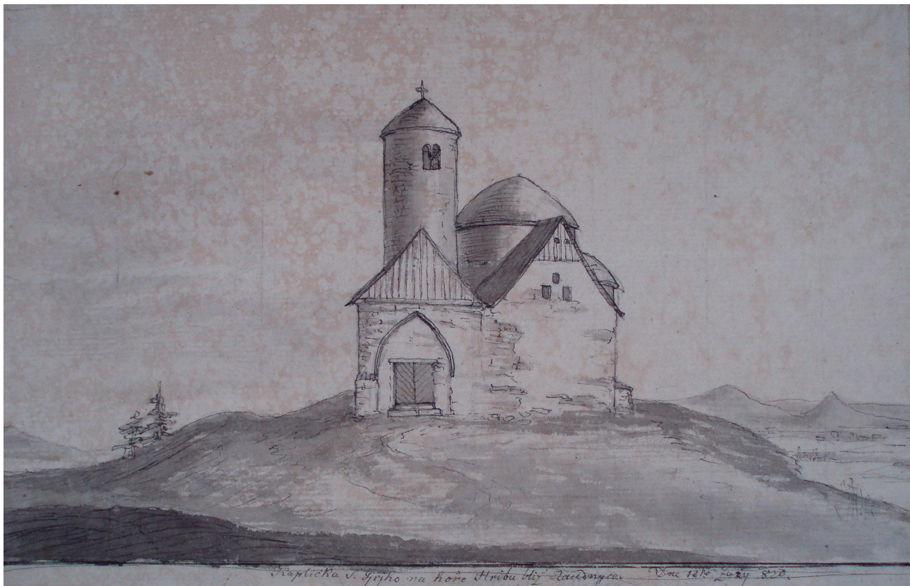
Obr. 1. Hugo Seykora, kaple sv. Jiří na hoře Říp, 1820, 12. září, lavírovaná kresba tuží, 140 x 215 mm. Pohled od západu, na kresbě je ještě patrná přístavba u věže. Královská kanonie premonstrátů na Strahově, grafická sbírka Strahovské obrazárny, sign. KKF 1597.