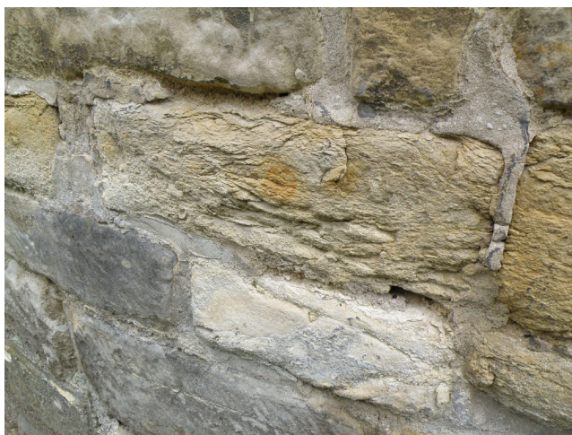
Obr. 6, 7. Primárním důvodem rozhodnutí o rekonstrukci omítek byl stav opukového zdiva.