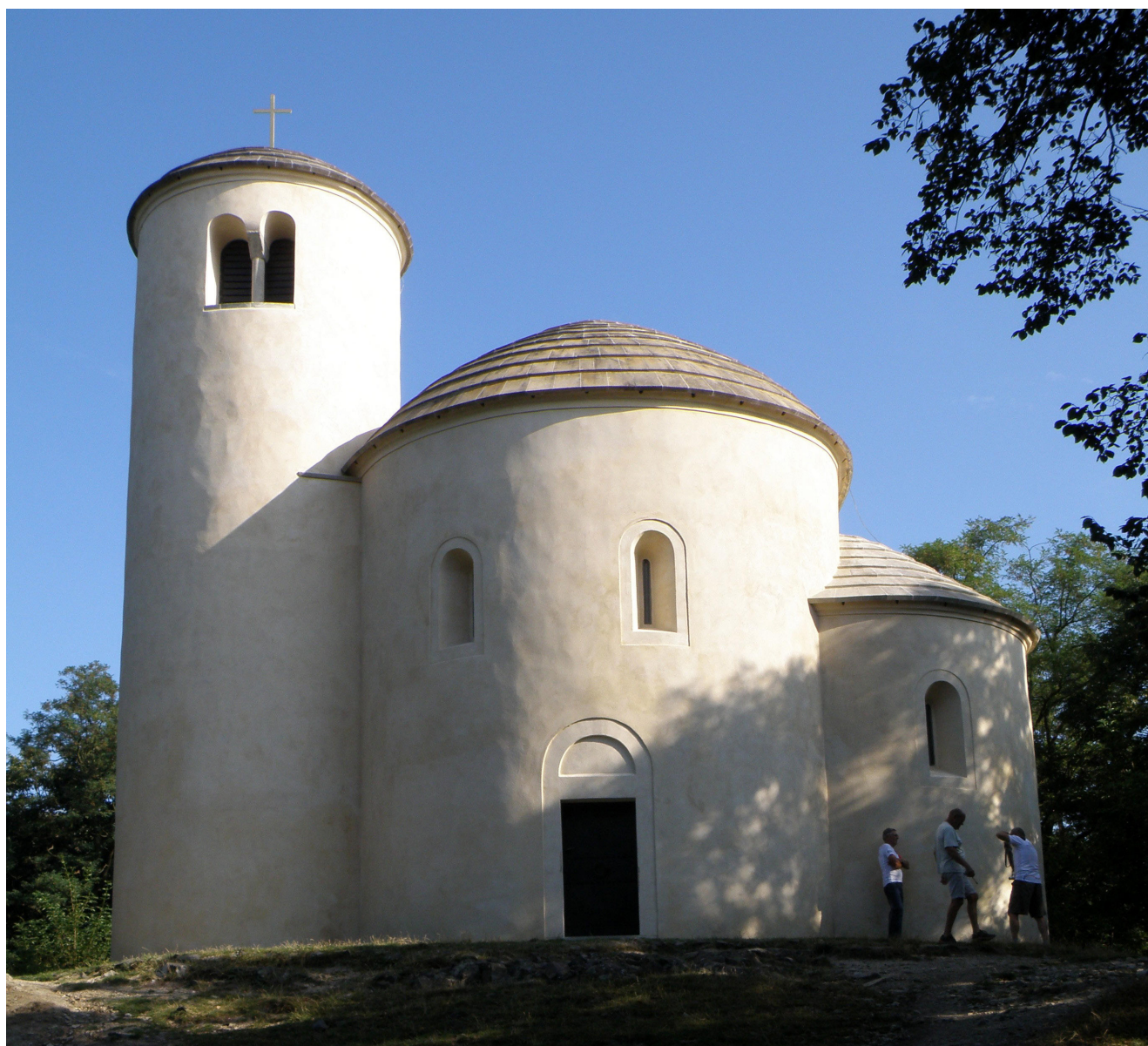
Obr. 11. Aktuální podoba po obnově.