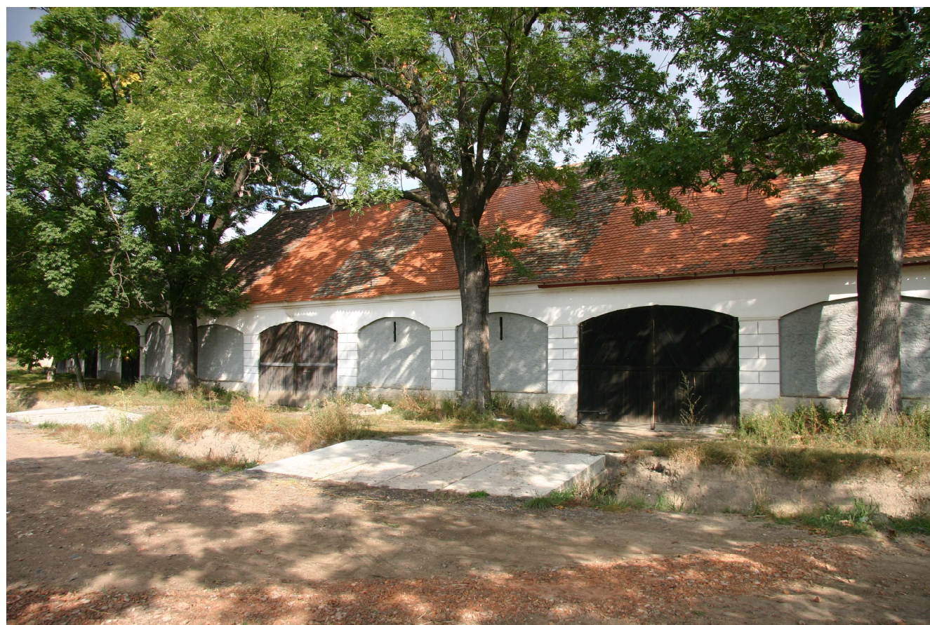
Obr. 3. Slatina, soubor stodol u čp. 7 a 8.