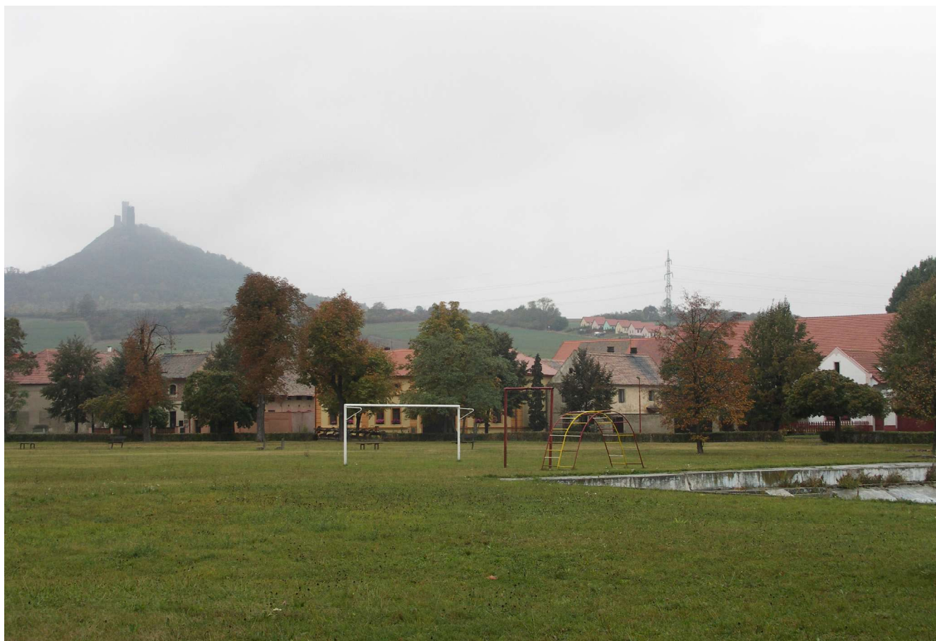
Obr. 2. Slatina, část návsi s fotbalovým hřištěm a požární nádrží, stav v říjnu 2009, v pozadí tzv. „povodňové domy“.