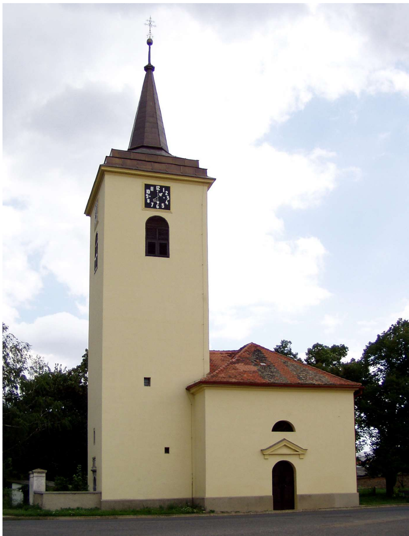
Obr. 5. Slatina, kostel sv. Jana Nepomuckého.