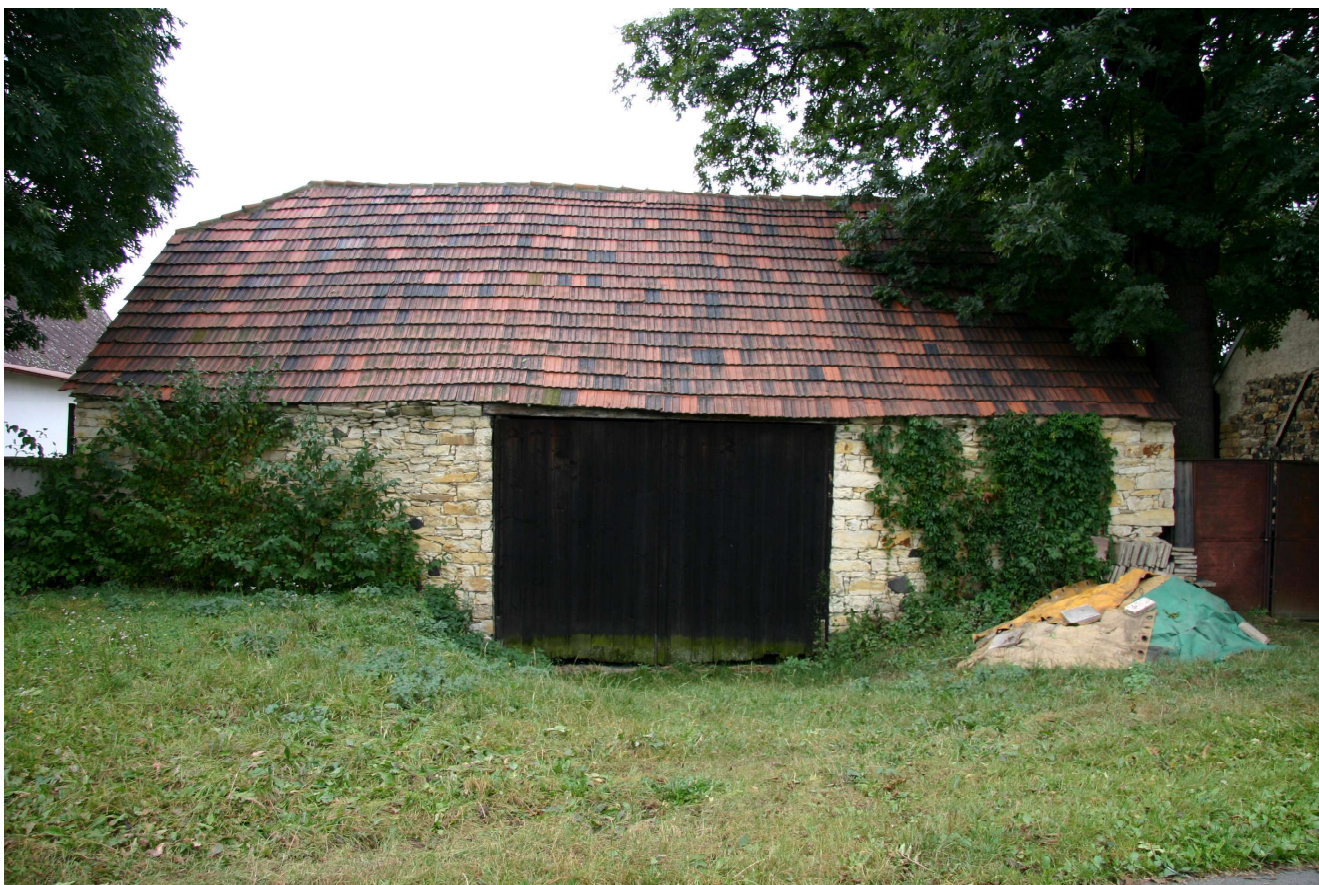
Obr. 4. Slatina, stodola u č. p. 30.

dvěma příčně položenými mlaty. Jedná se o stodoly s nosnými stěnami zděnými povětšinou z neopracované opuky, jejichž pojivem je vápenná malta. Většina dodnes existujících stodol je v relativně dobrém stavu.