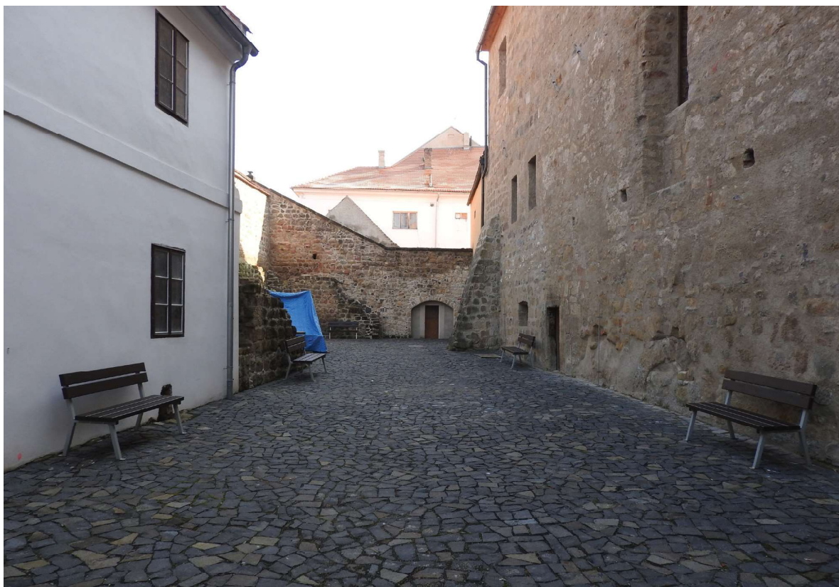
Obr. 10. Hrad Ústěšk, stav areálu v roce 2016, vnitřní hrad.