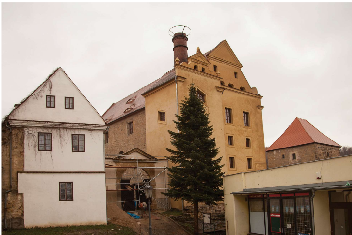
Obr. 11. Hrad Ústěšk, stav areálu v roce 2016, celkový pohled. Foto: Petr Hrubý, 2016.