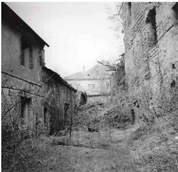
Obr. 3. Hrad Ústětk, stav areálu v 70. letech 20. století.

počítala se zřízením ubytování hotelového typu jako garni nově postaveného kulturního domu. Odhadované aproxima-tivní náklady se pohybovaly v částkách 2,8 mil. Kčs až 6,0 mil. Kčs, a to dle nákladnosti jednotlivých variant. 5 Projektový úkol na záchraná opatření 6 doplnil projektový úkol na rekonstrukci hradu. 7 Současně byla zpracována studie interiéru hradu. 8 Paralelně probíhalo zpracování technické dokumentace sanace hradu a jeho statického zajištění, které počítalo s betonovými torkrety kleneb přízemí, novými betonovými stropy a injektážmi obvodového zdiva, 9 a průzkum technické infrastruktury nádvoří. 10