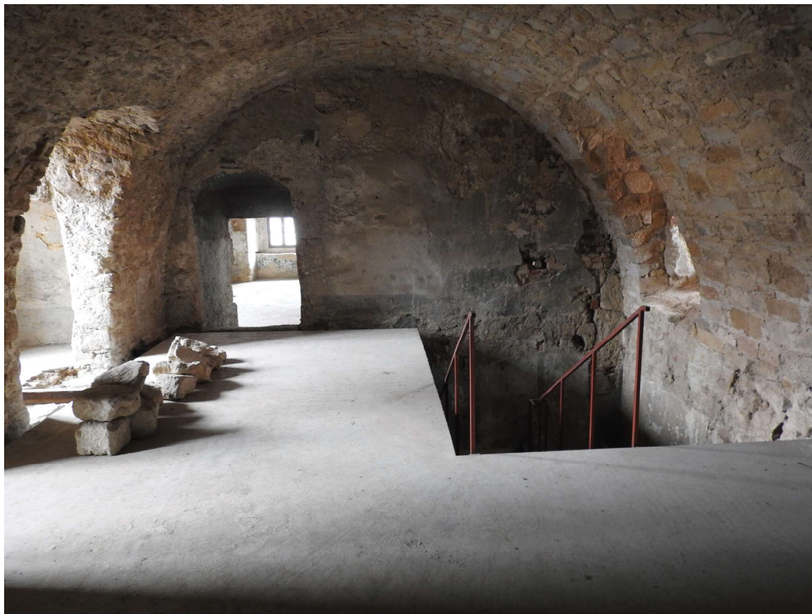
Obr. 4. Hrad Ústěck, obnova stropů paláce. Foto: Stanislav Flesar, 2016.

Havarijní stav objektů si vyžádal doměření objektu, 12 zpracování stavebně technického průzkumu skutečného stavu 13 a v předstihu dokumentaci pro okamžité zahájení zajišťovacích prací. Jednalo se především o povrchový průzkum všech přístupných prostor areálu hradu, kde byly sledovány jak nosné konstrukce, tak i povrchy, materiály a jejich současný fyzický stav. 14 Zeď byla postupně nově dostavěna z pískovcových štuků na betonovou mazaninu a klenbu nahradil betonový torkret. Součástí projektových prací byl i archeologický výzkum, který přispěl k poznání stavební podoby hradu. 15 V 90. letech 20. století byl palác zakryt novou provizorní šikmou pultovou střechou z příhradových nosníků. Při vyklizení nádvoří po stavbě severní zdi paláce a provizorní střechy byla demolována část hospodářských budov severního křídla hradu, a to bez řádné dokumentace a zrušení prohlášení za kulturní památku. Následky havárie a nutnost jejich odstra-