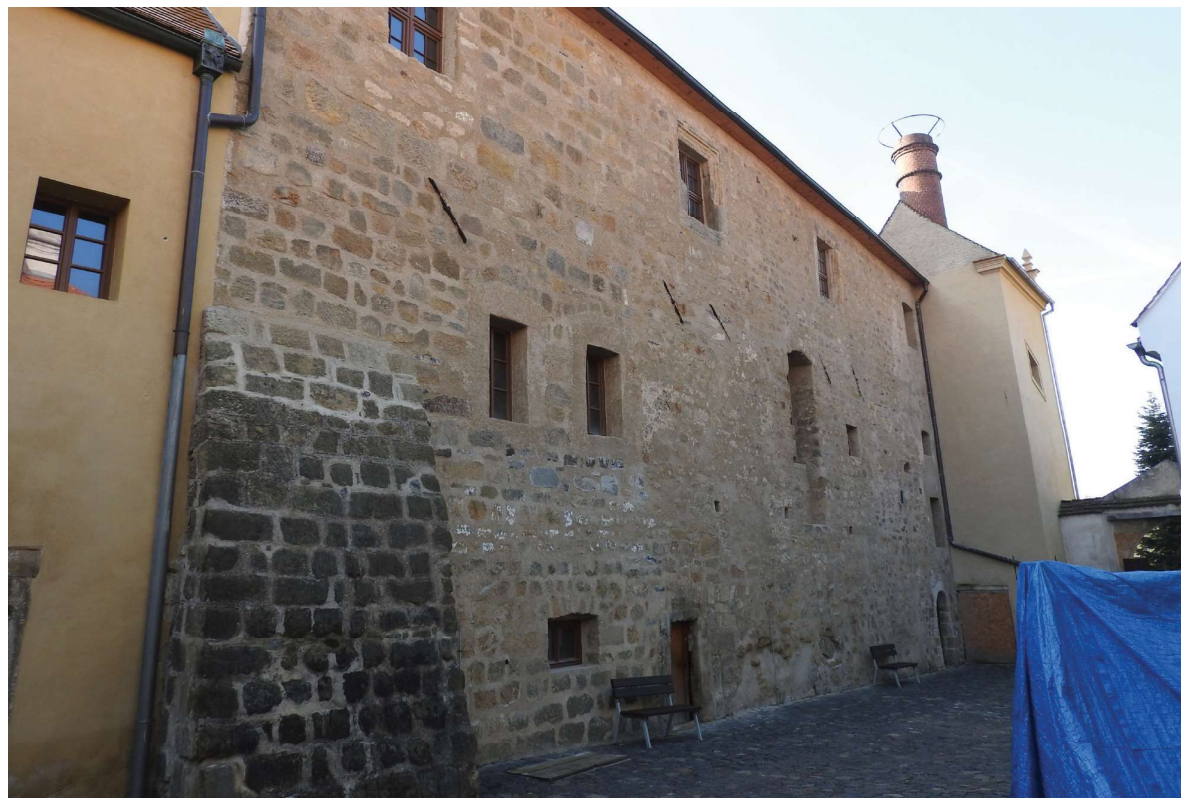
Obr. 9. Hrad Ústěk, stav paláce v roce 2016.