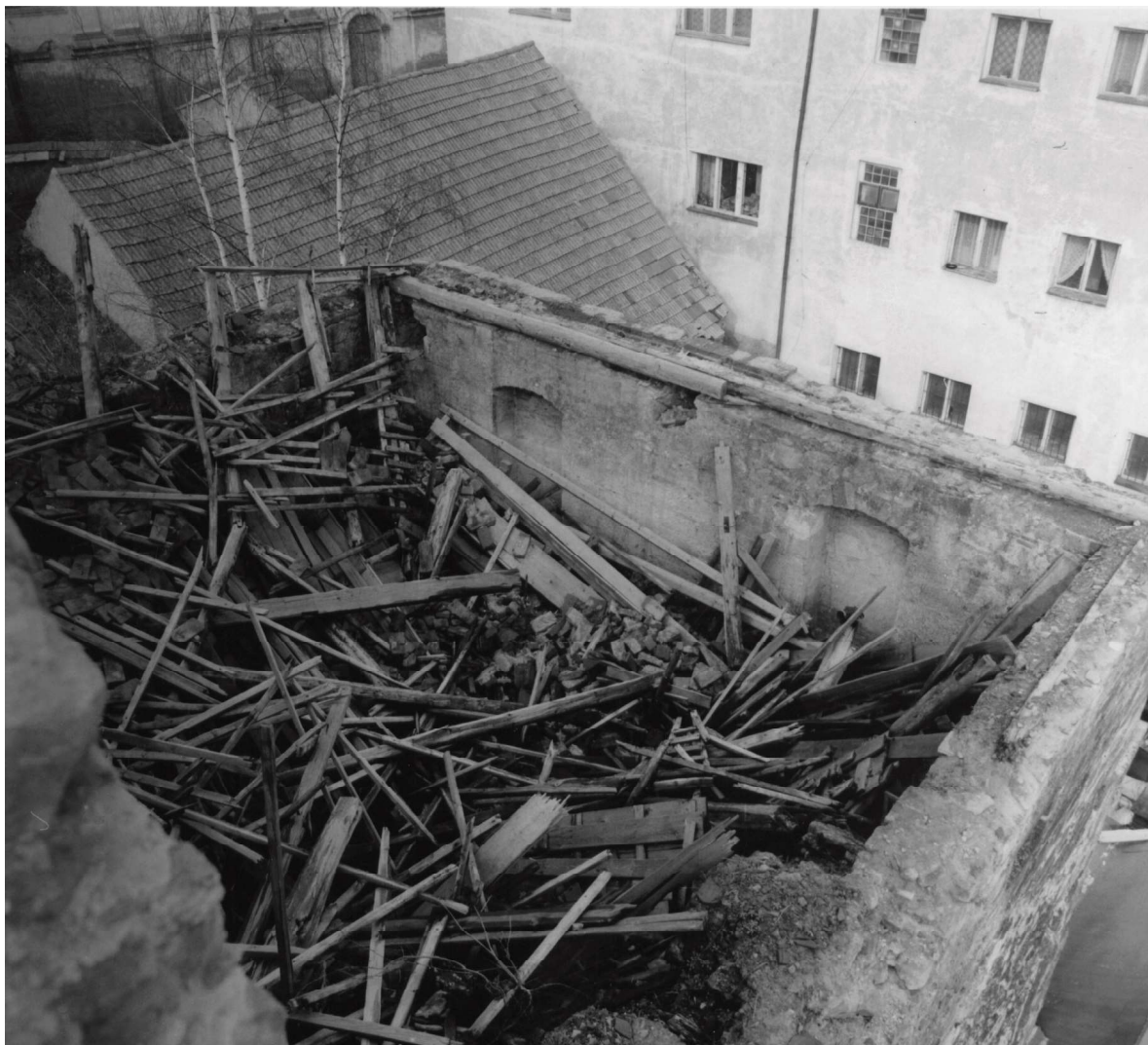
Obr. 5. Hrad Ústěk, zřícená střecha a stropy paláce v roce 1989.

být rekonstruován jako kulturně společenské středisko, které by zahrnovalo obřadní síň, klubové místnosti, výstavní síň apod. 18 V roce 2003 byl zpracován projekt záchrany kulturní památky jako podklad pro čerpání prostředků z Ministerstva kultury ČR z Programu záchrany architektonického dědictví (PZAD). 19 V roce 2005 je obnova hradu zahrnuta do tohoto programu a Město Ústěk získává finanční prostředky z PZAD MK ČR na statické zajištění hradního paláce. V souvislosti se zařazením do PZAD bylo nutné zpracovat stavebně historický průzkum 20 a dokumentaci k obnově hradního paláce, 21