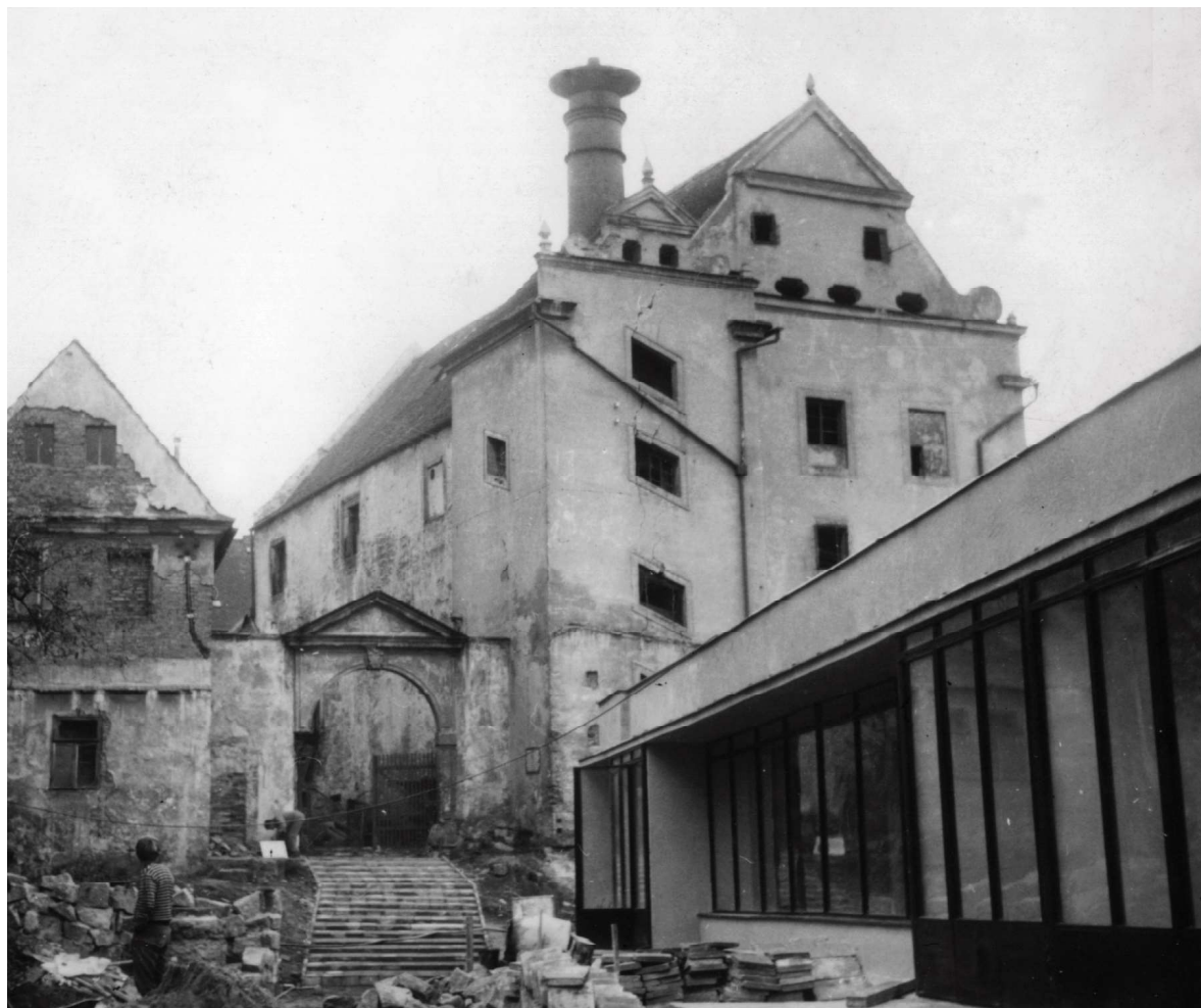
Obr. 1. Hrad Ústěk, celkový pohled na hrad v roce 1968.

Ústěk je sídelním celkem specifických hodnot s dochovaným čistým půdorysným typem ulicové zástavby sledující hřebben pískovcového ostrohu a s dochovaným systémem opevnění s hradem a tzv. Pikardskou věží, které využívá a dotváří přirozené podmínky obrany, dané reliéfem krajiny. Ústěcký hrad (č. p. 3, st. p. č. 10, k. ú. Ústěk – Vnitřní Město, rejstříkové číslo Ústředního seznamu kulturních památek ČR 43195/5-1892) tvoří dvojdielná dispozice, která respektuje systém městské parcelace, do něhož byla vložena. Na severu tvořila část fronty náměstí, na jihu byla do opevnění zapojena čtverhranná obytná věž. „Ústěk je vzácným příkladem malého hradu vloženého do města dodatečně a současně jedním z mála hradů zbudovaných ve městech v době Václava IV. Jeho palác se svou podobou a vybavením blíží velké tvrzi. V této kvalitativní úrovni