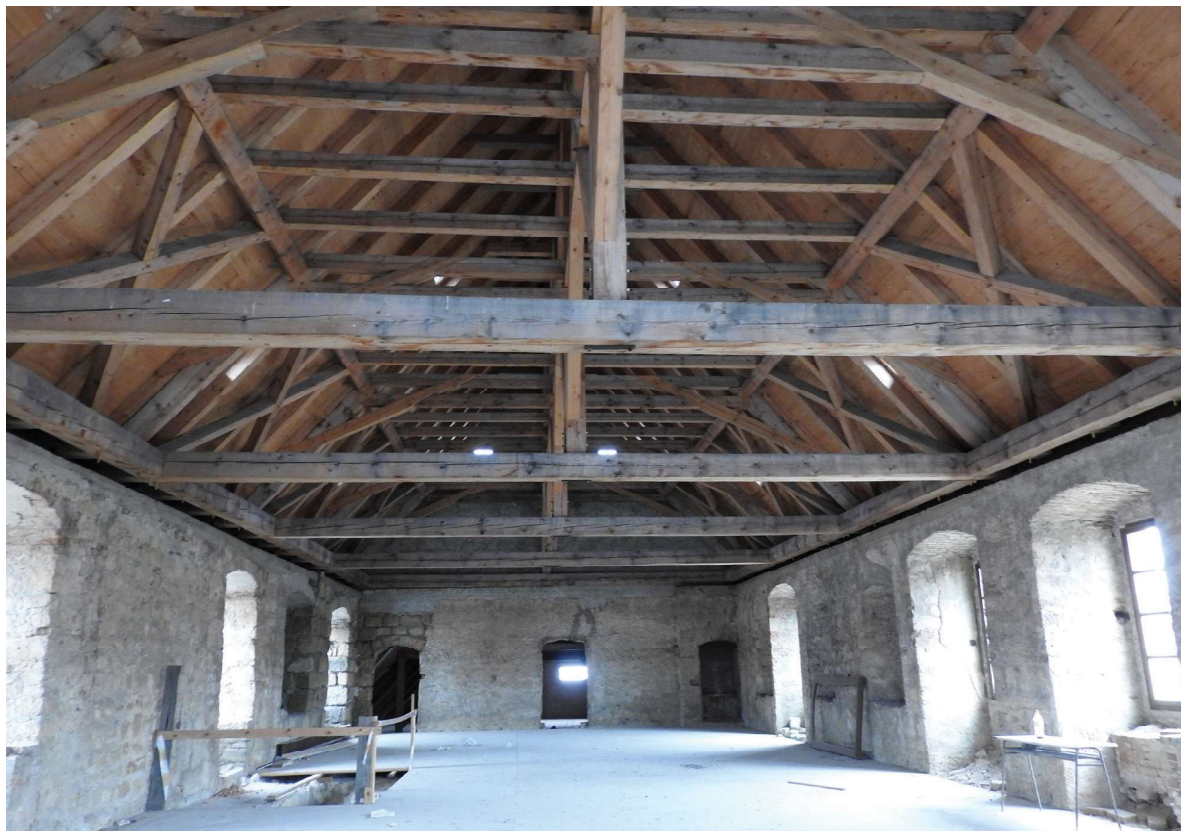
Obr. 8. Hrad Ústěk, kopie barokního krovu. Foto: Stanislav Flesar, 2016.