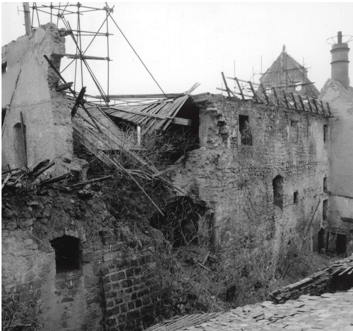
Obr. 6. Hrad Ústěck, stav paláce v roce 1989.

před jeho zříčením. V listopadu 2008 byla střecha dokončena a v roce 2009 dozděny boční štíty. Celkové rozpočtové náklady byly 12,2 mil. Kč. Akce „Městský hrad Ústěck – 3. etapa“ byla finančně zajištěna dotací Ministerstva financí v rámci Finančního mechanismu EHP (tzv. Norské fondy). Změna kurzu devizových prostředků (koruna vůči euru) v roce 2008 poškodila příjemce dotací a výrazně snížila rozpočtové náklady. Přesto byla akce úspěšně dokončena, ačkoli dotační prostředky musely být v následujících letech vráceny z důvodů nejasností kolem výběrového řízení. V létě 2012–2013 proběhl z důvodů následné realizace inženýrských sítí záchranný archeologický výzkum nádvoří, 24 který posunul nejstarší osídlení lokality na přelom 9. a 10. století a na jiném místě hradu odhalil pozdně středověkou sušárnu a zásobnici obilí. Následně byly realizo-