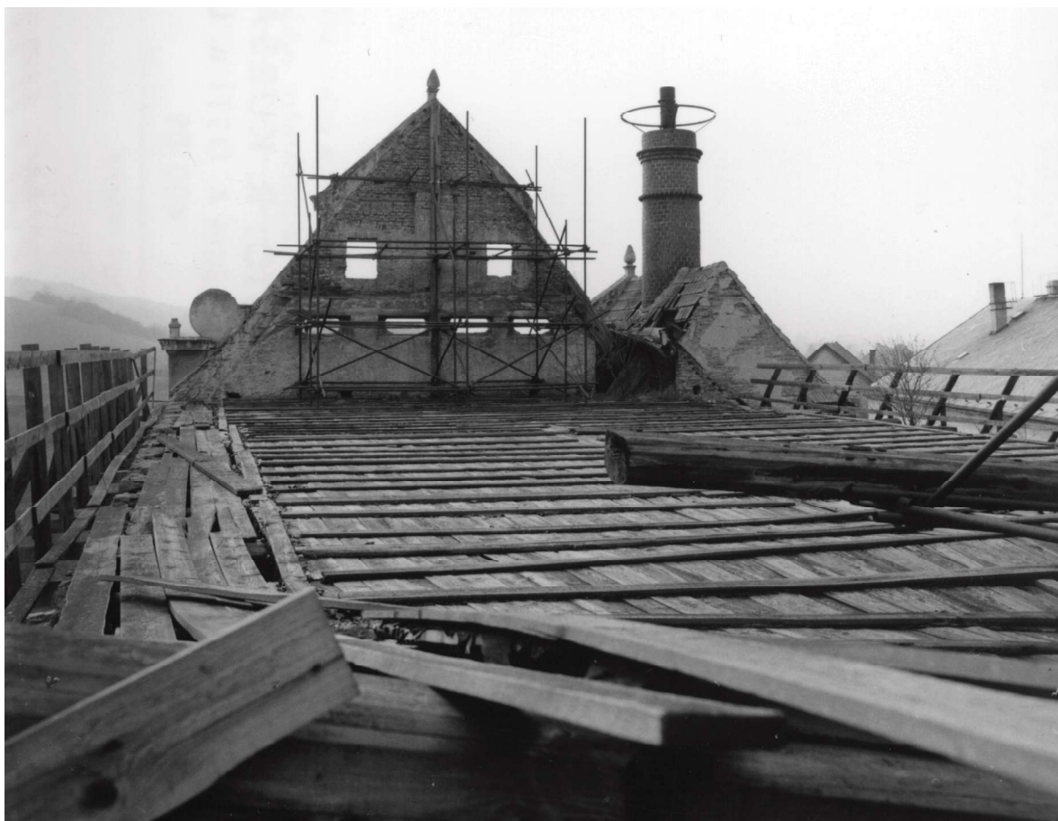
Obr. 9. Hrad Ústěck, provizorní zastřešení v roce 1989.

v současné době nejasnosti. Bylo ustoupeno od nereálného projektu využití pro společenský sál, obřadní síň a restauraci s teplou kuchyní. Tato koncepce je v současných podmínkách pro město nerentabilní. Jako reálné se jeví vytvoření několika na sobě nezávislých expozic (husitství na Ústěcku, hrady Českolipska, sezónní výstavní prostor, chmelařství a pivovarnictví na Ústěcku). Pro přístup do hradního paláce bude obnoven vstup ze zbořené schodiškové věže, který je zahlouben cca 80 cm pod niveletou nádvoří. K areálu hradu byl připojen (městem dokoupen) i objekt č. p. 80 pod arkádovou lávkou. Snahou města je získat solventního investora pro zbudování malého pivovaru, provozu, který zde tradičně býval. Náklady na opravu areálu od začátku čerpání dotací v roce 2005 si vyžádaly finanční prostředky ve výši cca 30 mil. Kč, nepočítáme-li navrácenou dotaci ve výši 10 mil. Kč.