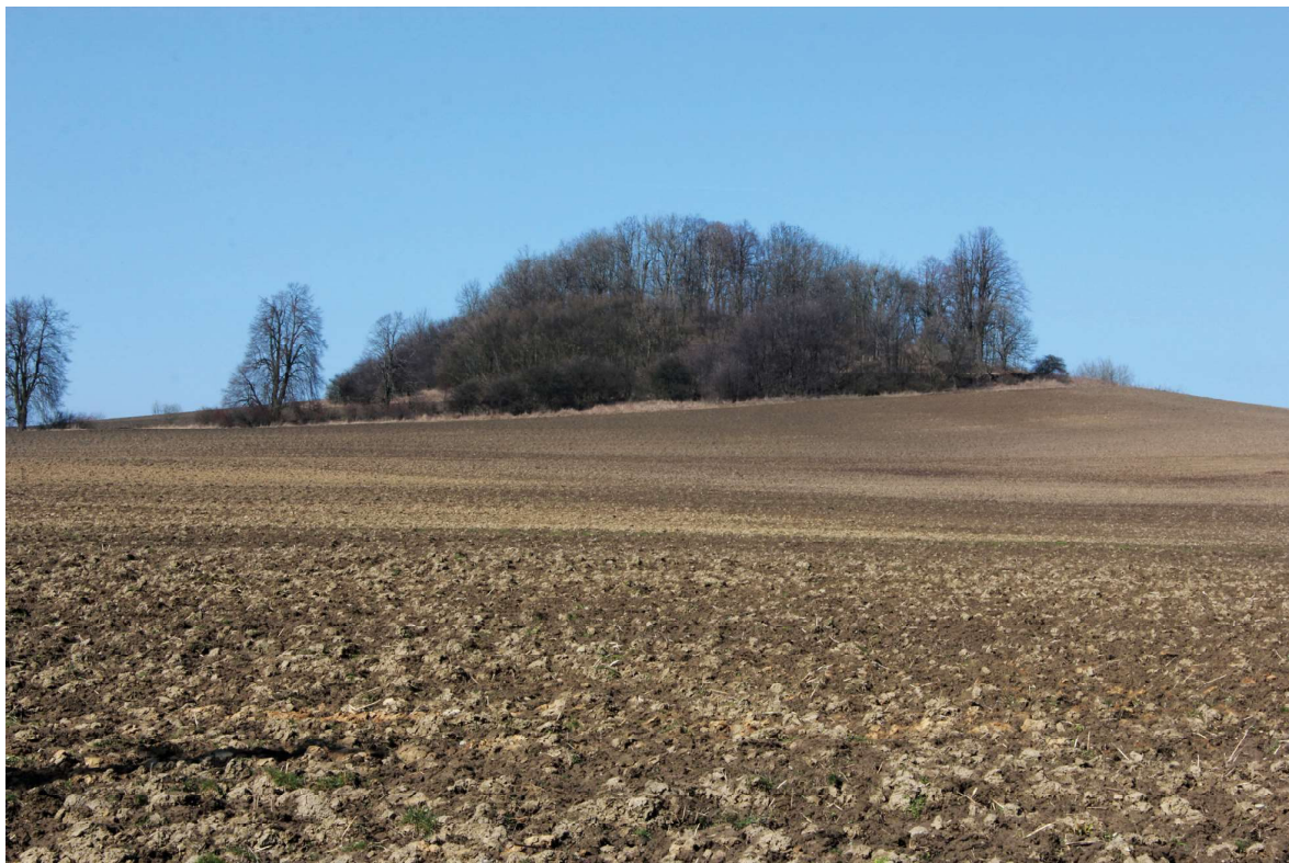
Obr. 2. Zarostlé návrší Gottesberg u Verneřic, o. Děčín, na kterém do roku 1975 stával poutní kostel Nejsvětější Trojice. Pohled od východu. Foto: Tereza Peerová, 2016.

centrální větší kaple obklopené ambitem se třemi menšími kaplemi patřilo k jedinečným příkladům krajinně exponované symboliky tajemství Nejsvětější Trojice v architektuře; symbolika trojedinosti se odrážela i v řešení průčelí s dominantou tří věžiček, vyšší střední nad vstupní předsíní a dvěma nižšími nad bočními kaplemi, přičemž trojice věžiček byla v sestupné řadě patrná i z bočních pohledů. Autor architektonického návrhu, ani provádějící stavitel znám není. Trojiční symbolika nebyla v sakrální architektuře středoevropského baroka nikterak ojedinělá, připomenout lze některé poutní kostely trojičního zasvěcení, např. na Glasbergu u Waldsassenu s obvodovým ambitem postavený dle návrhu G. Dientzenhofera v letech 1685–89 a vycházející z principu půdorysného překryvu tří kruhů, jejichž segmenty se ve formě apsid připojují k centrále trojúhelníkovitého půdorysu či poněkud obdobně, ovšem s centrálou kruhového půdorysu a bez ambity koncipovaný