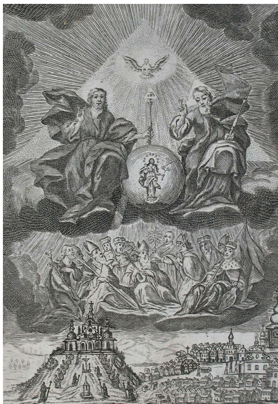
Obr. 6. Historická mědirytina (sign. Birckhardt) Verneřic a poutního areálu na Gottesbergu z doby po roce 1737.

ující 15 tajemství svatého utrpení Krista ke spasení všech živých i mrtvých duší s denními plnomocnými odpustky. Závěrečné 15. zastavení představovalo v duchu dobové tradice nepochybně Boží hrob. 11