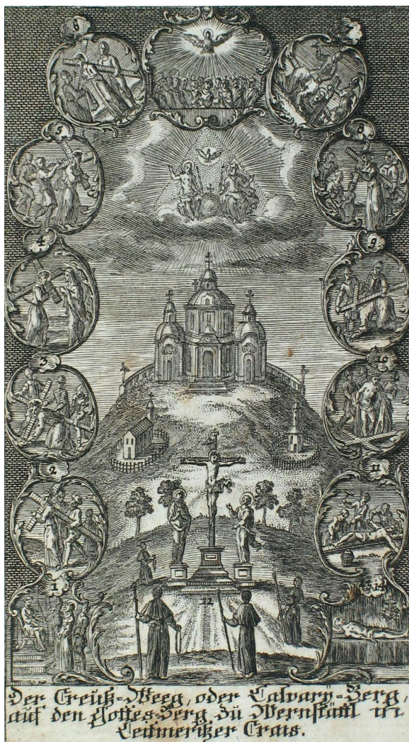
Obr. 5. Historická mědirytina starší fáze podoby poutního areálu na Gottesbergu z doby mezi lety 1734–36.

keré vykazují již rokokově prokrajované asymetrické linie a byly nepochybně poněkud pozdějším doplňkem.