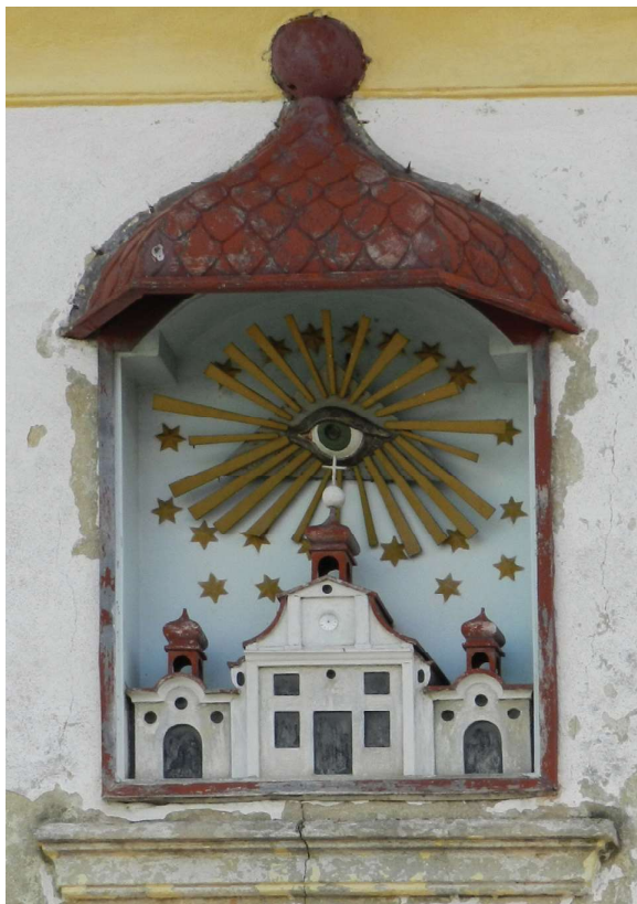
Obr. 8. Verneřice, okr. Děčín, dům č. 152, detail štukového průčelí kostela Nejsvětější Trojice na Gottesbergu v nice štítu.

předobrazy převážně mariánské, ale i christologické tematicky v malovaných medailonech kopule presbytáře kostela z doby okolo roku 1710, ale také v netradičních třech časově významových rovinách na cyklu lunetových obrazů ze života sv. Jana Nepomuckého z 1. třetiny 18. století v ambitech areálu. Zde se jedná o předobrazy života spojeného s Bohem, které slouží jako paralela k výjevům příkladného křesťanského života sv. Jana Nepomuckého. 19