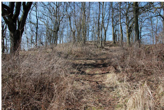
Obr. 3. Dnešní stav návrsí na Gottesbergu u Verneřic. Pohled z bývalé přístupové cesty od východu.