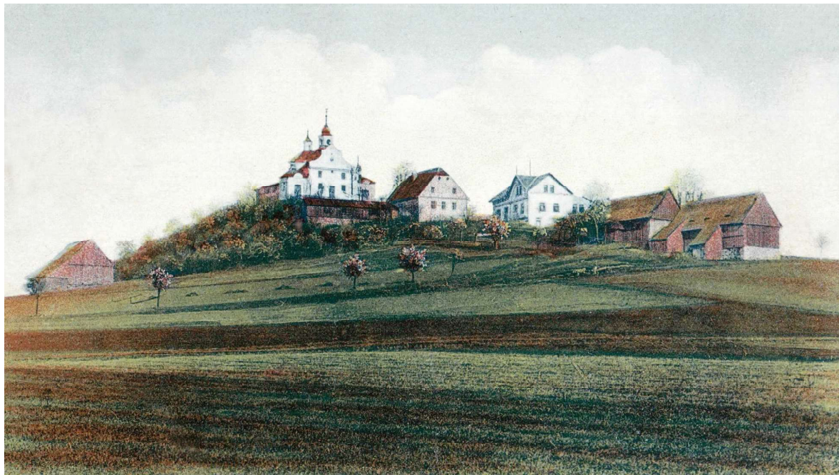
Obr. 1. Gottesberg, stav na počátku 20. století. Kolorovaná pohlednice