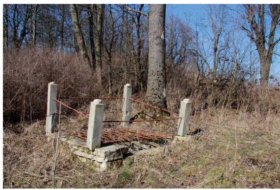
Obr. 4. Pozůstatek bývalé historické studny na východním úpatí Gottesbergu.

nižších kvadratických kaplí k větší kruhové centrále vyjadřující tak dobovým výrazem řečeno „uno in trino“. Nelze přitom vyloučit hypotézu, že volnou inspirací krajinyotvorného i průčelního řešení, ovšem ve výškově „převrácené“ variantě, mohl být o čtvrtstoletí starší komplex kaplí Kalvárie nad obcí Ostré u Úštěka.