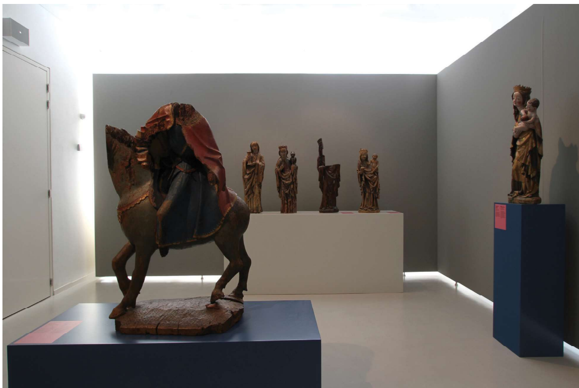
Obr. 2. Sv. Martin z Kleinschönau/Sieniawka, Horní Lužice, druhá polovina 15. století. V pozadí sochy světců a madony z Kleinschönau/Sieniawka, 1. polovina 15. století. Vpravo Madona z kostela Panny Marie ve Zhořelci, kolem 1450.

(od 1361), kriticky popisující vztah Karla IV. k Žitavě. Torzálně zachovaný soubor pozdně krásnoslohých, řemeslně zpracovaných soch z Kleinschönau/Sieniawka, uložený v žitavském muzeu, silně kontrastoval s Madonou z kostela Panny Marie ve Zhořelci, v českém prostředí dobře známou, jež přesně replikuje Madonu od plzeňských františkánů z 30. let 15. století. Za přesným použitím plzeňské předlohy mohly stát různé, snad i kultické důvody. Nejasný zůstal důvod datace zhořelecké sochy, kterou autoři výstavy posunuli až do doby kolem roku 1450. K tomu lze poznamenat, že na výstavě nebyl vysvětlen znalecký klíč k datování uměleckých děl z období krásného slohu. Na jedné straně se objevuje překvapivě časná datování Madony ze Sytové (poslední čtvrtina 14. století), která bude spíše slezským dílem z počátku 15. století, a na straně druhé se objevuje překvapivě pozdní datování kvalitní, opět spíše slezské, sv. Barbory z Grabštejna (1430–1450). Artefakty pocházející z první poloviny 15. století byly umístěny společně s mladšími díly i ve druhé části výstavy, situované na ochozy původního bazénu v libereckých lázních. Tento prostor již postrádal paneláž, výstavní barevnost se uplatnila pouze na modrých a bílých soklech a především na růžové výstavní grafice, která byla typická pro celou expozici. Na ochozech se uplatnily i velkoformátové fotografie architektury, ale především dva unikátní exponáty, oba díly vzácných rukopisů z dílny Mistra Hazmburského misálu – žitavské Vesperale