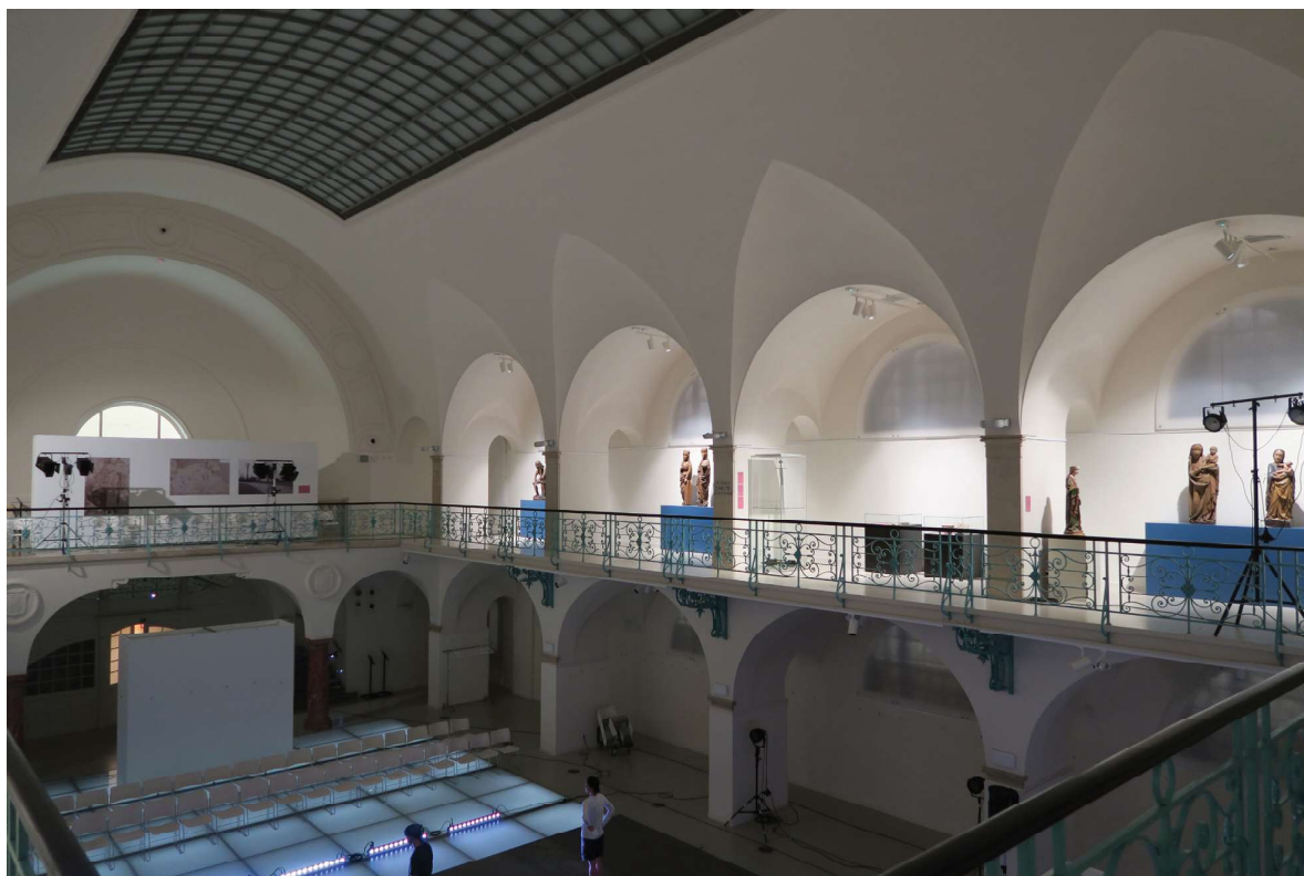
Obr. 1. Pohled do druhé části expozice výstavy Karel IV. na zakázané stezce.

UMĚNÍ MEZI LUCEMBURKY A JAGELLONCI V OBLASTI DNEŠNÍHO LIBERECKA A HORNÍ LUŽICE