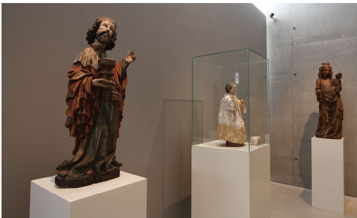
Obr. 5. Sv. Král z kláštera St. Marienstern, Horní Lužice, kolem 1430; Jezulátko z kláštera St. Marienthal, Mistr Michelské madony – dílna, Praha, kolem 1340–1350; Madona z Roesgerovy sbírky – Museum Budyšín, Horní Lužice 1370–1380.