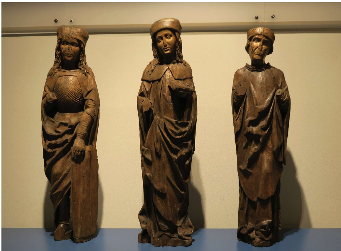
Obr. 4. Popisek: sv. Václav, sv. Vít a sv. Vojtěch (?) ze skříně oltářního nástavce v Bertsdorfu u Žitavy, Horní Lužice, kolem 1510.