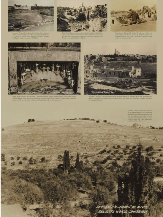
Obr. 3. Ukázka panelu výstavy Cesta kolem světa – panel věnovaný Izraeli, v době uskutečněné cesty se ještě jednalo o Britský mandát Palestina.

Ulice v Jeruzalémě. V pozadí je chrám Dávidův. Na přední straně je chrám Dávidův.