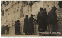
Jeruzalém. V pozadí je chrám Dávidův. Na přední straně je chrám Dávidův.