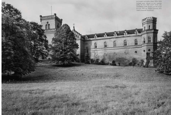
Obr. 1. Ukázka panelu výstavy Cesta kolem světa – fotografie z cest hraběte Lažanského z roku 1929 – úvodní panel informující o životě a rodině hraběte Prokopa Lažanského.