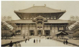
Ulice v Tokiu. V pozadí je chrám Tenmáe. Na přední straně je chrám Kojáči. V pozadí je chrám Kojáči. V pozadí je chrám Kojáči.