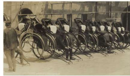
Ulice v Tokiu. V pozadí je chrám Tenmáe. Na přední straně je chrám Kojáči. V pozadí je chrám Kojáči.