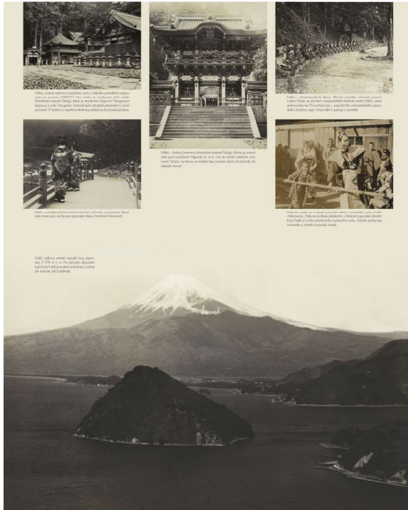
Obr. 2. Ukázka panelu výstavy Cesta kolem světa – panel věnovaný zemi vycházejícího slunce – Japonsku.

Ulice v Tokiu. V pozadí je chrám Tenmáe. Na přední straně je chrám Kojáči. V pozadí je chrám Kojáči.