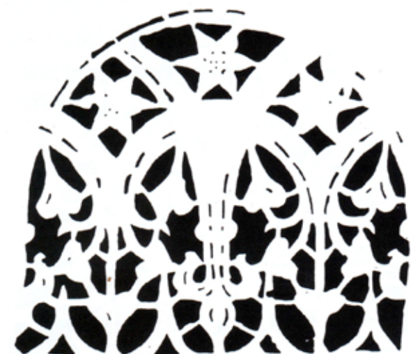
Obr. 1a. Kružba, 2. polovina 15. století, šablonová malba, Podještědské muzeum, restaurátorská kopie skříňe. Foto: Eva Csémyová, 2017.