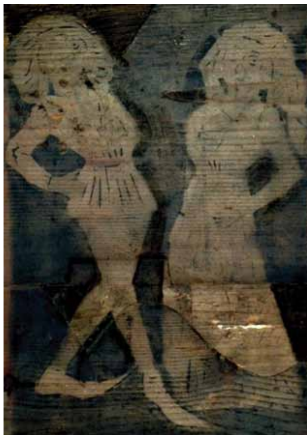
Obr. 4b. Galantní pár, 1. polovina 16. století, šablonová malba, Etzoldshain, kostel sv. Martina, fragment zábradlí empory.

dou barevného soutisku s využitím bílé, červené, modré, zelené a žluté barvy.