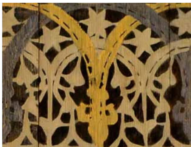
Obr. 1b. Kružba, počátek 16. století, šablonová malba, Kirchgattendorf, patronátní lavice.

a brokátové vzory, variace architektonických kružeb ( obr. 1a ), a dále se setkáme s motivem novozákonní assumpty a bernardinským sluncem s christogramem IHS. Spíše výjimkou je v rámci šablonové malby hojný výskyt zoomorfních námětů, které jsou zastoupeny motivem pádicího jelena, draka, gryfa ( obr. 2a ) a výjevem tvořeným párem dvounohých zvířat s dlouhými, vzájemně propletenými krky, která mezi svými hlavami s drobnými růžky a nakročenýma nohama přidržují dvě královské koruny ( obr. 3a ). 7 Výčet završuje v rámci šablonové malby rovněž neobvyklý motiv tančícího galantního páru ( obr. 4a ).