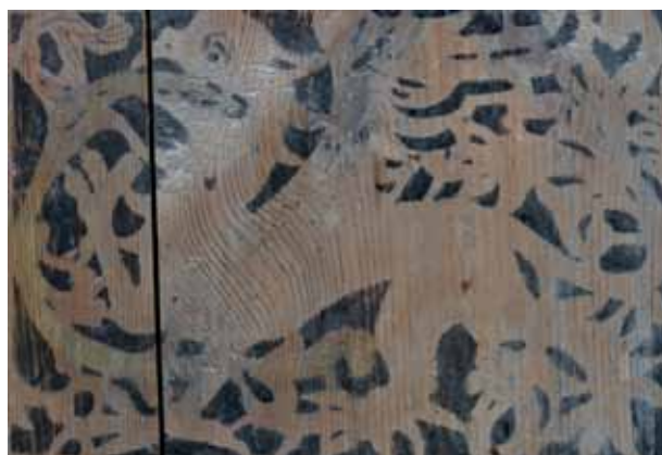
Obr. 2b. Gryf, počátek 16. století, šablonová malba, Kirchgattendorf, patronátní lavice.

dovy do období konce 15. století. 8 Plocha stropu je lištami rozdělena do deseti podélně orientovaných pásů, z nichž každý představuje jedno výzdobné pole dekorované vždy dvěma nekonečnými šablonovými motivy tak, že jeden z nich tvoří středový pás lemovaný po obou stranách druhým motivem. K výzdobě stropu bylo užito 14 různých šablon nejčastěji s geometrickými, architektonickými nebo vegetabilními náměty. Na několika místech je pak nekonečný průběh středového pásu přerušen a jsou do něj vsazeny otisky šablon, s nimiž se setkáváme na skříni z Českého Dubu – dvojice tvorů s propletenými krky ( obr. 3b ), gryf, lev ( obr. 5a ), a dále pak motiv dvojice draků s propletenými krky.