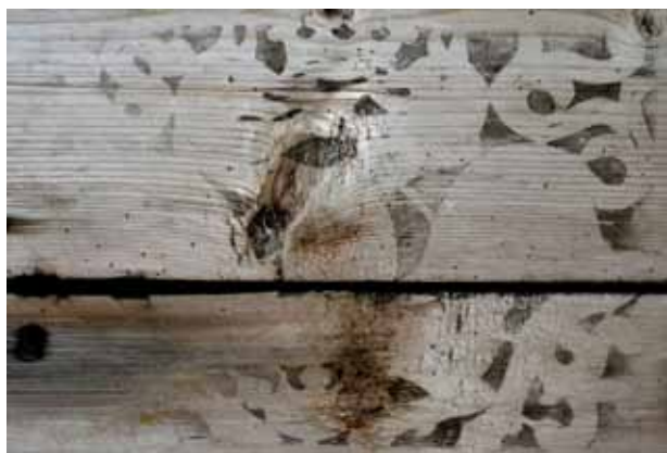
Obr. 3b. Dvojice tvorů s propletenými krky, konec 15. století, šablonová malba, Oberndorf, hřbitovní kaple při kostele Nanebevzetí Panny Marie, strop.