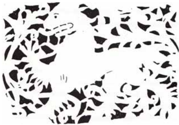
Obr. 5a. Lev, konec 15. století, šablonová malba, Oberndorf, hřbitovní kaple při kostele Nanebevzetí Panny Marie, strop.