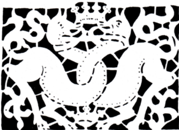
Obr. 3a. Dvojice tvorů s propletenými krky, 2. polovina 15. století, šablonová malba, Podještědské muzeum, skříň. Foto: Eva Csémyová, 2017.