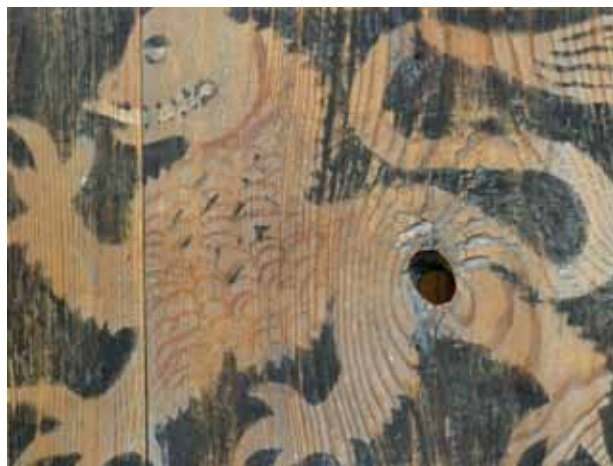
Obr. 5b. Lev, počátek 16. století, šablonová malba, Kirchgattendorf, patronátní lavice.

záklenků i korunních říms provedenou plochou řezbou variující motivy úponků s listovým, na dorsale jsou nad jednotlivými místy vyřezány kroužené či vegetabilní motivy, fantaskní náměty, cechovní znaky a erb donátorské rodiny.