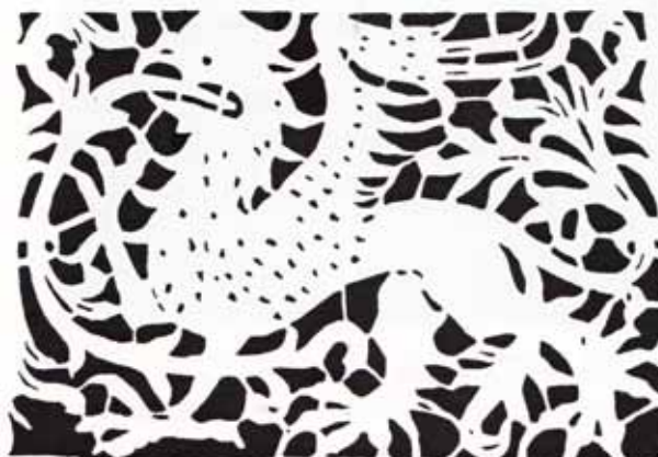
Obr. 2a. Gryf, 2. polovina 15. století, šablonová malba, Podještědské muzeum, skříň.