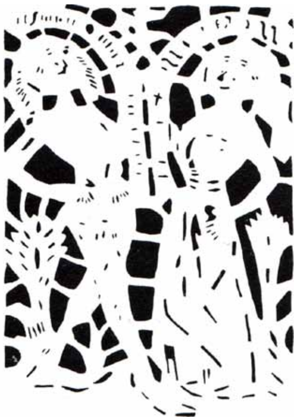
Obr. 4a. Galantní pár, 2. polovina 15. století, šablonová malba, Podještědské muzeum, skříň.

prvků interiéru. 13 Zatímco strop lodi se do dnešní doby i díky citlivě provedenému restaurátorskému zásahu realizovanému na přelomu 80. a 90. let minulého století dochoval ve velmi dobrém stavu, výzdoba zábradlí schodiště vedoucího na emporu a strop pod ní byly vážně poškozeny opakovanými přemalbami. Výmalba v chóru zcela zanikla spolu s výměnou stropu roku 1725. 14