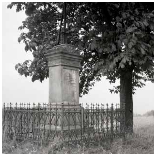
Obr. 10. Kříž z roku 1863 [5].