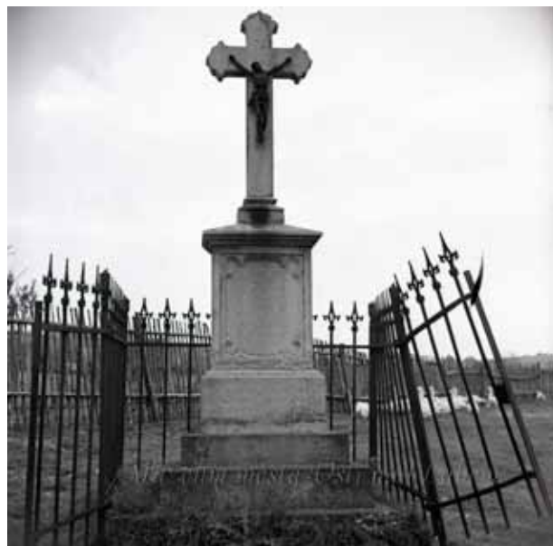
Obr. 6. Kříž od čp. 9 [3].