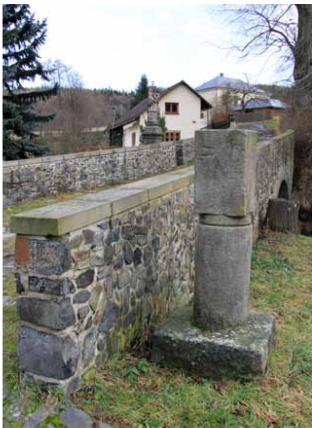
Obr. 13. Milník [8]. Foto: Martin Zubík, 2016.

Historie objektu: UPČ odhadují vznik objektu na konec 18. století. 69 Tato datace je nejspíše ovlivněna rokem 1756, kdy Marie Terezie zavedla rakouskou (vídeňskou) metrickou soustavu (platnou i pro České země), jejíž součástí je jako délková míra i tzv. rakouská míle (tj. 7 585,936 m), spíše nežli vcelku nevýrazným slohovým tvaroslovím objektu. Náš milník však byl osazen až roku 1851, v rámci výstavby okresní silnice, která v katastru obce Čermná probíhala s přestávkami v letech 1841 až 1861. 70 Silniční ukazatel („Wegweiser“) stál 12 zl. 30 kr. a za provedení nápisů zaplatila obec 2 zl. 30 kr. 71