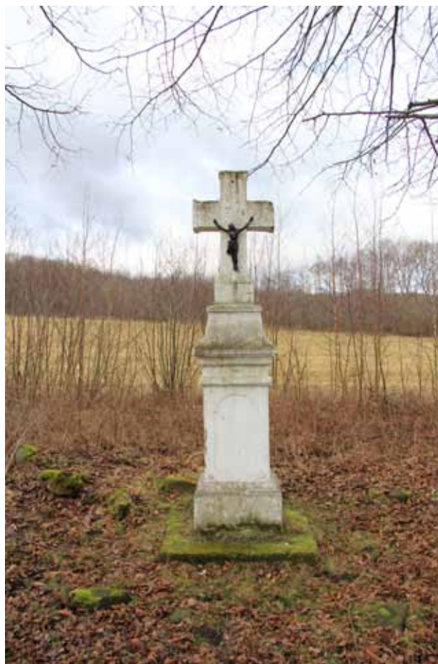
Obr. 11. Kříž u výjezdu na Mnichov [6]. Foto: Martin Zubík, 2016.

V roce 2012 se celý objekt nacházel v žalostném stavu, jednotlivé části podstavce byly rozkutané po okolí a kříž ztracený. Členové místního občanského sdružení „Přátelé Čermné“ vlastními silami a s finanční podporou grantů (např. dotačního programu Energie pomáhá společnosti CENTROPOL ENERGY, která poskytla 20 000,- Kč) 53 docílili toho, že 22. října 2012 se skvěl obnovený pomník na svém místě. Bohužel, zřejmě z důvodu finančního limitu, neakceptovali iniciátoři akce připomínku Národního památkového ústavu, aby osadili na vrchol podstavce některý replikovaný litinový kříž, nýbrž použili jednoduchý latinský kříž z oceli, který je ubohou, spíše jen symbolickou nežli estetickou náhradou a celkový dojem poněkud kazí. Rovněž nápisová složka pomníku byla upozaděna. 54