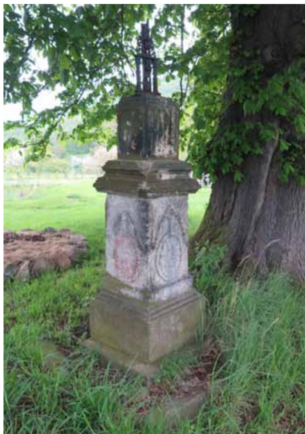
Obr. 7. Kříž od čp. 35, [4]. Foto: Martin Zubík, 2016.

Soupis z roku 1835 popisuje kříž takto: Číslo – 8; Název – Kříž; Na jakém pozemku – na pozemku Ferdinanda Höhne, sedláka z čp. 35; Zřizovatel – Ignatz Höhne, sedlák z čp. 35; Rok zřízení – Anno 1820; Způsob údržby (kdo je povinný, jaký fond a kde je složený) – Ferdinand Höhne, fond není; Nápisy – žádné; Místní název – Joxels Kreuz; Popis – Nový kamenný kříž včetně podstavce, ale sochařské provedení Spasitele je velice špatné, jinak je kříž velmi pěkný a trvanlivý. Blízko u obce. Ill. zastavení o prosebných dnech. 37