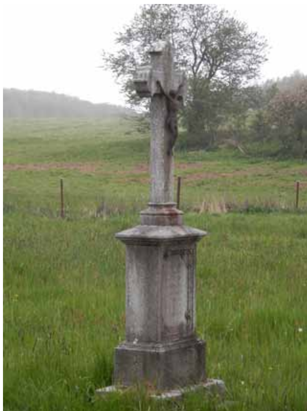
Obr. 5. Kříž od čp. 9 [3].

Povrchová úprava kamene je šedá bez známek polychromie. Korpus je na povrchu korodován. Dnešní stav nápisového pole nedovoluje přečíst původní text. Dle starší fotodokumentace kříž obklopoval kovový plot, dnes je umístěn uvnitř zahrady.