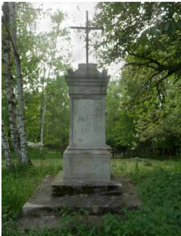
Obr. 9. Kříž z roku 1863 [5].