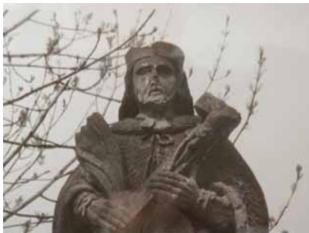
Obr. 2. Sv. Jan Nepomucký [1] – detail, Repro restaurátorská zpráva k areálu mostku se sochou sv. Jana Nepomuckého a milníkem z r. 1969 uložená pod signaturou 350/R ve sbírkách NPÚ ÚOP Ústí nad Labem.

Historie objektu: Autoři Uměleckých památek Čech kladou vytvoření této skulptury do druhé čtvrti 18. století, vlastní mostek pak do první čtvrtiny 18. století. 11 Souček uvažuje o datu 1813 jako o pozdější opravě již existující sochy. 12 O existenci sochy před rokem 1813 však není k dispozici žádný doklad. Pouze víme, že roku 1811 v podvečer strhla velká voda most u kostela. 13 Možná hypotéza také je, že povodní postižený mlynář Anton Hamann z čp. 32 nechal v roce 1813 na obnovený most postavit novou sochu protipovodňového