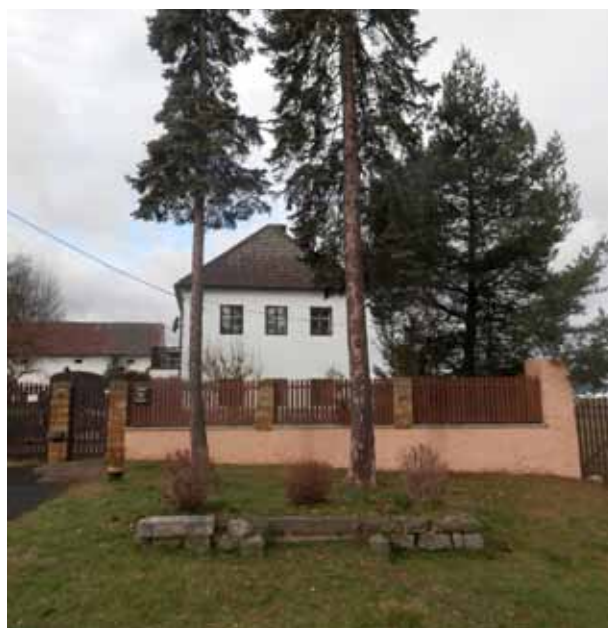
Obr. 16. Pomník současný stav [9].

Pomník padlým byl jako připomínka Němců odstraněn novými osídlenci buď krátce po jejich příchodu do obce po roce 1945, nejpozději však v roce 1946, kdy proběhlo několik akcí „vyklizení obce od zbytku nacismu“. 81 Uprázdňené místo po pomníku pak na podzim roku 1948 obsadil nový pomník (recyklací německého náhrobku), jehož určení nám není známé, nicméně bylo politické. (Srovnej např. s Pomníkem novoosídlencům z roku 1945 v blízkém Libouchci). Ze zápisu schůze Místního národního výboru: „Dále byl přijat návrh od KSČ, ohledně postavení pamětné desky. Že prý leží rosipaný