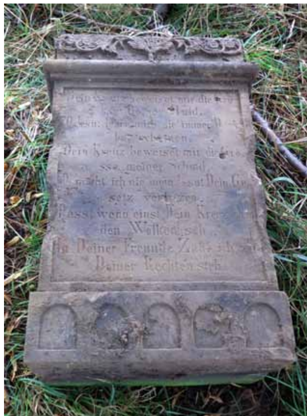
Obr. 3. Kříž od čp. 20 [2], Centrální část podstavce s nápisovým polem – přední strana. Foto: Martin Zubík, 2017.

Kvádr sloužící coby dolní část podstavce má na přední straně latinskou kapitálou vytesaný nápis s majuskulami provedeným chronogramem: Erectum / Anno / Domini Nostri Jesu Christi / MDCCLVIII. Překlad: „Vztyčeno léta našeho pána Ježíše Krista 1858.“