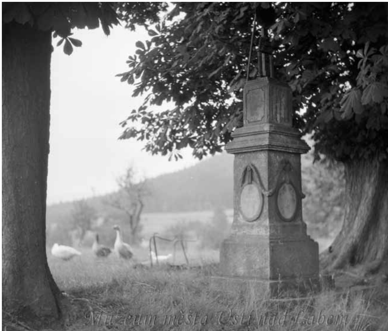
Obr. 8. Kříž od čp. 35 [4].

píše, že kříž zřídil Johann Christoph Höhne (1836–1815) 39 roku 1811, kdy šel se svou manželkou Rosinou (1744–1814) 40 do vojenskú a statek předal synovi Ferdinandovi Höhnemu (1780–1841). 41 Druhý starší syn se jmenoval Ignác (1775–1852). Ten