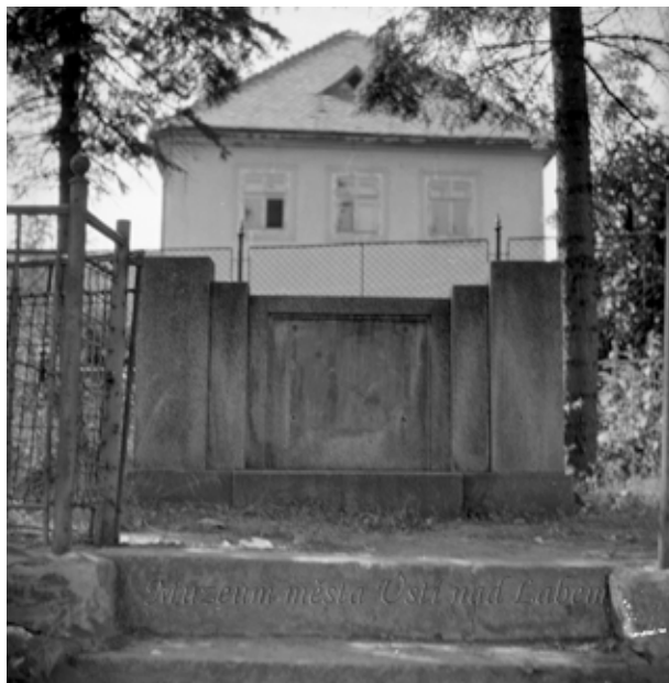
Obr. 15. Pomník z roku 1948 na místě pomníku padlých [9].