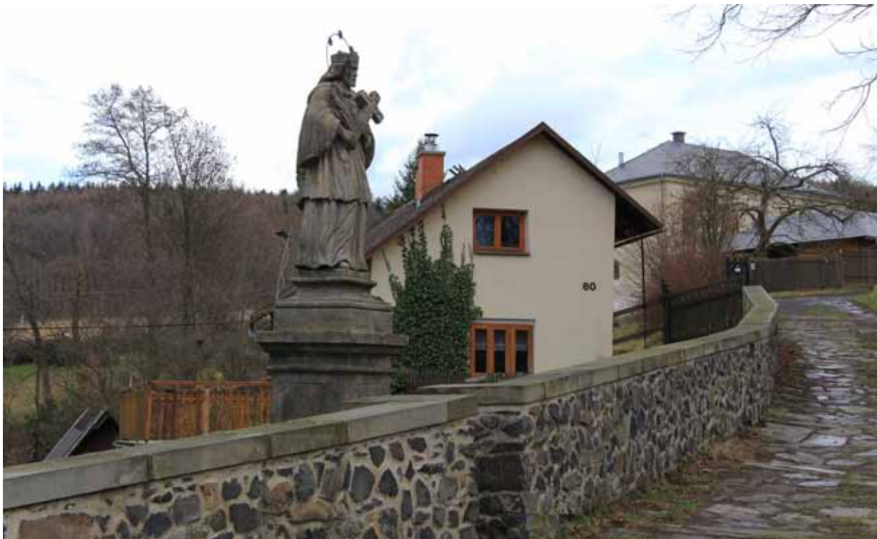
Obr. 1. Sv. Jan Nepomucký [1]. 2016.