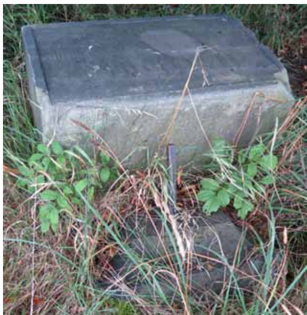
Obr. 4. Kříž od čp. 20 [2], Spodní část fundamentu s datací, v popředí hlavice s kovovým čepem.