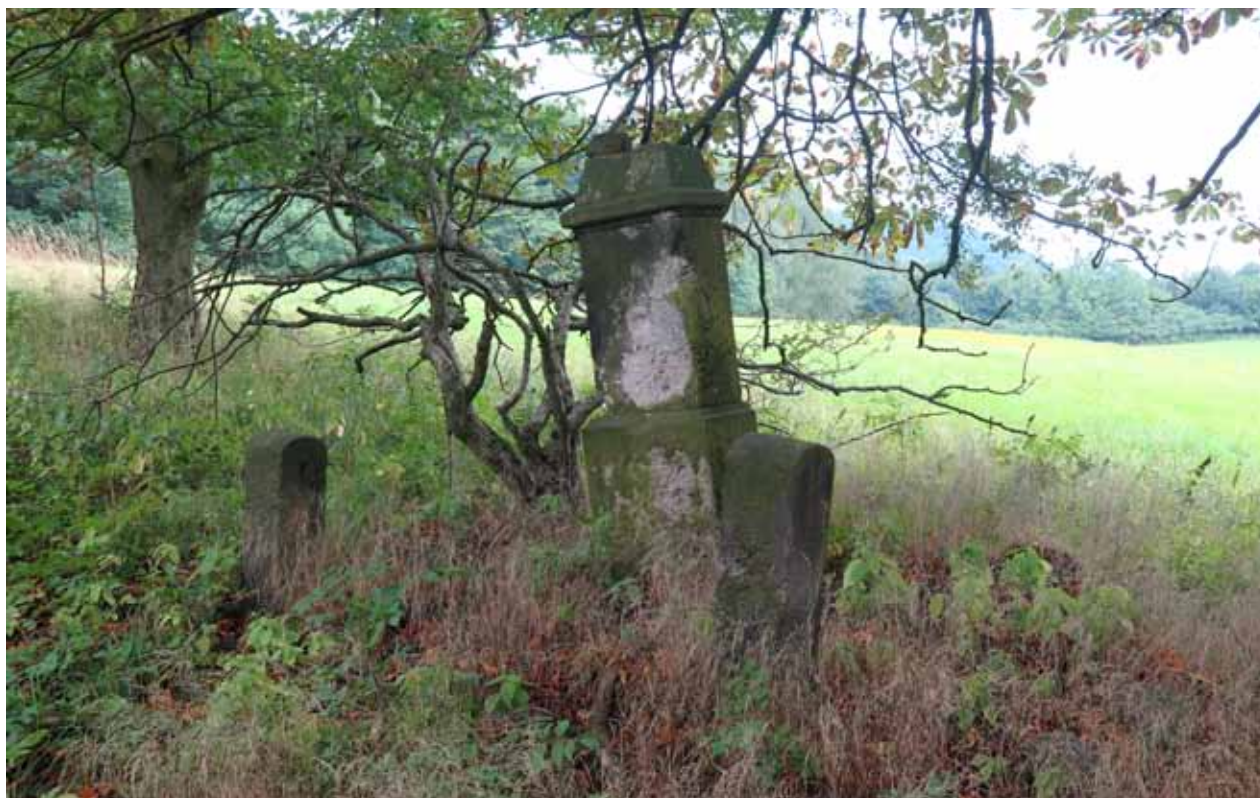
Obr. 12. Kříž z roku 1890, pod Liščím kopcem [7].

tvorí římsu kříže. Deska se směrem vzhůru kónicky zužuje. Na ní je položen hranolový soklový nástavec, do něhož je připevněn masivní latinský kříž. Z čelní strany je na kříži nepoměrně menší kovový korpus Ježíše Krista vyvedený v černé barvě.