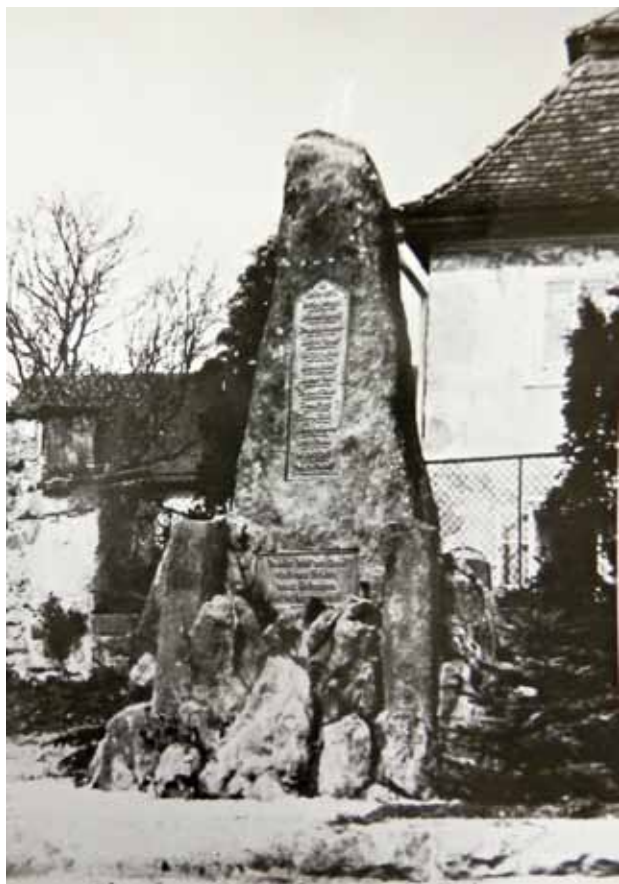
Obr. 14. Pomník padlým [9].

umístěná deska uvádí 14 jmen místních, kteří buď padli na bitevním poli, nebo zemřeli následkem válečných útrap. 77