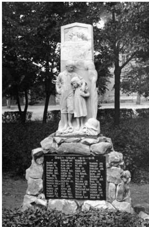
Obr. 16. Pomník padlým v Lenešicích z roku 1921 od Václava Hartmana, nedatováno (1921–1926).

pouze Kodetův pomník v Peruci. Samotný proces vzniku pomníků v českém vnitrozemí i v oblastech s převahou českých Němců je obdobný, pomníky zde vznikaly hlavně na základě iniciativy místních spolkových organizací. Obě skupiny zahrnují díla různé umělecké kvality, od běžné řemeslné produkce až po umělecká díla renomovaných autorů. Zřetelné odlišnosti můžeme ale vysledovat v ikonografické oblasti. V německém prostředí byla možnost veřejné nacionální prezentace z politických i legislativních důvodů omezená, proto zde byl pomník padlým vnímán zejména jako důstojná připomínka hrdinství a válečných obětí. Pro českou veřejnost však tyto monumenty představovaly výraznější prvek identifikace s novým státním zřízením a demonstrovaly její rozchod s předválečným režimem. Pomníky velké války zde tedy vedle pietní funkce přebírají i nacionálně identifikační roli pomníků 19. století a stávají se nedílnou součástí národní a kulturní prezentace první republiky.