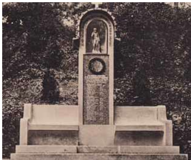
Obř. 2. Původní podoba pomníku padlým v Krásném Dvoře z roku 1919 od sochaře Seipa, (po roce 1919).

Vlastní pramenná základna pro dané téma je tedy značně torzální a roztržitá, zejména pro oblasti postižené odsunem německého obyvatelstva bylo velmi obtížné dohledat