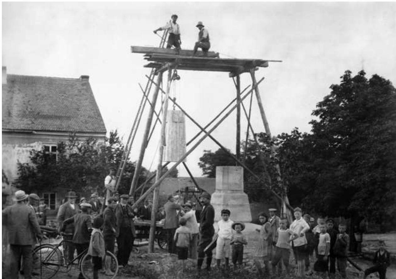
Obr. 1. Snímek ze stavby pomníku padlým v Chlumčanech, 1922.

V průběhu meziválečného období do veřejného prostoru měst a obcí vstoupil fenomén válečného pomníku. Kamenní svědkové obětí čtyř železných let velké války postupně doplnili četná náměstí, parky, venkovské návsi či hřbitovy a stali se nedílnou součástí našich sídel. Tyto pomníky lze vnímat jako pozoruhodně vrstevnaté monumenty, jejichž osudy odrážejí složitost historického vývoje naší oblasti v průběhu celého 20. století. Přesto meziválečná vzpomínková kultura velké války a problematika výstavby pomníků nebyly v severočeské oblasti dosud komplexně zhodnoceny a zpracovány. 1 Také