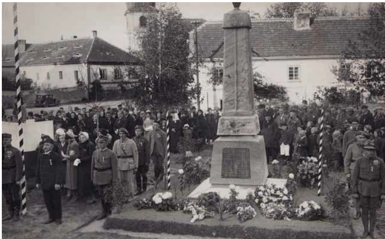
Obr. 4. Snímek ze slavnostního odhalení pomníku padlým v Panenském Týnci, 28. říjen 1924.

1923, 22 na jehož základě byly odstraňovány symboly spojené s habsbursko-lotrinskou dynastií. Některé z monumentů však před úplným zničením zachránila urychlená adaptace na pomník padlým velké války. Na Lounsku byl takto upraven v roce 1921 například jubilejní pomník Františka Josefa I. ve Velemyšlevisi. 23