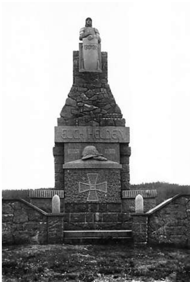
Obr. 9. Původní podoba pomníku padlým v Lubenci z roku 1923 od sochaře Johanna Adolfa Mayerla, nedatováno (po roce 1923).

Vedle tradičních konstrukčních materiálů jakými byly kámen, žula, pískovec a mramor se v meziválečném období začíná hojně užívat i umělý kámen běžný zejména v drobné funerální architektuře. Z umělého kamene byl vytvořen například pomník v Seménkovicích (1925) věnovaný majitelem místní cementárny nebo původní sochařská výzdoba pomníku v Telčích (1925). 39 Zkušenost dvou desetiletí exteriérového užívání umělého kamene však naznačila úskalí trvanlivosti a složitosti oprav tohoto materiálu, který již nebyl po druhé světové válce ke stavbě pomníků doporučován.