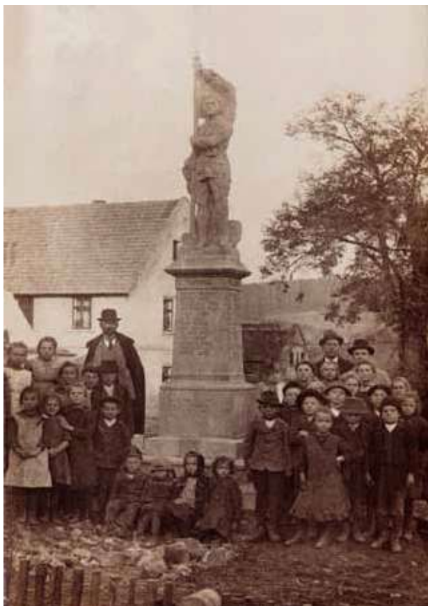
Obr. 3. Pomník padlým ve Vinařicích z roku 1920 zhotovený firmou Vytvar a Novák, nedatováno (1920–1925).

a řadě dalších severočeských měst, ale nebyly tyto stavební záměry do konce války naplněny a pietní místa se omezila jen na čestné hroby a hřbitovní kenotafy.