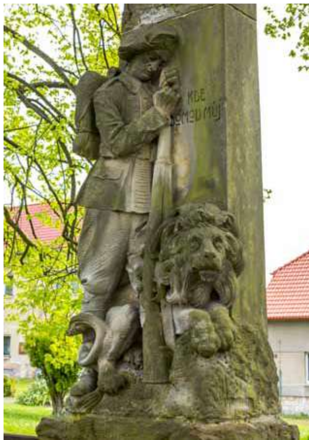
Obr. 6. Socha legionáře se lvem na pomníku v Nové Vsi z roku 1926 od Václava Hartmana, 2017.

Pomyslným vrcholem uzavírajícím realizaci pomníku bylo jeho slavnostní odhalení. Téměř vždy probíhalo za účasti míst-