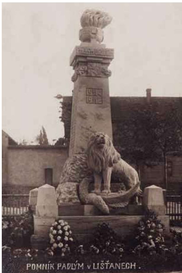
Obr. 12. Pomník padlým v Lištanech z roku 1922 zhotovený podle vzoru kamenickým mistrem Erazimem Sobeckým ze Solce, září 1922.

například pomníku padlým v Hlubanech. V případě pomníků německé provenience převládá typ přílby rakousko-uherské armády, tzv. rohatky. V prostoru s převahou česky hovořícího obyvatelstva se objevují rohatky také (Lenešice, Jimlín), ale zdařile jim konkuruje politicky vhodnější spojenecká přílba typu Adrian a její odvozeniny s charakteristickým středovým hřebenem (Vlčí, Cítoliby). Vojenskou výzbroj na pomnících dále zastupují dělové koule nebo oblíbené dekorativní sloupky ve tvaru dělových nábojnic.