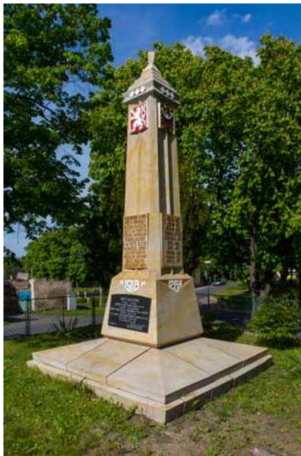
Obr. 18. Pomník padlým v Chlumčanech z roku 1922 od architekta Emila Dufka, 2017.