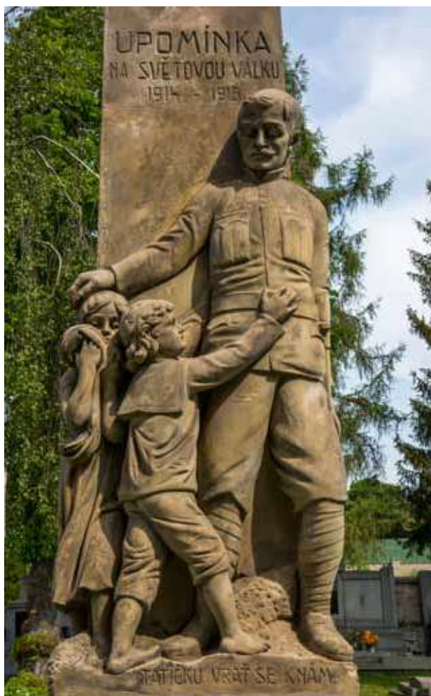
Obr. 7. Sousoší otce loučícího se s dětmi na pomníku v Zeměchách z roku 1926 od Václava Hartmana, 2017.

v obcích s převahou německého obyvatelstva býval poslancem Národního shromáždění za německé agrárníky Bund der Landwirte 34 Georg Böllmann (1866–1933), původně rolník z Vysočan.