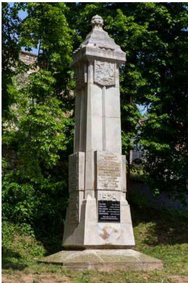
Obr. 17. Pomník padlým v Hřivčích z roku 1924 od architekta Emila Dufka, 2017.