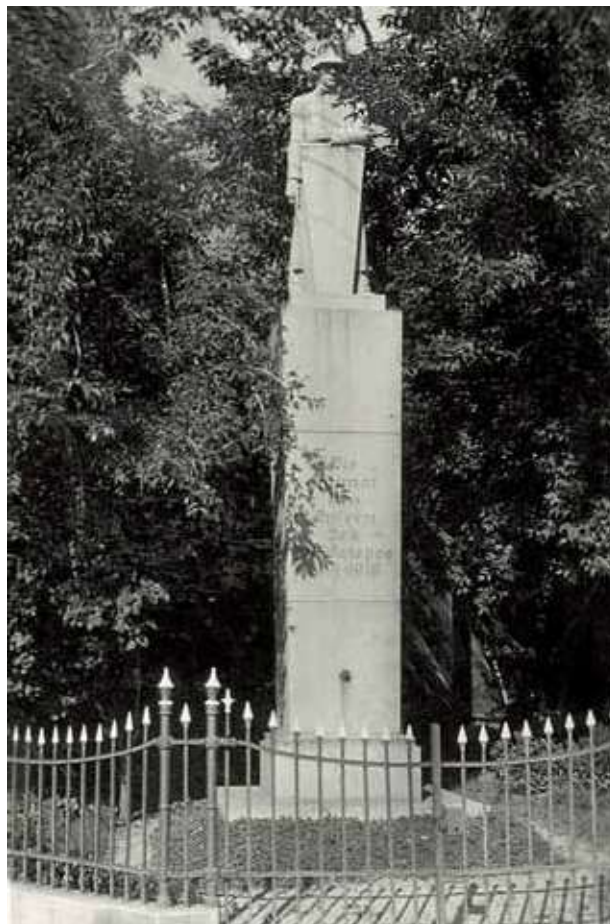
Obr. 10. Původní podoba pomníku padlým v Kryrech z roku 1926 od sochaře Johannese Watzala, nedatováno (po roce 1929).

zen palmovou ratolestí – symbolem čisté a mučednické smrti nebo vavřínovým věncem – symbolem hrdinství.