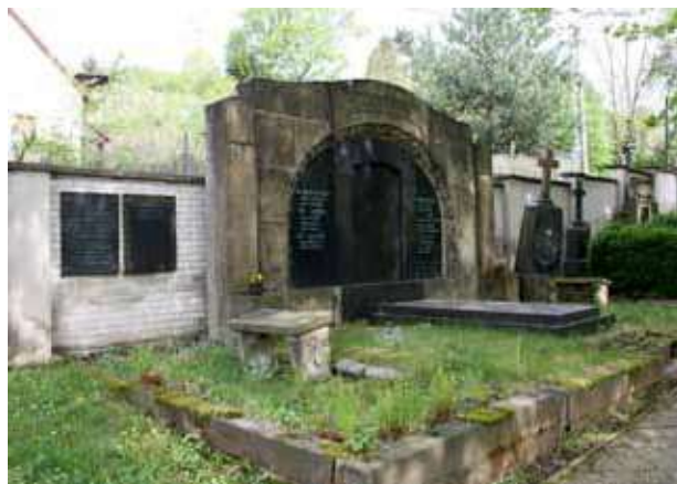
Obr. 10. Hrobka rodiny Klepsch na obecním hřbitově, pohled od jihozápadu. Foto: Martin Zubík, 2018.