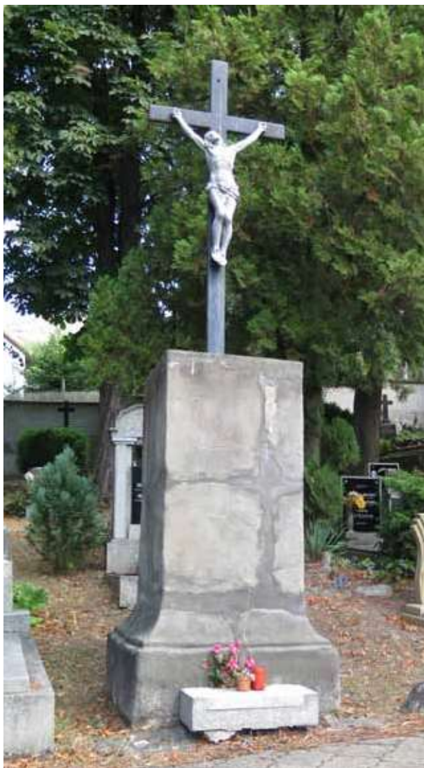
Obr. 23. Centrální kříž na hřbitově. Foto: Martin Zubík, 2018.