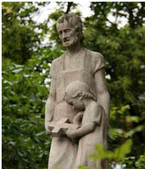
Obr. 19. Sousoší sv. Josefa s malým Ježíšem, detail.