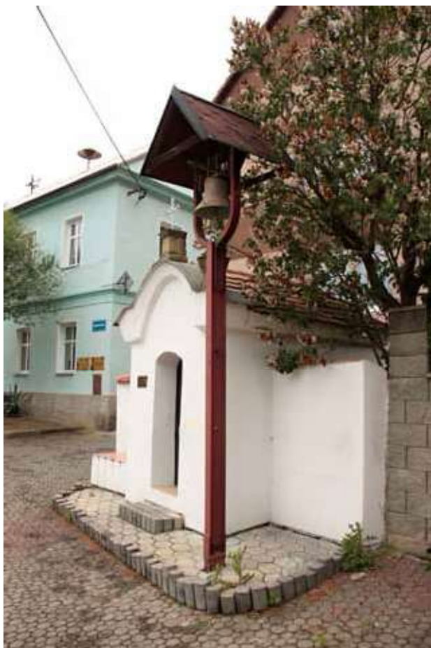
Obr. 1. Kaple sv. Anny na návsi se zvoničkou, pohled od jihovýchodu. Foto: Martin Zubík, 2018.