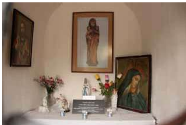
Obr. 2. Interiér kaple sv. Anny s vystaveným snímek restaurované řezby svatě Anny Samotřetí z původního vybavení kaple. Foto: Martin Zubík, 2018.