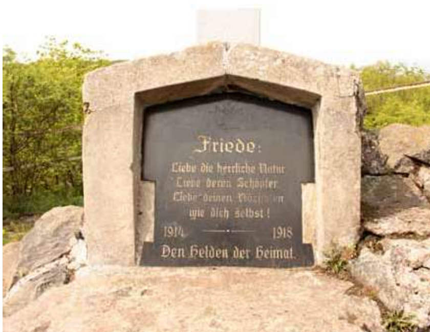
Obr. 25. Kříž na Mlynářově kameni, nápisová deska vsazená do podstavce, pohled od východu.