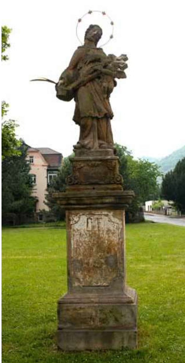
Obr. 16. Socha sv. Jana Nepomuckého, pohled od východu.