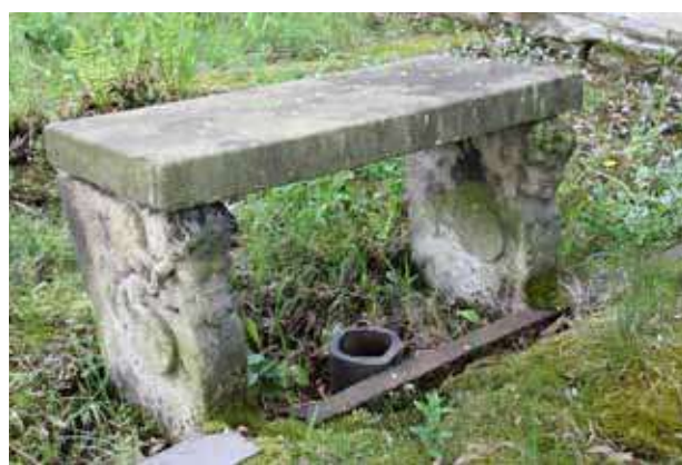
Obr. 11. Kamenná lavička s okřídlenými andlými hlavičkami po levé straně hrobky rodiny Klepsch. Foto: Martin Zubík, 2018.