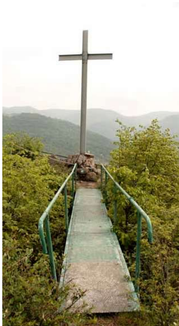
Obr. 24. Kříž na Mlynářově kameni, pohled od západu. Foto: Martin Zubík, 2018.