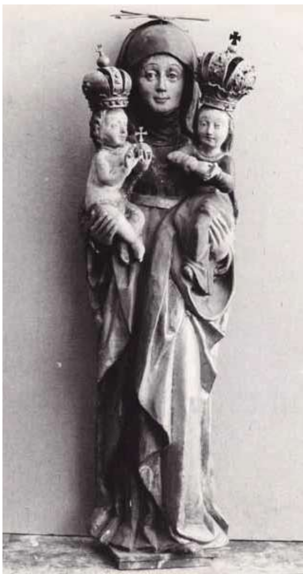
Obr. 7. Fotografie původního vzhledu, těsně před restaurováním v roce 1967, řezby sv. Anny Samotřetí z kaple sv. Anny na návsi. Reprodukováno z restaurátorské zprávy Vlastimila Lachouta, Dolní Zálezly, ÚL, dřevěná polychromovaná plastika sv. Anna Samotřetí z kapličky, signatura 340/R, uložené ve sbírce restaurátorských zpráv při NPÚ ÚOP Ústí nad Labem.