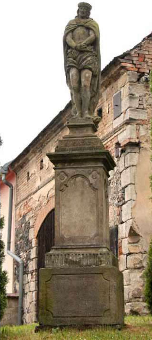
Obr. 20. Socha Ecce Homo, pohled od východu. Foto Martin Zubík, 2018.