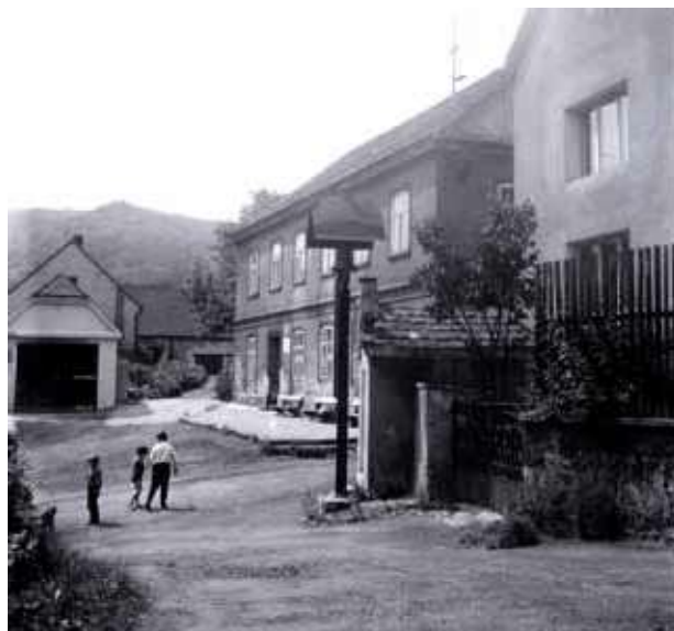
Obr. 6. Kaple sv. Anny se zvoničkou v roce 1972, pohled z východu. Foto: NPÚ ÚOP Ústí nad Labem, sbírka fotografické dokumentace, č. neg. 46725.