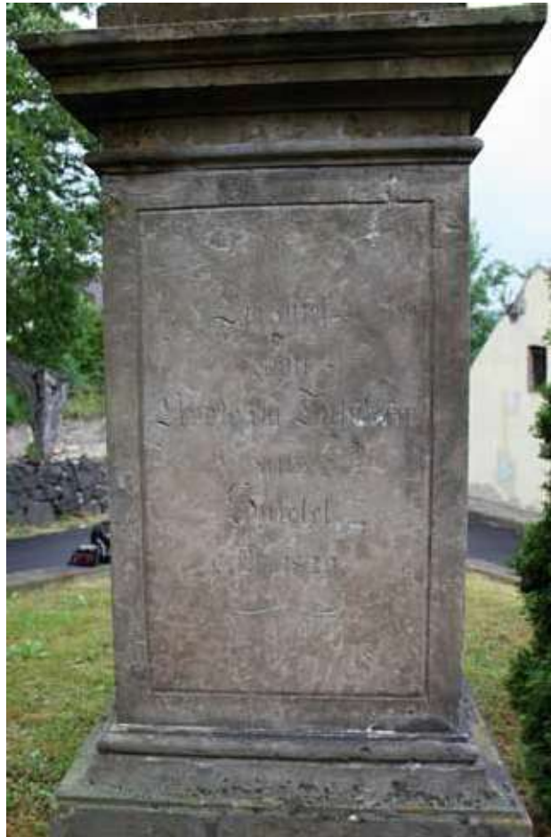
Obr. 21. Socha Ecce Homo, nápis s datací 1820 na zadní straně podstavce, pohled od západu. Foto Martin Zubík, 2018.