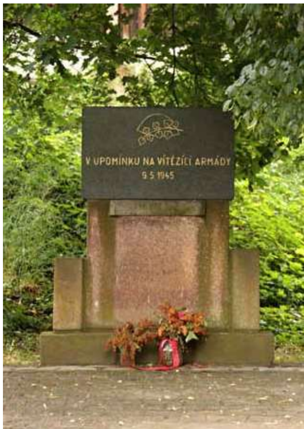
Obr. 13. Pomník vítězným armádám, pohled od jihu.