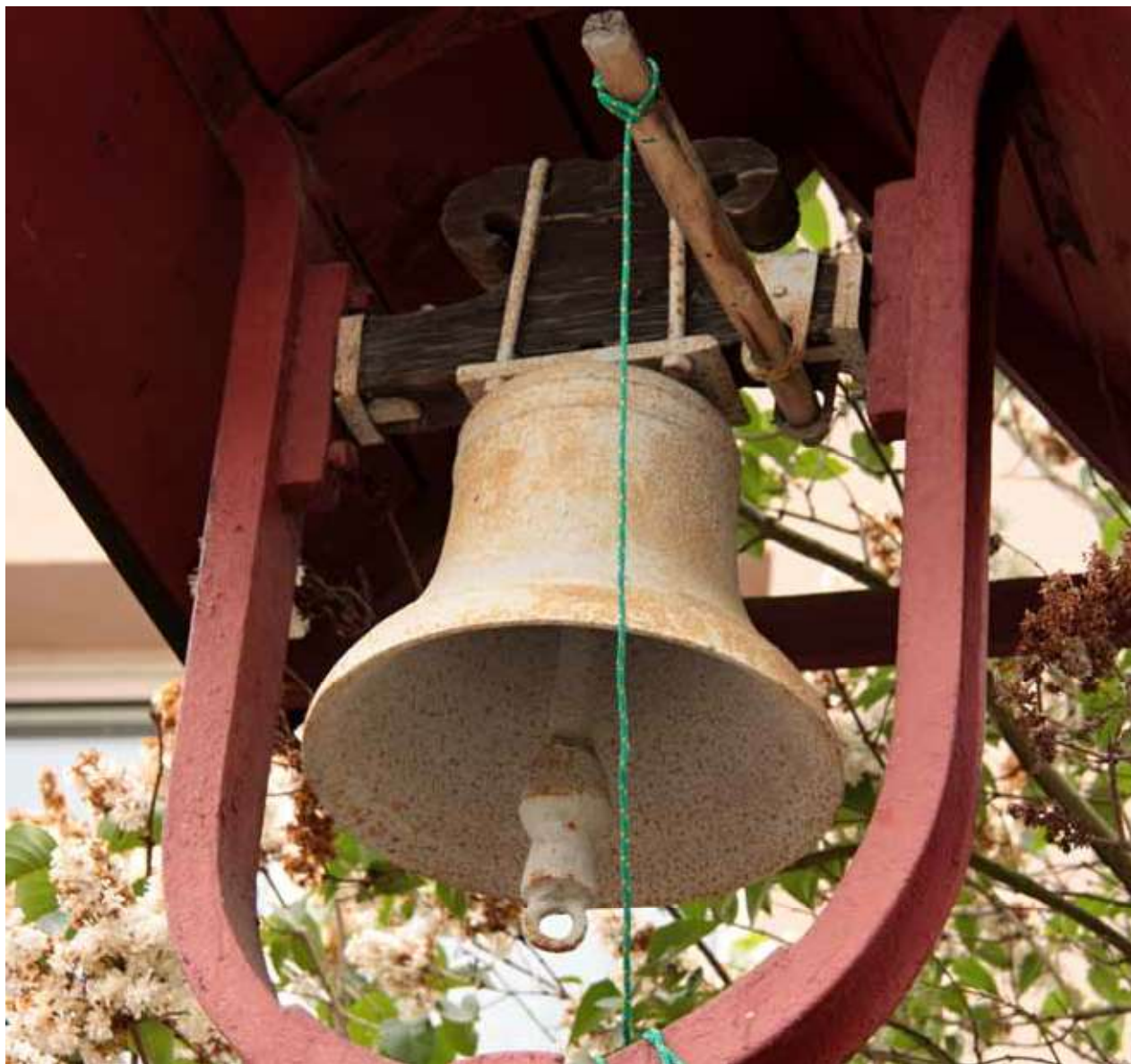
Obr. 26. Zvonička na návsi, detail se zavěšením zvonu.