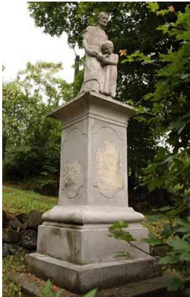
Obr. 18. Sousoší sv. Josefa s malým Ježíšem, pohled od západu. Na soklu jsou patrné vpředu zbytky nápisu, zleva pak neurčitě torzo reliéfu neznámého svatého. Foto: Martin Zubík, 2018.