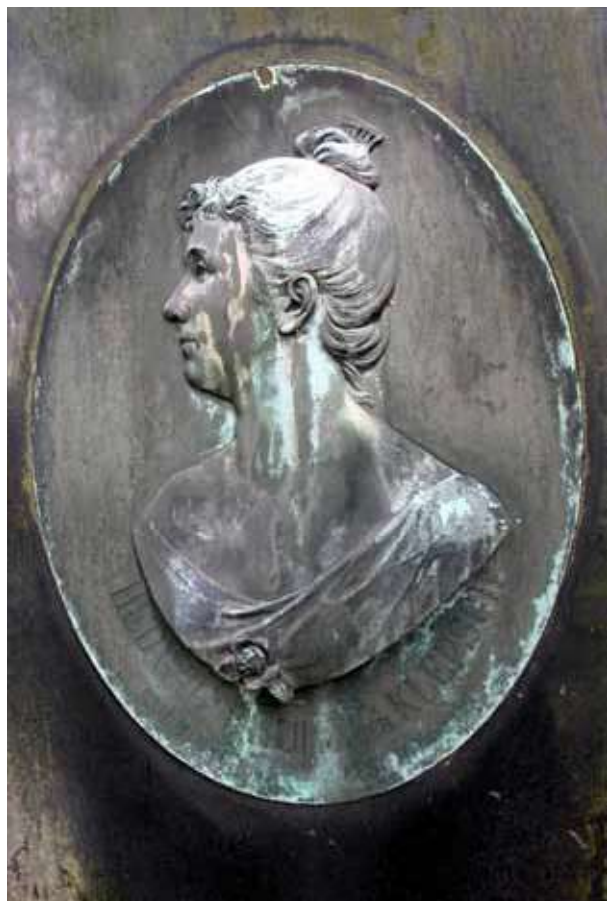
Obr. 12. Reliéfní podobizna Hedwigy Brune, roz. Klepsch, z konce 19. století na samostatném náhrobníku nebožky umístěném vpravo vedle hrobky rodiny Klepsch.