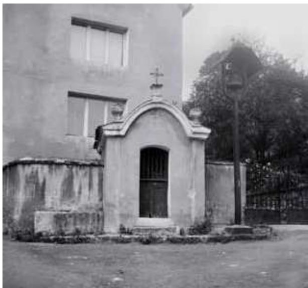
Obr. 5. Kaple sv. Anny se zvoničkou v roce 1972, pohled z jihu. Foto: NPÚ ÚOP Ústí nad Labem, sbírka fotografické dokumentace, č. neg. 46724.