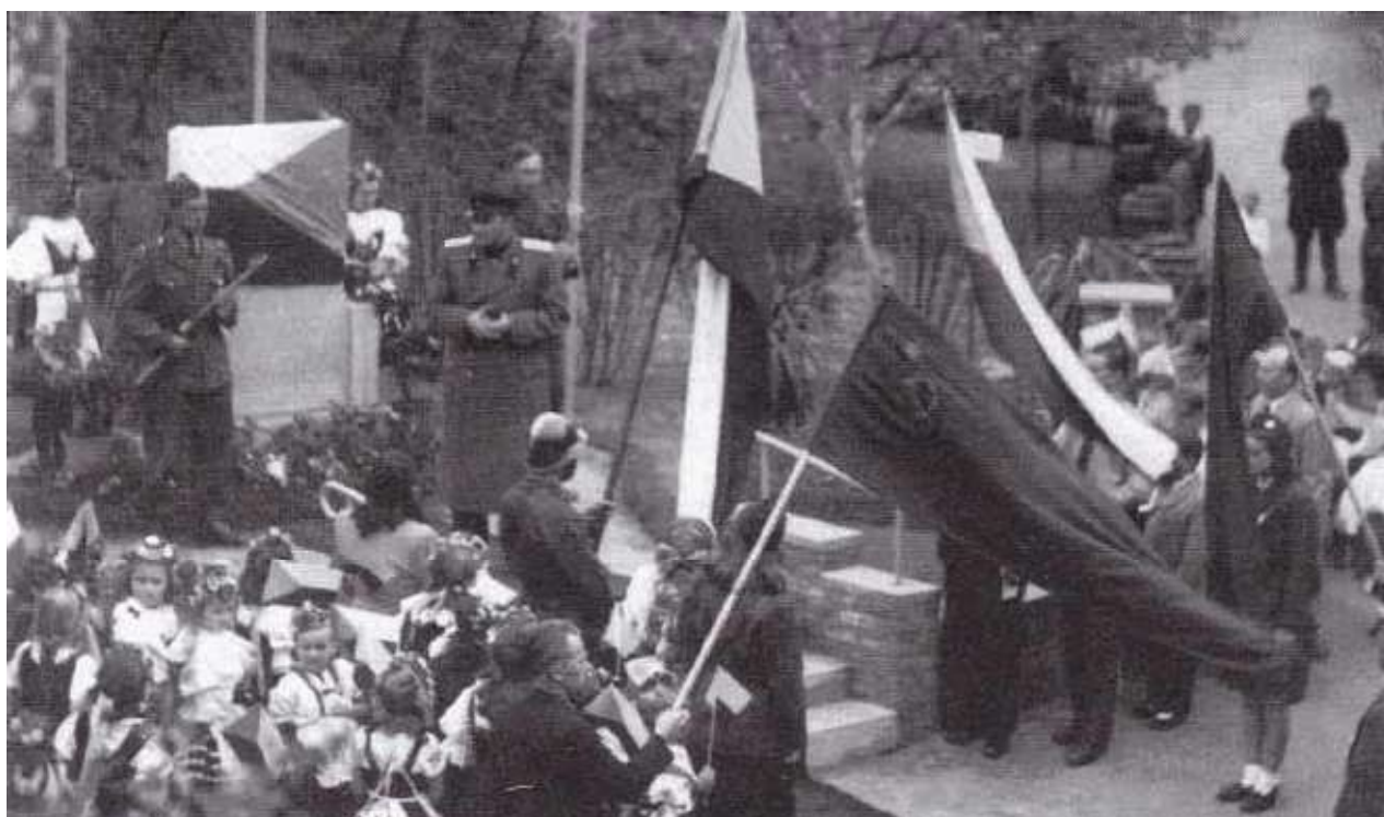
Obr. 14. Slavnost odhalení pomníku v květnu 1946. Reprodukce z knihy Věry Hladíkové, Dolní Zálezly v minulosti a současnosti , Ústí n. L. 2006, s. 77.