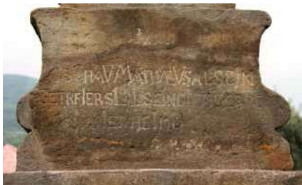
Obr. 17. Socha sv. Jana Nepomuckého, zadní strana soklového nástavce s nesrozumitelným textem a s chronogramem 1717.