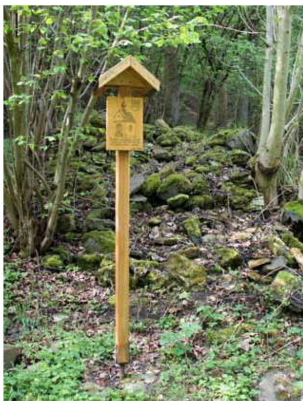
Obr. 8. Torzo kaple Panny Marie Pomocné při zelené turistické stezce do Dubice, pohled od východu na bývalé průčelí kaple.