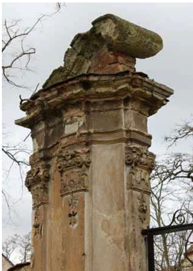
Obr. 1. Jižní brána západní zahrady zámku Stekník od jihu. Foto: K. Podroužek, 2018.

Ve dnech 1. 2.–22. 3. 2018 byla Centrem pro dokumentaci a digitalizaci kulturního dědictví při Filozofické fakultě Univerzity Jana Evangelisty Purkyně v Ústí nad Labem provedena dokumentace vybraných prvků v areálu terasových zahrad zámku Stekník. Jednalo se o štukovou výzdobu jižní a severní vstupní brány, drobnou architekturu point de vue na jihovýchodě a západě ohradní zdi, krycí desky pilířů ohradní zdi a koruny ohradní zdi, typovou pískovcovou vázu na poprsní východní části horní terasy západní zahrady a o dochované barokní omítky ohradní zdi.