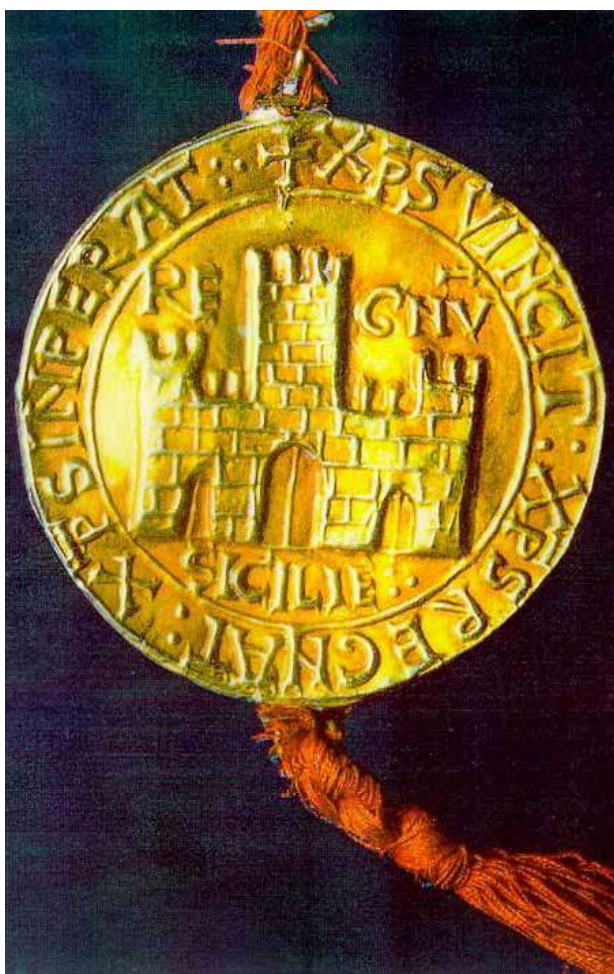
3) Zlatá bula sicilská (1212).