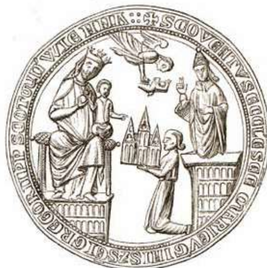
11) Pečeť benediktinského kláštera U Skotů ve Vídni.

případě s náznakem jistého realismu, neboť zde roste z hradeb stavba kostela.