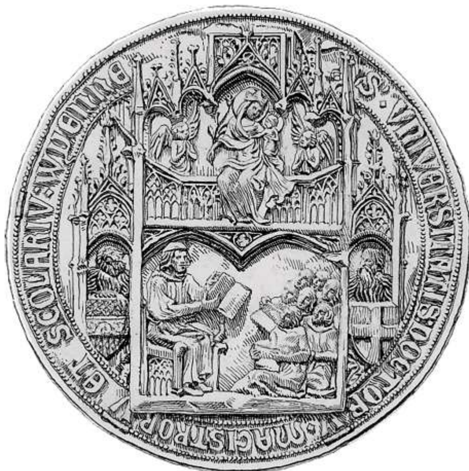
14) Pečeť univerzity ve Vídni (1365).

nemáme. V této souvislosti bychom mohli uvést vyobrazení abatyše Kunhuty ve známém pasionálu, nicméně její pečeť ji ukazuje na honosném stolci bez baldachýnu. 44 V literatuře najdeme úvahy, že tyto architektonické motivy čerpaly inspiraci z dobových monstrancí. Tento typ pečetního obrazu našel ještě i svou renesanční podobu. 45 Vývoj v dalších staletích ukázal převahu heraldických kompozic a architektonické motivy definitivně mizí. 46