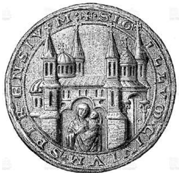
8) Pečeť města Špýru.

Kolínská a mohučská pečeť vytvořily určitý model, který se stal závazným a uplatnil se v dalších lokalitách. Bylo to především vlastní Porýní, kde se nová symbolika rychle rozšířila. Jako město mohučských arcibiskupů to bylo např. město Erfurt, které převzalo porýnský vzor, pečeť je doložena k roku 1225. Na ní sedí v architektuře sv. Martin a žehná městu, model se stal ohniskem, odkud se toto zobrazení šířilo dále. 18