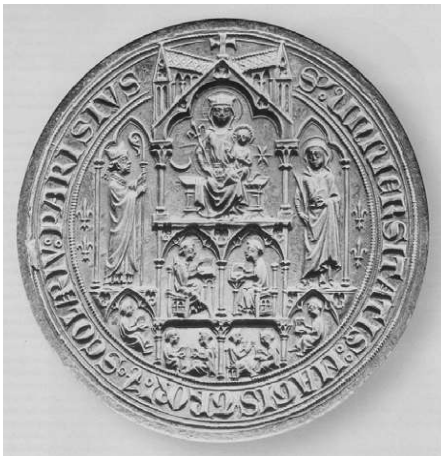
13) Pečeť pařížské univerzity (1292).

křížovníků s červenou hvězdou (1305). Nad oblouky mostu stojí budova kláštera, v její střední části klečí zakladatelka sv. Anežka. Vlny v patě pečeti udávají konkrétní umístění kostela a křížovníckého konventu. 39 Patrocinium kapituly Všech svatých na hradě Pražském, kterou založil Karel IV. v roce 1339/1340 ještě jako markrabě moravský, inspirovalo i tvůrce její pečeti. V pečetním obraze spatřujeme architekturu oltáře, v jehož jednotlivých výklencích stojí světec nebo svěťice. 40 V tomto stručném přehledu můžeme jen okrajově připomenout nejstarší pečeti konventu zábrdovického kláštera, první, velmi poškozená je doložena do roku 1262 a druhá k roku 1287. Na obou je budova kostela. Starší kvůli svému poškození nám mnoho nepomůže, druhá prozrazuje neumělou ruku rytce. Bez šťastného nálezu nepoškozeného kusu nelze rozhodnout, zda se jedná o symbolické zachycení nebo zda se jedná o obraz konkrétní stavební situace. Zajímavý je klobouk, který se nad stavbou vznáší a připomíná zakladatele kláštera Lva z Klobouk. Kdyby se potvrdil popis K. Maráze, který viděl v dolní části špičaté oválné pečeti postavu donátora, 41 jednalo by se o velmi vzácný případ, kdy na pečeti církevní instituce je zobrazen světský donátor, později jsou ovšem takové případy