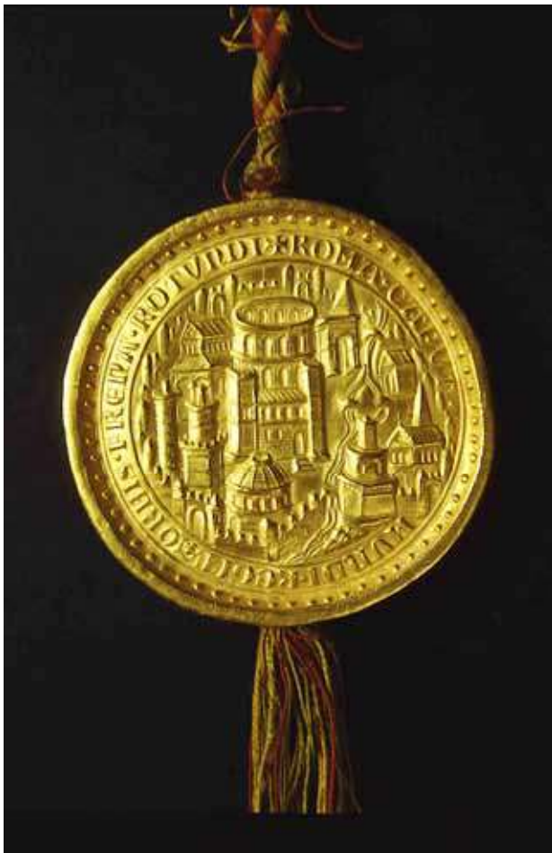
4) Zlatá bula Ludvíka Bavora. Bulle d'or de l'empereur Louis IV de Bavière , autor: Unknown XIVe s'.

komunity, ale komunity přesně vymezené v řádových regulích, komunity, která byla konstituována shora, řádovým vedením. Městské organizace naopak vznikaly postupně zdola. I v Porýní, kam zaměříme svou pozornost, platilo, že mnohé pojmy se upevňovaly teprve postupně v zápasu různých lokálních sil, jejichž ambice a rivality se projevovaly uvnitř městského hnutí. Z tohoto hlediska se zmíněně typáře, vzniklé k momentální konkrétní situaci, prosadily postupem času jako městské pečeti. V takových případech mohla vzniknout městská pečeť až jako výsledek uznání nejen uvnitř městské organizace, ale především jako symbol města navenek. Ještě Konrád de Mure (1210–1281), ve svém známém díle Summa de arte prosandi (vzniklo 1275–1276) se o městské pečeti nezmiňuje. 12 Jak ukazujeme dále, někteří autoři poukazují na fakt, že nejstarší pečeti říšských měst vznikly v těch komunitách, které vedly svůj emancipační zápas s církevní vrchností, a v některých případech se podařilo ukázat, jak městská pečeť mohla odrážet spíše závislost na příslušné vrchnosti.