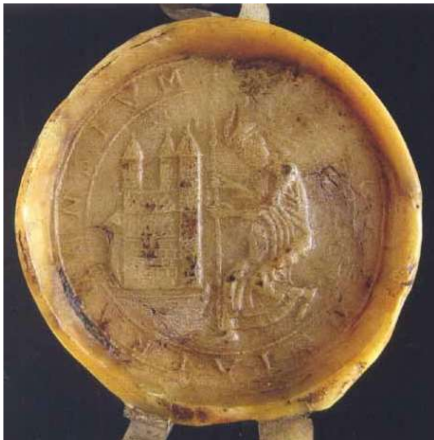
12) Nejstarší pečeť pražské kapituly z konce 12. století.

Dalším dokladem může být pečeť kapituly v Olomouci, na ní drží biskup Jindřich Zdík model kostela, jehož fasádu tvoří dvojvěž. Pečeť vznikla až po biskupově smrti, ale je připomínkou jeho zakladatelského počínu, když přenesl biskupský kostel z kostela sv. Petra na kostel sv. Václava. 36 Pečeť je uváděna v diskusích o podobě olomouckého chrámu a teze o jeho „realitě“ nachází zastánce.