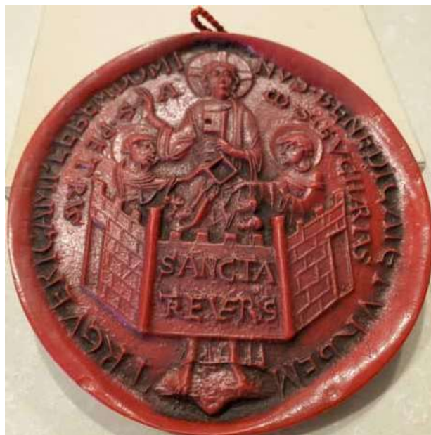
7) Pečeť města Trevíru.

hexametru: TREVERICAM PLEBEM DOMINUS BENEDICAT ET URBEM. Představitelé lidu vztahují ruce ke klíči, který otevírá současně bránu nebes i města. Obraz pečeti odpovídá snahám představitelů Trevír jako druhý Řím a zdůraznit primát trevírského kostela. Podobně byl význam města zdůrazňován na dobových mincích a v jiných projevech. Tento záměr podporovali jak obyvatelé města, tak jejich arcibiskup, v tomto směru se jejich zájmy shodovaly.