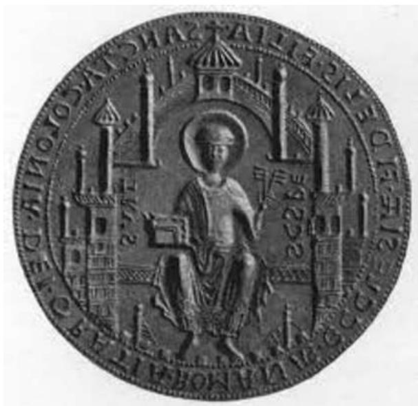
6) Pečeť města Kolína nad Rýnem.

(Ap 21,12). Město na pečetí má dvanáct věží, stejně jako biblický Jeruzalém. Tím vstupuje do městské symboliky biblický Jeruzalém jako symbol, který byl chápán prostřednictvím spisu sv. Augustina o Božím městě. Toto učení hluboce ovlivňovalo nejen chápání města jako celku, ale projevovalo se konkrétněji i při vysazování měst a v jejich stavební koncepci, dokonce i ve stavbě bran. 15