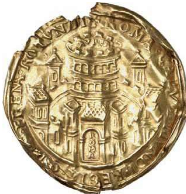
2) Bula Friedricha I. Barbarossy (1122–1190).