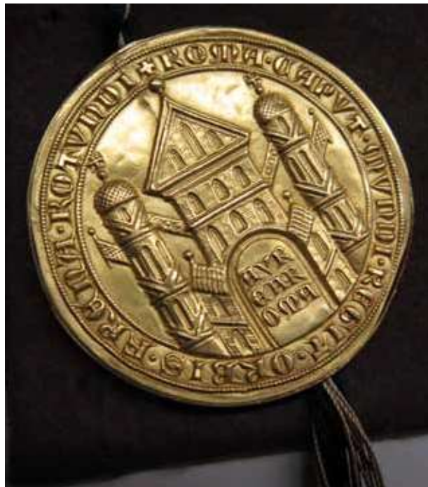
5) Zlatá bula Karla IV. Zdroj: Wikimedia Commons, Rückseite des Siegels vom Trierer Exemplar der Goldenen Bulle mit stilisierter Darstellung Roms , autor: Hauptstaatsarchiv Stuttgart.

Než přistoupíme ke stručnému přehledu jejich chronologického vývoje, musíme zmínit jejich typologii. Ve středoevropském prostoru se přidržujeme typologie městských pečeti, kterou vytvořil Toni Diederich. Základní typ nazval zkratkou obrazu města. Architektonické motivy na této skupině pečeti mají ryze symbolický význam. 13