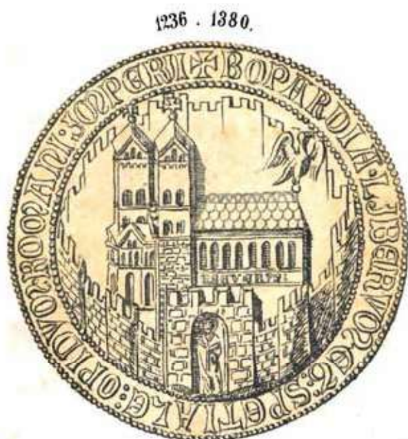
9) Pečeť města Boppardu.

pět různě velkých věží i se střechami. 24 Inspirace pečetěmi porýnských měst je dobře patrná. Jen hypoteticky bychom mohli uvažovat, jaký vliv měla příslušnost pražské diecéze k mohučskému arcibiskupství, upozornit můžeme na typologickou (nikoliv výtvarnou) podobnost se zmíněnou pečetí Erfurtu. Na pražské pečeti jsou v bočních věžích patrné lidské hlavičky, které představují obyvatele (představitel) města, To ji spojuje s nejstarší pečeti Trevíru, kdy ke Kristově postavě vzhlížejí drobné postavičky. 25