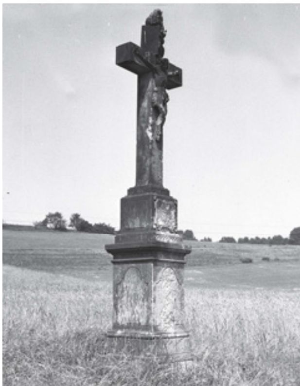
Obr 6. Trojiční kříž v Libově (1813), dnes zničený, asi 1958.