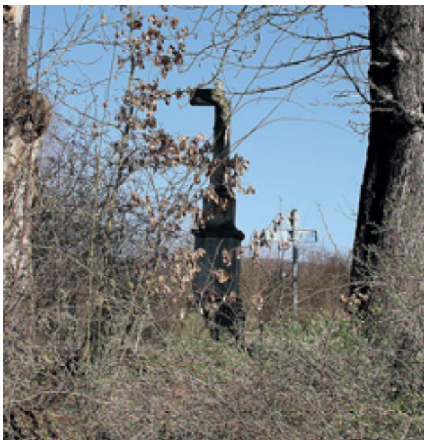
Obr 26. Kříž (1832), Podhoří, snímek dosvědčující zoufalý stav kříže v roce 2024. Foto: Martin Zubík 2024