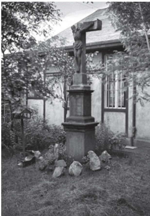
Obr 13. Trojiční kříž (kolem 1822) v Chabařovicích. Dnes zmizelý kříž známe z fotografie ze 30. let 20. století, kde je již patrně druhotně umístěn v zahradě hostince Gartensaale čp. 116 v Chabařovicích. Muzeum města Ústí nad Labem

ném čtvercovém podiu za nízkým snad řetězovým oplocením s kamennými sloupky v nároží. V centrální poloze byl umístěn kvádrový sokl, na který nasedala patka dřívku v horní části s oblounem. Dřík měl dle dochované fotodokumentace vpadlá pole s květinovým motivem v horních cviklech. V polích na přední straně byl reliéf piety se sedící Pannou Marií, která držela v náručí tělo Krista. Na straně je zřetelný neznámý světec v mnišském rouchu. Hlavici tvoří profilovaná římsa s fabionem. Na její horní plochu byl položen nízký sokl s geometrickým motivem protínajících se elips. Na soklu byl položen zhruba krychlový nástavec s nápisovými čtvercovými poli s vykrajovanými rohy vystupujícími z plochy dole ozdobený čabrákami. V koutech byly reliéfy květů. Na čelní straně je rozpoznatelný německý kurzivní nápis: Der Vater / der Sohn / und der / heilige Geist . Ostatní nápisy jsou nečitelné. Nad nástavcem byl další nízký sokl s motivem protínajících se elips, z něhož se přes zužující se patku tyčil kříž s ukřížovaným. Ve spodní části kříže byl reliéf obdélného tvaru se segmentovým záklenskem a zobrazením srdce s těžko určitelným motivem. Kristus byl expresivně zpracován s propracovanou muskulaturou s masivní trnovou korunou. Bohatě zřasená bederní rouška na Ježíšově pravém boku přečnívala přes svislou