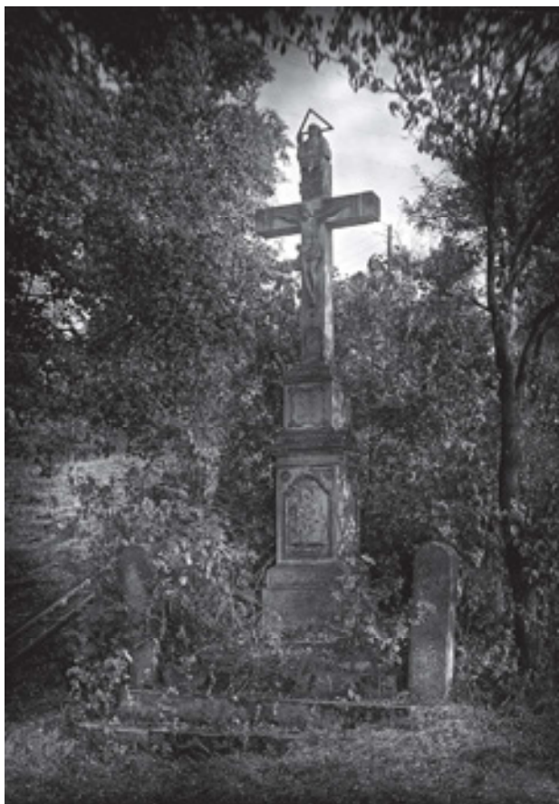
Obr 9. Trojiční kříž (1818) u ovčárny v Chuderově, stav asi 30. léta 20. století.