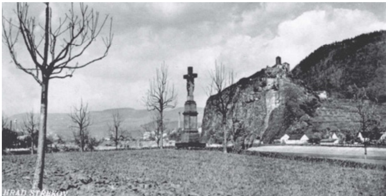
Obr 22. Kříž zvaný Löblův (1832), Vaňov, původní umístění u řeky Labe, pohlednice vydaná O. Bukačem v Ústí nad Labem roku 1932.

Ukřižovaného s bederní rouškou, prověšenýma rukama s trnovou korunou a hlavou svěšenou na pravém rameni. Nad Kristem byla v kameni vyvedena deska s nápisem INRI.