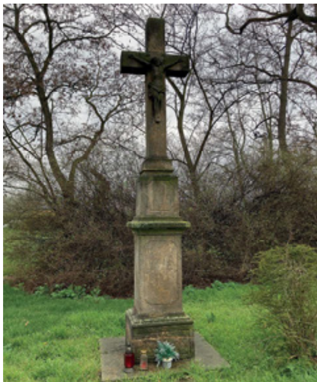
Obr 1. Kříž (1807) pocházející z osady Kamenice, dnes u kostela sv. Josefa v Předlicích.