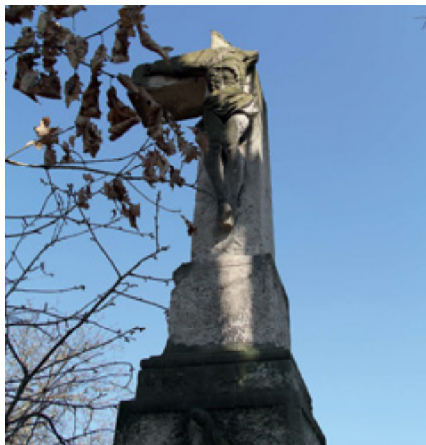
Obr 27. Kříž (1832), Podhoří, detail poškození kříže 2024.