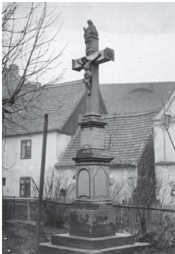
Obr 11. Trojiční kříž (1819) v Ústecké ulici v Chabařovicích, stav asi 30. léta.