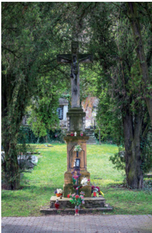
Obr 23. Kříž (?), na hřbitově ve Vaňově, stav 2024. Přenesený kříž plní druhotně funkci centrálního hřbitovního kříže.

latinský a je tvořen dvěma ostře profilovanými pravidelnými hranoly. Ukřižovaný je proveden na obou stranách. Na severní straně k ulici je ztvárněn Kristus na kříži s propracovanou muskulaturou končetin a trupu. Hlava Ježíše je svěšená na pravé rameno. Dominantním prvkem je široká trnová koruna. Nad hlavou je svisle orientovaná nápisová páska. Kristova bederní rouška je bohatě zřasená a na jeho pravém boku přesahuje svislé břevno kříže. Druhá strana kříže byla v době dokumentace nepřístupná.