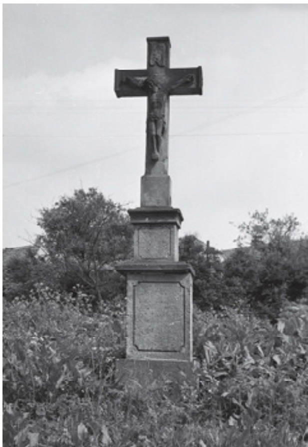
Obr 16. Kříž (1824) na návsi ve Velkém Chvojně zničen v 60. letech 20. století, stav 1958.