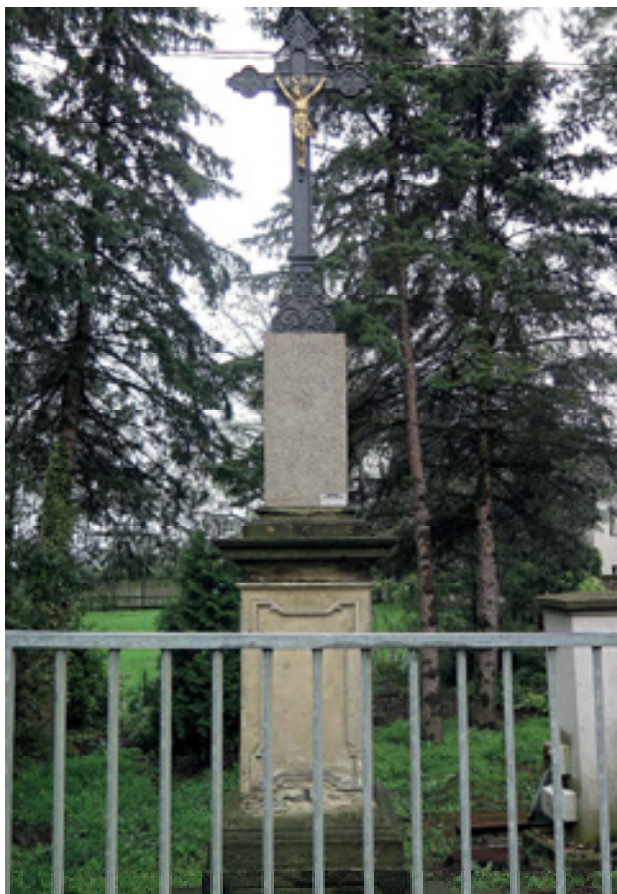
Obr 18. Trojiční kříž (1830) u čp. 2 v Soběchlebech po nepřítli zdařilé rekonstrukci, stav 2024.

vysvěcen. Popis ze soupisu (1835): Kříž s obrazem Vykupitele, nad tím Duch svatý a Bůh Otec, ozdobně tesáno z kamene, pěkně štafírováno. Nápis, vpředu: Drei sind, welche Zeugniß geben, der Vater, der Sohn und der hl. Geist, und diese Drei sind Eins. Na straně: Dank Dir, o Jesu, dank für Dein aus Liebe zu uns überstandenes bitteres Leiden. 54