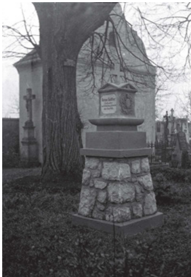
Obr 14. Kříž (kolem 1822) v Chabařovicích. Druhotně umístěný ke stěně márnice na místním hřbitově, stav 1935.

ném čtvercovém podiu za nízkým snad řetězovým oplocením s kamennými sloupky v nároží. V centrální poloze byl umístěn kvádrový sokl, na který nasedala patka dřívku v horní části s oblounem. Dřík měl dle dochované fotodokumentace vpadlá pole s květinovým motivem v horních cviklech. V polích na přední straně byl reliéf piety se sedící Pannou Marií, která držela v náručí tělo Krista. Na straně je zřetelný neznámý světec v mnišském rouchu. Hlavici tvoří profilovaná římsa s fabionem. Na její horní plochu byl položen nízký sokl s geometrickým motivem protínajících se elips. Na soklu byl položen zhruba krychlový nástavec s nápisovými čtvercovými poli s vykrajovanými rohy vystupujícími z plochy dole ozdobený čabrákami. V koutech byly reliéfy květů. Na čelní straně je rozpoznatelný německý kurzivní nápis: Der Vater / der Sohn / und der / heilige Geist . Ostatní nápisy jsou nečitelné. Nad nástavcem byl další nízký sokl s motivem protínajících se elips, z něhož se přes zužující se patku tyčil kříž s ukřížovaným. Ve spodní části kříže byl reliéf obdélného tvaru se segmentovým záklenskem a zobrazením srdce s těžko určitelným motivem. Kristus byl expresivně zpracován s propracovanou muskulaturou s masivní trnovou korunou. Bohatě zřasená bederní rouška na Ježíšově pravém boku přečnívala přes svislou