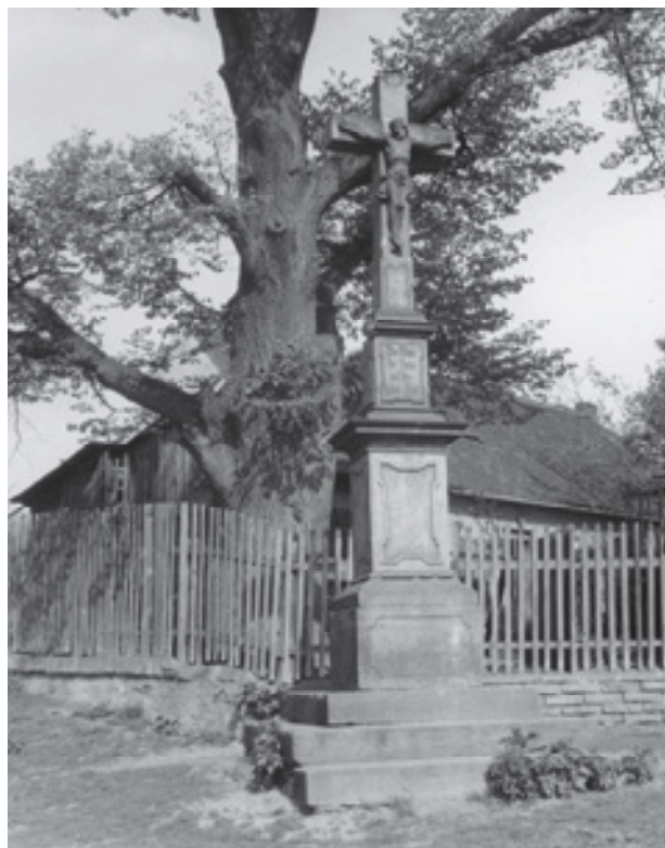
Obr 4. Trojiční kříž (1811) na původním místě ve Vyklicích při usedlosti čp. 26, stav z roku 1959.