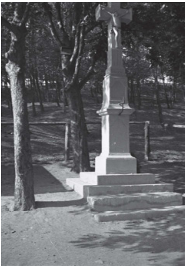
Obr 19. Kříž zvaný Bílý (1832), Klíše, stav z 30. let 20. století.