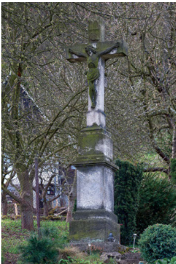
Obr 21. Kříž zvaný Löblův (1832), Vaňov, současný stav v zahrádkářské kolonii.

menného kvádrů položeného na výšku, do něhož je vsazen litinový kříž s rostlinným motivem a zlacenou plastikou Krista. Původní kříž se dochoval jen v torzu a byl druhotně doplněn. Novodobé doplňky jsou silně kontrastní a nekorespondují s historickou skutečností.