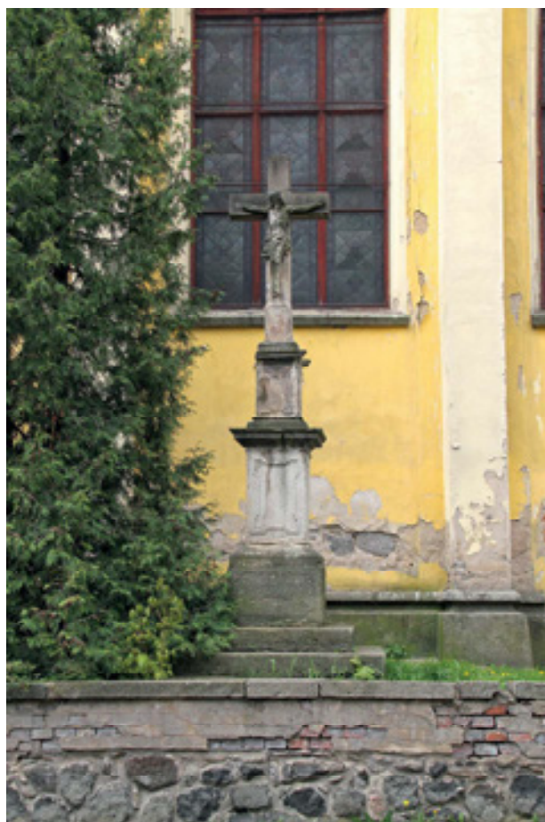
Obr 5. Trojiční kříž z Vyklic (1811) na současném místě u kostela sv. Havla v Chlumci.

Ignaz Josef (*1. 7. 1780) 15 se oženil v roce 1803. Do domu