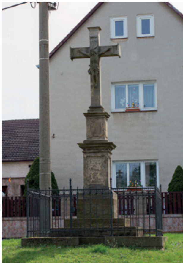
Obr 8. Trojiční kříž (1816) v Brozánkách, současný stav.