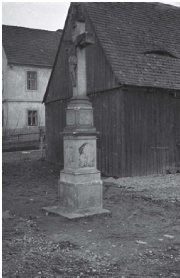
Obr 24. Trojiční Kříž (?), Vaňov. Dnes neznámý kříž na snímku druhotně umístěný ke stodole vedle čp. 110 ve Vaňově asi 30. léta 20. století.

Ve Vaňově se zřejmě nacházely ještě dva Jennatschovy kříže. Jeden je dnes na místním hřbitově. Zdá se, že sem byl přenesen po zřízení hřbitova (někdy v druhé polovině 19. století) a získal funkci centrálního hřbitovního kříže. Kde a kdy byl vztyčen původně není jasné. Soupis (1835)