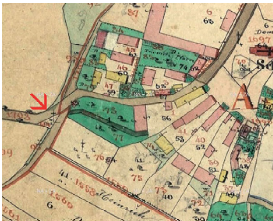
Obr 28. Trojiční kříž (1832), Tuchomyšl, kříž na indikační skice stabilního katastru 1842.

grafii, tušit v případě obličeje Krista. Jennatsch byl pravděpodobně spíš kameníkem než uměleckým sochařem, a tak tento detail lze hodnotit jako ne příliš kvalitní. Přesto dynamicky působící Ježíšovo tělo je v působivém stylovém kontrastu s chladnou a až matematickou proporcí kříže. Jennatsch si vypracoval i osobitý styl kladení jednotlivých komponent křížů, které usnadňují identifikaci jeho děl. Zajímavostí je střídání vpadlých a vystupujících nápisových a reliéfních polí, které může nastat v rámci jedné památky. Jistou genezi sledujeme u oblíbenosti využívání jednotlivých tvarů zrcadel či nápisových polí. Ve 20. letech se objevují téměř výhradně obdélná segmentově zaklenutá pole. Ve třicátých letech segment mizí a je nahrazen obdélným motivem buď s rozšířenými, nebo vykrajovanými rohy.