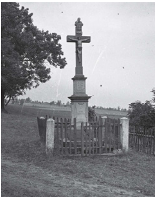
Obr 3. Trojiční kříž (1810) v Nakléřově, který se nacházel přes silnici proti dnešní restauraci U Johnů, dnes neznámý.