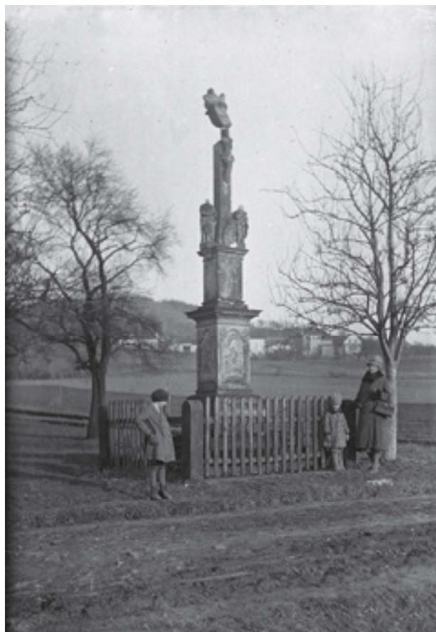
Obr 10. Trojiční kříž s figurami (1819) u ovčárny v Chuderově, stav asi 40.–50. léta 20. stol.

Varvažovský kříž je dnes (2024) umístěn jižně od památkově chráněné hospody Stará pošta na dohled od Pruského pomníku bitvy u Chlumce. V roce 2021 byl okolo kříže instalován nízký kovový plot. Kříž stojí na nízkém hranolovém soklu o rozměrech 53 x 53 cm v průřezu s oblounem, nad terén vyčnívá 27 cm. Na sokl nasedá prostý dřík zakončený profilovanou římsou. Na římsě je hranolový podstavec s nápisovým čtvercovým zrcadlem s vykrajovanými rohy. Podstavec je zakončen oblounem a výžlabkem. Na čelní straně je německou frakturou vyveden černou linkou v nedávné době zvýrazněný nápis: Vater in deine / Häd befehle ich / meinen Geist / Literim 3 Kap. Nápis odkazuje na poslední slova Ježíše Krista: „Otče do tvých rukou poroučím svou duši“, která najdeme v Lukášově evangeliu v kapitole 23 verš 46. Není zcela zřejmé, zda zkomolená slova vychází z pozdějšího neodborného zásahu, nebo z omezené gramotnosti tvůrce. Z pravé strany je další nápisové pole s textem vyvedeným stejným typem písma: Errichtet von / Franz Hantschel / aus Abersau / Ao. 1808. (překl. Zřízeno Franzem Hantschelem z Varvažova v roce 1808). Zbylé strany nástavce mají zrcadla prázdná. Na vrchní obloun nástavce nasedá podstavec kříže ozdobený kamenickými reliéfy. Na přední straně kruhovým věncem