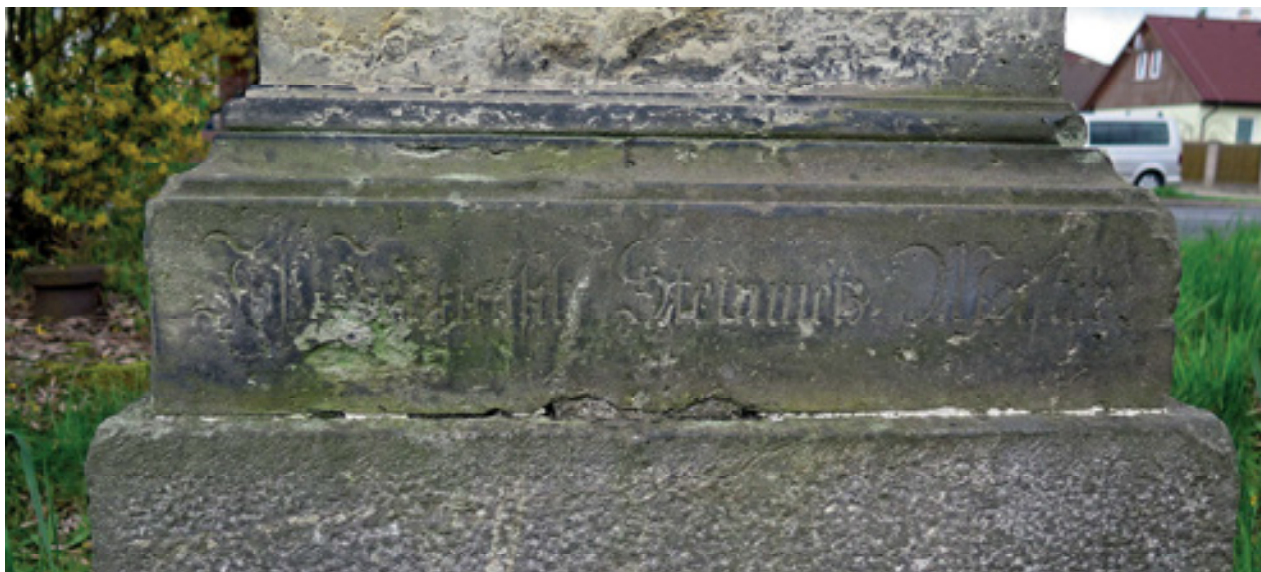
Obr 12. Trojiční kříž (1819) v Ústecké ulici v Chabařovicích. Z kříže zůstalo dnes jen těleso soklu, na němž je dosud čitelný tesaný nápis: Jos. Jennatsch Steinmetz Meißter . Foto: Martin Zubík 2024

části se zužuje a pokračuje na výšku položeným kvádrem dříku zakončeným profilovanou římsou. Dřík je zdoben zrcadlem ve tvaru obdélníku s rozšířenými rohy. Od soklu k horní hraně římsy měří dřík 112 cm. Na římsu nasedá hranolový nástavec o výšce 66 cm, který je zakončený další profilovanou římsou. Na tuto římsu nasedá v horní části se zužující sokl latinského kříže. Sto sedmdesát osm cm vysoký kříž je tvořen dvěma pravidelnými hranoly s korpussem Ukřižovaného na přední straně. Pod nohama Krista je ještě obdélné vpadlé zrcadlo s rozšířenými rohy. Kristova hlava je svěšena na pravé rameno. Bederní rouška je charakteristicky rozevřatá a přečnívá přes svislou část kříže na Ježíšově pravém boku.