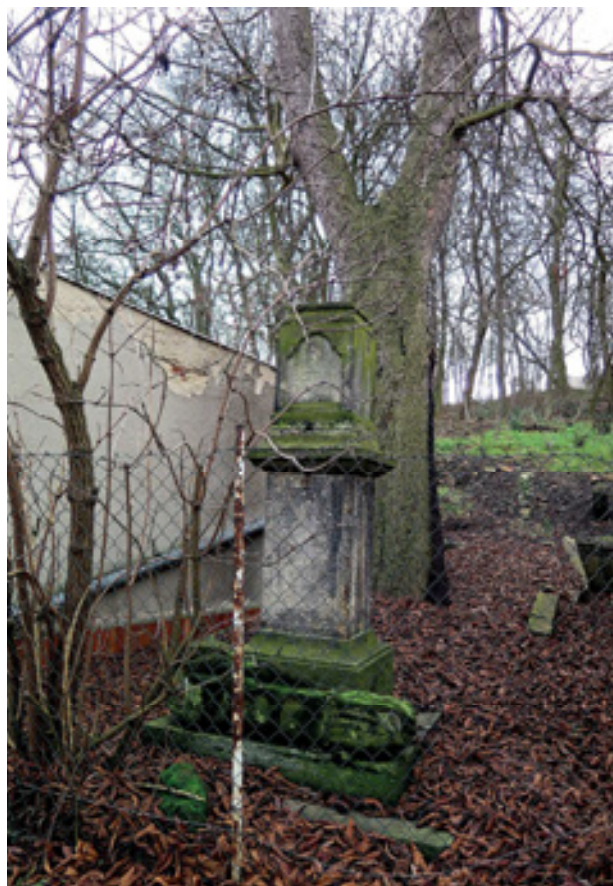
Obr 20. Kříž zvaný Bílý (1832), Klíše, stav 2023.

Soupis (asi 1838) kříž popisuje následovně: U Soběchleb při silnici do Chlumce spočívá kamenné ztvárnění ukřižovaného Spasitele, štafírované, na čtyřbokém rovněž kamenném podstavci. Kamenická práce. Socha je velmi pěkná, důstojná a poučná. Na čtyřbokém podstavci je na přední straně vymalováno Objevení bohosudovské Matky Boží, vpravo je obraz sv. Josefa, vlevo je umírající sv. František Xaverius. Nápisy, Na přední straně pod křížem: Dreye geben Zeugnis im Himmel, der Vater, der Sohn und hl. Ge-