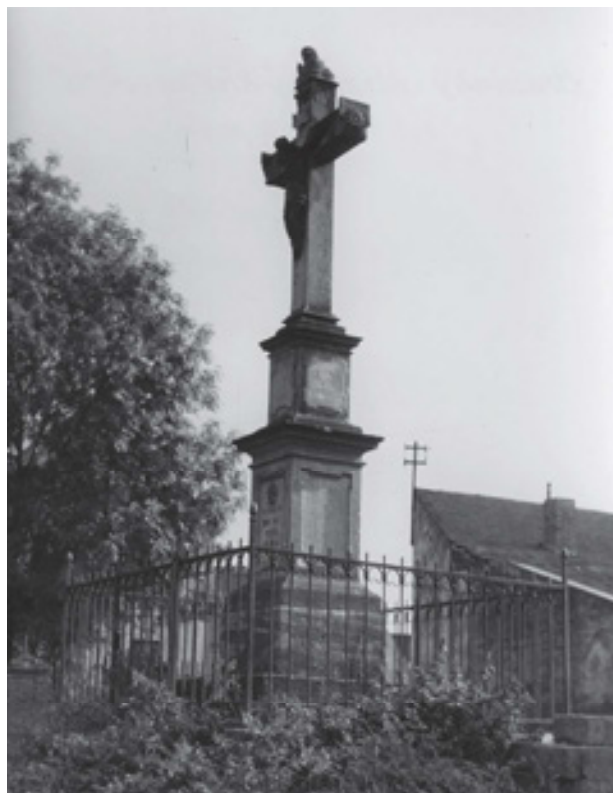
Obr 7. Trojiční kříž (1816) na návsi v Brozánkách, asi 1958.