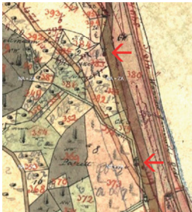
Obr. 25. Vaňov, pravděpodobné původní umístění dvou kamenných křížů (dnes jeden na hřbitově, druhý neznámý).

Kříž se nachází na jihovýchodním okraji zaniklé obce Podhoří. Na dvakrát odstupňovaném podstavci sto-