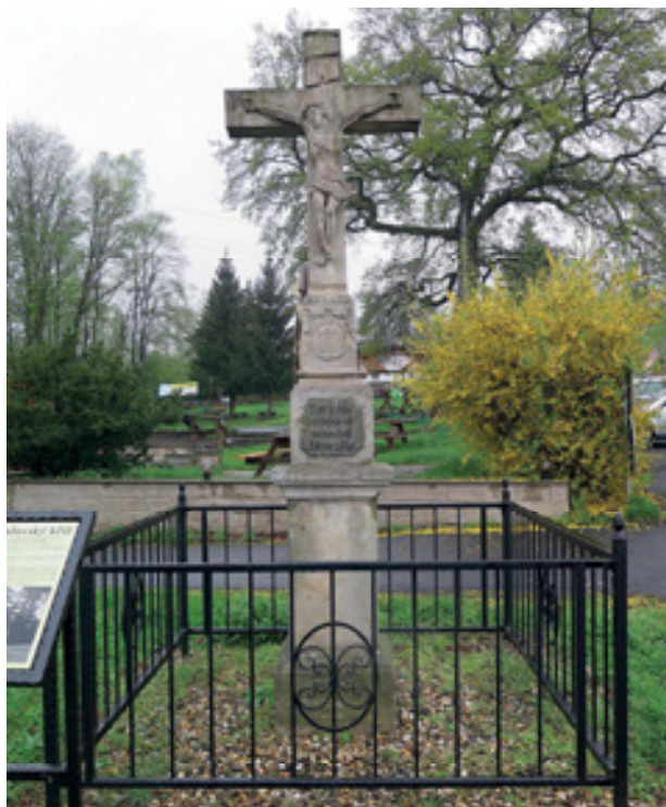
Obr 2. Kříž (1808) v obci Varvažov mezi pruským pomníkem a starou poštou.