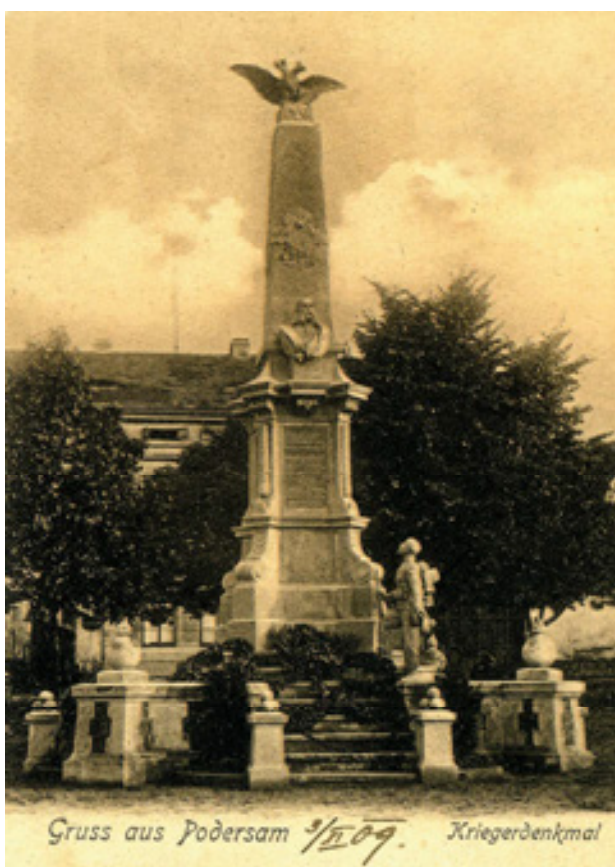
Obr 10. Pomník padlým v rakouských válkách v Podbořanech od firmy Josef Seiche z roku 1905, nedatovaná pohlednice (okolo roku 1909).