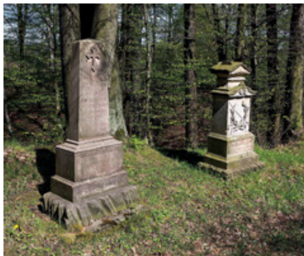
Obr 7. Pomníky padlým sedmileté války u Kunratic z let 1903 a 1906.