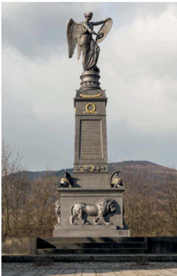
Obr 4. Ruský pomník bitvy roku 1813 u Přestanova od architekta Pietra Nobileho a sochaře Josefa Maxe z roku 1837.

leho za účasti sochaře Josefa Maxe. Tento litinový pomník vrcholící okřídlenou sochou bohyně Niké byl postaven rakouským císařem Ferdinandem V. a vzdává hold ruské armádě. Svůj podíl na jeho vzniku měli také jeho otec František I., dále ruský car Mikuláš I. a především kancléř Metternich. Již samotné položení základního kamene se stalo mimořádnou událostí, odehrálo se 29. září 1835 za přítomnosti panovníků zemí tehdejší protinapoleonské koalice a bylo okázalejší než následné odhalení a vysvěcení dokončeného monumentu uskutečněné 29. srpna 1837. 14