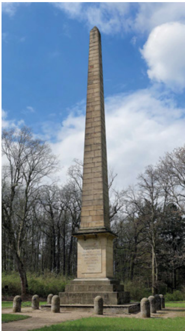
Obr 1. Obelisk v Krásném Dvoře z let 1796–1802 vztyčený na oslavu arcivévody Karla a jeho vítězství nad Francouzi v bitvě u Ambergu. Foto: Marta Pavlíková, 2017

Základní údaje o válečných pomnících dlouhého 19. století poskytuje také evidence provedená v roce 1926 četnickými stanicemi pro potřeby Památníku odboje. 5 Tato plošná dokumentace zaměřená primárně na pomníky obětí velké války podchycuje i starší válečné nebo císařské pomníky, které se staly po roce 1918 ideově nežádoucími. Součástí této evidence byl nejen slovní popis pomníku, ale také jeho obrazová dokumentace v podobě nákresu, černobílé fotografie nebo pohlednice. 6 Prameny ikonografického charakteru dále doplňují historické fotografie a pohlednice uložené ve fondech regionálních muzeí, městských a oblastních archivů nebo ve sbírkách soukromých sběratelů.