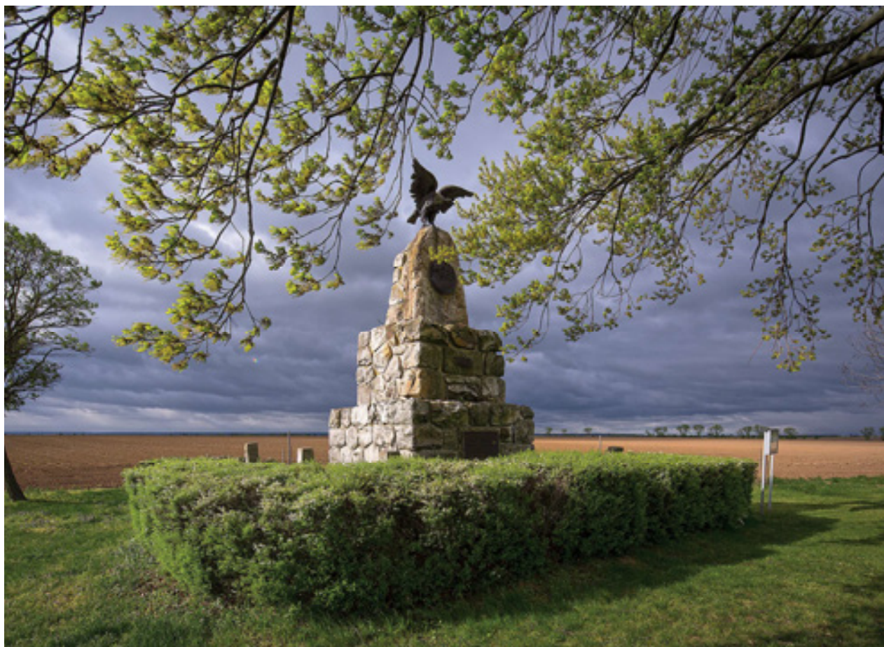
Obr 15. Jubilejní pomník bitvy tří císařů u Vraného z roku 1913.

držícího vojenskou standartu, kterou z litiny následně odlila vídeňská slévárna Franze Xavera Pönningera. 32