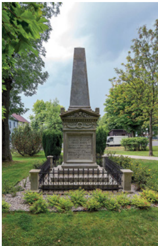
Obr 8. Pomník padlým v rakouských válkách v Hoře sv. Šebestiána od Heinricha Rövera z roku 1879.