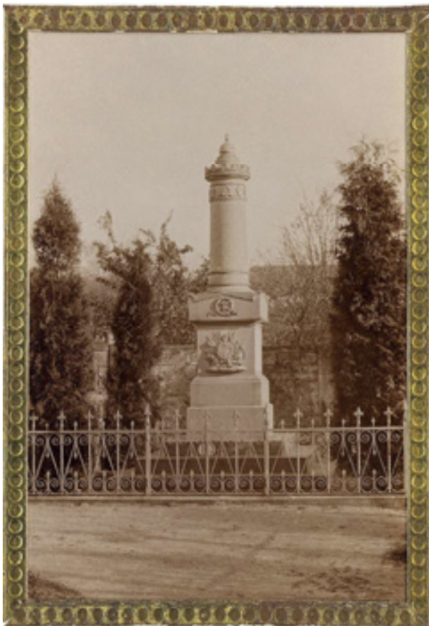
Obr 6. Pomník padlým v rakouských válkách v Chřibské z roku 1874, nedatovaná fotografie (okolo roku 1900).

a později pod vlivem německého prostředí spolky válečníků ( Kriegerverein ), 15 které začaly vznikat v šedesátých a sedmdesátých letech 19. století primárně za účelem podpory válečných vysloužilců. Tyto supraetnické organizace oddané císaři byly obvykle navázány na aristokracii, která často vystupovala v roli čestného protektora a podporovatele spolku. Tradičně uniformované spolky měly vlastní vlajky i hudební tělesa. Pro svou „oddanost k císaři, dynastii a rakouskému státu a družnou věrnost v rakouském duchu vojenském“ byly tyto vysloužilecké organizace po zániku habsburské monarchie výnosem Ministerstva vnitra z 29. listopadu 1919 oficiálně zrušeny. Zároveň však nový československý stát poskytl spolkům tříměsíční lhůtu na transformaci a vznik nástupnických organizací s upravenými stanovami a novým názvem – nejčastěji Spolek vojenských vysloužilců ( Verein gedienter Soldaten ). Tato transformace však byla podmíněna jejich činností „na poli humanitním, bude-li z nich veškeren vojenský a dynastický rakouský ráz vymýcen“. 16