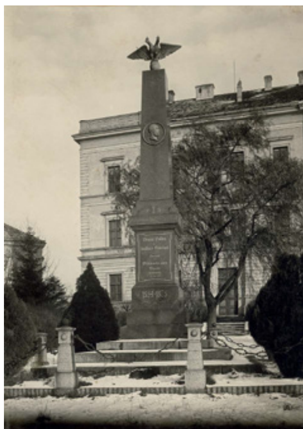
Obr 11. Pomník padlým v rakouských válkách v Litoměřicích od firmy Rudolf Burghart z roku 1894, nedatovaná fotografie (okolo roku 1900).