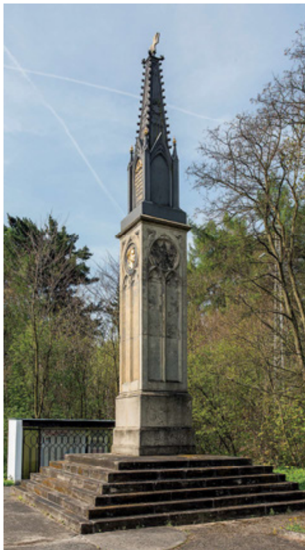
Obr 2. Pruský pomník bitvy roku 1813 ve Varvažově od architekta Karla Friedricha Schinkela z roku 1817. Foto: Marta Pavlíková, 2017