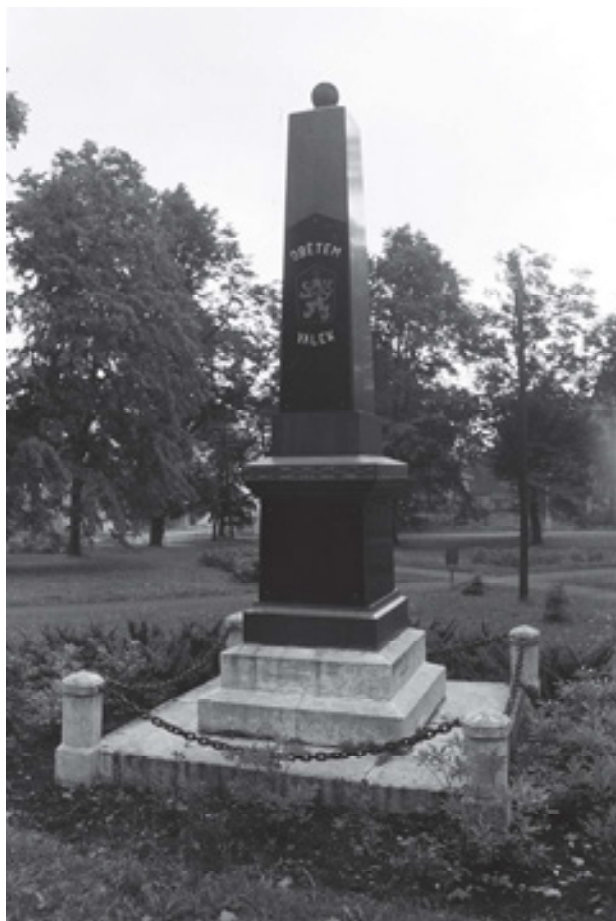
Obr 20. Pomník padlým v rakouských válkách ve Výsluní od Karla Wilferta z roku 1897 po celkové úpravě po roce 1945, nedatovaná fotografie (okolo roku 1980).

Další část sledovaného pomníkového fondu prošla adaptací, v pořadí již druhou, jež opět směřovala k přizpůsobení jejich vzhledu a významu novým společensko-politickým poměrům a tím i k jejich lepšímu přijetí novou komunitou. Jednalo se téměř výhradně o stavby v meziválečném období adaptované na pomníky obětí velké války. Toto převrstvení doprovázelo systematické ničení německých textů nebo německy vnímaných symbolů, jakými byly tlapaté kříže, plastiky orlů nebo dubové ratolesti. V některých případech se adaptační práce omezily na pouhou výměnu dedikační desky za novou s českým nápisem a státním znakem socialistického Československa jako v případě pomníku ve Výsluní. Pouze menší část válečných pomníků v Ústeckém kraji zůstala zachována in situ a mimo pozornost odborné i laické veřejnosti byla ponechána pozvolnému rozpadu.