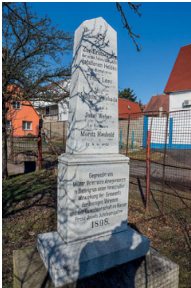
Obr 21. Jubilejní pomník padlým ve válkách z let 1848 a 1866 v Chudeříně z roku 1898 po celkové obnově.

Zcela odlišně bylo přístupováno k souboru napoleonských pomníků v Chlumci, Přestanově a Varvažově, které byly díky svému mimořádnému uměleckému a historické-