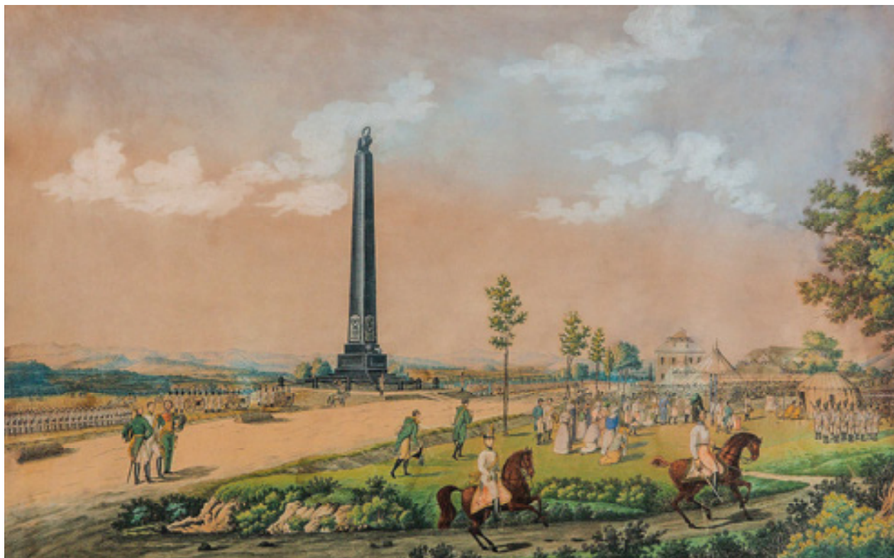
Obr 3. Slavnostní odhalení rakouského pomníku generála Colloredo-Mansfelda ve Varvažově konané dne 17. září 1825, nesignovaný akvarel, 1825.

obětí – řadových vojáků. 7 Tyto revoluční ideje se následně odrazily i v národně osvobozené boji německých států proti Napoleonovi. 8