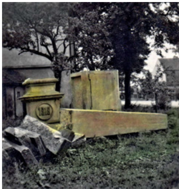
Obr 19. Torzo rozebraného jubilejního pomníku v Lovosicích před konečnou likvidací, 20. červenec 1960.

Po osvobození v roce 1945 se společnost musela vyrovnat s problematickým dědictvím pomníků českých