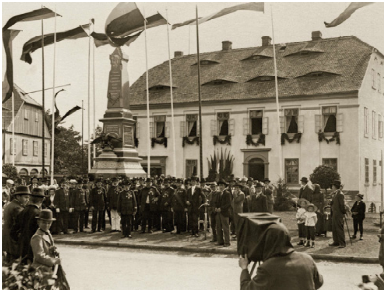
Obr. 17. Slavnostní odhalení pomníku padlým v rakouských válkách ve Varnsdorfu konané dne 17. srpna 1902.