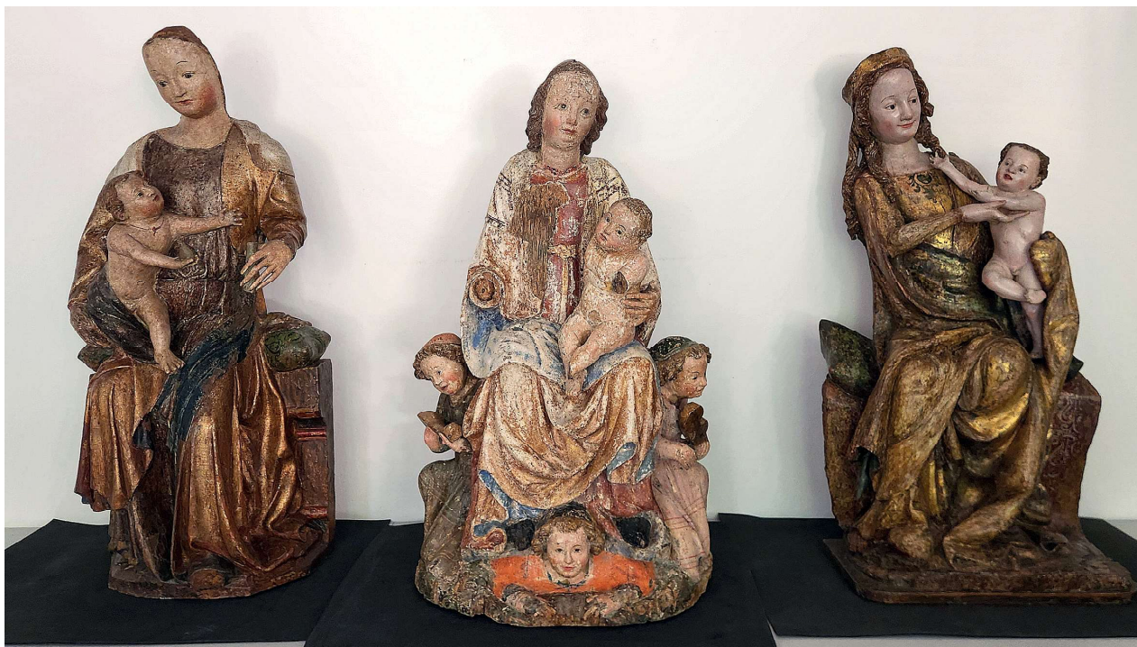
Obr 7. Madona z Kerhartic, Madona z Havraně, Madona z Bečova. Stav v průběhu restaurování.