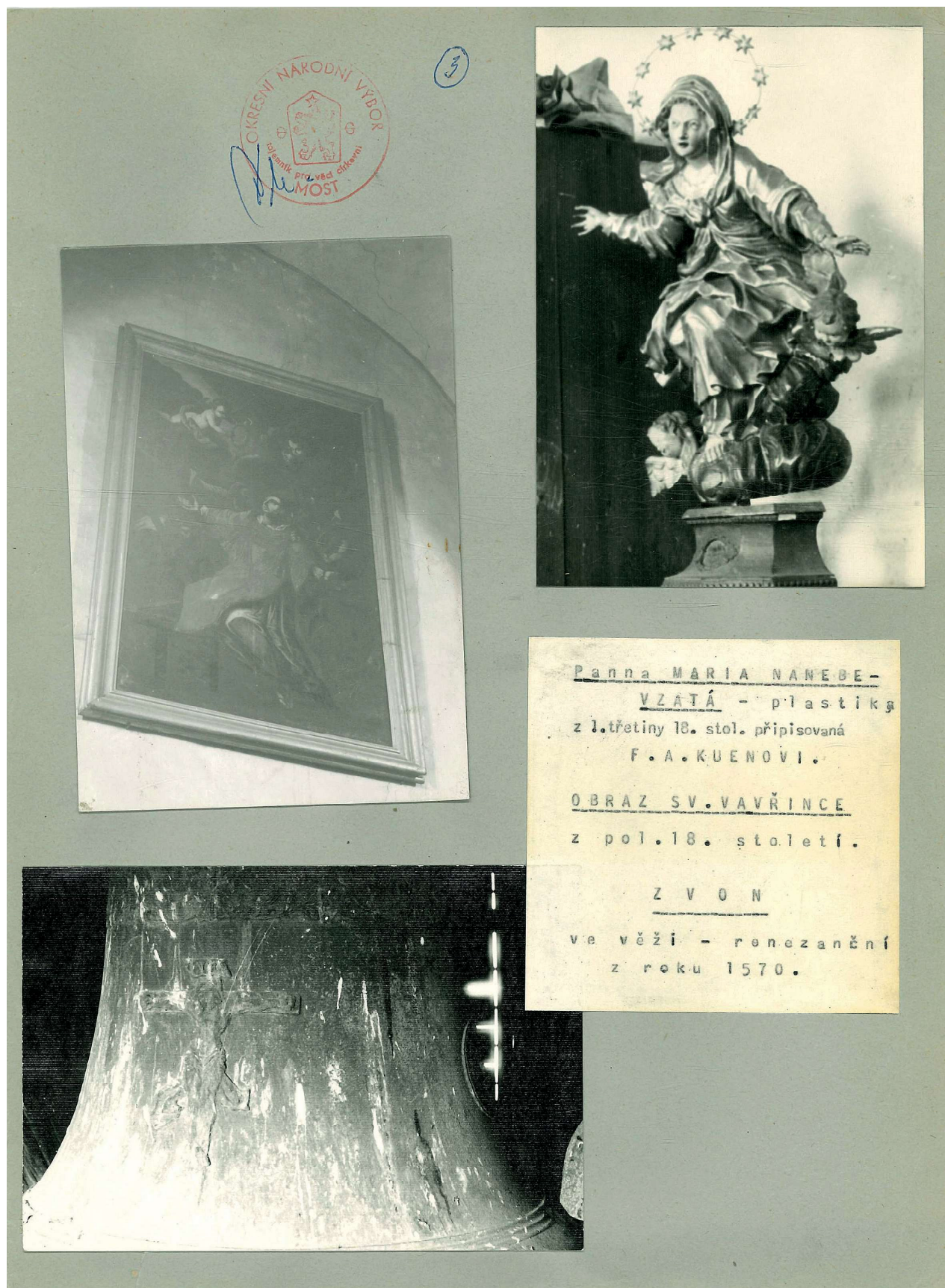
Obr 5. Havraň – kostel sv. Vavřince a fara.