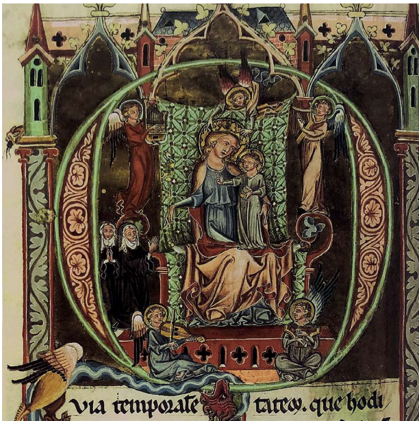
Obr 8. Madona s anděly, miniatura v rukopise Sermologium. 2. čtvrtina 14. století, Oxford, Bodleian Library, MS Douce 185, fol. 44v.

rysy, nelze přehlédnout i podstatné rozdíly v traktování draperie a zejména pak v pohybu Madony a Ježíška. Ježíšek u trůnící Madony Bečovské je daleko subtilnější, má jiný tvar hlavy a je také výrazně hybnější. Má tak blíže k pojetí Ježíška na trůnící Madoně z Kerhartic (Děčín), 10 která patří do stejné časové vrstvy jako Madony z Havraně a Bečova. U Madony Bečovské jde o složitý, zdánlivě náhodný pohyb Madony i Ježíška, u Madony z Havraně naopak o harmonické vyvážení hmot. Jiný charakter draperie má také Madona z Kerhartic. Je tedy zřejmé, že zmíněné Madony nevytvořil jeden autor, ale nanejvýš můžeme zvažovat vznik zmíněných soch v jedné dílně. Charakterem záhybů i pojetím dítěte Ježíše měl autor blízko dobovému malířství, které reprezentují taková díla jako Votivní obraz Jana Očka ze Středy, iluminátoři Liber Viaticu Jana ze Středy či Evangeliáře Jana z Opavy. Odborná literatura předpokládá, že Madona Bečovská byla součástí skříňového retáblu. 11 Podobně tomu může být i u Madony z Havraně. Analogii nacházíme v již zmíněném oltáři z Puschedorfu, avšak zde byla původní skříň značně upravena v 15. století.