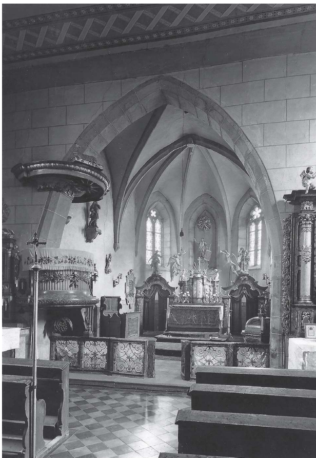
Obr 2. Havraň, interiér kostela sv. Vavřince kolem roku 1970.

N a půdě statku ve vesnici Moravěves, která je součástí obce Havraň, byla majiteli usedlosti na jaře roku 2022 nalezena socha trůnící Madony nadnášené trojicí andělů (lipové dřevo polychromované, v. 95 cm, 70. léta 14. století).