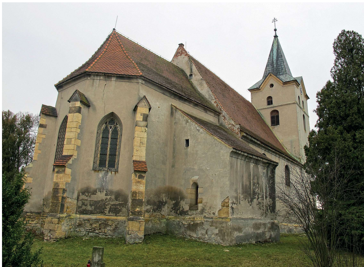
Obr 1. Kostel v Havrani. Foto: Jiřina Fenclová 2014. Zdroj: SOKA Most, Fotografická sbírka