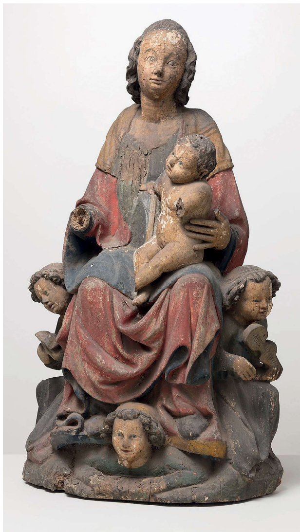
Obr 6. Madona z Havraně, stav před restaurováním.